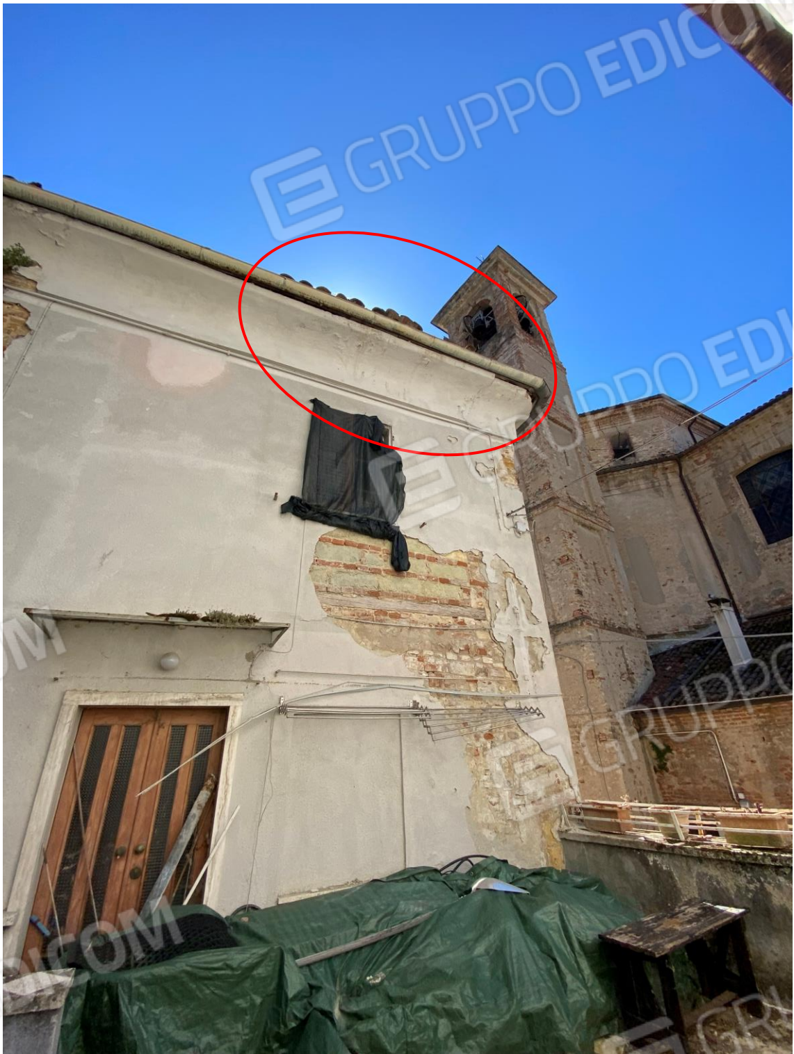
FOTO 39 : PORZIONE DI TETTO CROLLATO CON SFONDAMENTO DEL SOFFITTO DELLA CAMERA SOTTOSTANTE