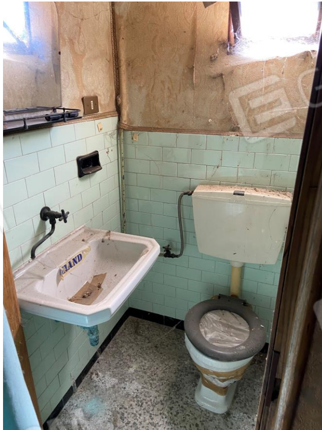
FOTO 8 : SERVIZIO IGIENICO NON SANABILE DA RIPORTARE A DESTINAZIONE DI RIPOSTIGLIO