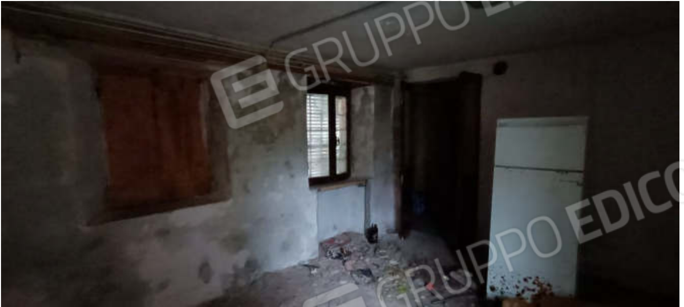
8-Locale di sgombero