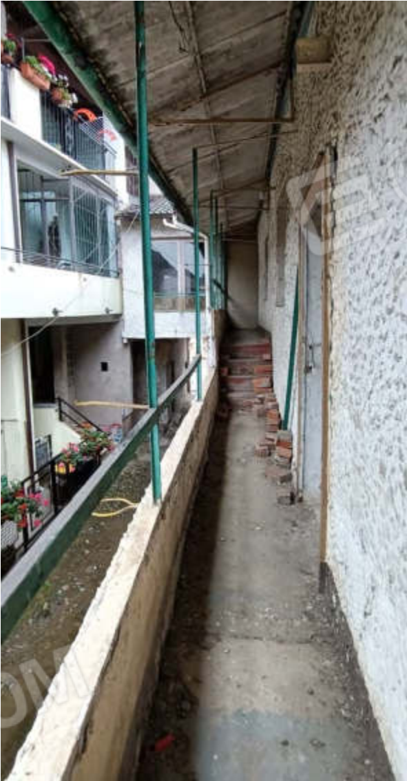
23-Vista da balcone