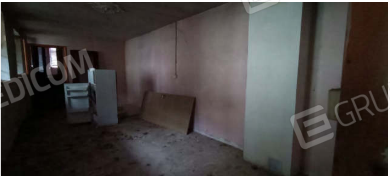
20-Locale di sgombero