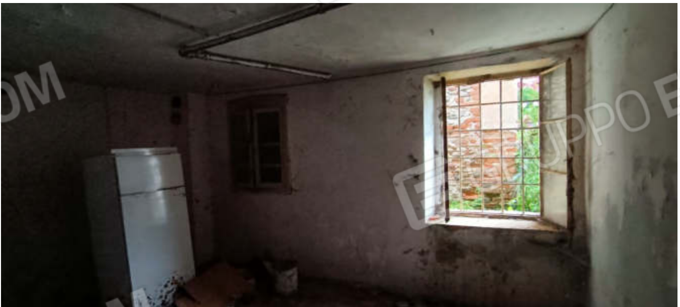
9-Locale di sgombero