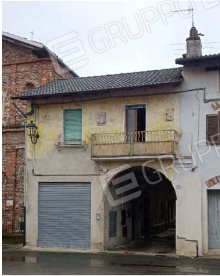
1-Prospetto nord su Via G. Garibaldi n. 2