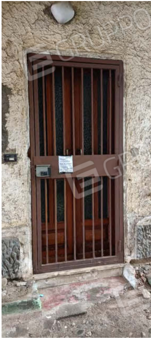
5-Porta d'ingresso dell'immobile su Prospetto Ovest