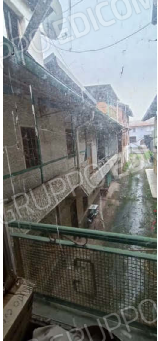
24-Prospetto ovest dal piano primo