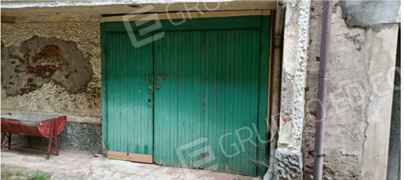
6-Portone d'ingresso dell'autorimessa su Prospetto Ovest