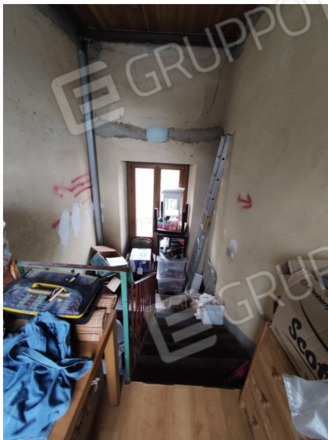
Vano scala tra primo e secondo piano