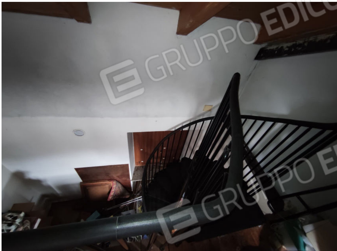
Scala di accesso al sottotetto