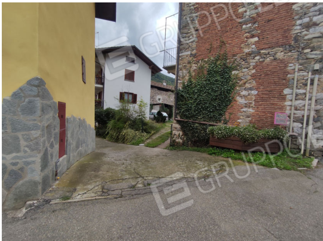
Accesso da Via Gabotto