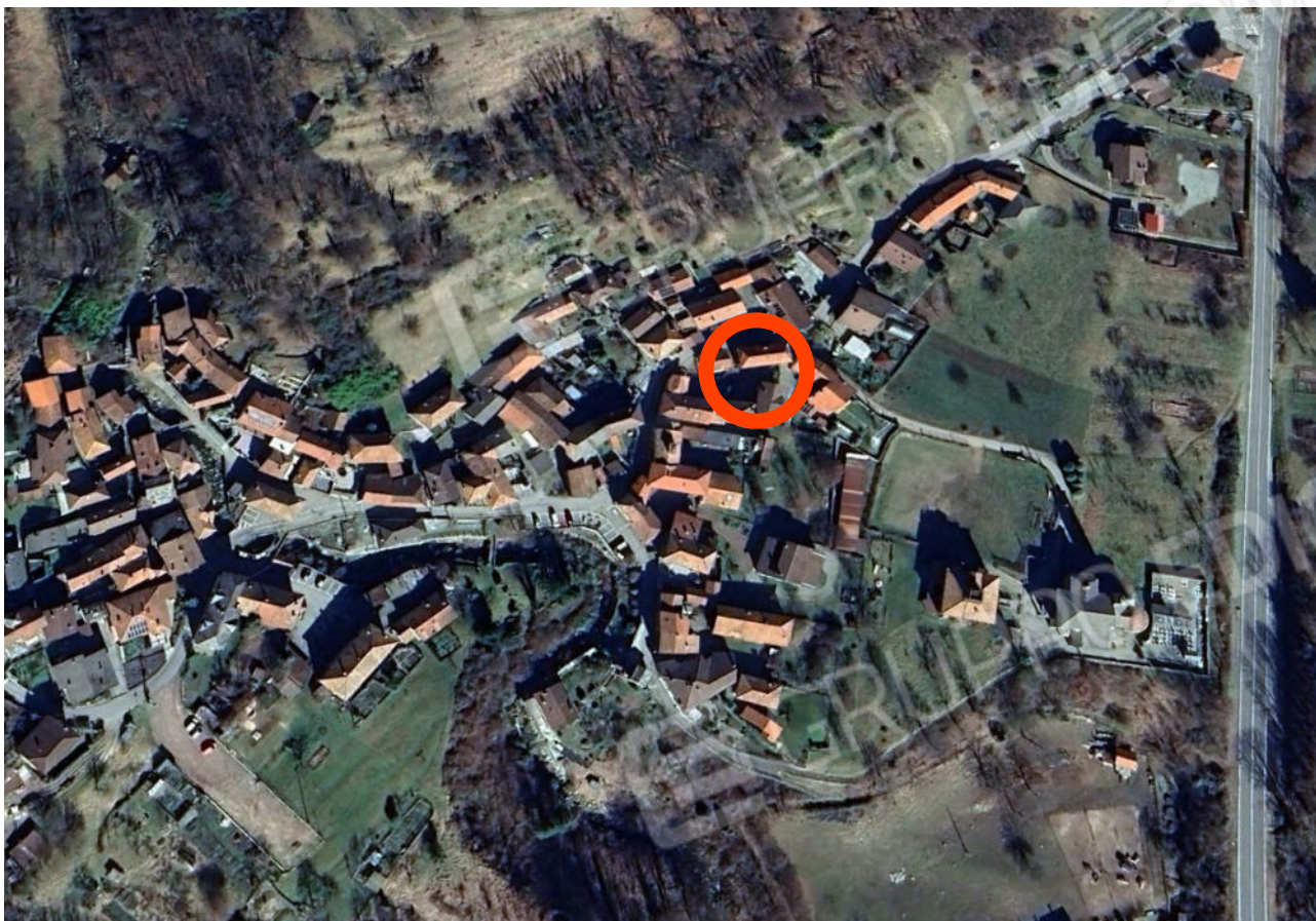
Individuazione beni nella frazione Locarno di Varallo