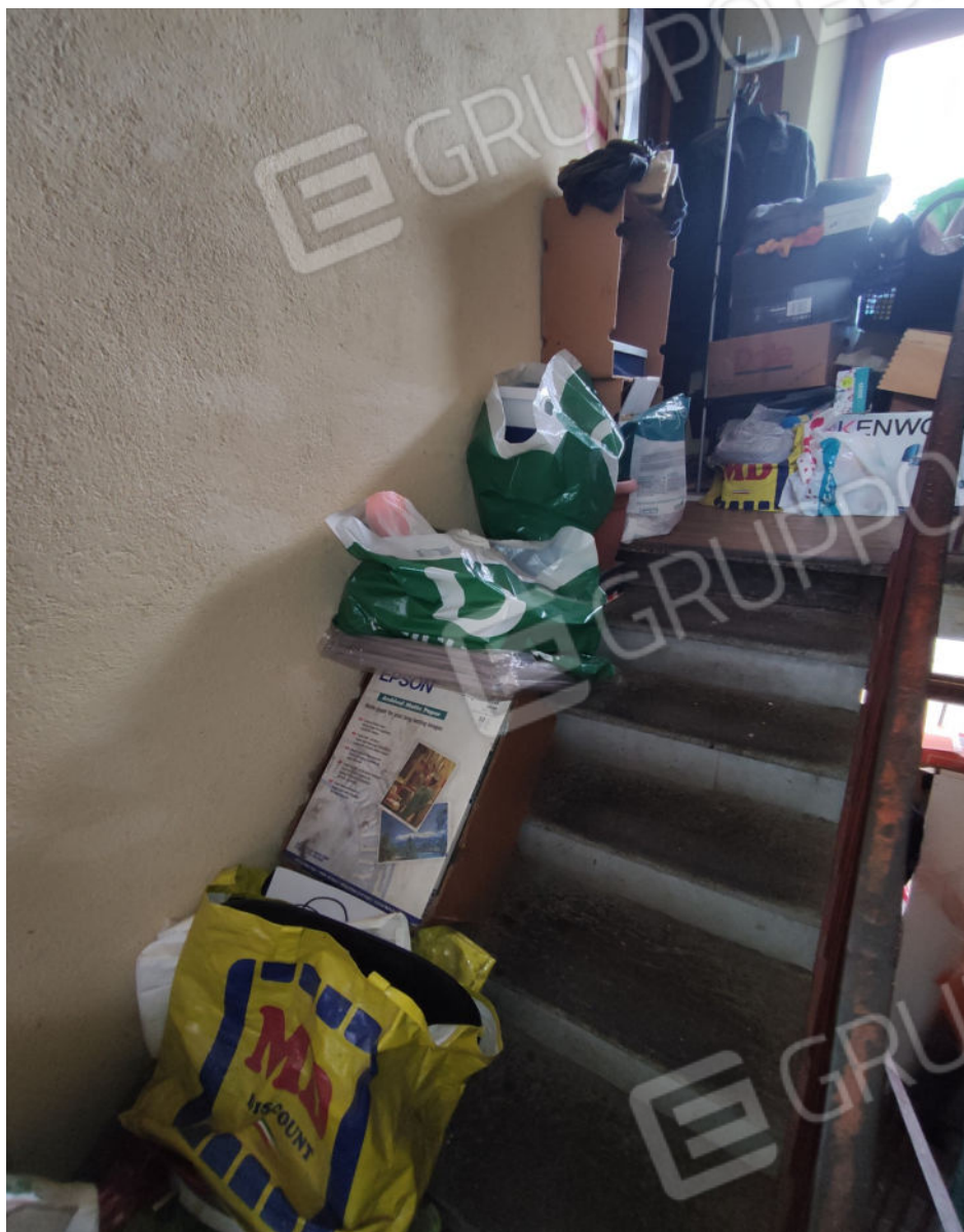
Rampa della scala che porta dal piano terra a piano primo