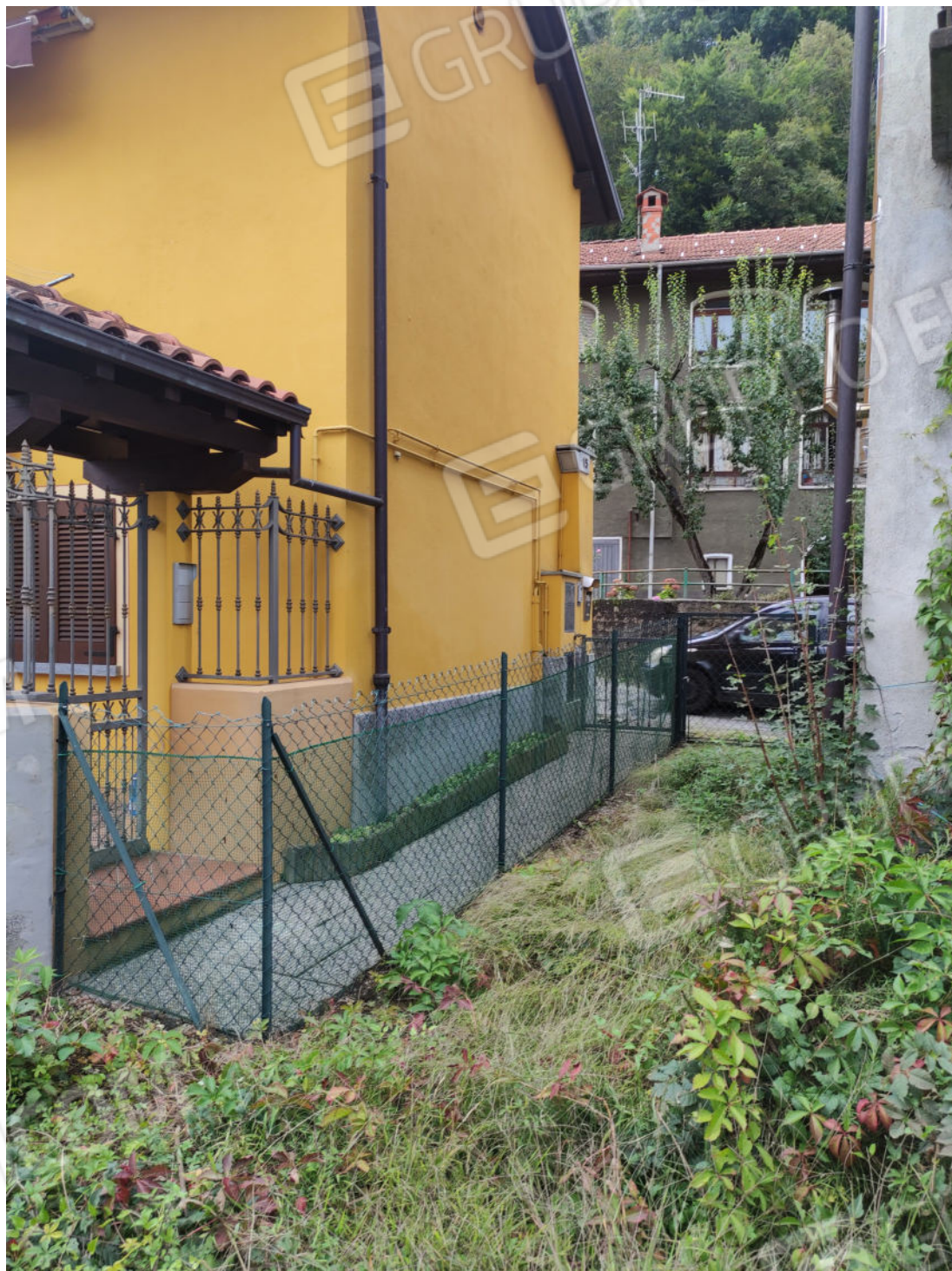
Porzione di cortile recintata e utilizzata dal vicino come accesso pedonale su Via Gabotto