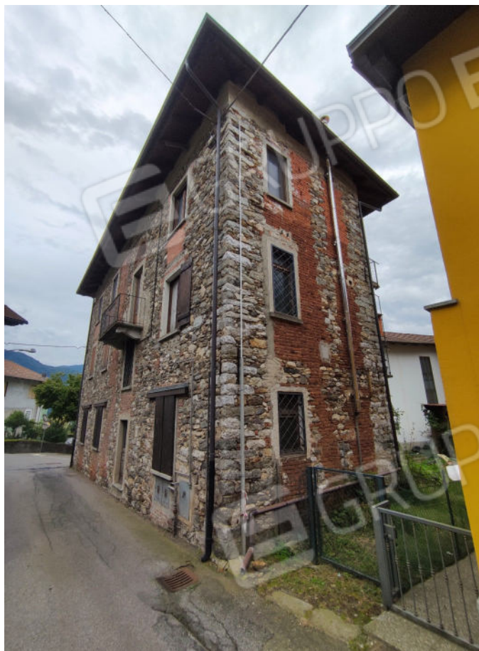
Angolo nord - ovest