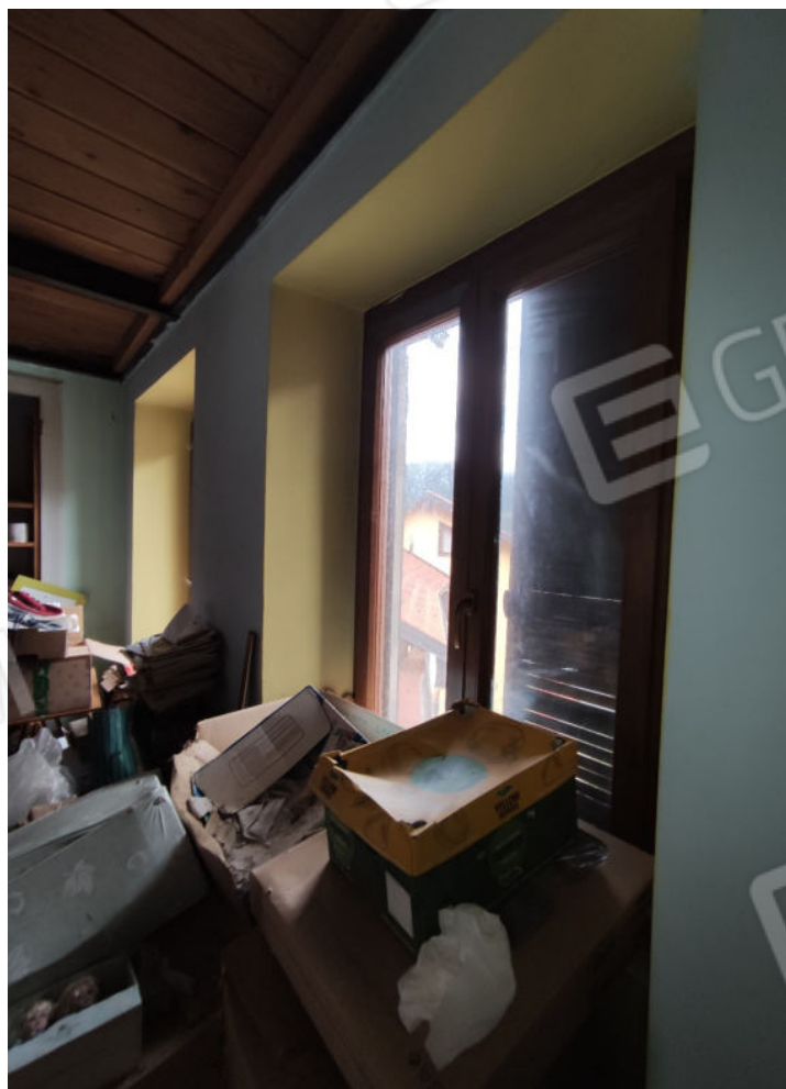
Finestre della camera