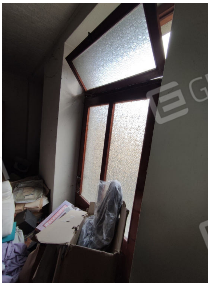
Finestra della camera