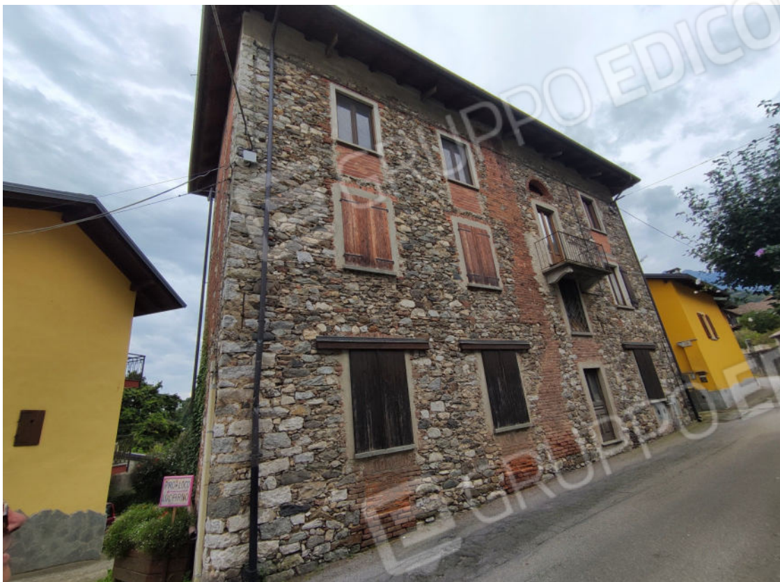
Prospetto nord dell'edificio a confine con Via Gabotto