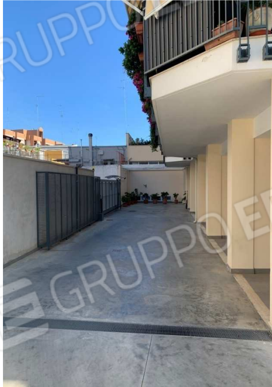
Foto nn. 5-6. Parti comuni