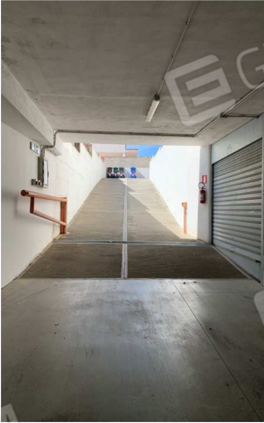
Foto n. 9. Rampa carrabile condominiale