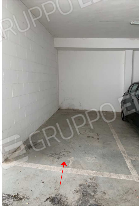
Foto n. 10. Piano S1. Posto auto coperto