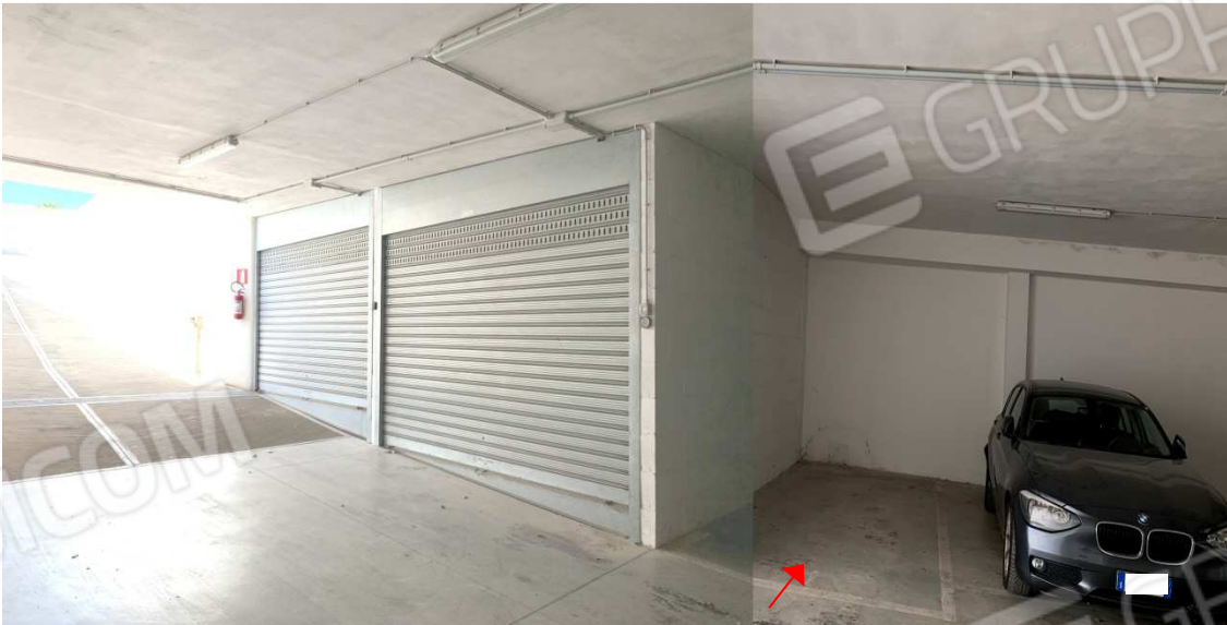
Foto n. 11. Piano S1. Posto auto coperto