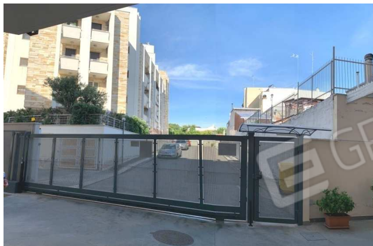
Foto nn. 1-2-3-4. Posto auto coperto al piano S1 (fg. n. 1 ptc. n. 3146 sub. n. 72 ) scala B , sito in Bari Palese (BA) al Vico XX Vittorio Emanuele nn. 29/31