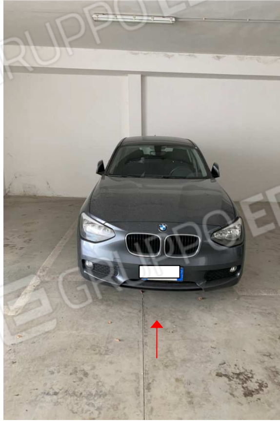
Foto n. 10. Piano S1. Posto auto coperto