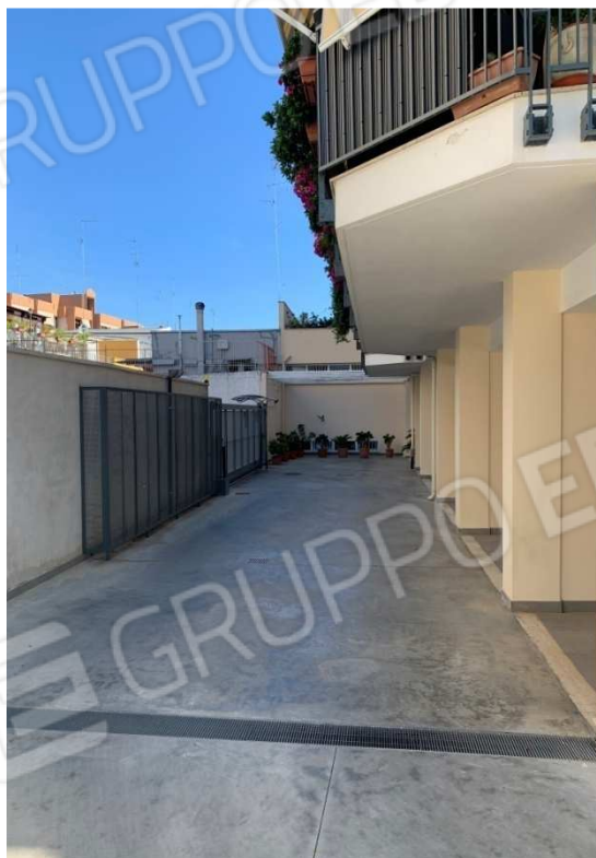
Foto nn. 5-6. Parti comuni