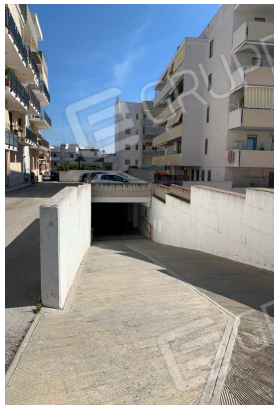
Foto nn. 7-8. Cortile interno e rampa carrabile comune