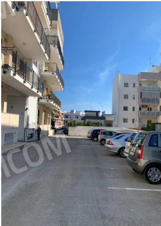
Foto n. 7. Cortile interno