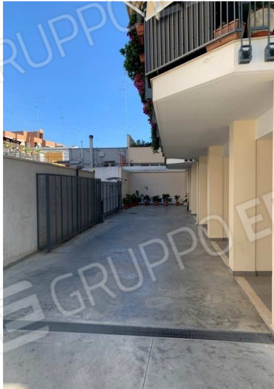
Foto nn. 5-6. Parti comuni