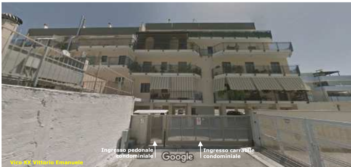
Foto satellitare. Complesso residenziale al civico numero 29/31 di Vico XX Vittorio Emanuele