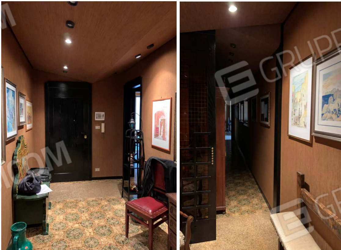
Foto nn. 8-9-10-11. Piano Quinto. Ingresso abitazione e vano ingresso