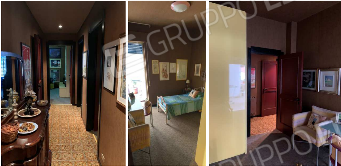
Foto nn. 24-25-26. Piano Quinto. Disimpegno 2 e letto 1