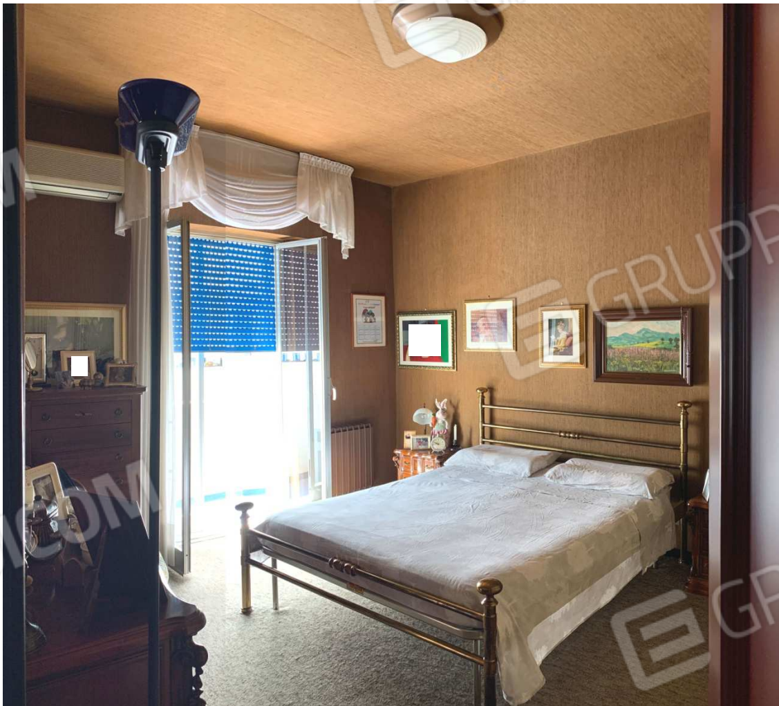
Foto n. 27. Piano Quinto. Letto 2