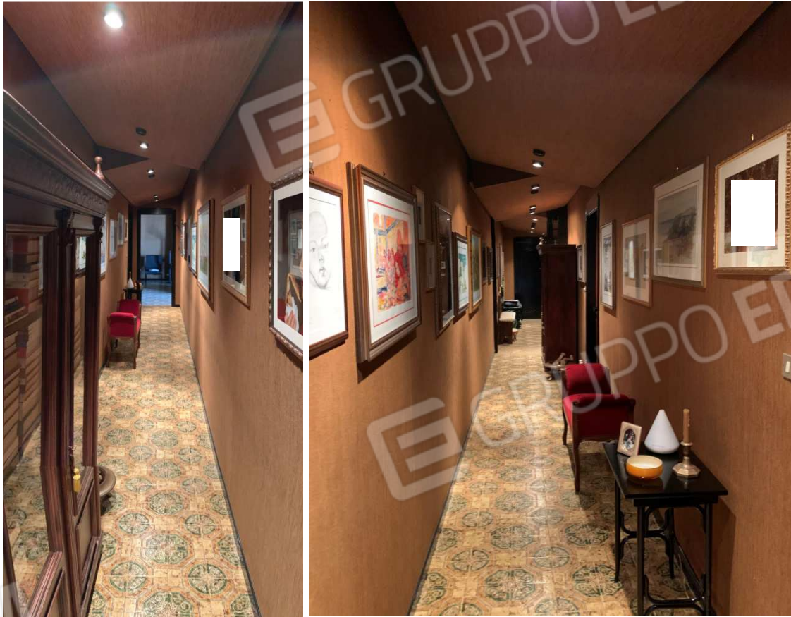
Foto nn. 12-13. Piano Quinto. Disimpegno 1