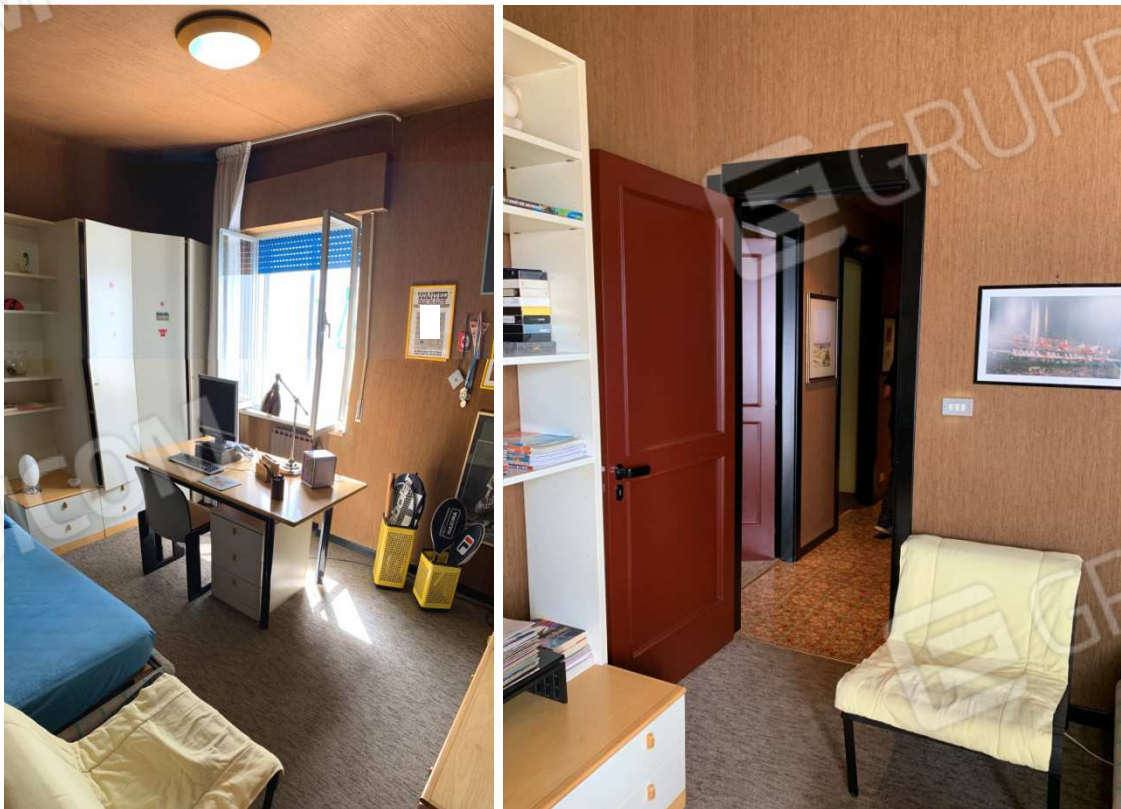
Foto nn. 30-31. Piano Quinto. Letto 3