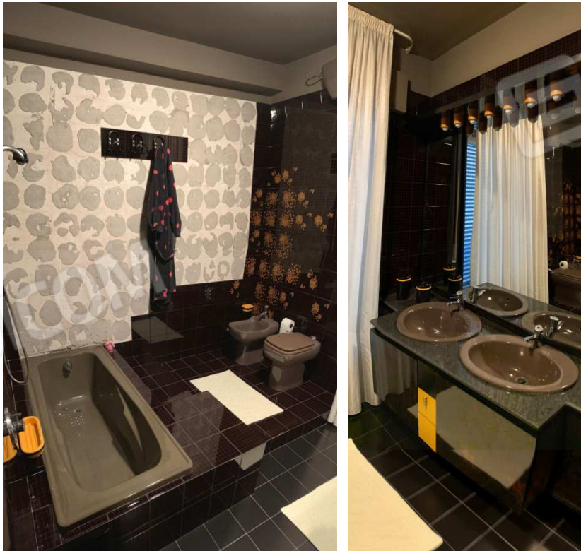
Foto nn. 14-15. Piano Quinto. Bagno 1