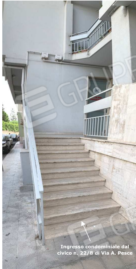
Foto nn. 1-2-3. Appartamento per civile abitazione al piano quinto interno 22 scala E, sito in Monopoli (BA) alla Via Amleto Pesce n. 22/B