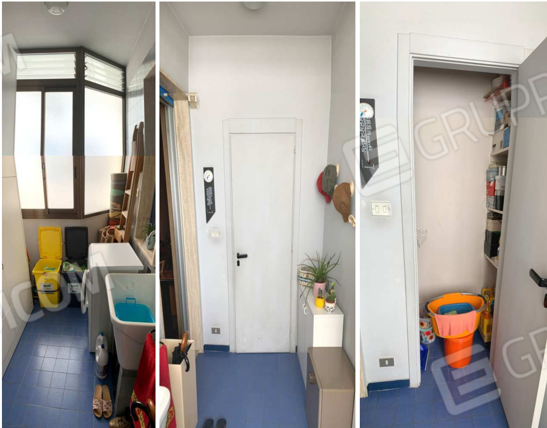
Foto nn. 36-37-38. Piano Quinto. Veranda e ripostiglio