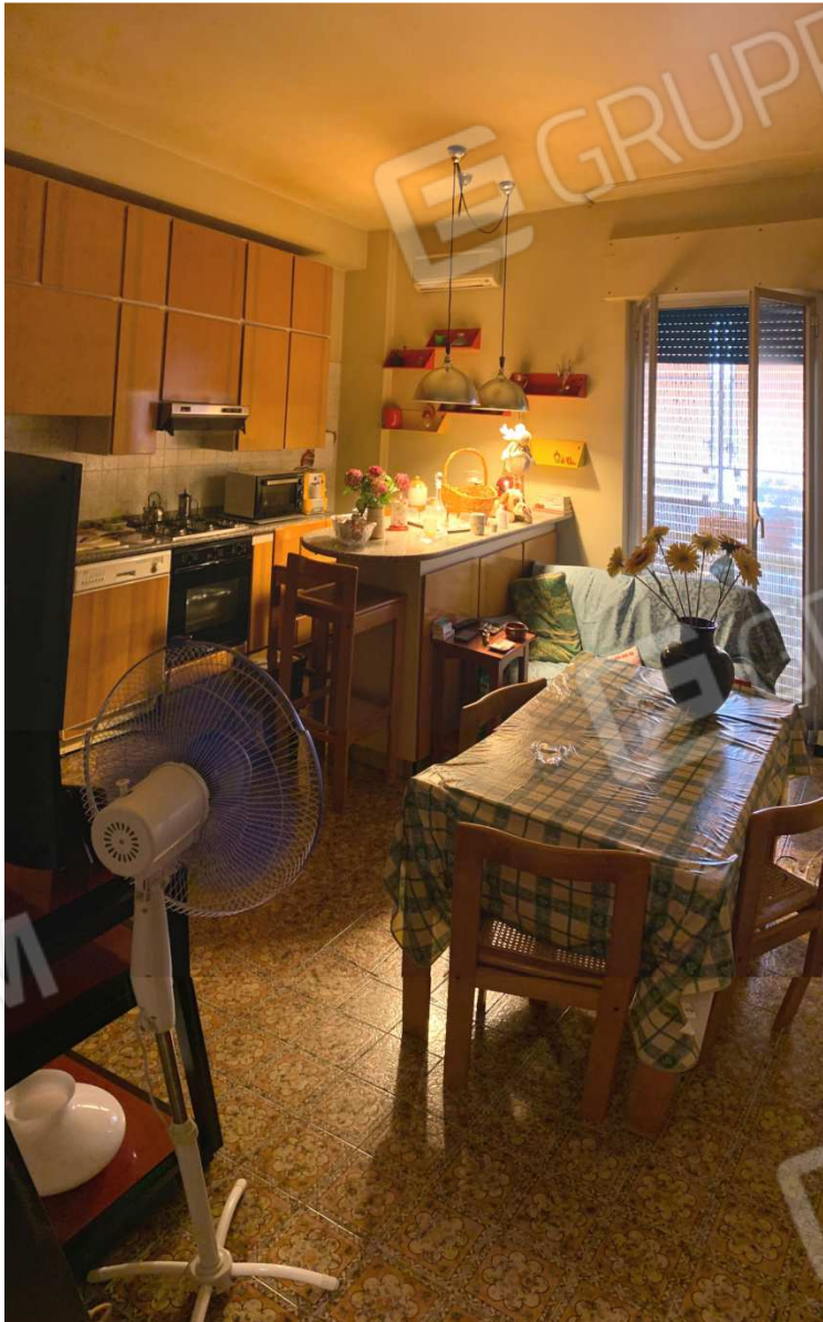
Foto nn. 16-17. Piano Quinto. Cucina