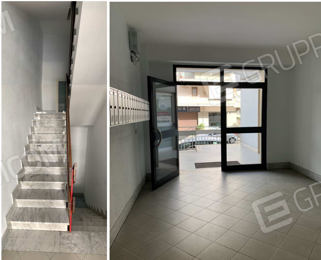
Foto nn. 4-5-6-7. Ingresso comune scala E e androne condominiale