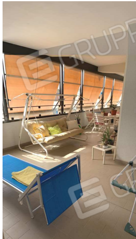
Foto nn. 20-21-22-23. Piano Quinto. Balcone 1 e 2