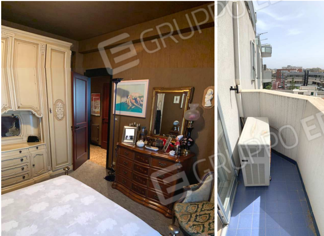
Foto nn. 28-29. Piano Quinto. Letto 2 e balcone 3