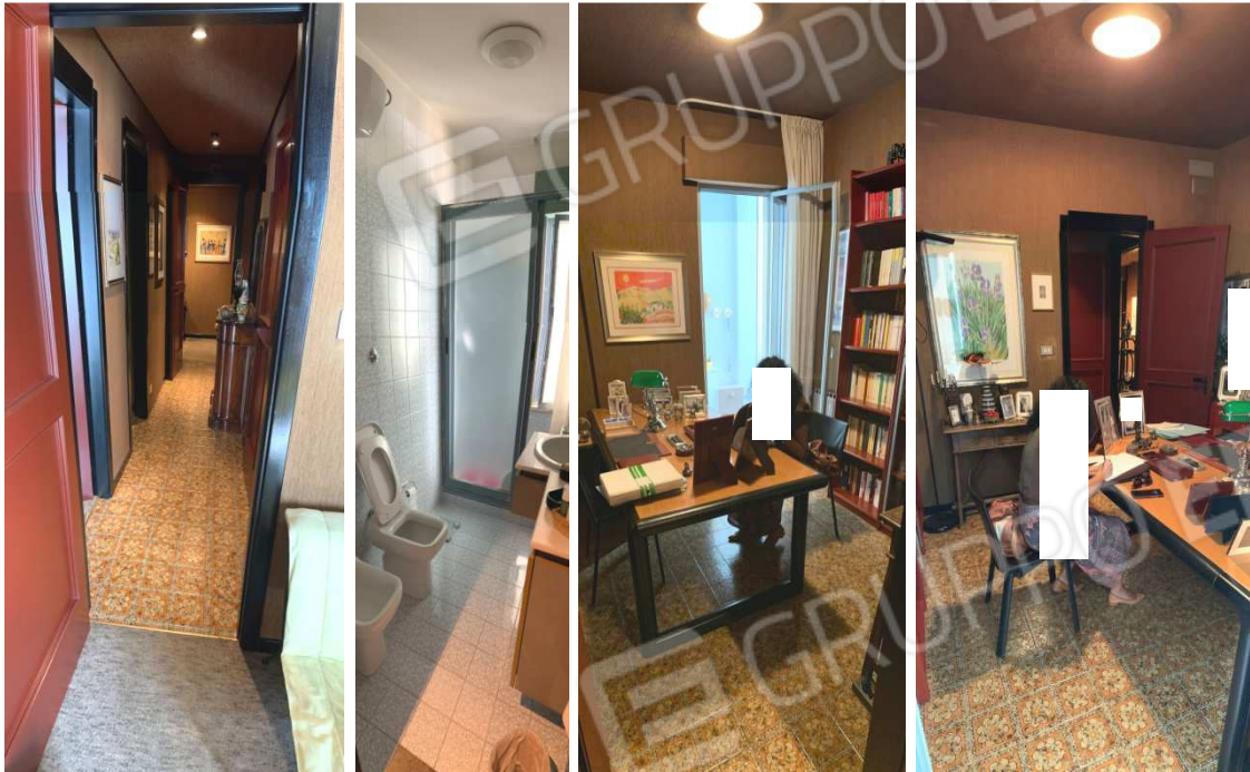
Foto nn. 32-33-34-35. Piano Quinto. Disimpegno2 , bagno 2 e vano studio