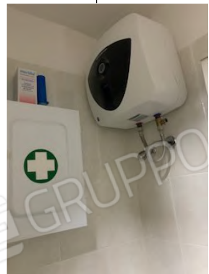
13. scaldabagno WC