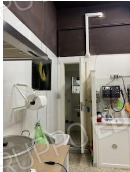
11. vano tre e porta WC