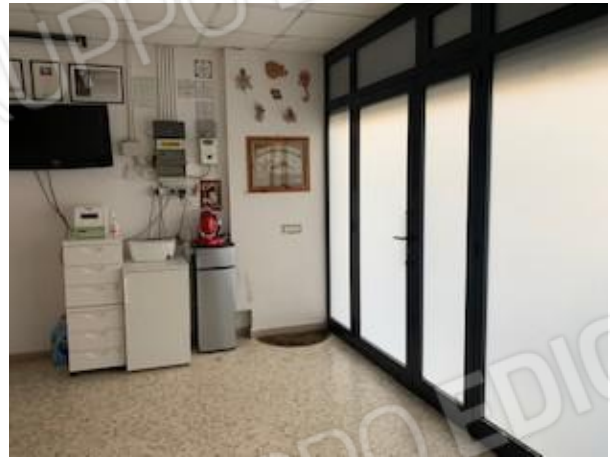
5. vano ingresso