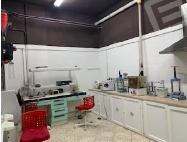
10. vano tre retrostante

Tribunale di Bari Ufficio Esecuzioni Immobiliari Proc. Esecuzione n°150/2020 R.G.Esec.