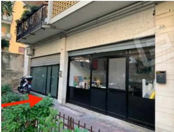
4. ingresso immobile dal civico 34 di via Morea

Tribunale di Bari Ufficio Esecuzioni Immobiliari Proc. Esecuzione n°150/2020 R.G.Esec.