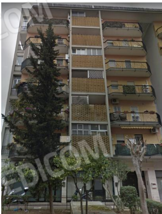
2. Prospetto fabbricato su via Morea