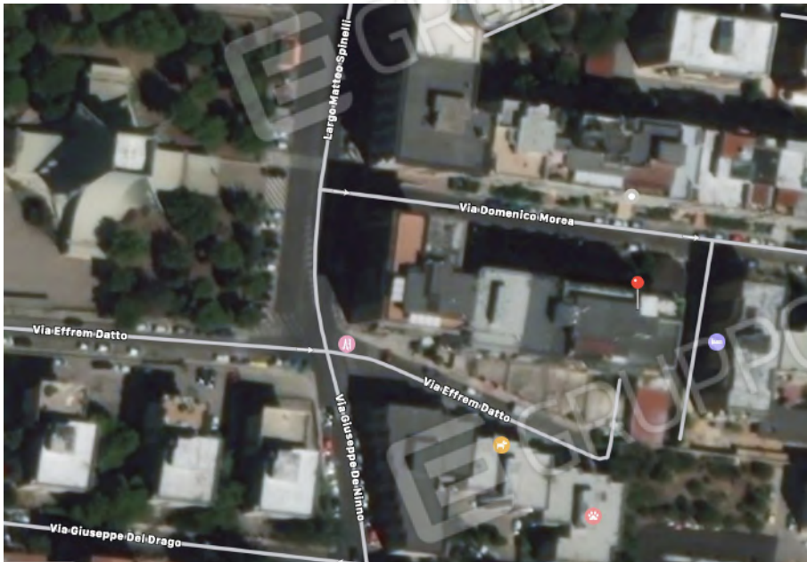
1. ubicazione su ortofoto via Domenico Morea n.34