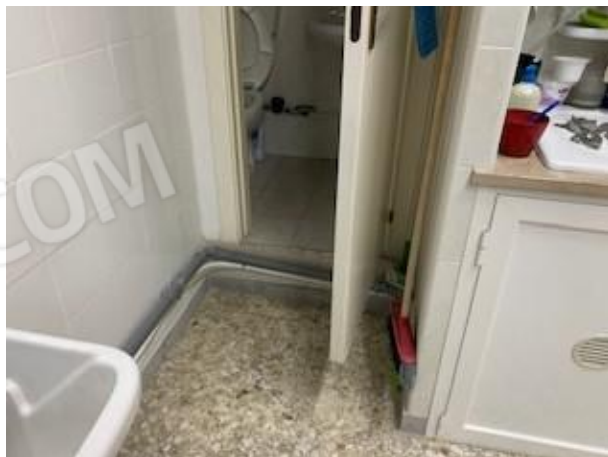
12. particolare pavimento vano 3