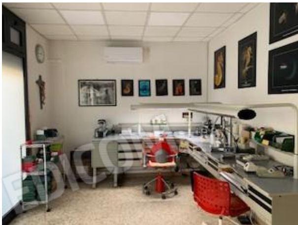
8. vano uno ingresso