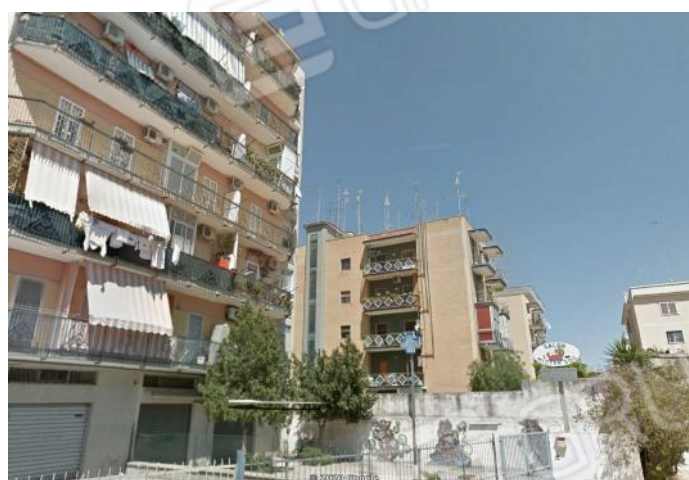
3. Prospetto fabbricato su via Datto

L'Esperto Stimatore dott. agr. Elena Barbone