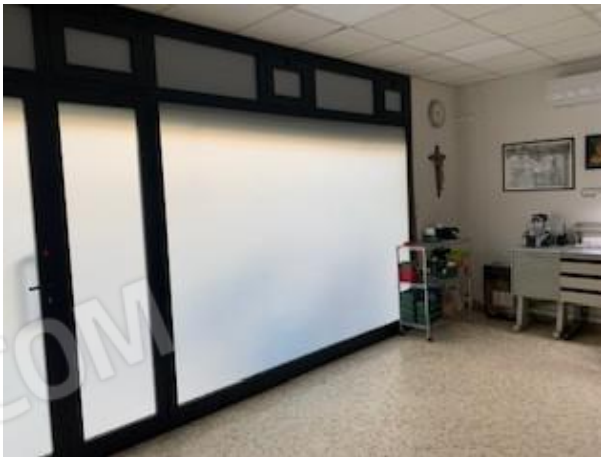
6. vano uno ingresso via Morea