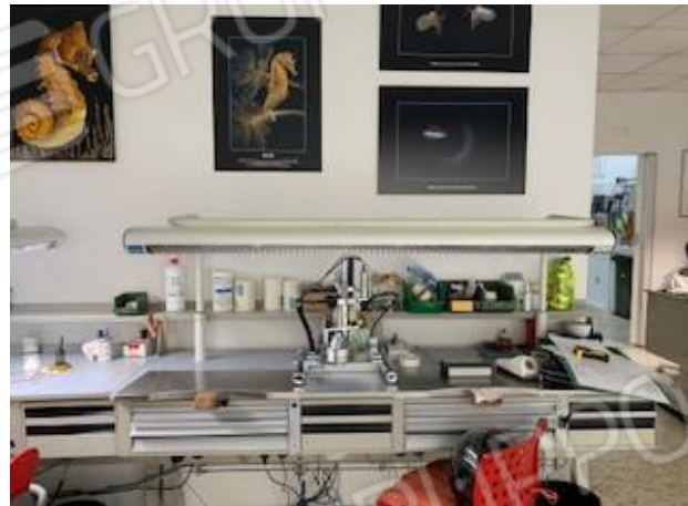
7. vano uno ingresso