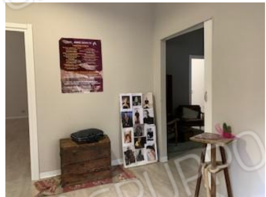
6.ingresso : a sinistra della foto porta per vano 2 , a destra foto vano 3