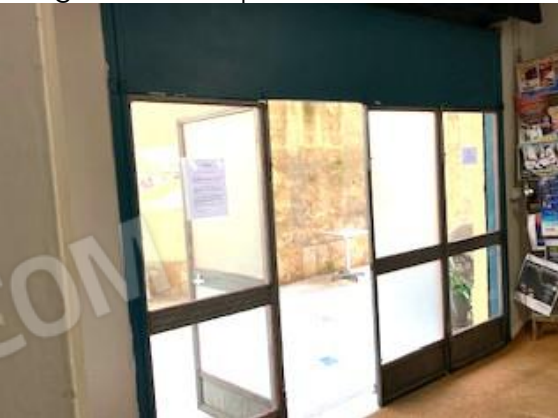
5. vano 1/ ingresso