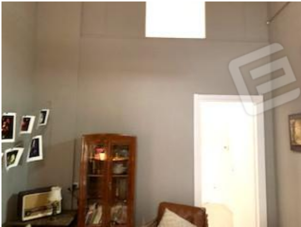
22.porta per vano 5 da vano 3

Tribunale di Bari Ufficio Esecuzioni Immobiliari Proc. Esecuzione n°150/2020 R.G.Esec.