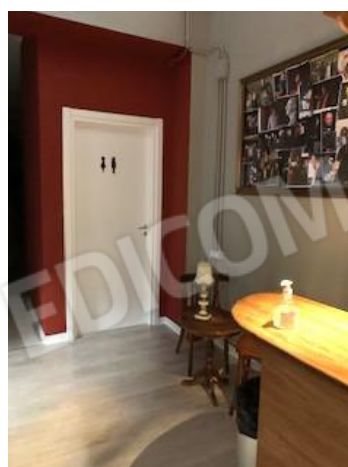
13. vano 3 con porta per WC