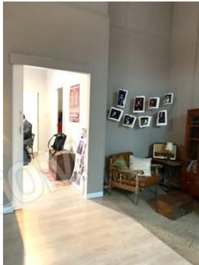
11-12. vano 1/ ingresso e vano 3 ( ad Ovest)