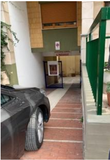
3. ingresso da rampa carrabile

Tribunale di Bari Ufficio Esecuzioni Immobiliari Proc. Esecuzione n°150/2020 R.G.Esec.