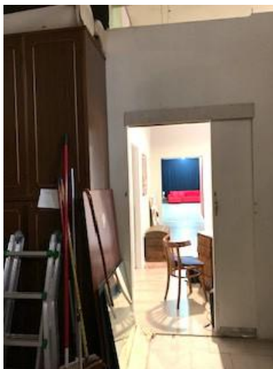
28. vano 1 da vano 6

Tribunale di Bari Ufficio Esecuzioni Immobiliari Proc. Esecuzione n°150/2020 R.G.Esec.