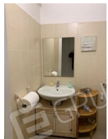
15. vano WC