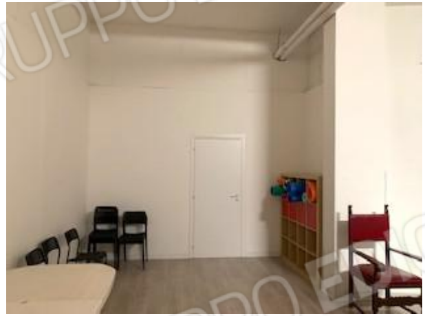
10. vano 2 e porta per vano 1/ingresso