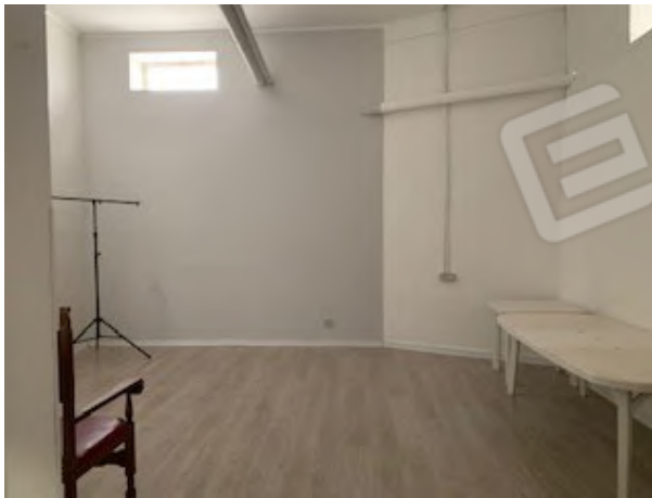
9. vano 2

Tribunale di Bari Ufficio Esecuzioni Immobiliari Proc. Esecuzione n°150/2020 R.G.Esec.