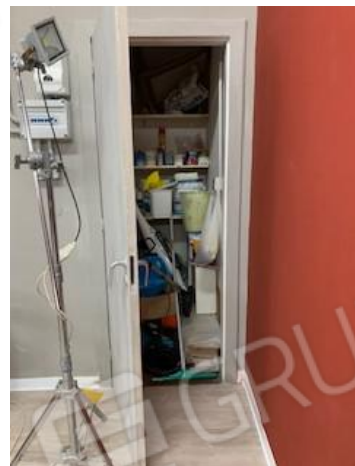
20. vano 4 ( dietro tenda foto 19)