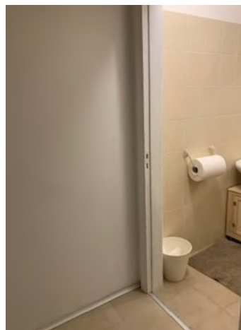
14. disimpegno per vano WC