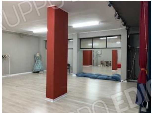
16-17. vano 4