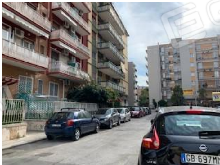
2. Bari via Bartolo Longo