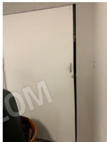
24.porta da vano 1 a vano 6 ( ad EST)