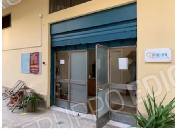
4. cortile e serranda d'accesso al locale