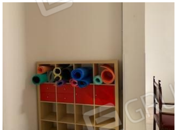
8. vano 2

L'Esperto Stimatore dott. agr. Elena Barbone