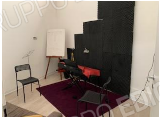
23. vano 5