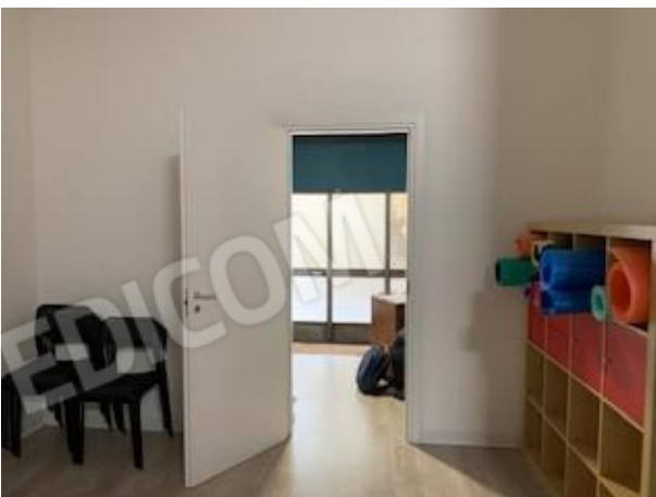
7. vano 1/ingresso e vano 2 (a Sud)