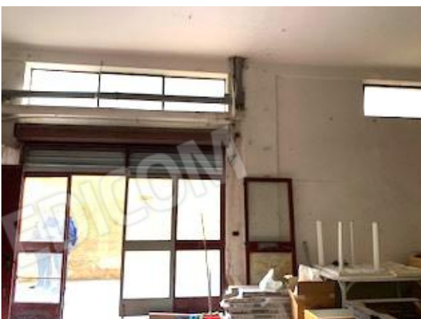
7. interno locale