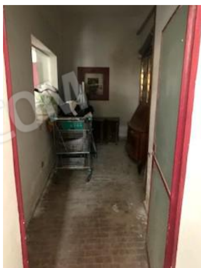
11.locale da intercapedine