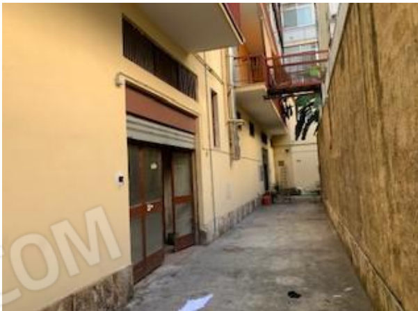
5-6. cortile : serranda e porta vetrata di accesso sub 17