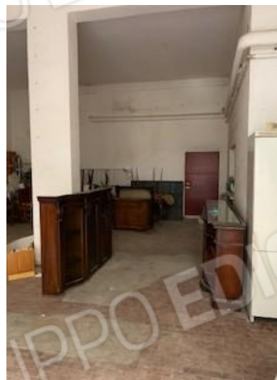
10. locale e porta per intercapedine