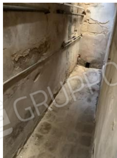
12. intercapedine a Sud