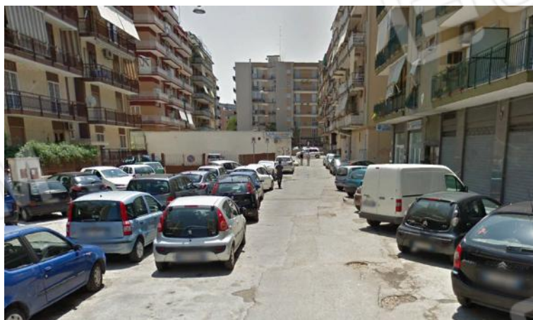
2. Bari via Bartolo Longo