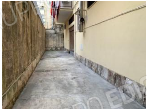
4. cortile: a destra serranda d'accesso al locale