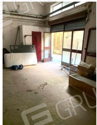
8. a destra dell'ingresso vano WC

L'Esperto Stimatore dott. agr. Elena Barbone