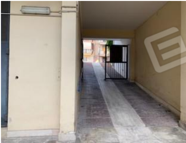
3. ingresso da rampa carrabile

Tribunale di Bari Ufficio Esecuzioni Immobiliari Proc. Esecuzione n°150/2020 R.G.Esec.