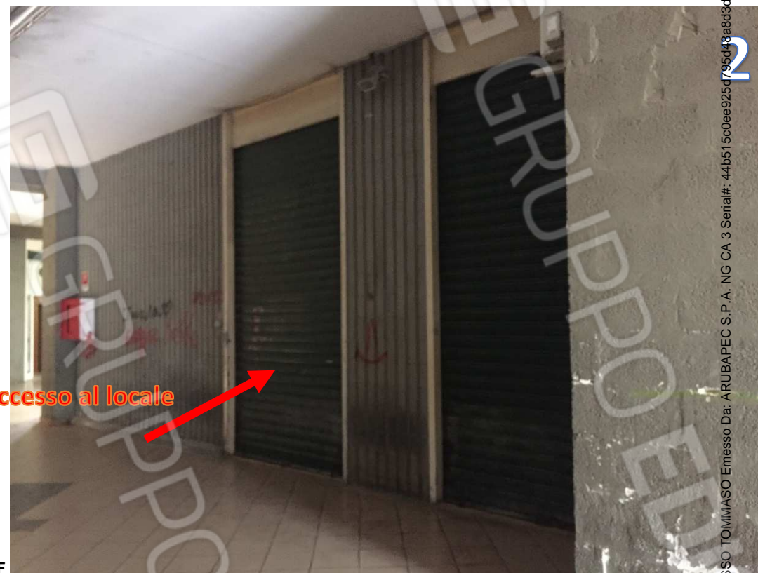
INGRESSI AL LOCALE

Firmato Da: BASSO TOMMASO Emesso Da: ARUBAPEC S.P.A. NG CA 3 Serial#: 44b515c0ee925d795d49a8d3d1082c9f