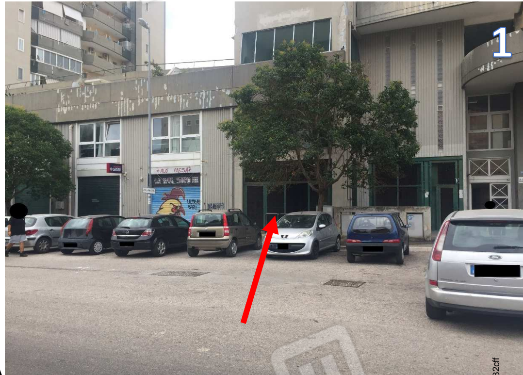
INGRESSO ALLA GALLERIA

Rilievo Fotografico – Immobile sito in Bari alla via Viale Europa 32, 71/L