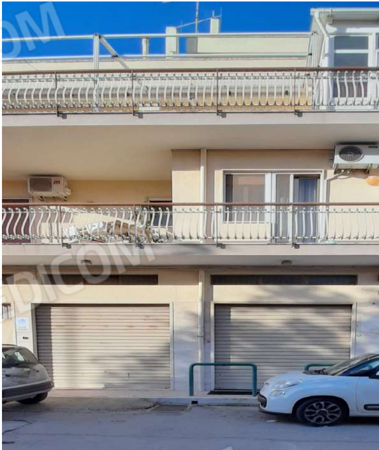
Foto n 1. Accessi nn.cc. 7 - 9