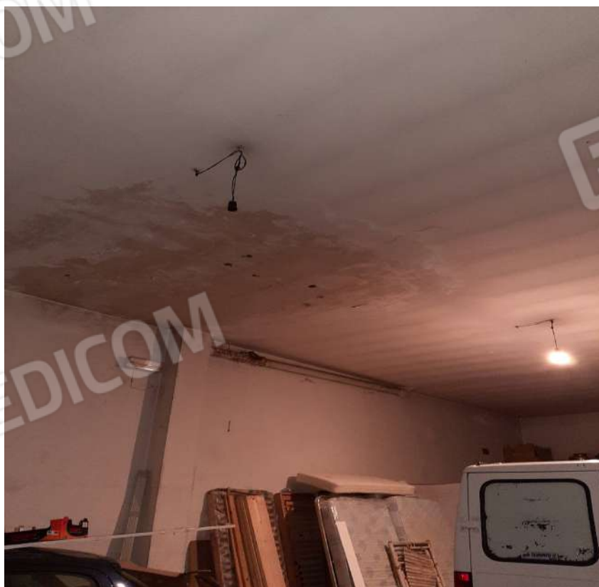
Ffoto n. 9 Interno locale