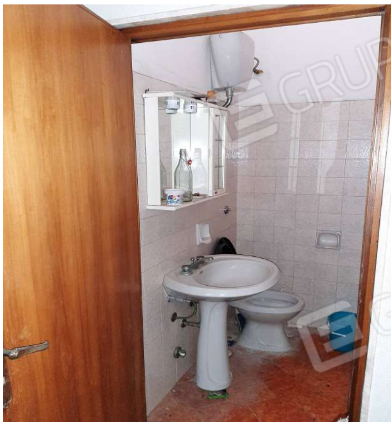
Foto n. 4 Bagno