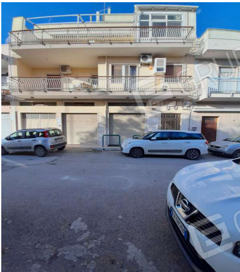
Foto n. 0 Prospetto