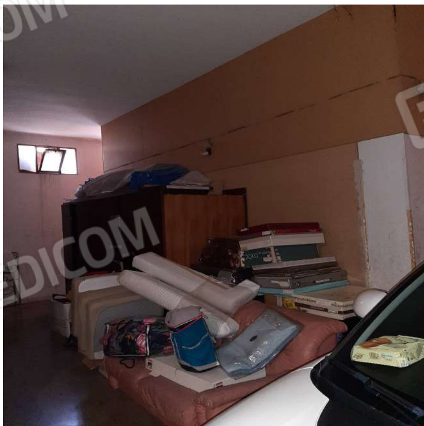
Foto n. 11 Locale dietro zona esposizione con passaggio alla scala per pianerottolo vano scala