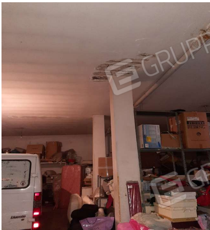
Foto n. 10 Fondo del locale