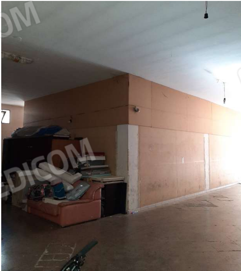
Foto n. 13 Locale con zona delimitata per esposizione