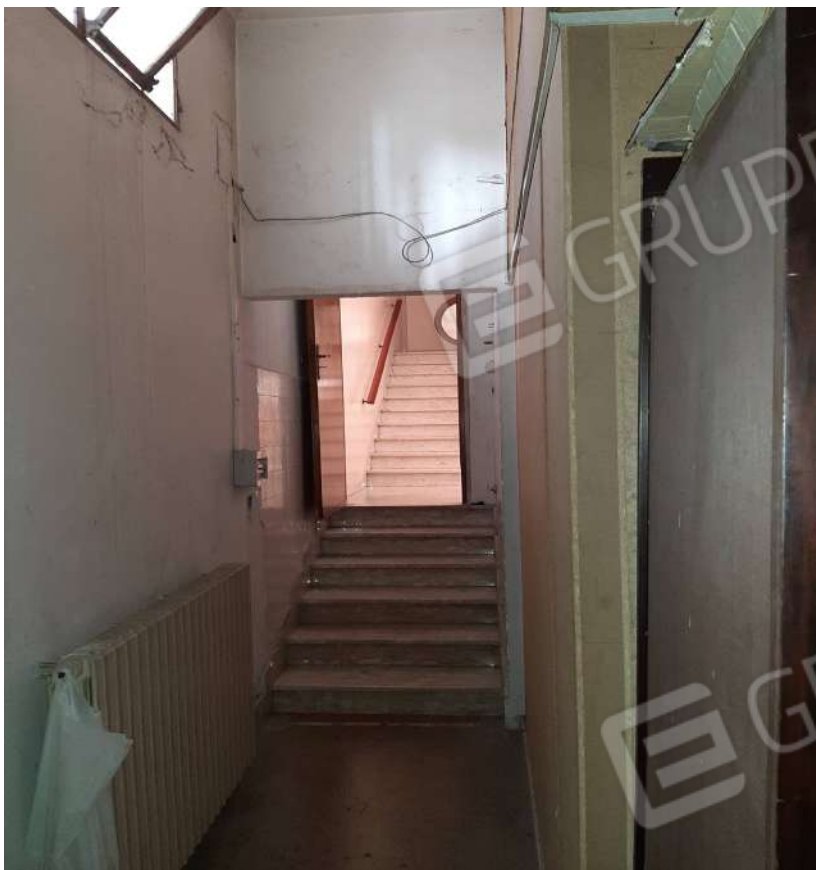
Foto n. 12 Scala da demolire che accede a porta da murare sul pianerottolo vano scala n.c. 5