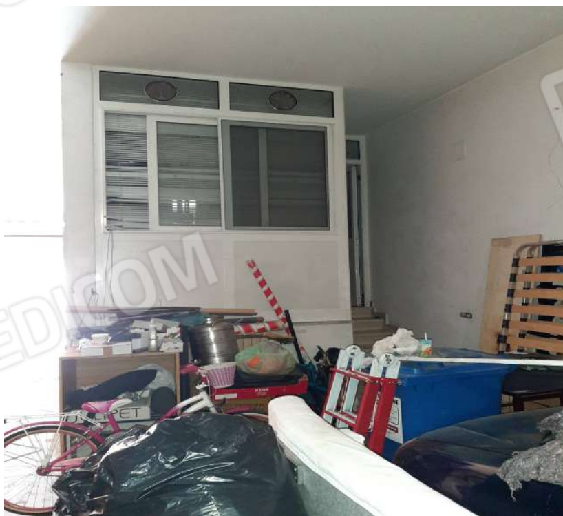
Ffoto n. 7 Locale su rampa