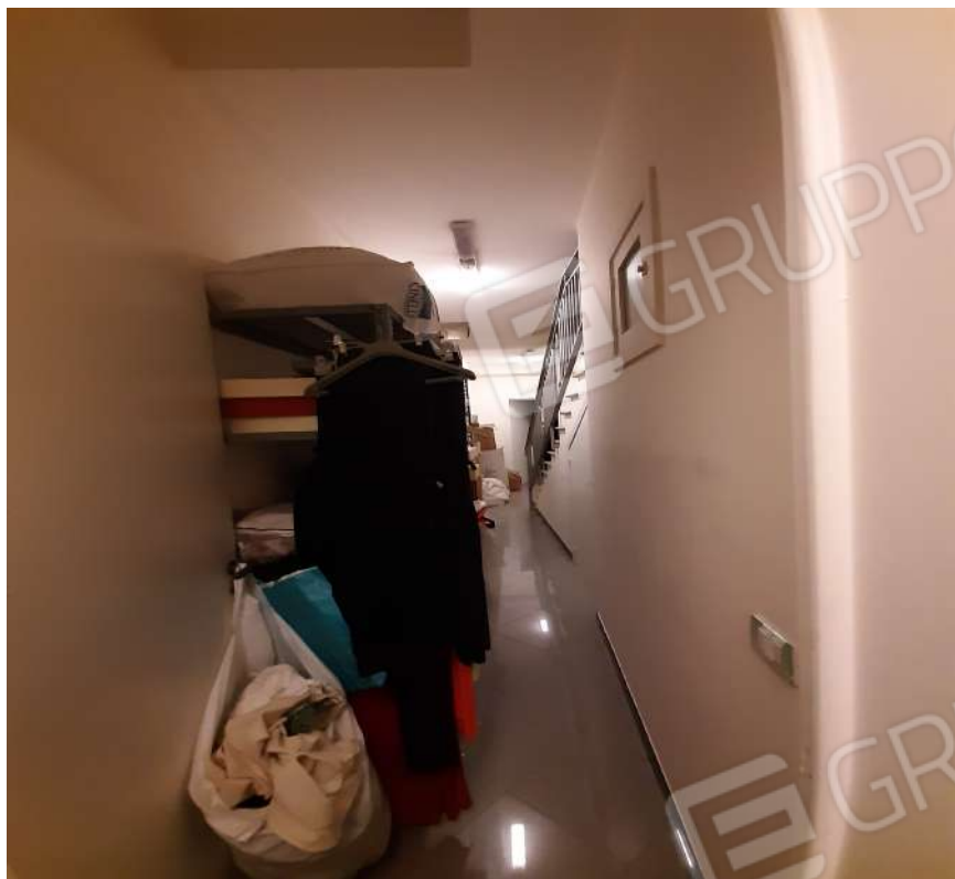
Foto n. 15 Corridoio ai locali retrostanti con destinazione cantina