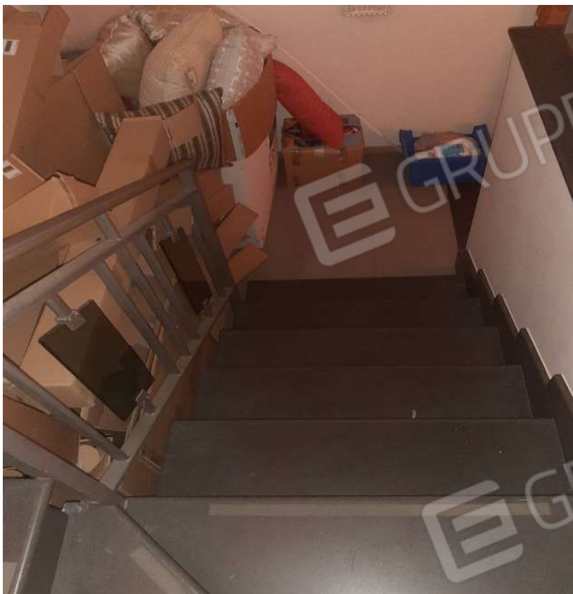
Foto n. 09 Scala al piano interrato