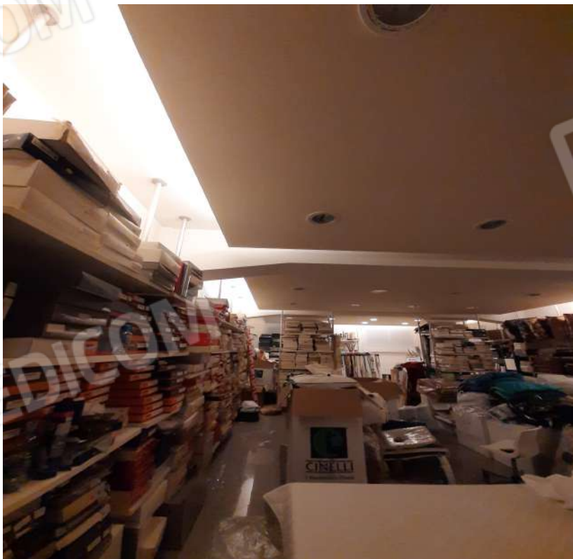
Foto n. 10 Piano interrato vista alla base delle scale