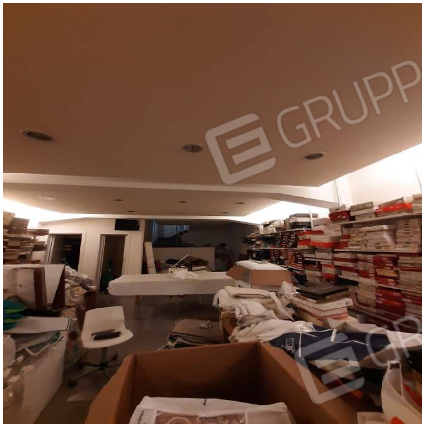
Foto n. 13 Piano interrato vista dal fondo del locale