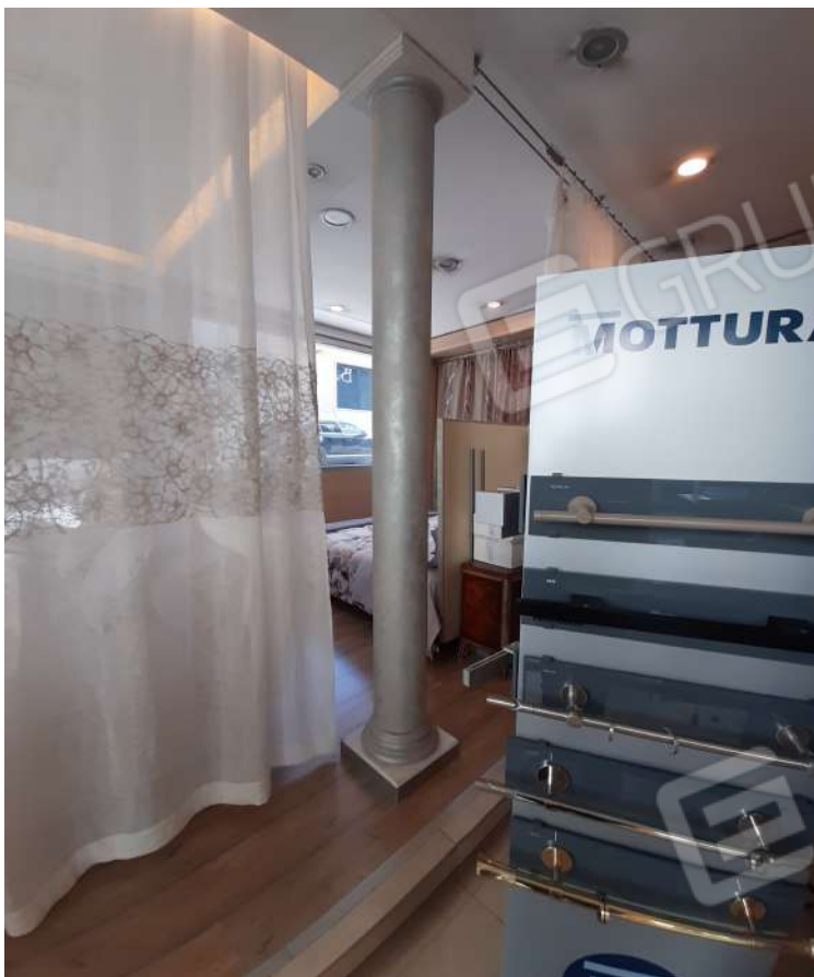
Foto n. 5 Vista interna lato sinistro con vetrine su Via Giuseppe Di Vittorio