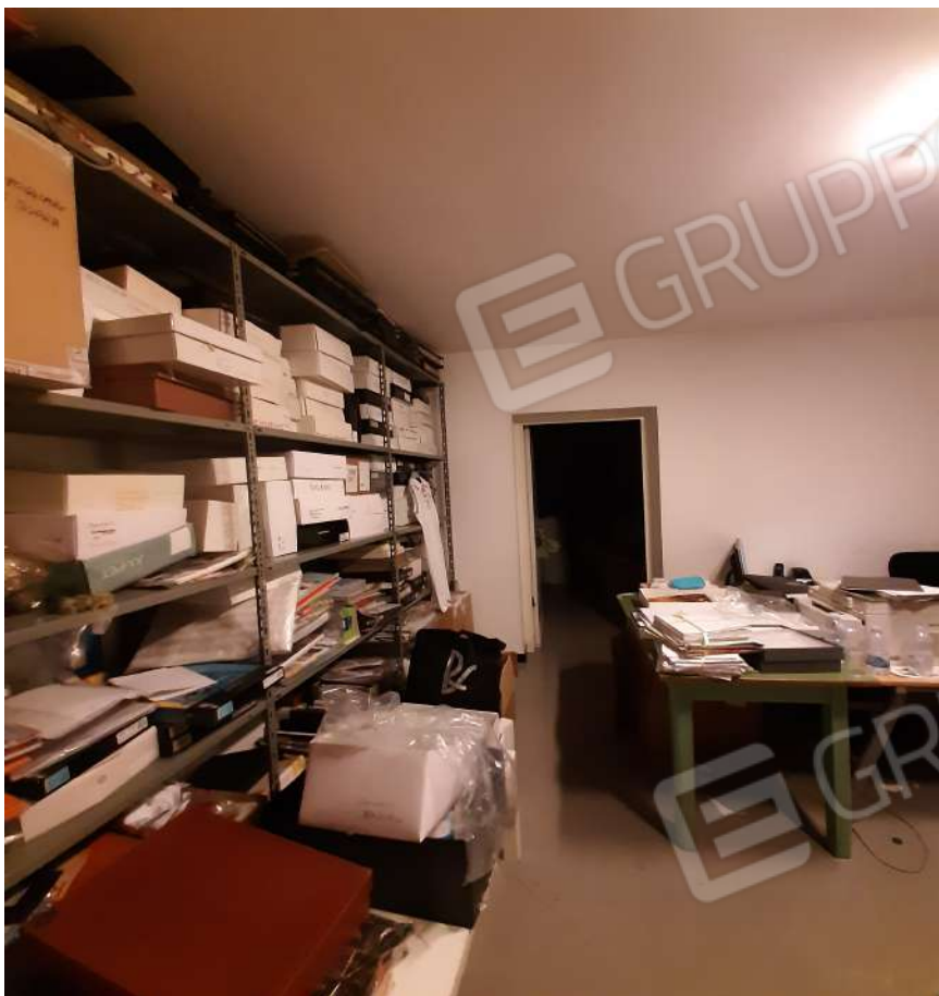
Foto n. 20 Locale retrostante