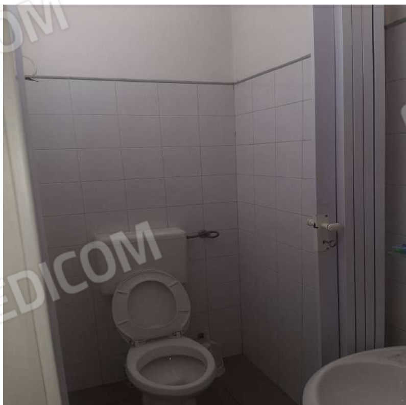
Foto n. 8 Bagno