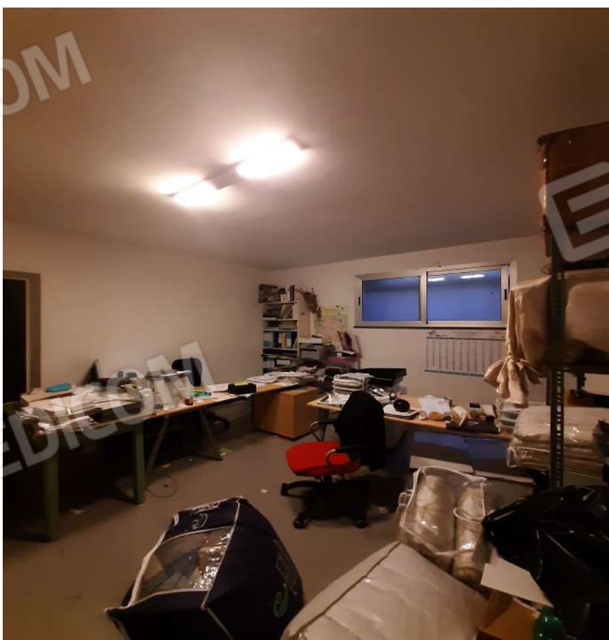
Foto n. 19 Locale retrostante