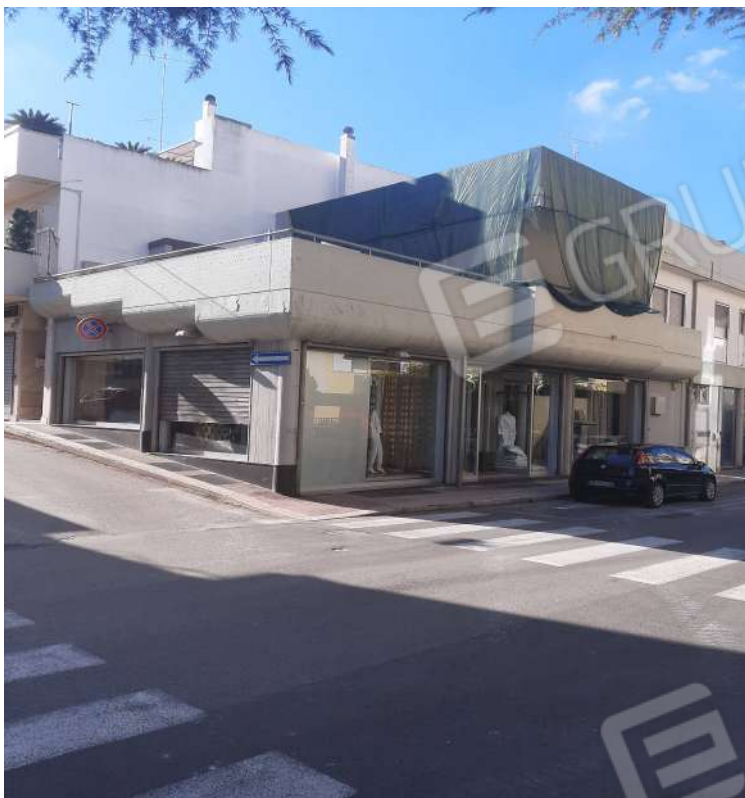
Foto n. 1 Vista complessiva dei prospetti