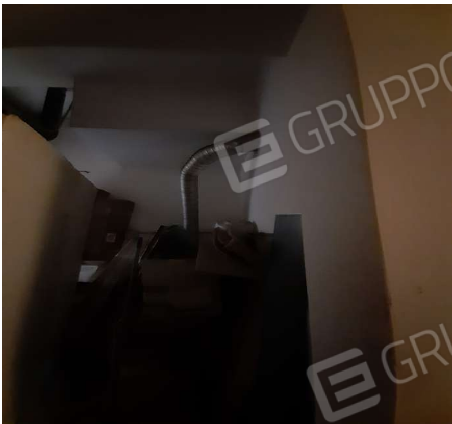
Foto n. 18 Locale C.T. in disuso