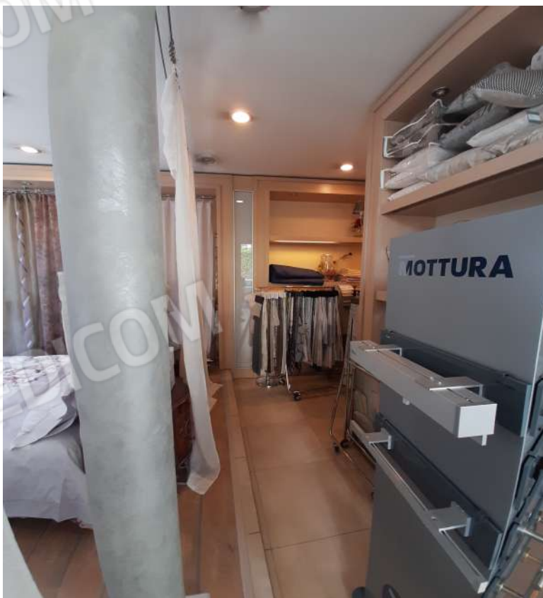
Foto n. 6 Vista interna con scaffalature centrali