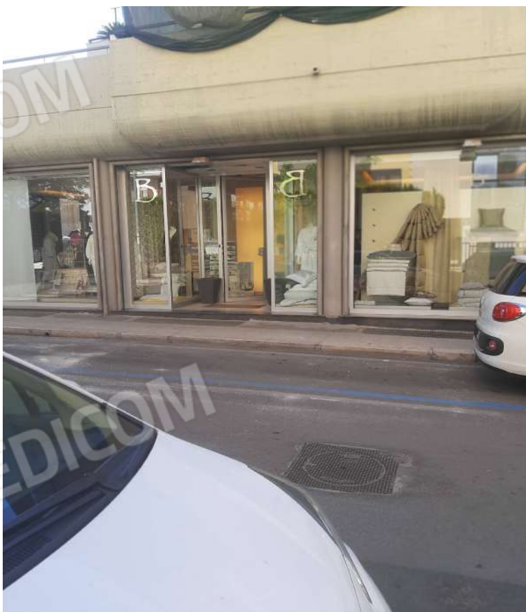
Foto n. 2 Vista da Via Antonio Macario