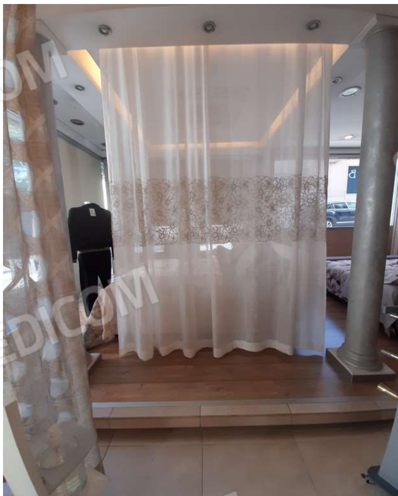
Foto n. 4 Vista interna lato sinistro con vetrine su Via Giuseppe Di Vittorio