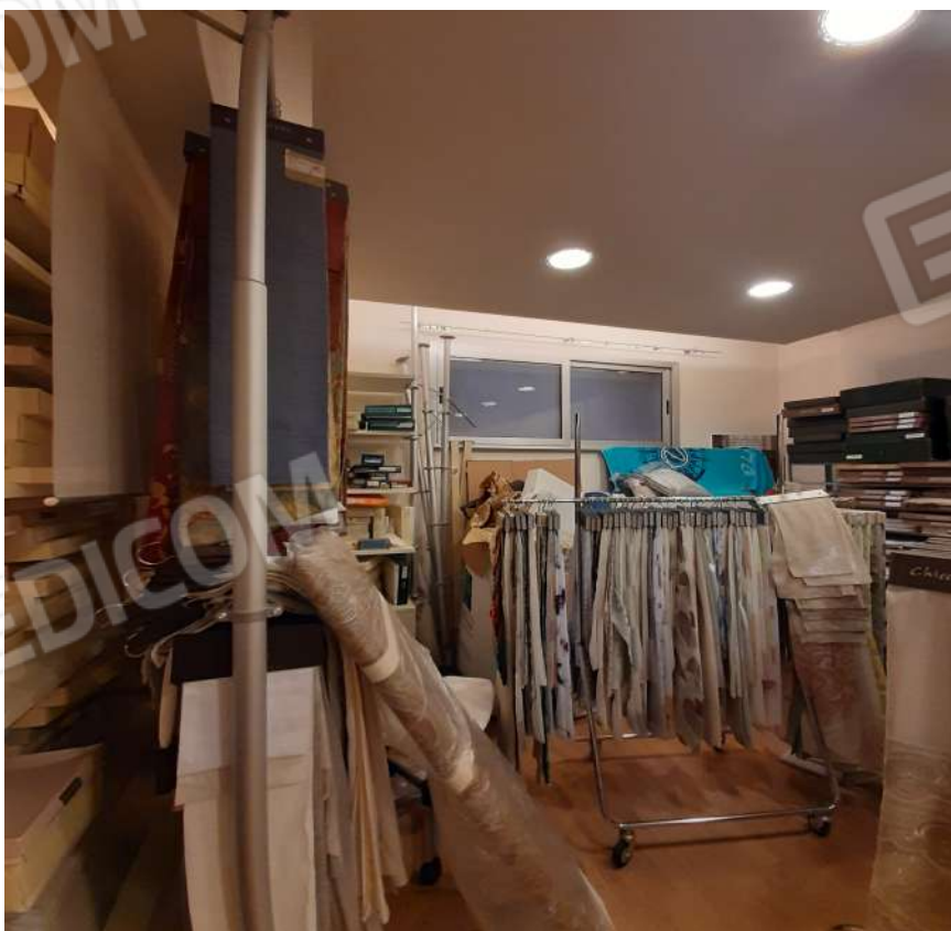
Foto n. 21 Locale retrostante