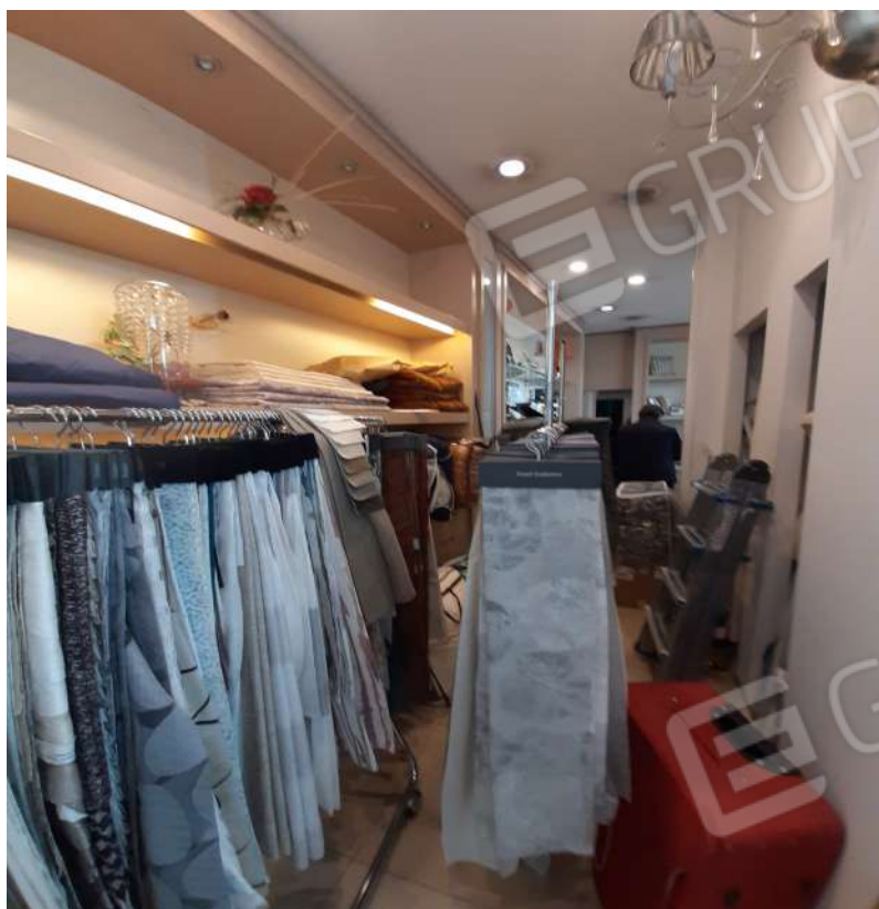
Foto n. 7 Interno dietro le scaffalature centrali