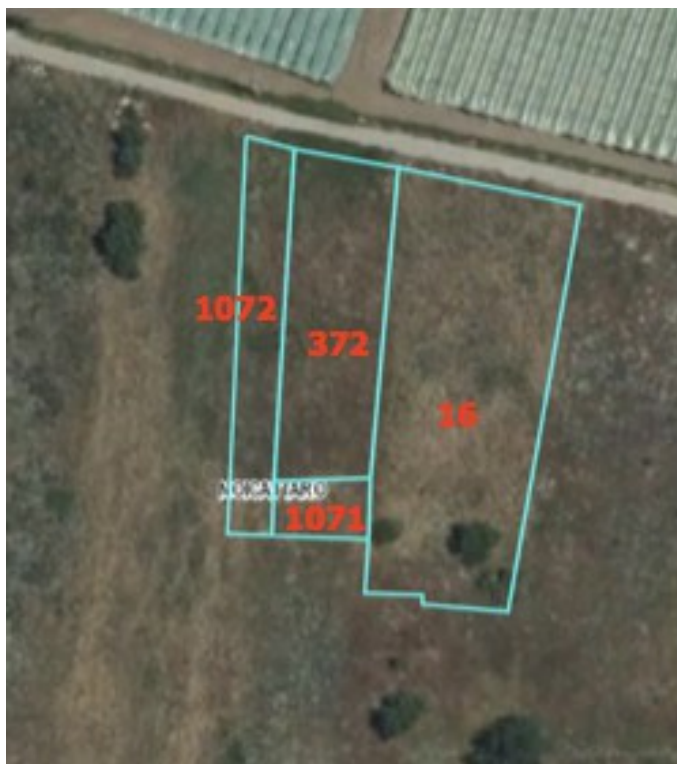
1. Ortofoto con ubicazione terreni pignorati

I terreni hanno l'accesso diretto dalla via Giuseppe Saragat come si evince dalla ortofoto qui di seguito e dallo stralcio della mappa catastale a pag. 6.