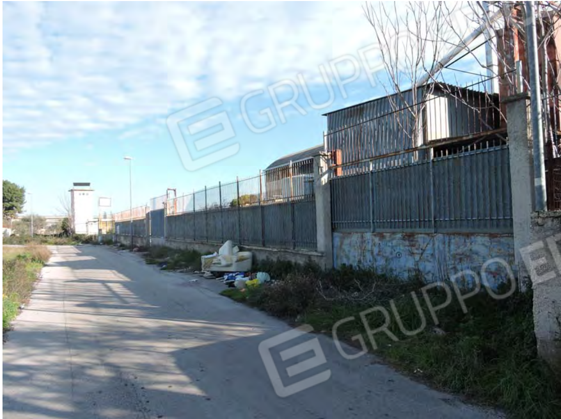
Strada Fondo Capillo del Campo