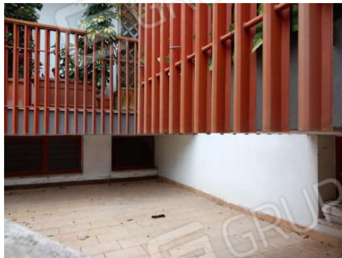
Foto 24 - Vista verso il lato Sud sottoposto al balcone di altra u.i.u.