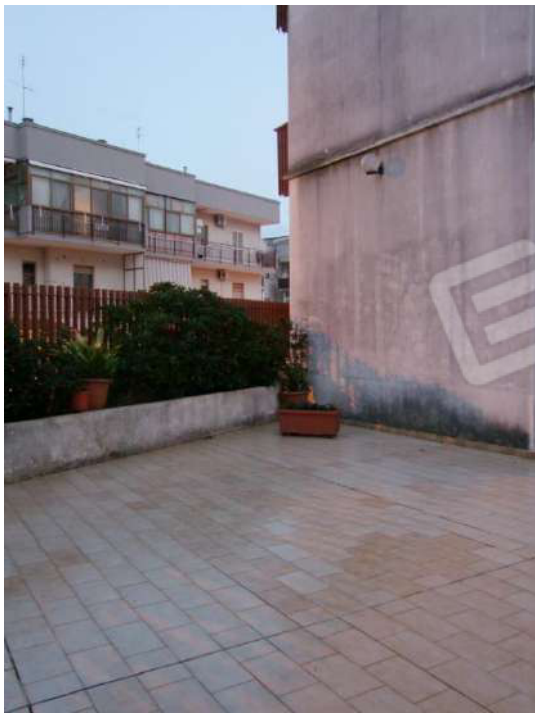
Foto 21 - Vista del cortile verso il passaggio allo spazio di corte