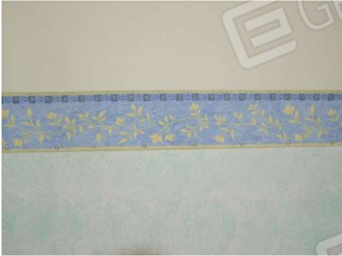
Foto 31 - Particolare parete dell'ambiente L1