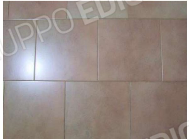
Foto 26 - Particolare pavimentazione balconi al prospetto posteriore