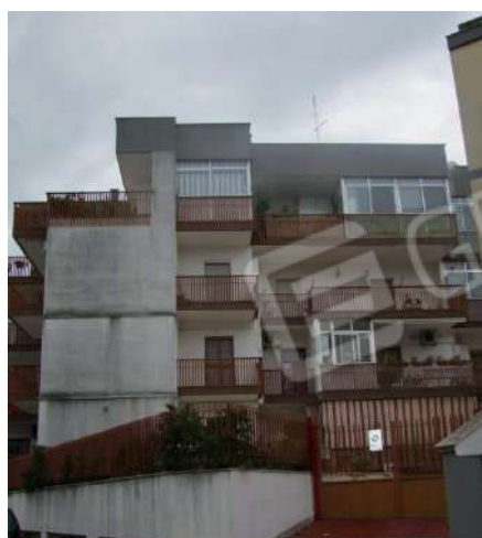
Foto 6 – Prospetto posteriore su via G. Armellini – Particolare rampa d'ingresso al Bene 2