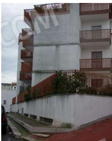
Foto 5 – Prospetto posteriore su via G. Armellini – Particolare angolo della recinzione del cortile del Bene 1