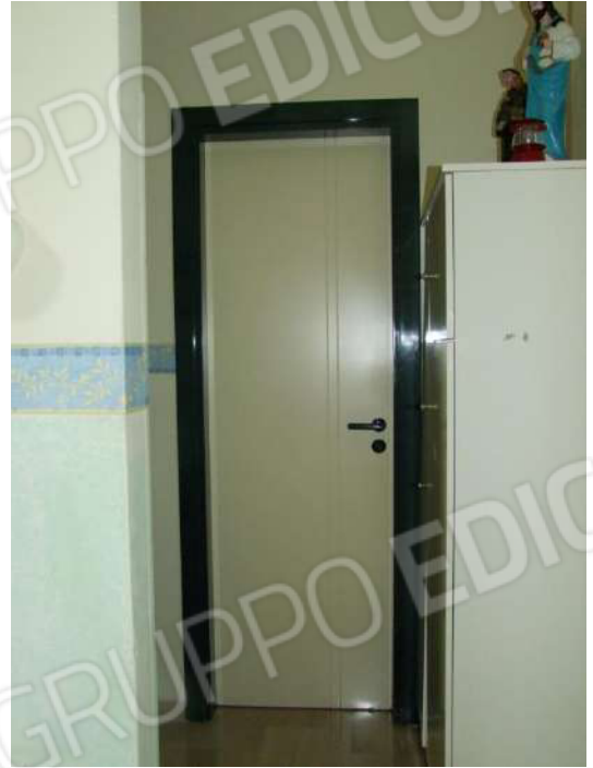
Foto 32 - Particolare infisso interno