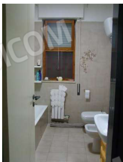
Foto 15 - Vista del bagno