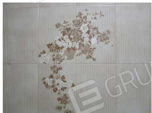
Foto 30 - Particolare rivestimento bagno