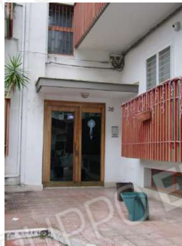
Foto 2 - Prospetto dell'edificio su via E. Fermi – Particolare portone d'ingresso