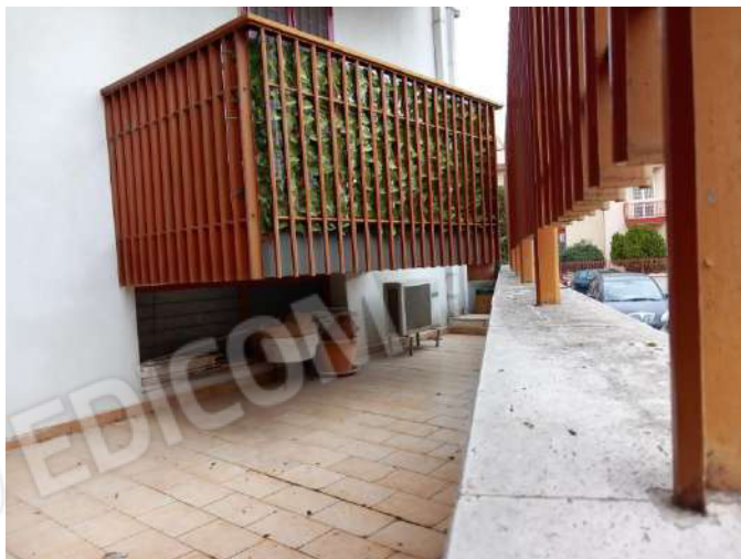
Foto 23 - Vista verso il passaggio al cortile