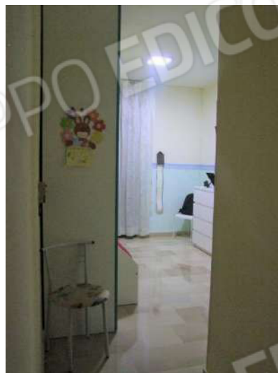
Foto 12 - Vista verso l'ambiente L1