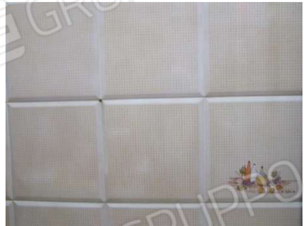
Foto 28 - Particolare rivestimento pareti della cucina