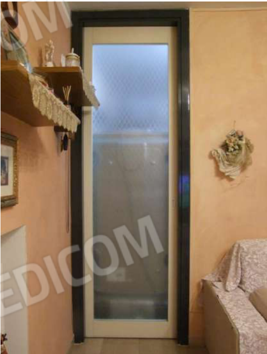
Foto 33 - Particolare vetrata di comunicazione tra il soggiorno e la cucina