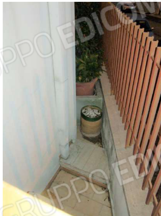
Foto 22 - Vista del passaggio tra il cortile e lo spazio di corte