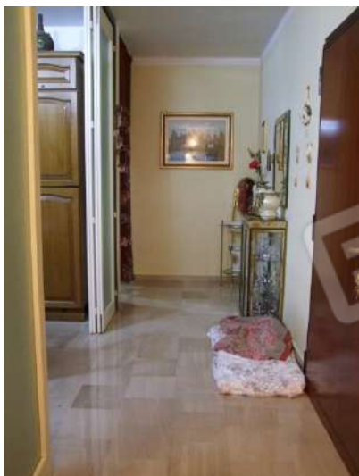
Foto 11 - Vista dall'ingresso verso il disimpegno alla zona notte