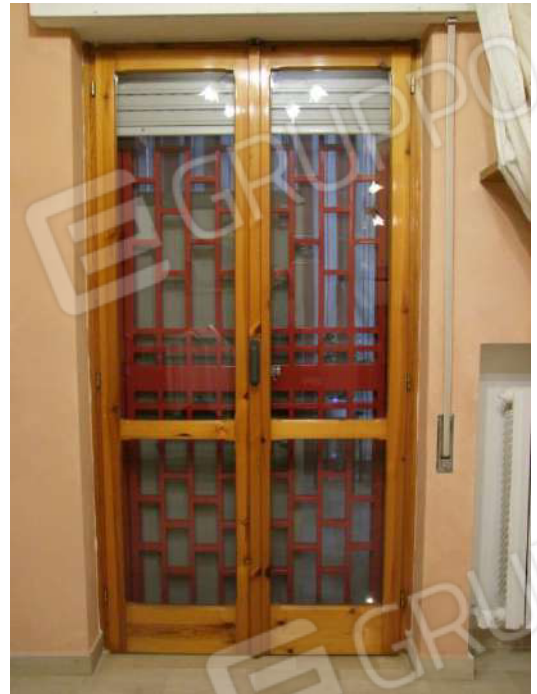
Foto 34 - Particolare infisso esterno