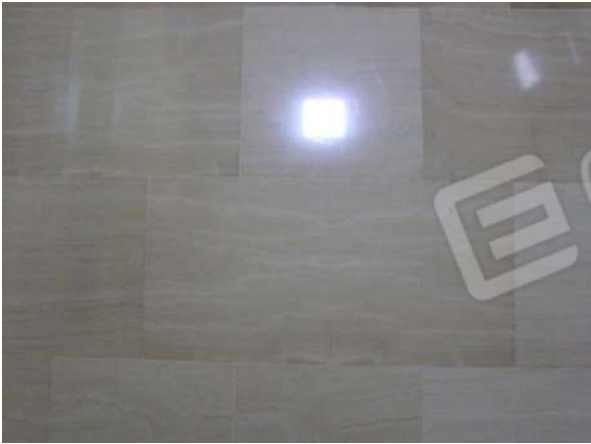
Foto 25 - Particolare pavimentazione interna all'appartamento