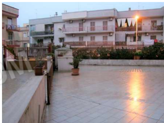
Foto 18 – Vista del cortile verso via G. Armellini e verso il vialetto d'accesso carrabile – Bene n.2