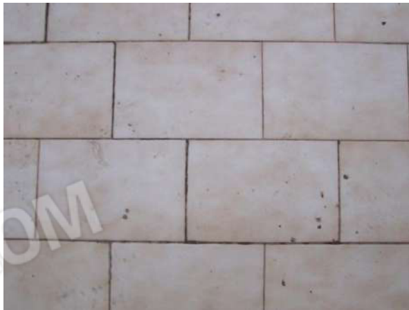
Foto 27 - Particolare pavimentazione balcone al prospetto laterale, cortile e area di corte