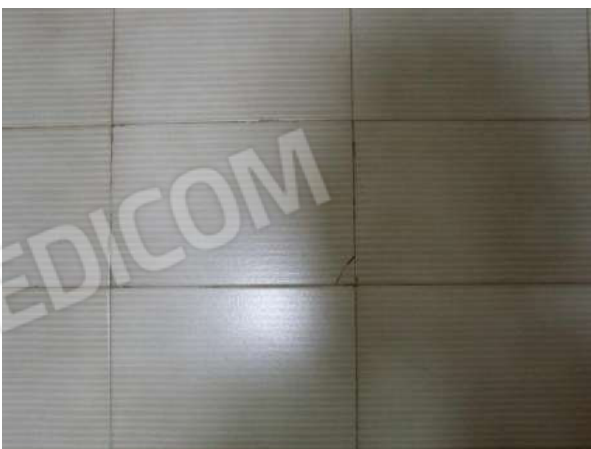
Foto 29 - Particolare pavimentazione bagno