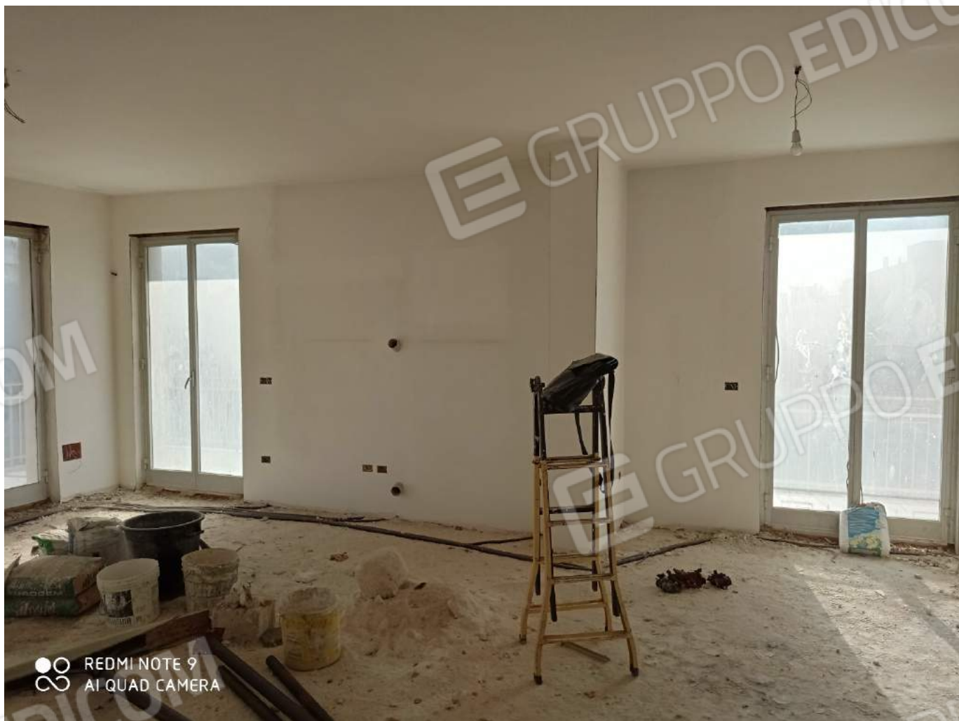
Lato salone su via Longo