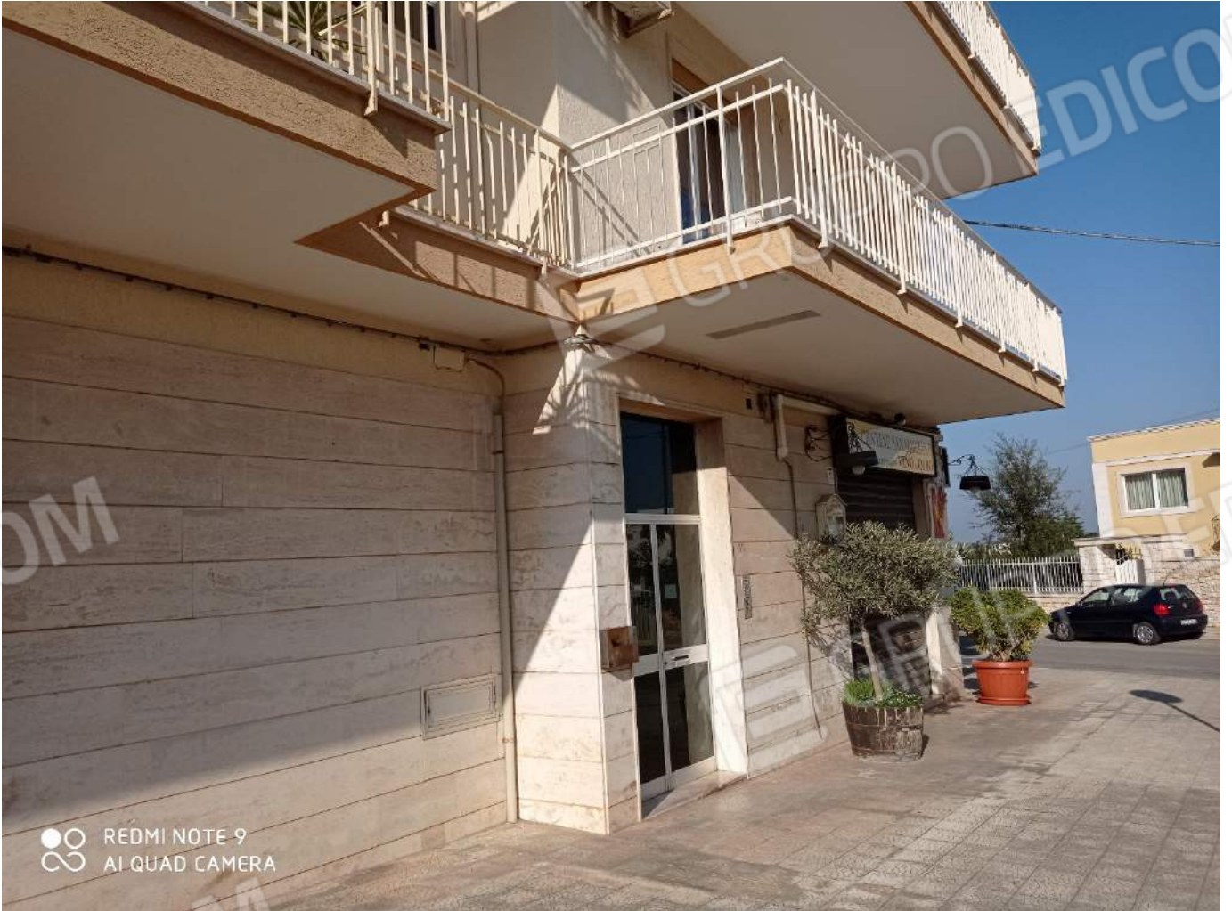
Dettaglio piano terra