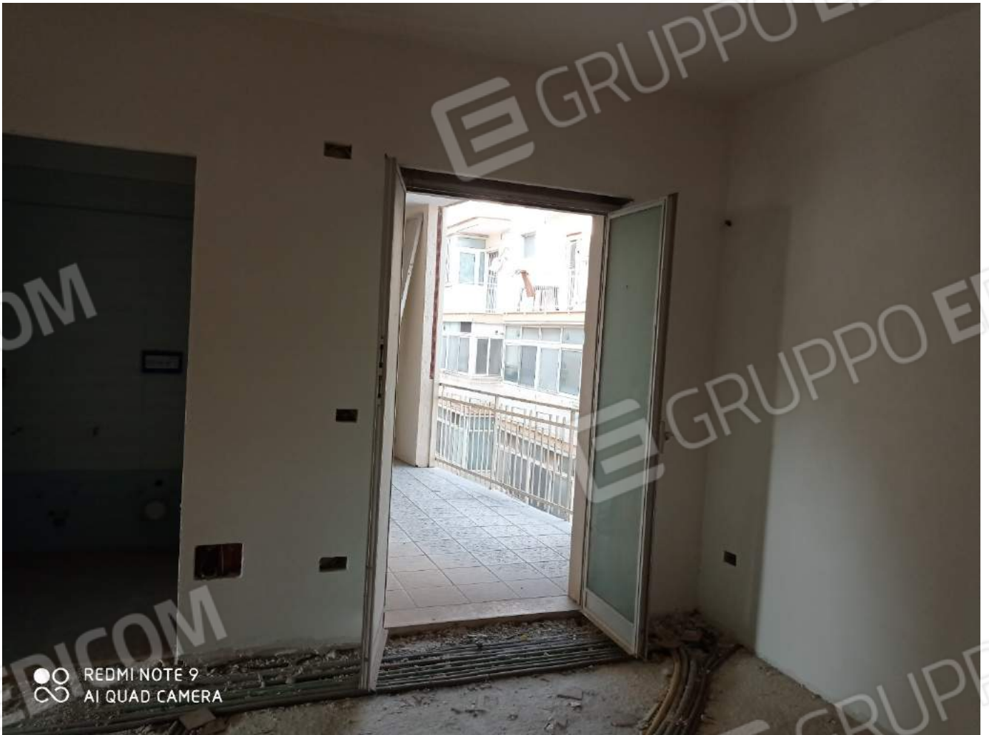
Accesso balcone interno da cucina