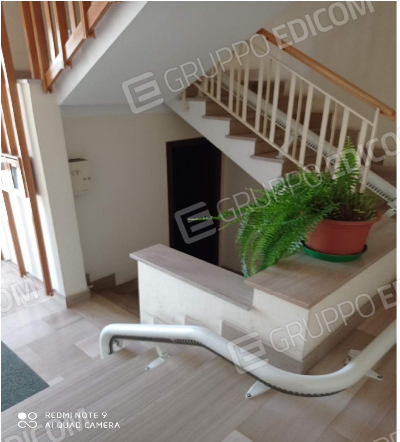
Accesso locali deposito