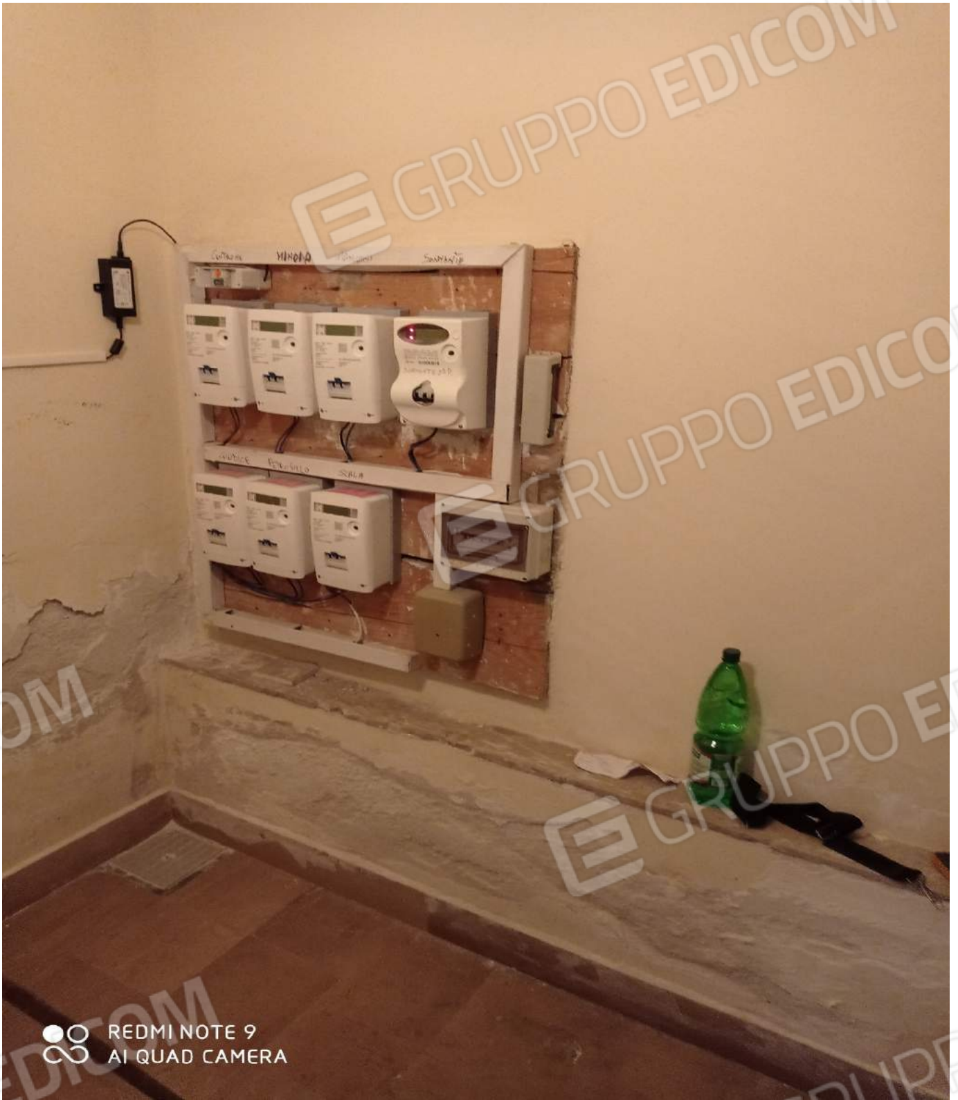
Dettaglio contatori Enel