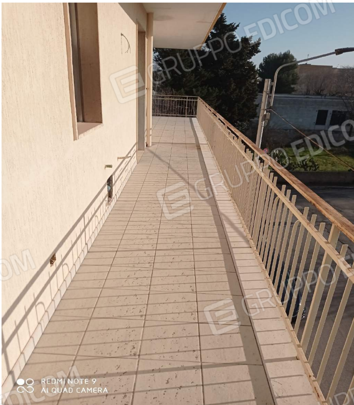
Balcone angolare via Europa – via Longo