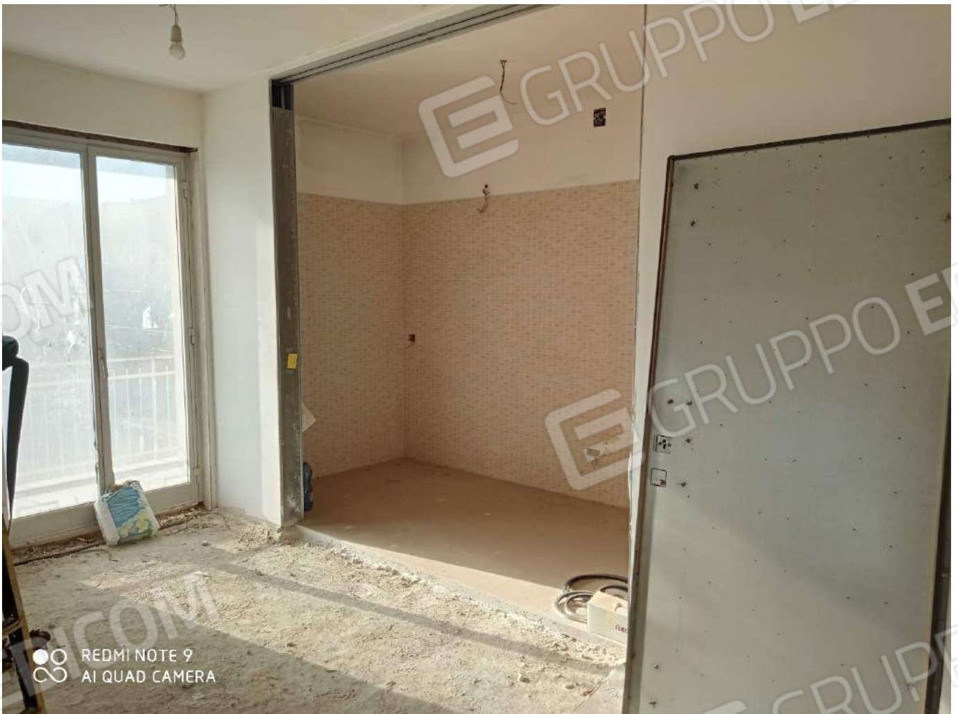
Dettaglio vano ricavato