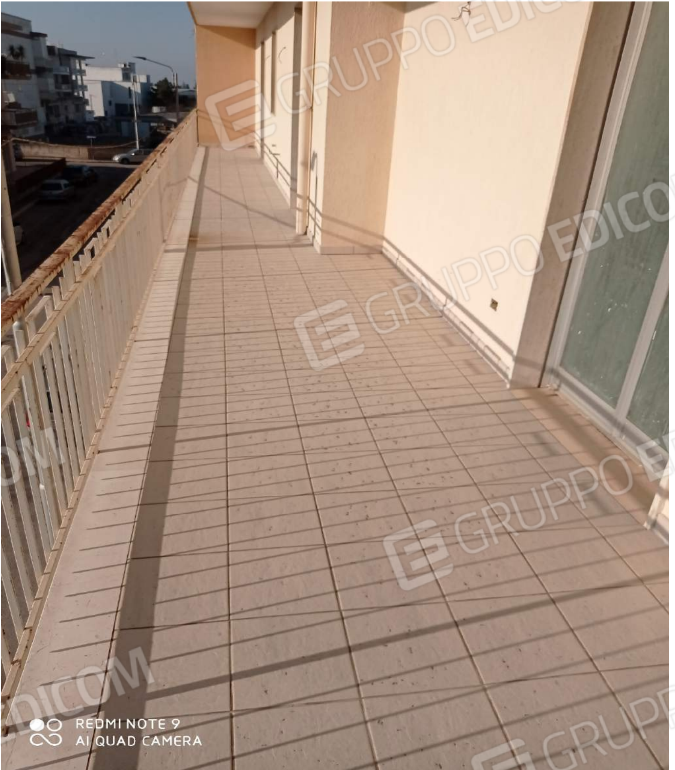
Altra vista balcone angolare via Longo