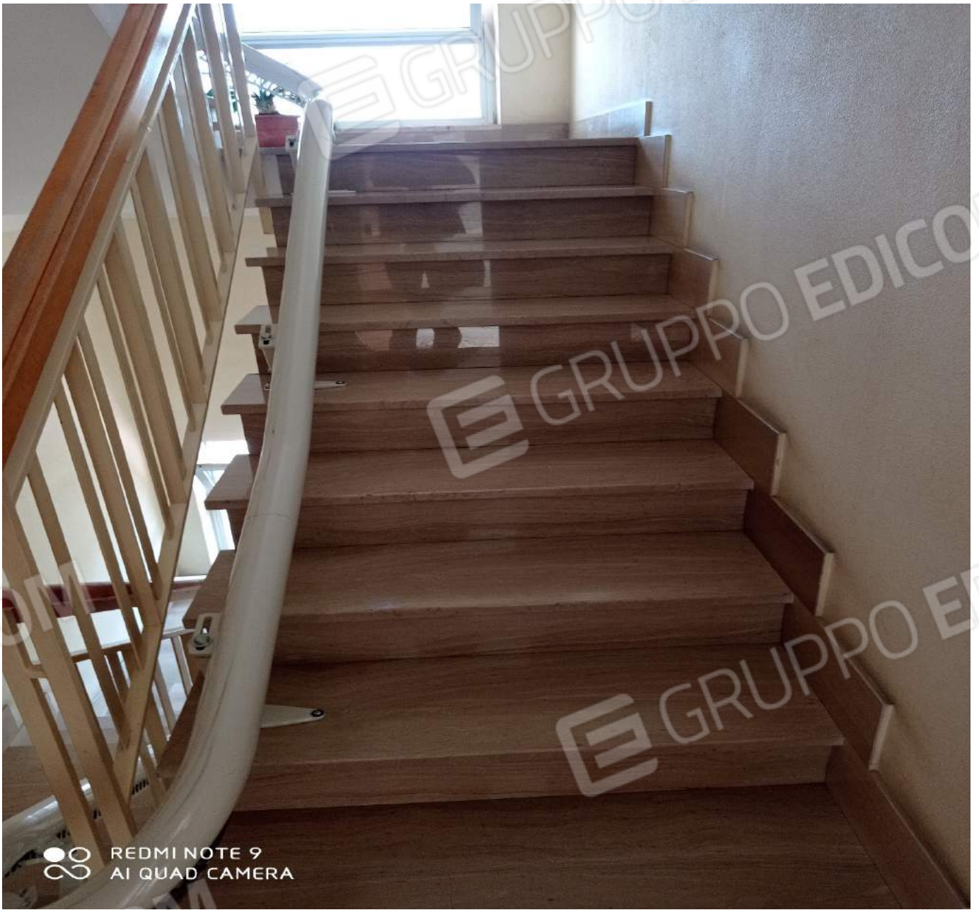
Dettaglio rampa scale