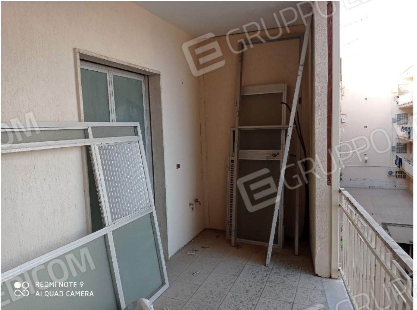
Dettaglio accesso vano letto