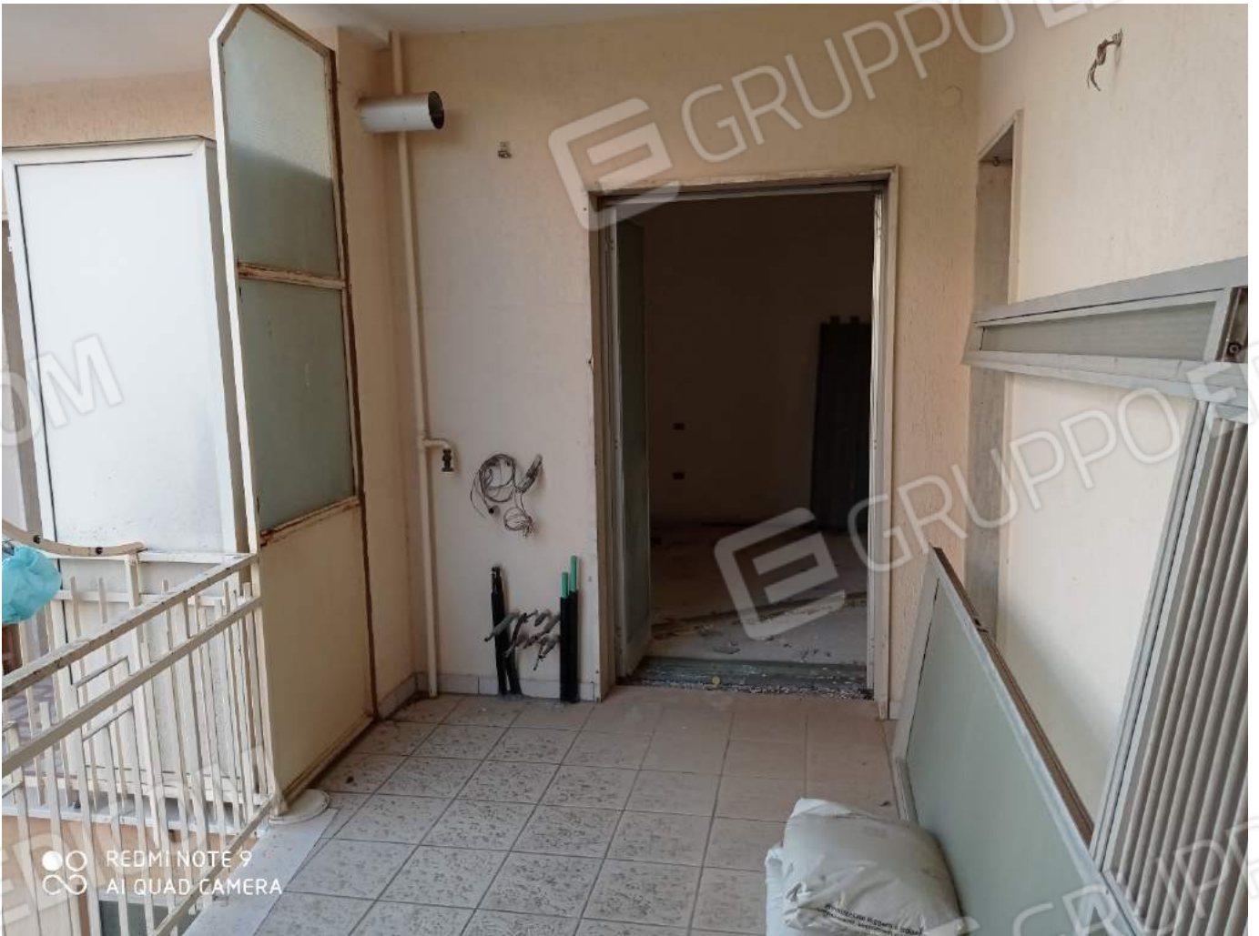
Confine altro appartamento