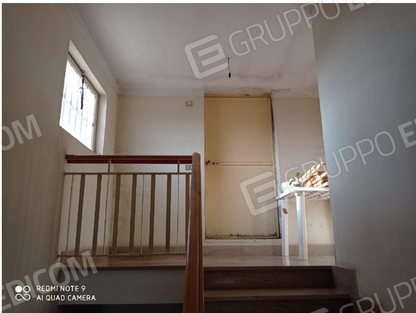
Accesso lastrico solare