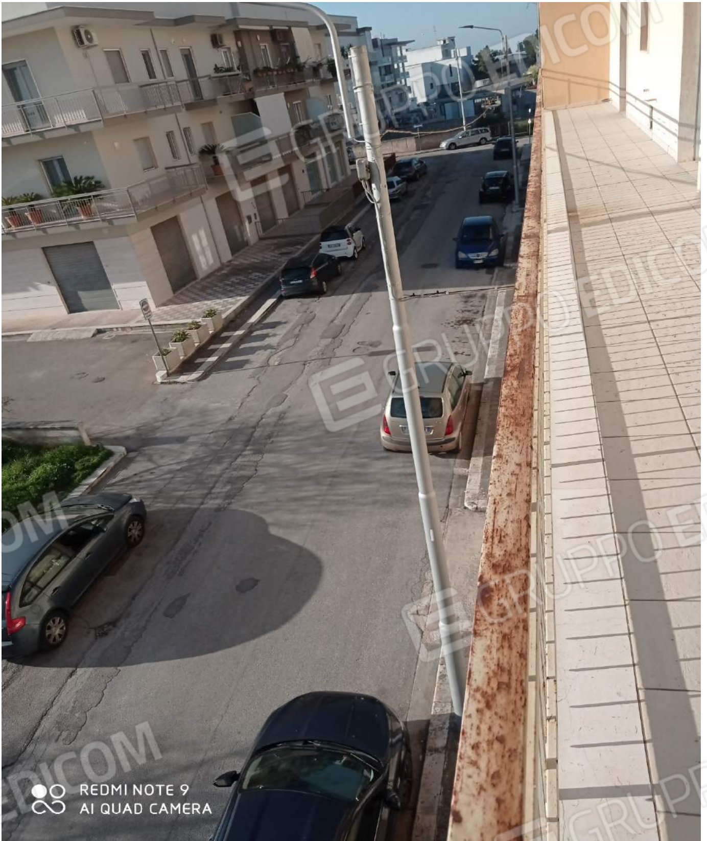
Vista su via Longo