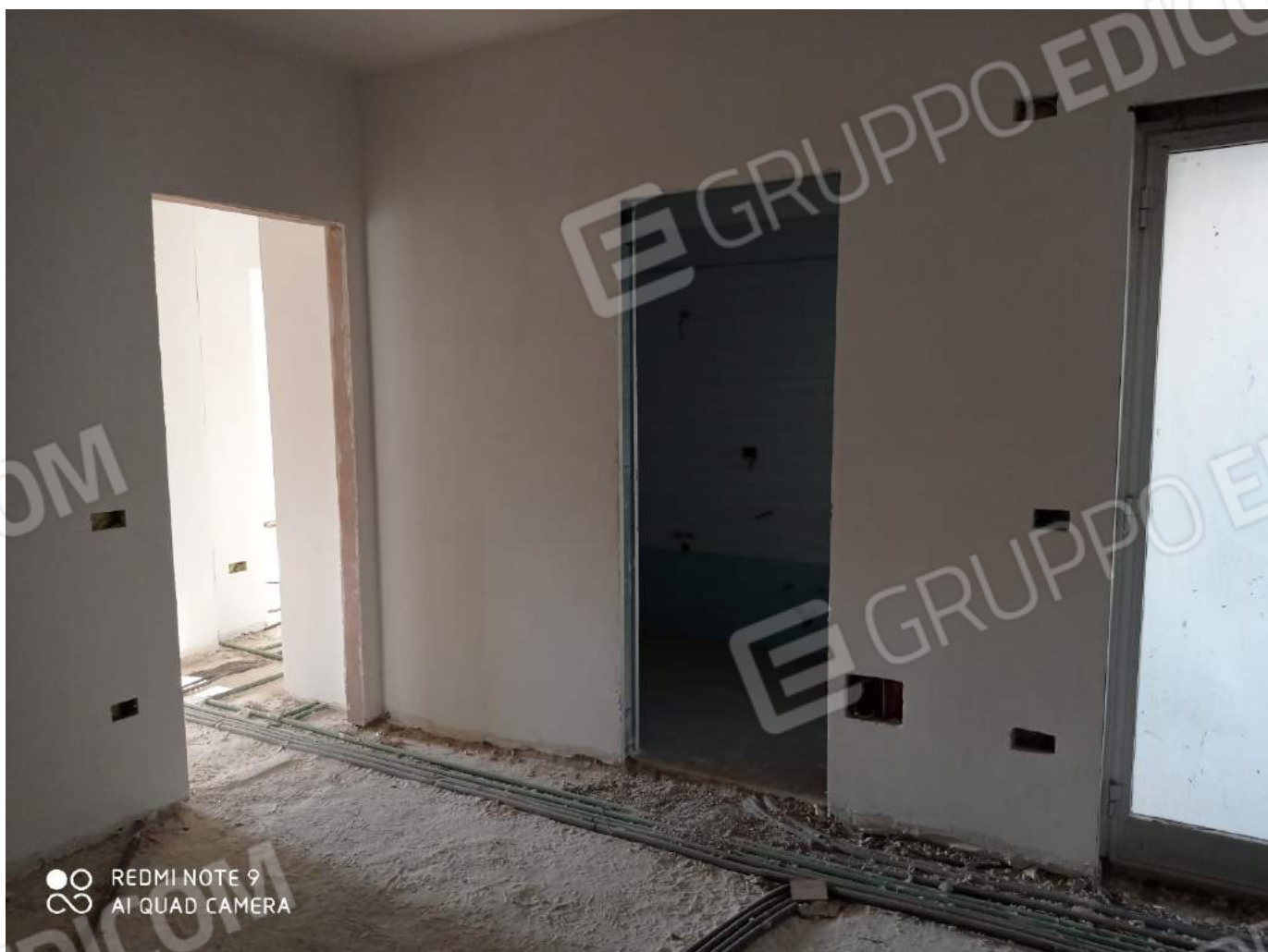
Dettaglio corridoio con ingresso bagno