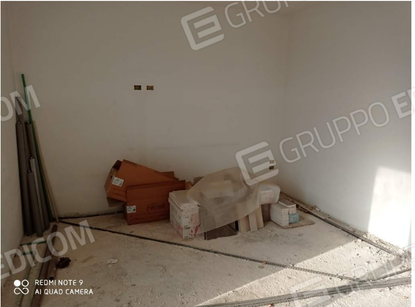
Dettaglio parete vano letto