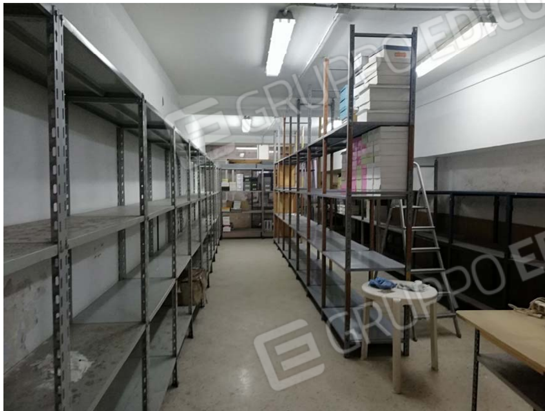
Vano deposito interrato