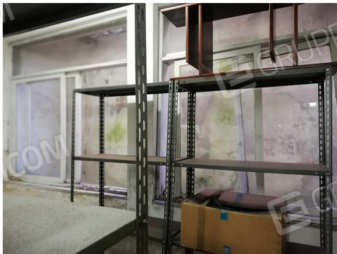
Zona intercapedine (via Manzoni)