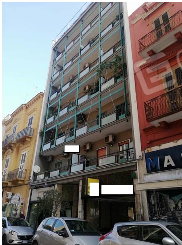
Prospetto dello stabile