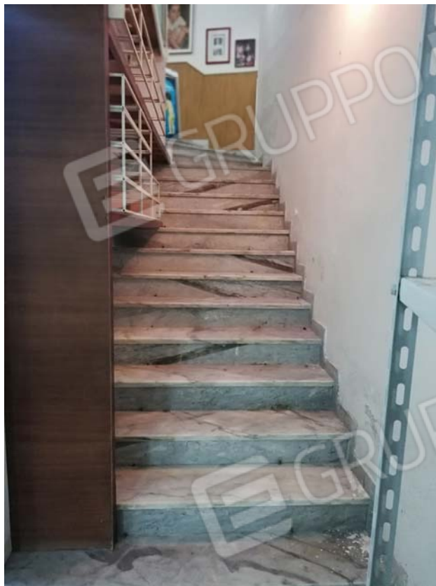
Scala di accesso all'interrato