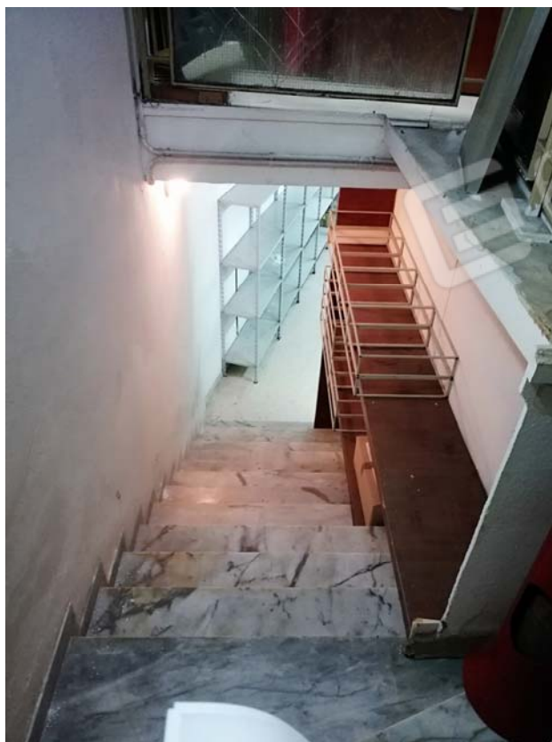
Scala di accesso all'interrato