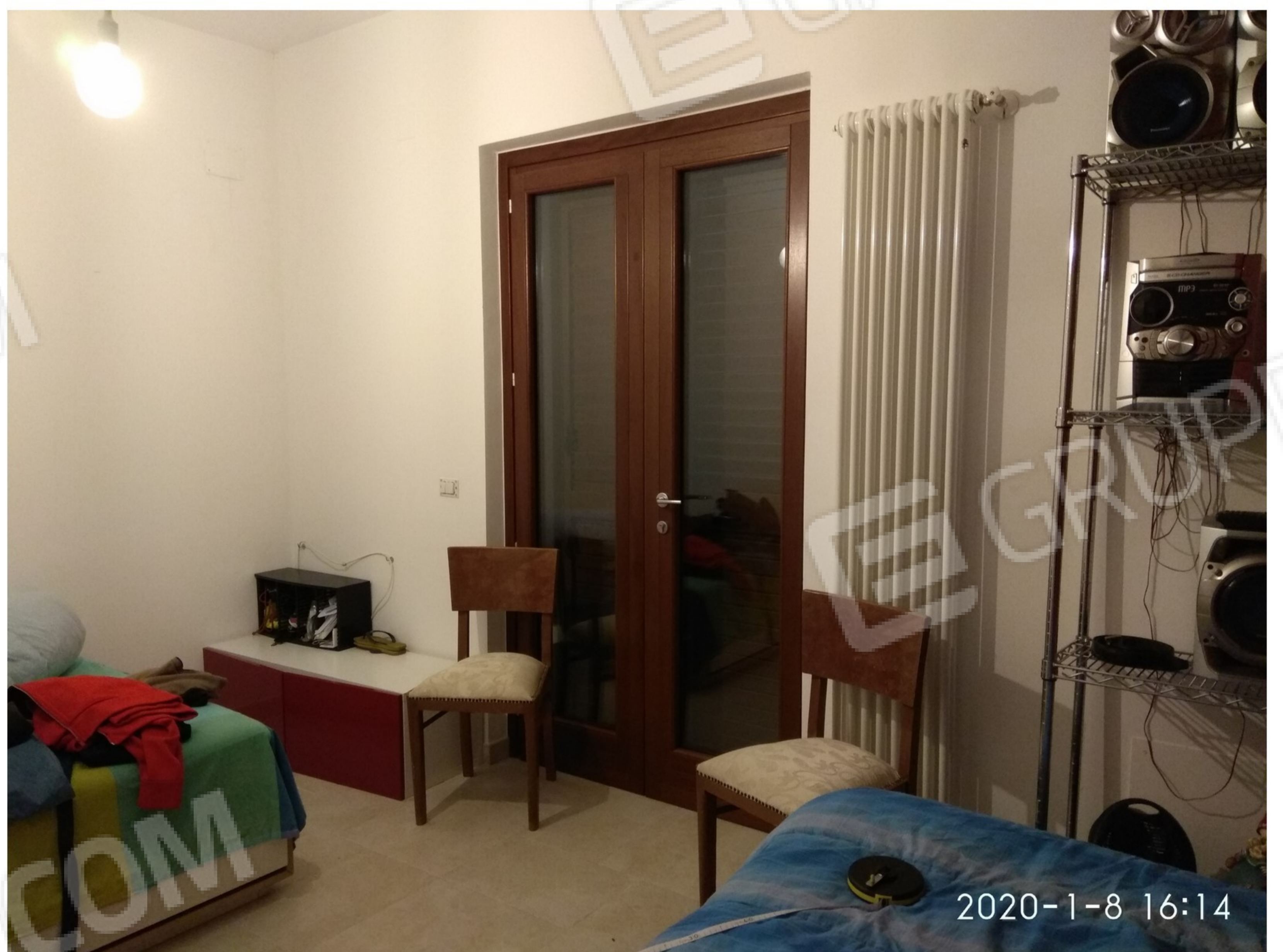
Foto n. 08 - stanza 1 piano interrato