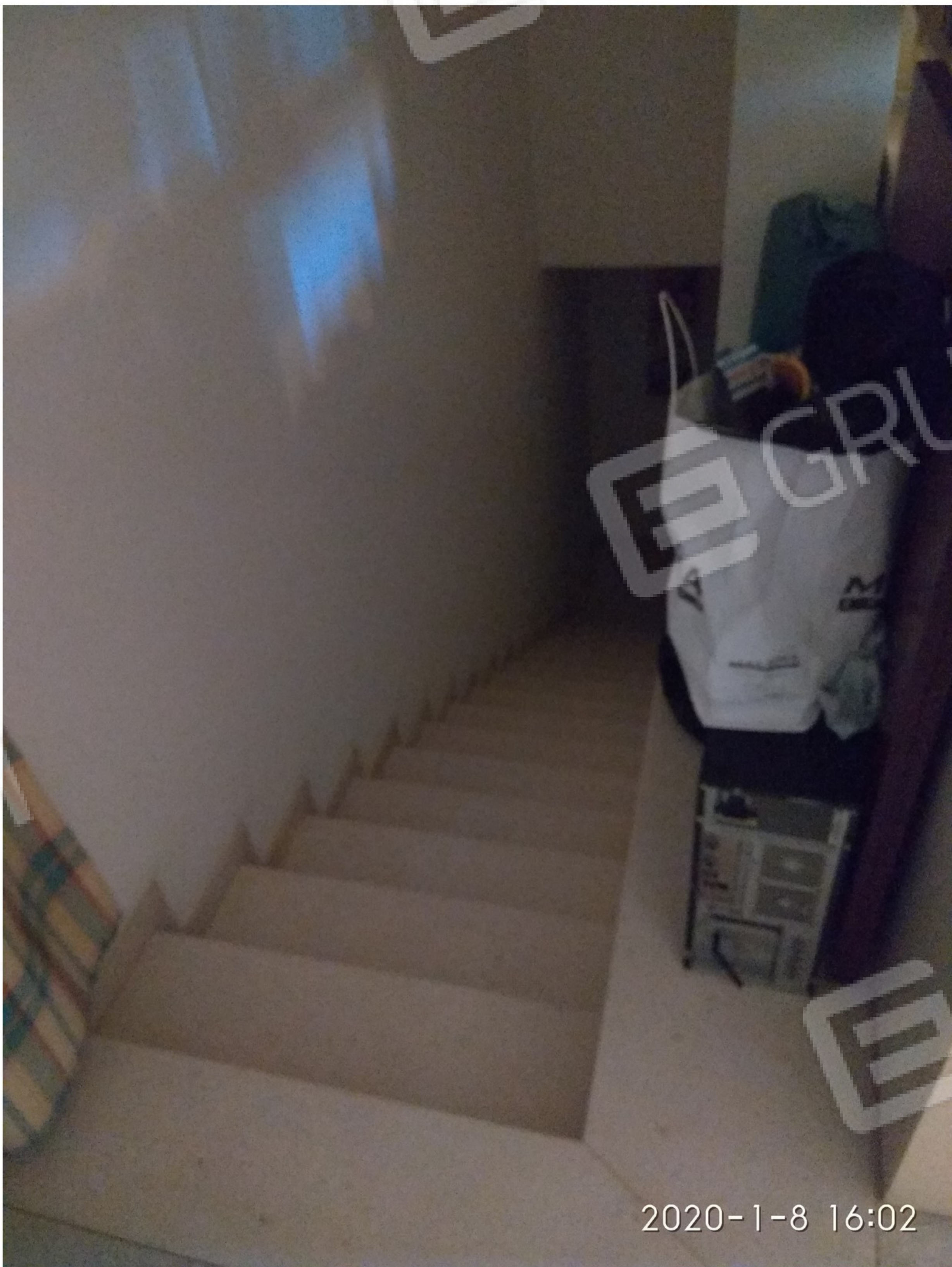
Foto n. 07 - vano scala