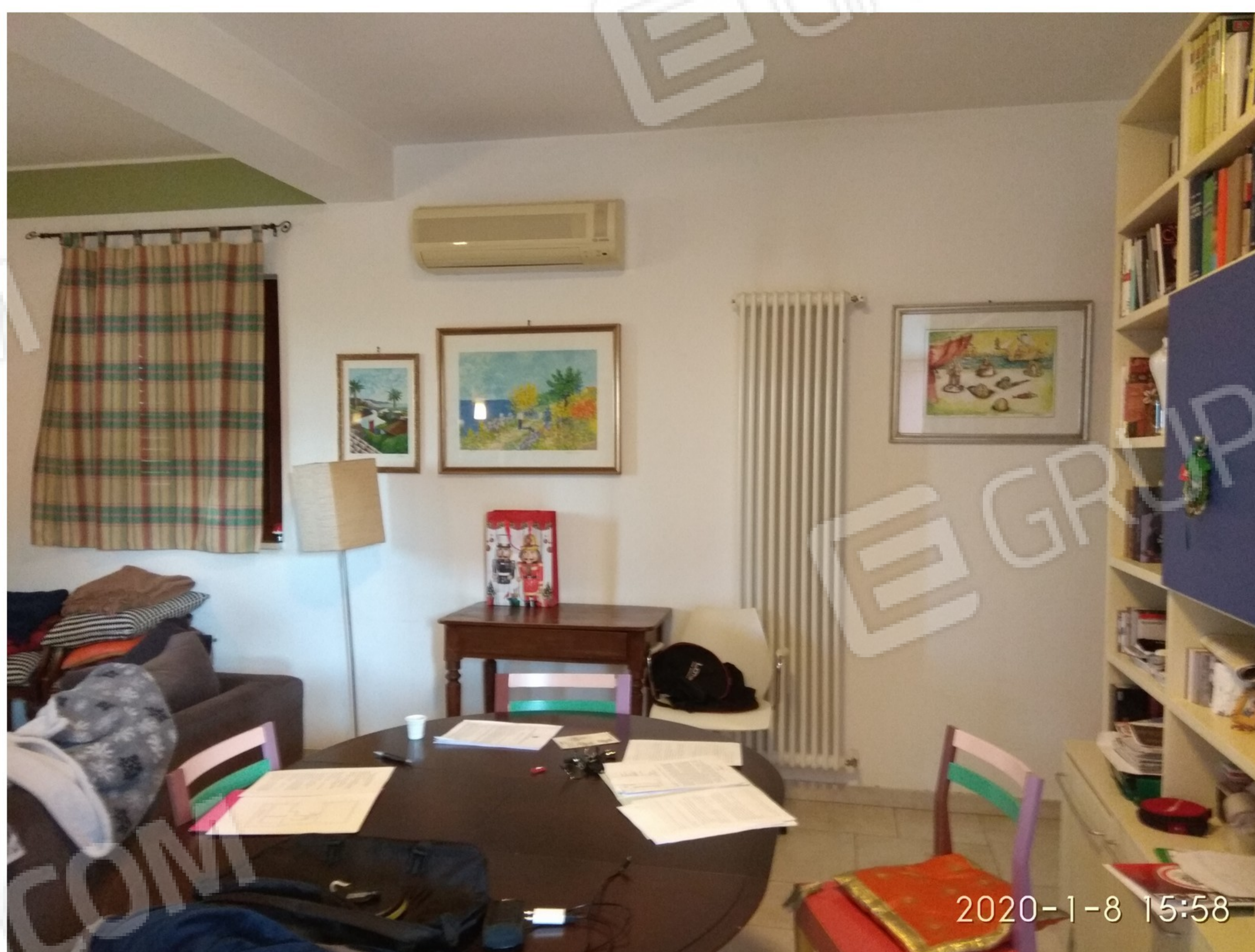
Foto n. 04 - monolocale residenziale