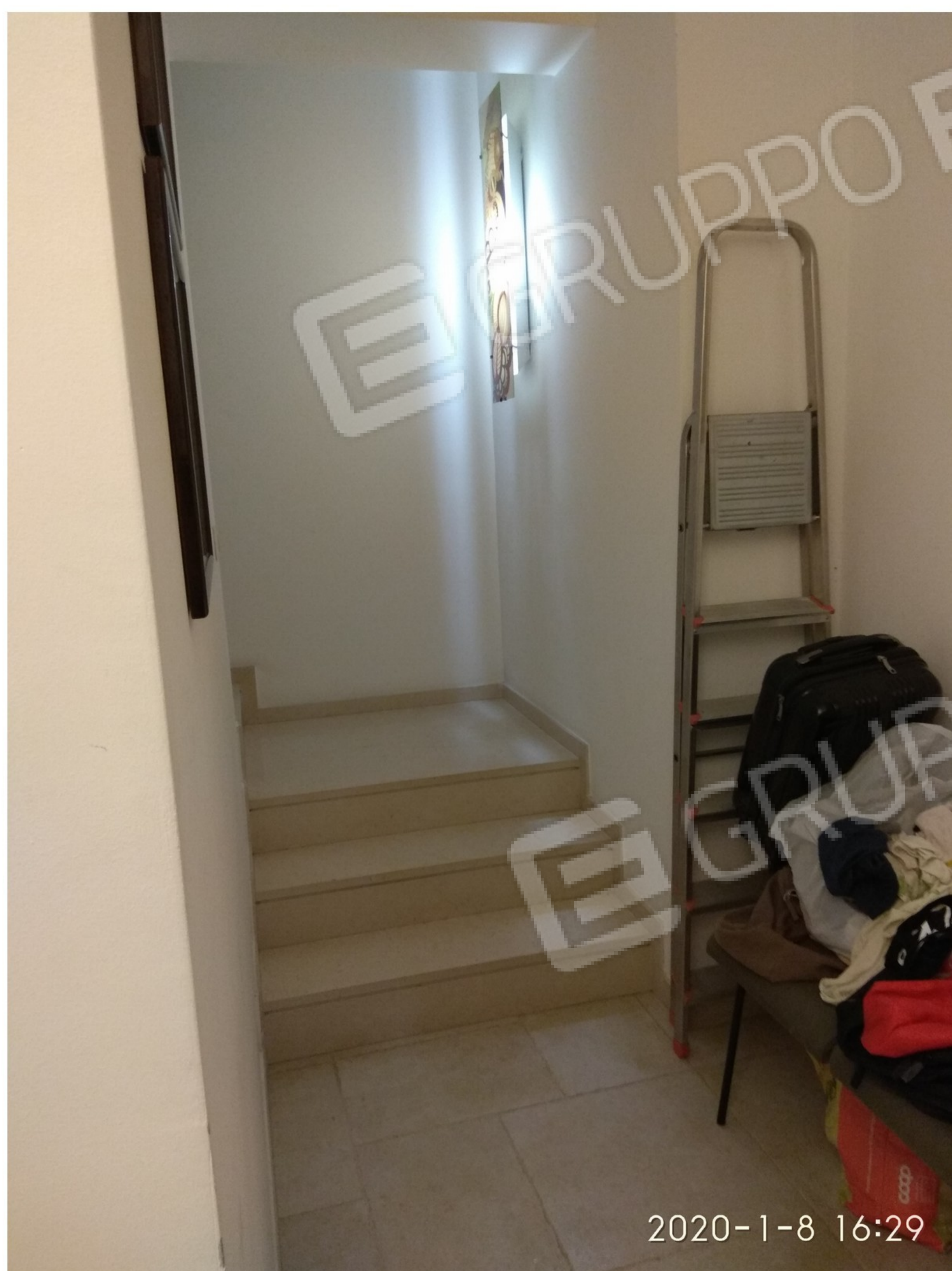
Foto n. 10 - disimpegno piano interrato