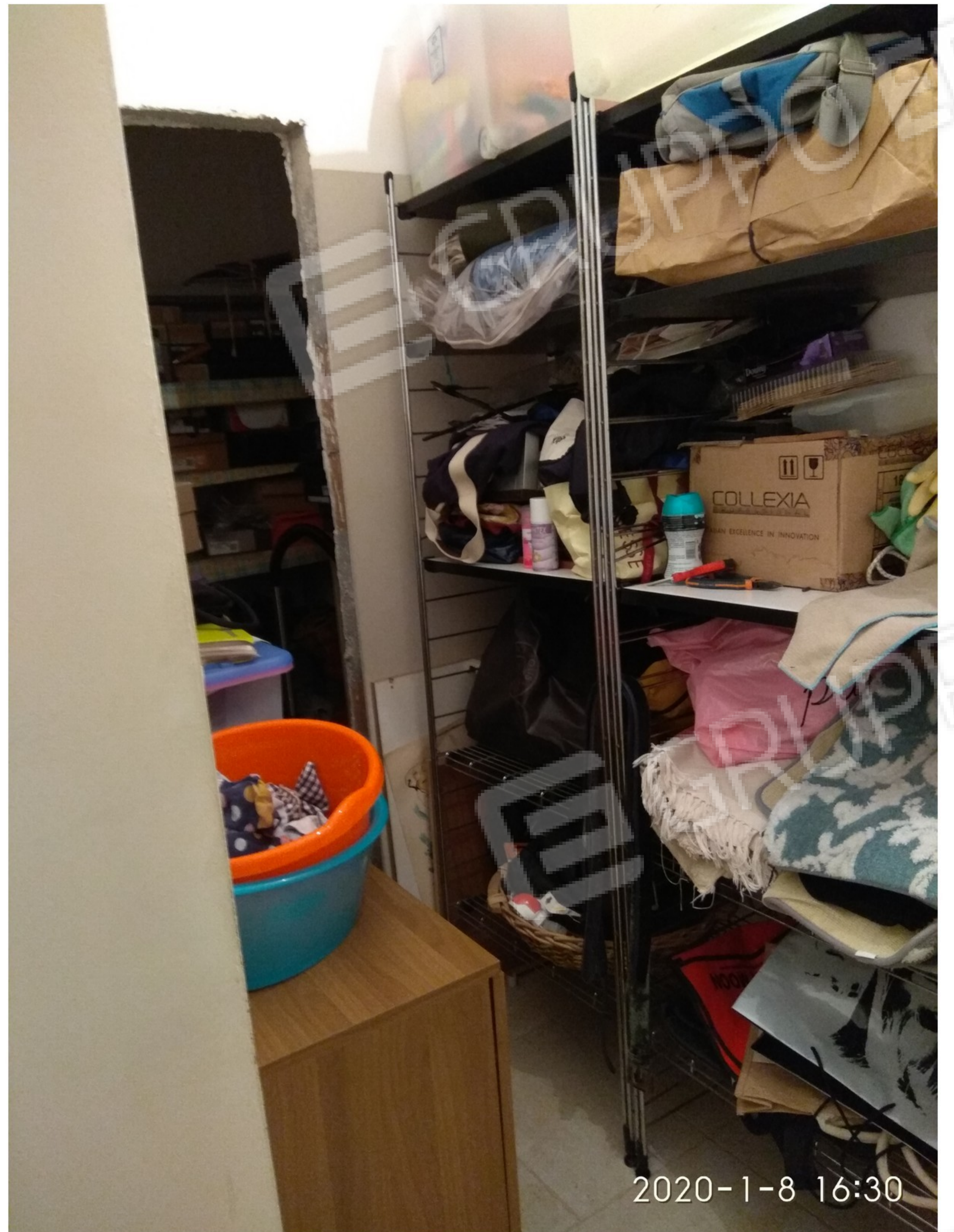
Foto n. 12 - ripostiglio piano interrato