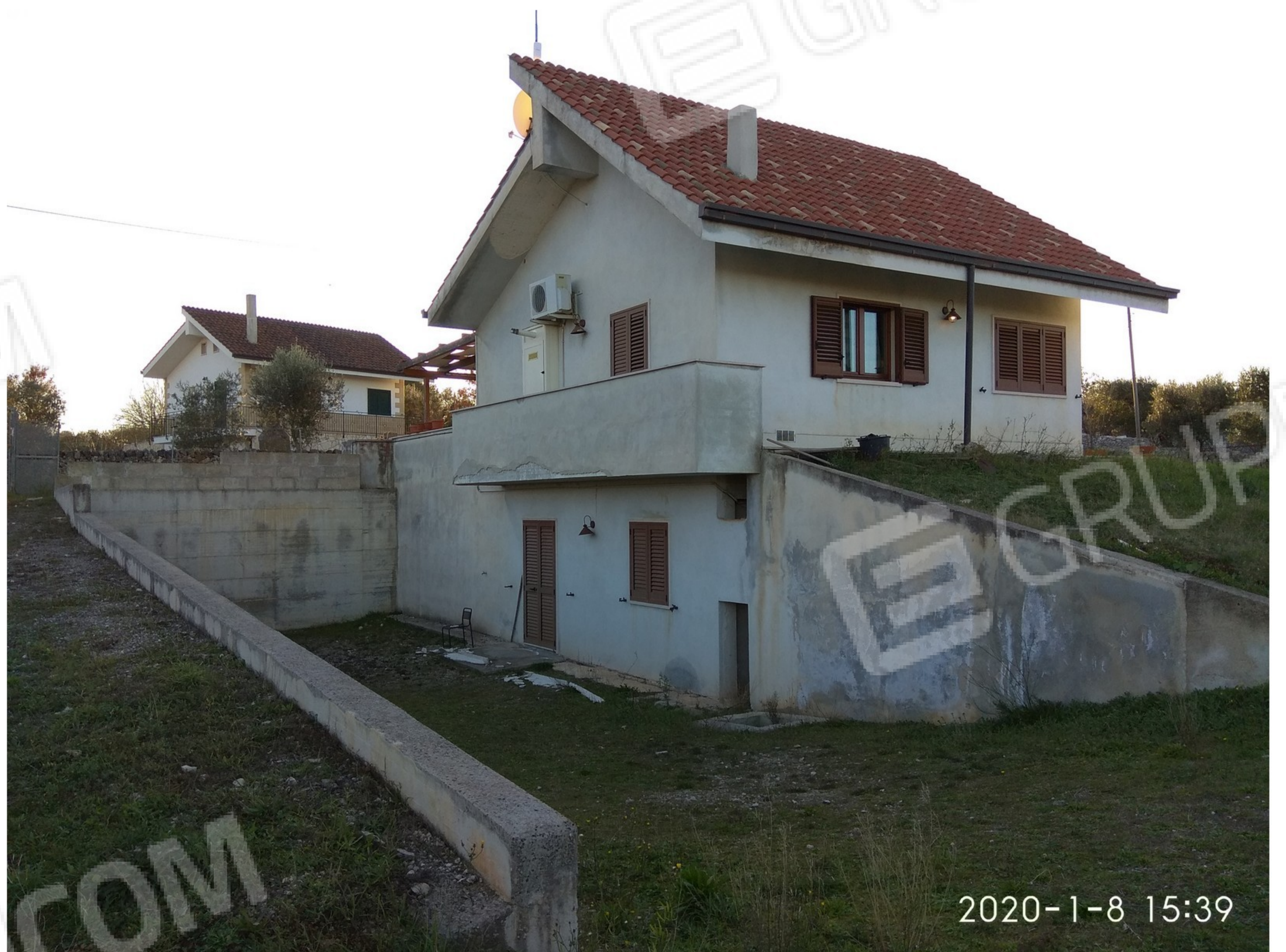
Foto n. 02 - prospetto nord-est