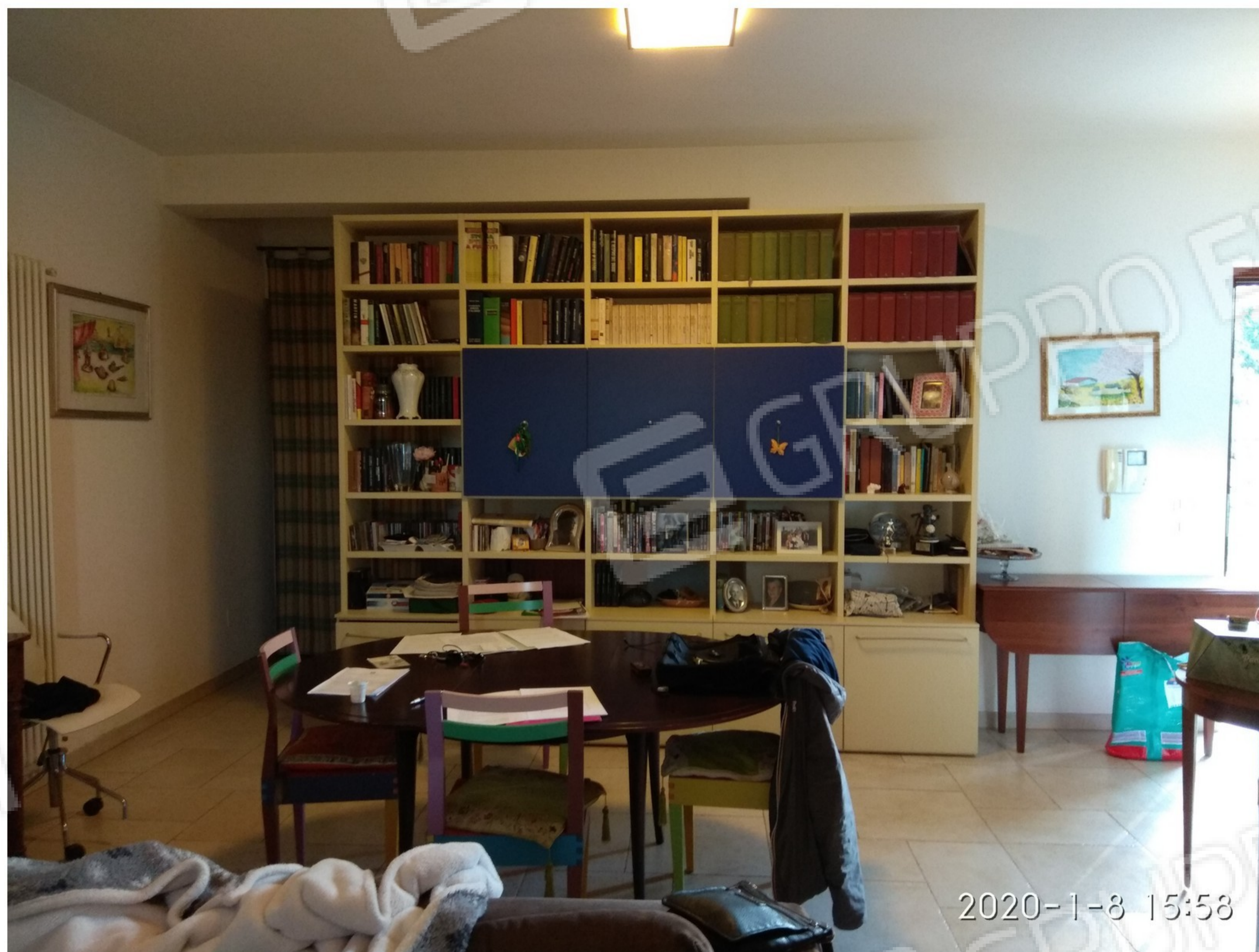
Foto n. 03 - monolocale residenziale