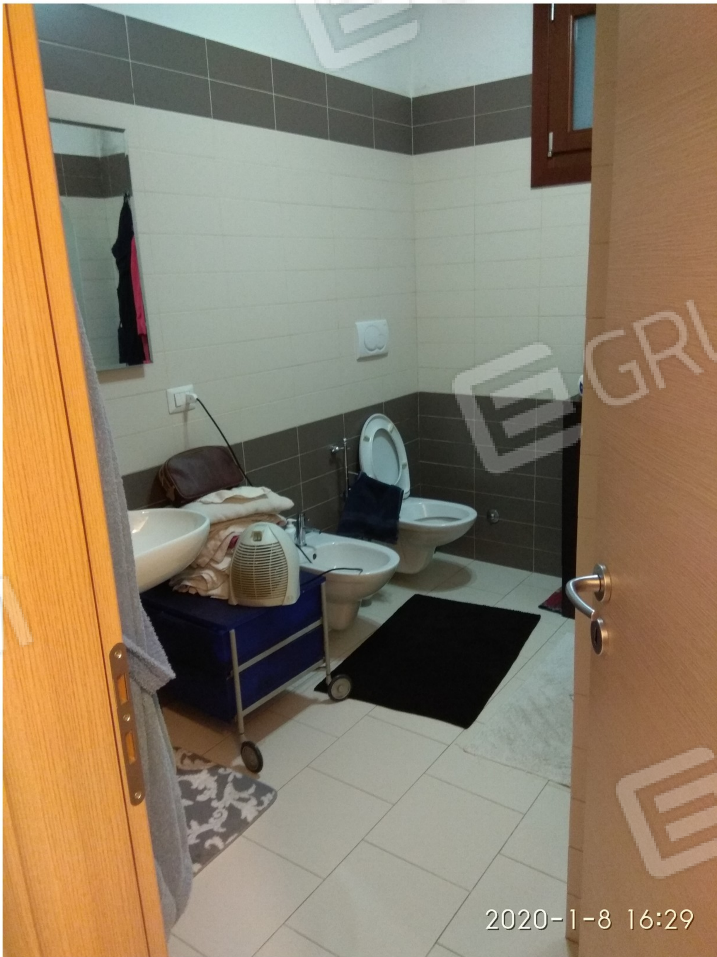
Foto 11 - wc piano interrato