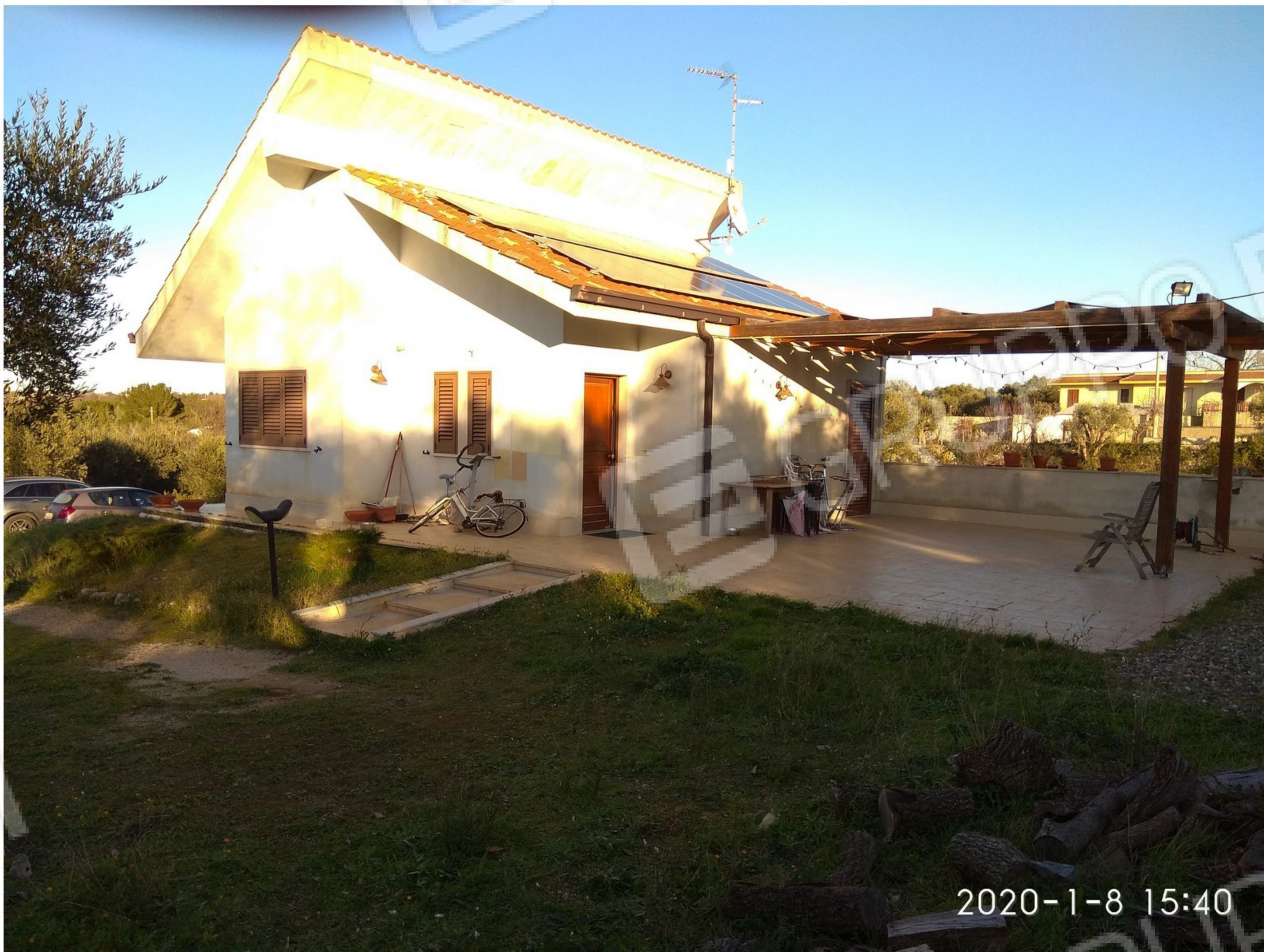
Foto n. 01 - prospetto sud-ovest