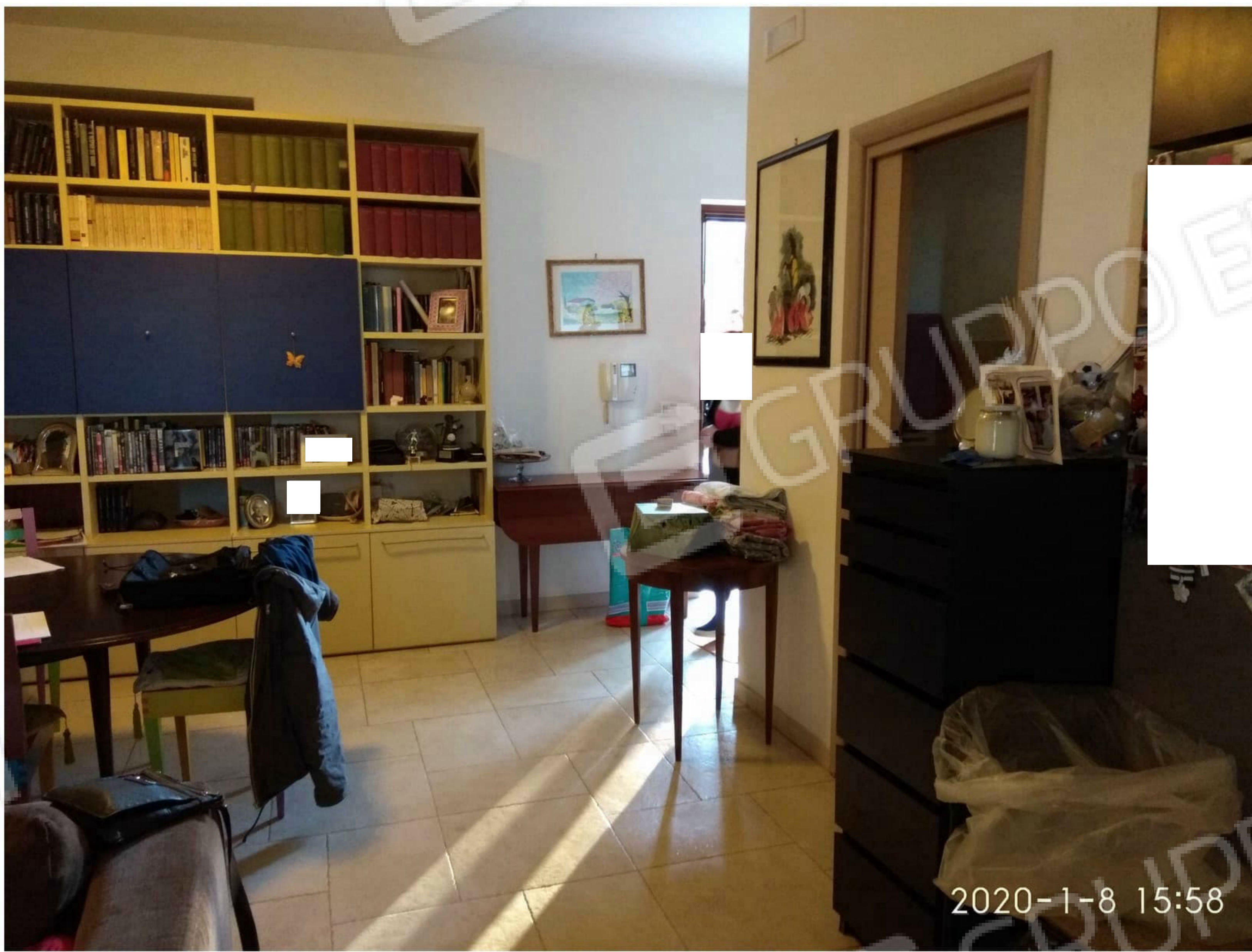
Foto n. 05 - monolocale residenziale