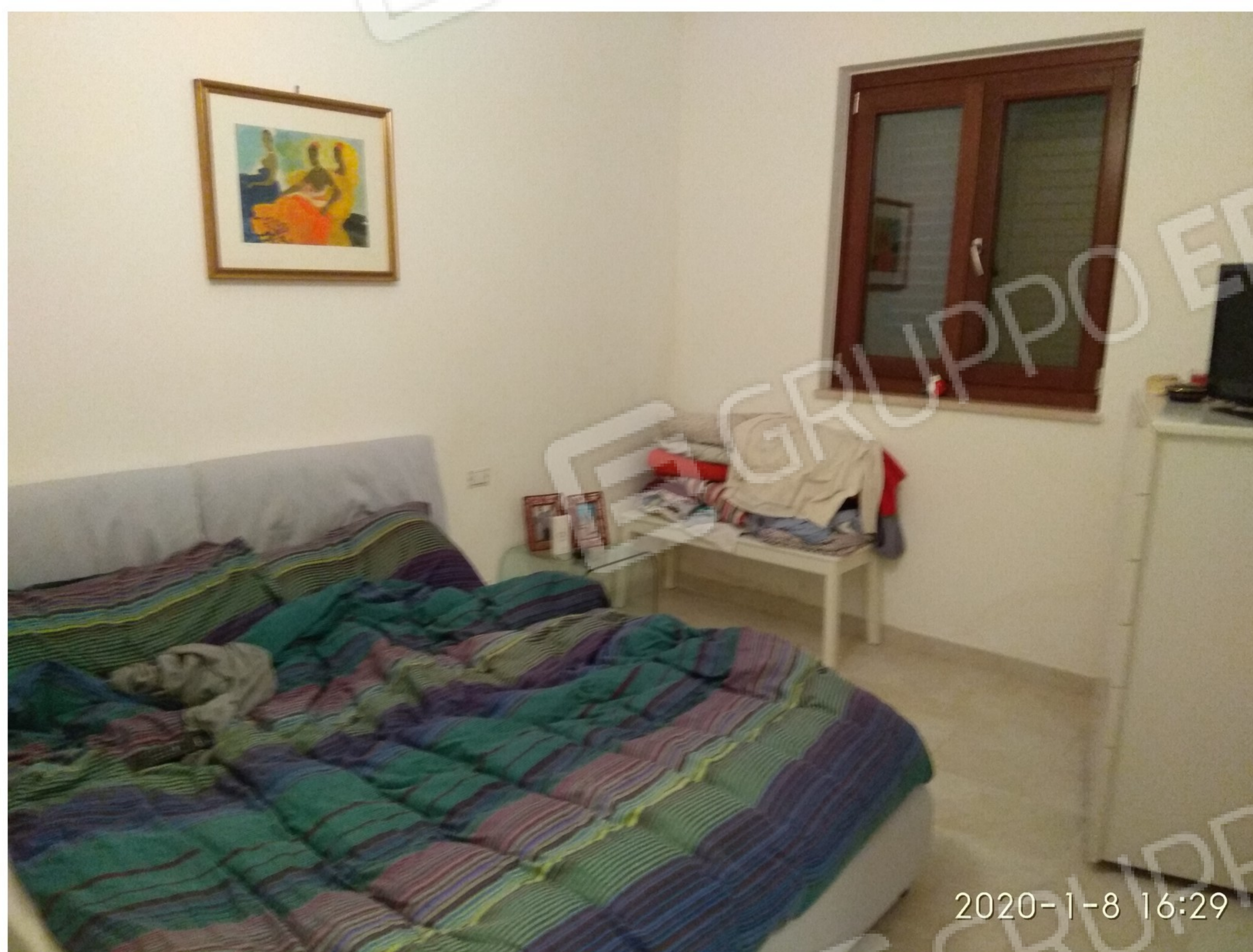
Foto n. 09 -stanza 2 piano interrato