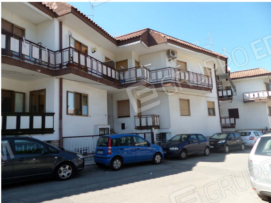
FOTO N°1: Prospetto principale dell'edificio condominiale su Via della Repubblica.