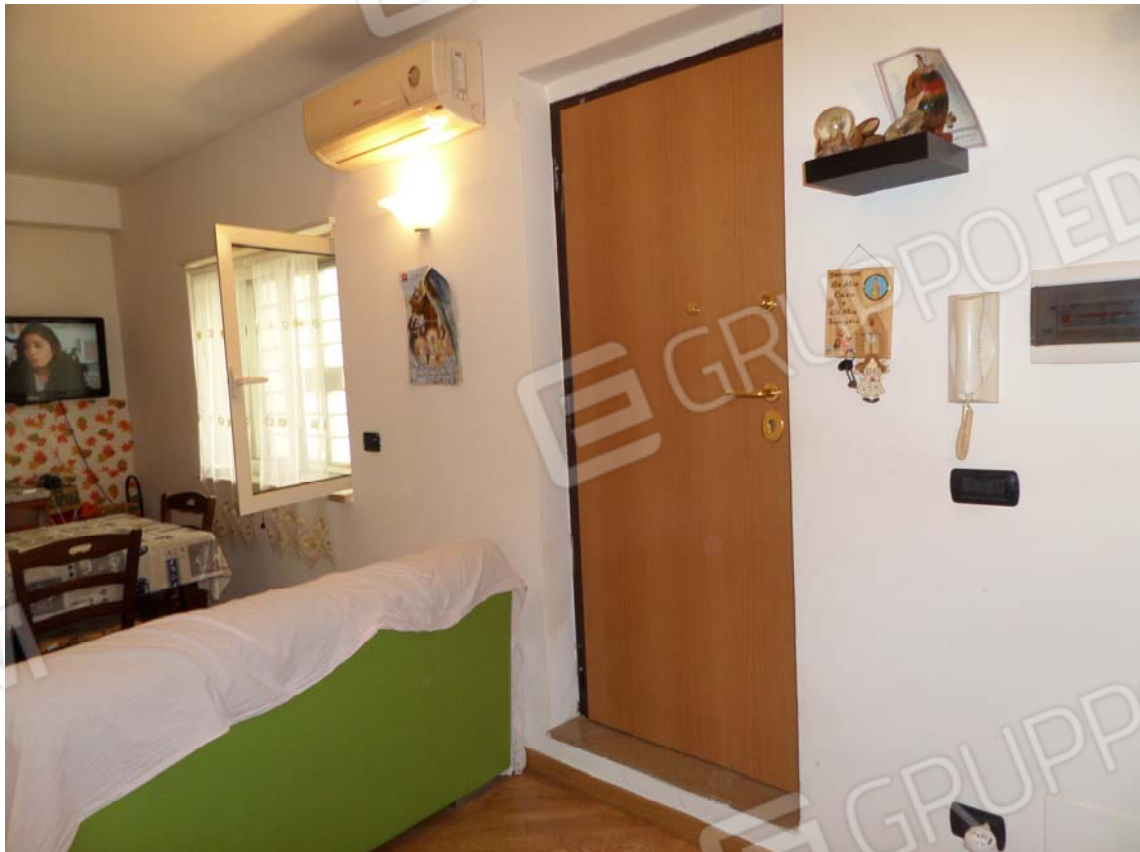
FOTO N°5: Zona ingresso all'appartamento oggetto di Procedura Esecutiva.