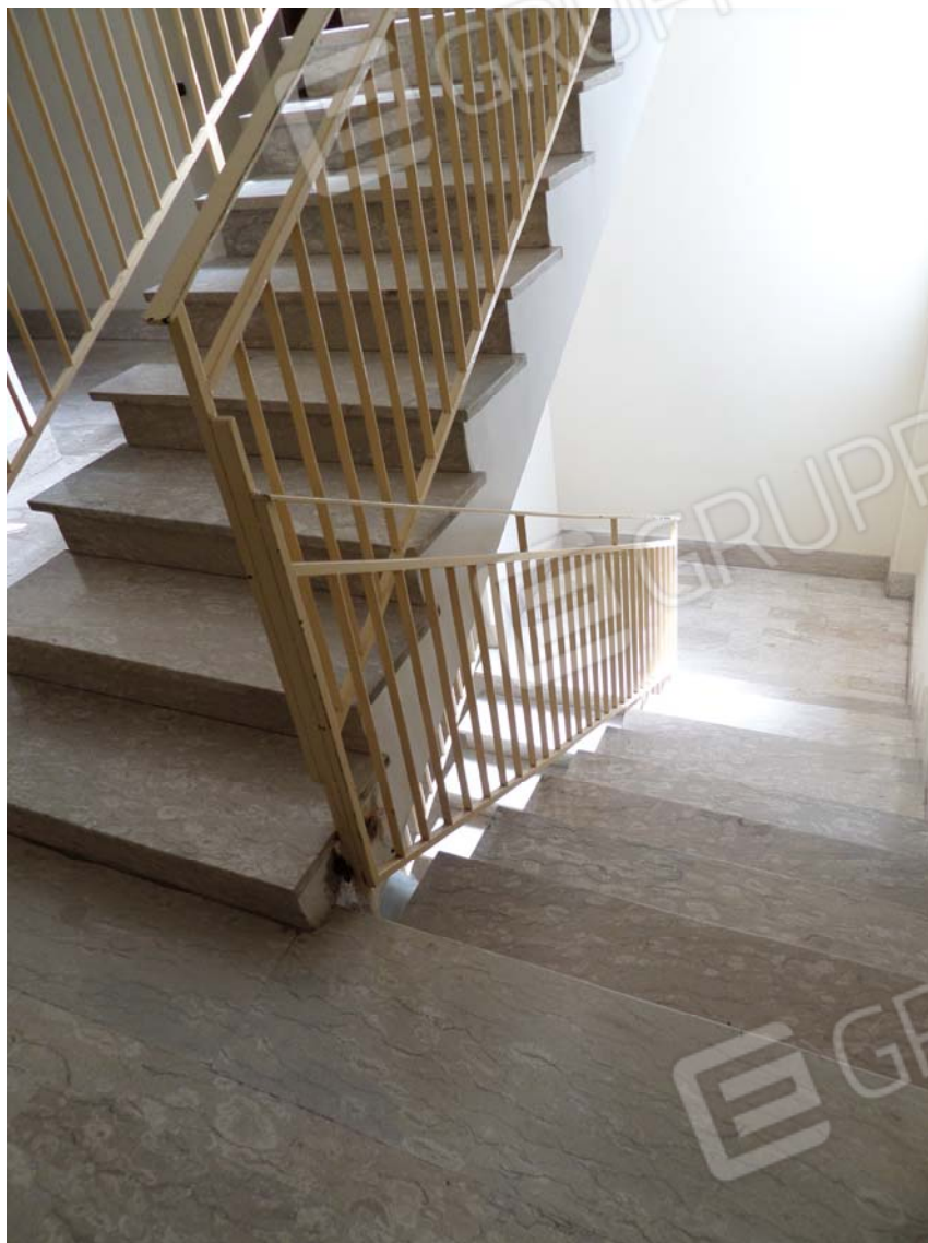
FOTO N°3: Scala comune, di distribuzione ai piani della palazzina n°5.