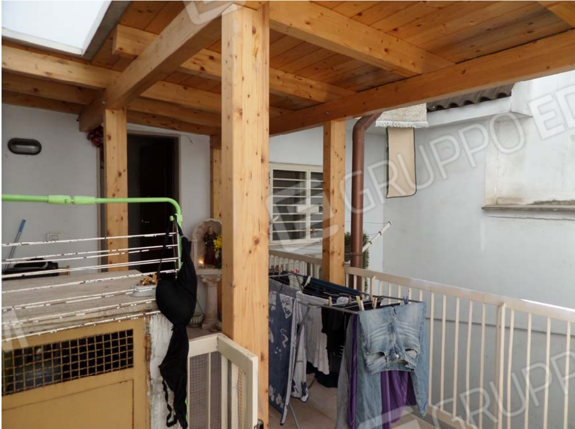
FOTO N°11: Particolare dell'attrezzamento ligneo di copertura del terrazzino esterno pertinenziale.