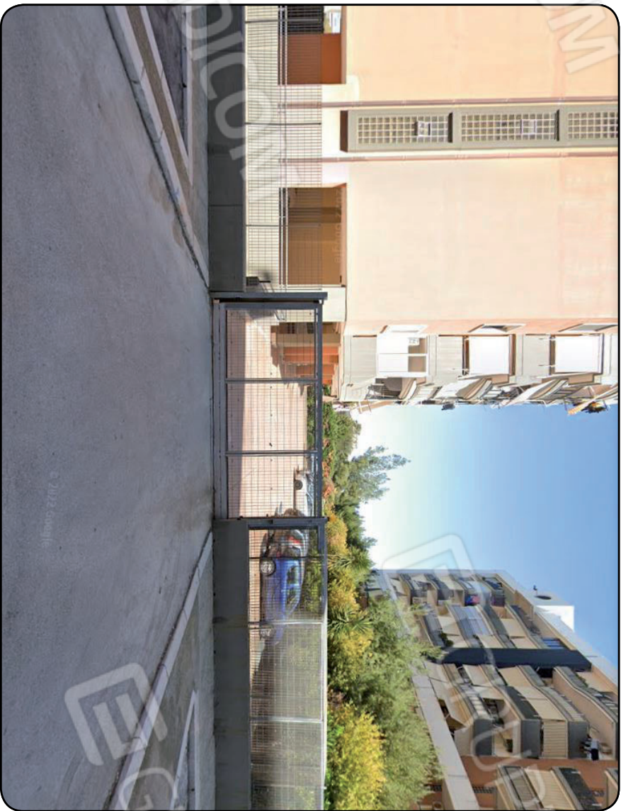
Foto 2: Cancelli scorrevole per l'ingresso carrabile ai posti auto al piano terra su via Nicola Rotondo civ. 5