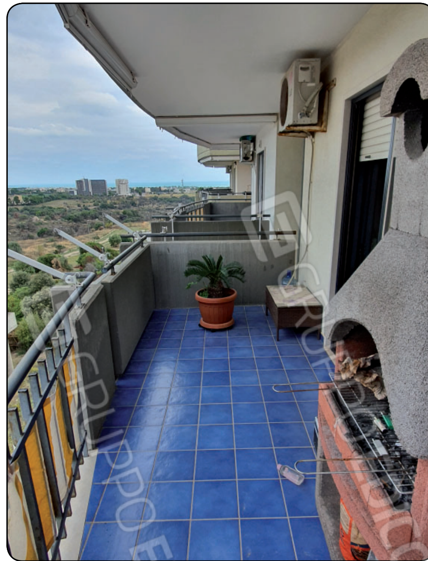
Foto 11- ABITAZIONE: Balcone orientato verso est, prospiciente via Cardinale Giuseppe