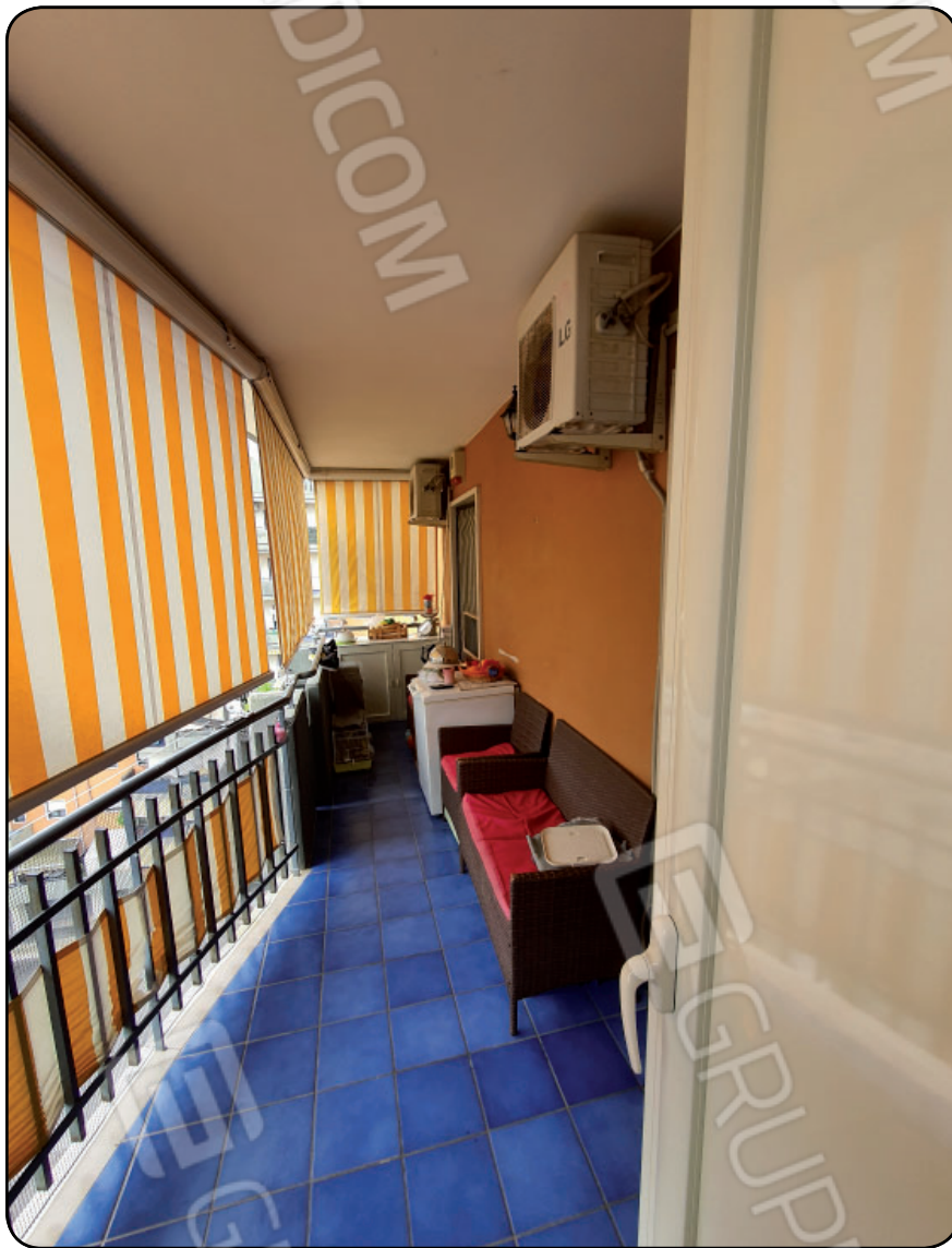
Foto 12- ABITAZIONE: Balcone orientato verso ovest, prospiciente il cortile interno condominiale