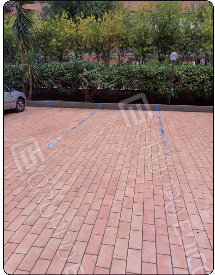
Foto 15: POSTO AUTO SCOPERTO al piano terra con accesso da Via Nicola Rotondo civ.5