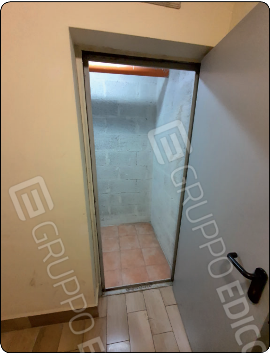
Foto 13: Ingresso al corridoio comune di accesso alla cantinola pertinenziale del piano interrato