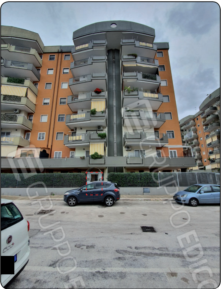
Foto 1: Fabbricato in Bari, via Giuseppe Cardinale con indicazione dell'ingresso pedonale ubicato al civico 3