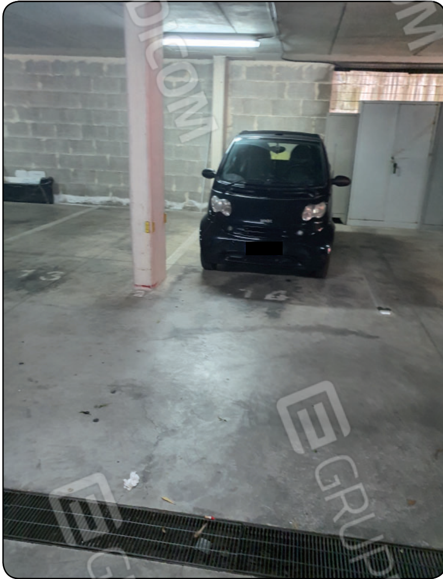
Foto 16: POSTO AUTO COPERTO al piano interrato con accesso dalla rampa su via Giuseppe Cardinale civ.1