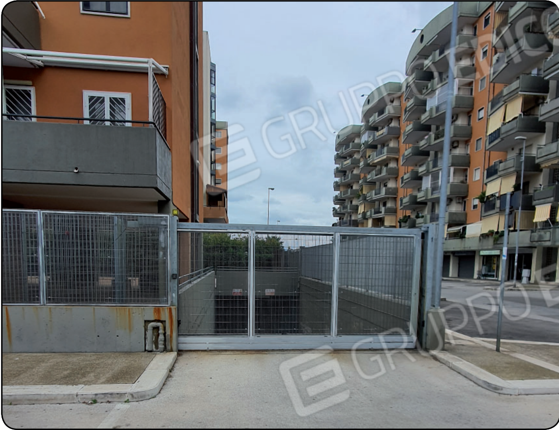
Foto 3: Ingresso carrabile su via Giuseppe Cardinale civ.1 alla rampa di accesso all'autorimessa ubicata al piano interrato