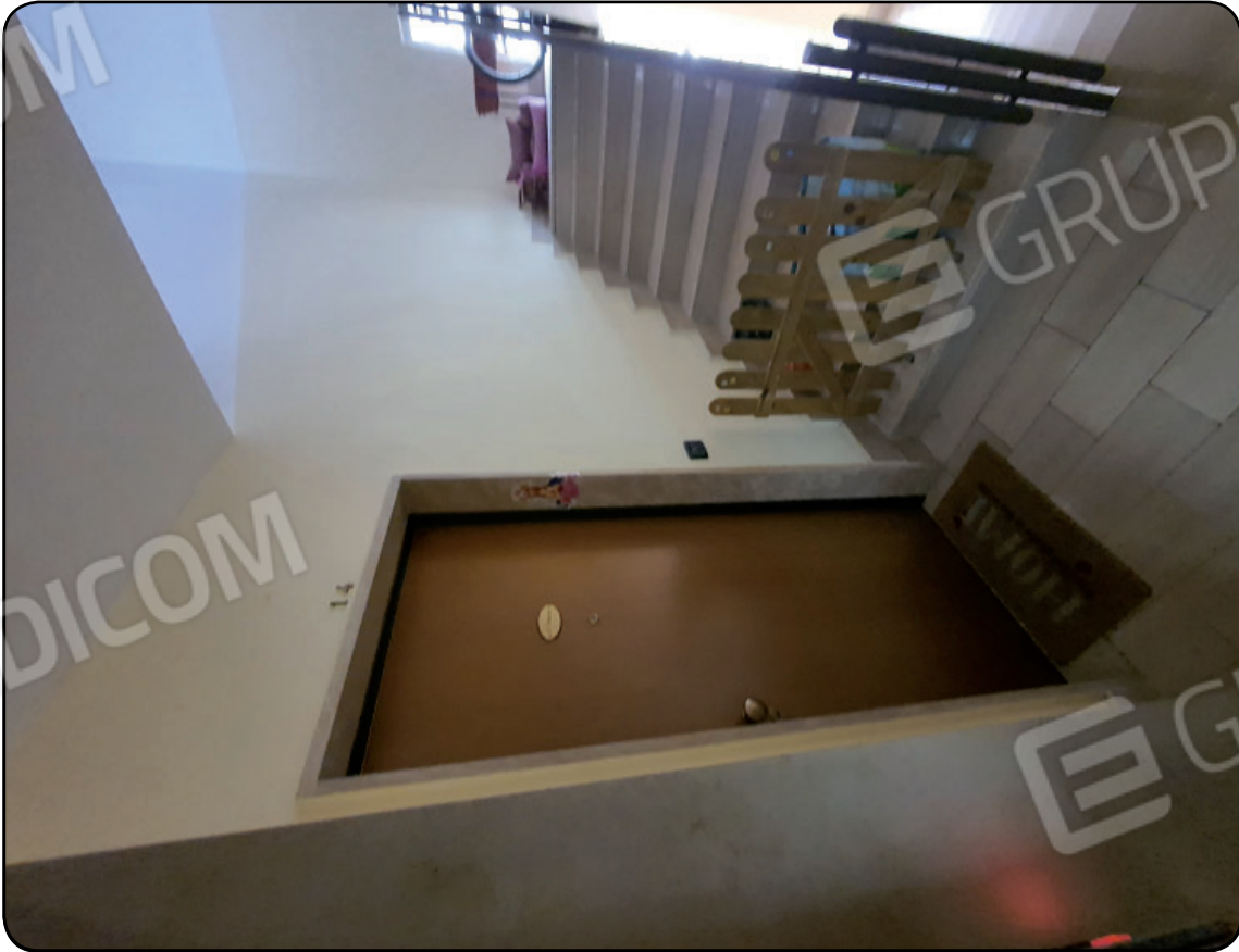
Foto 4: Vano scala e porta di ingresso dell'abitazione in stima al settimo piano