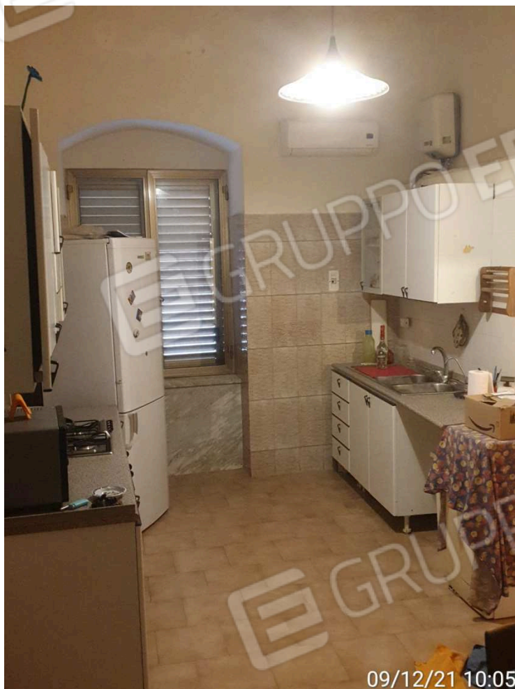
Foto 8- CUCINA A PRIMO PIANO