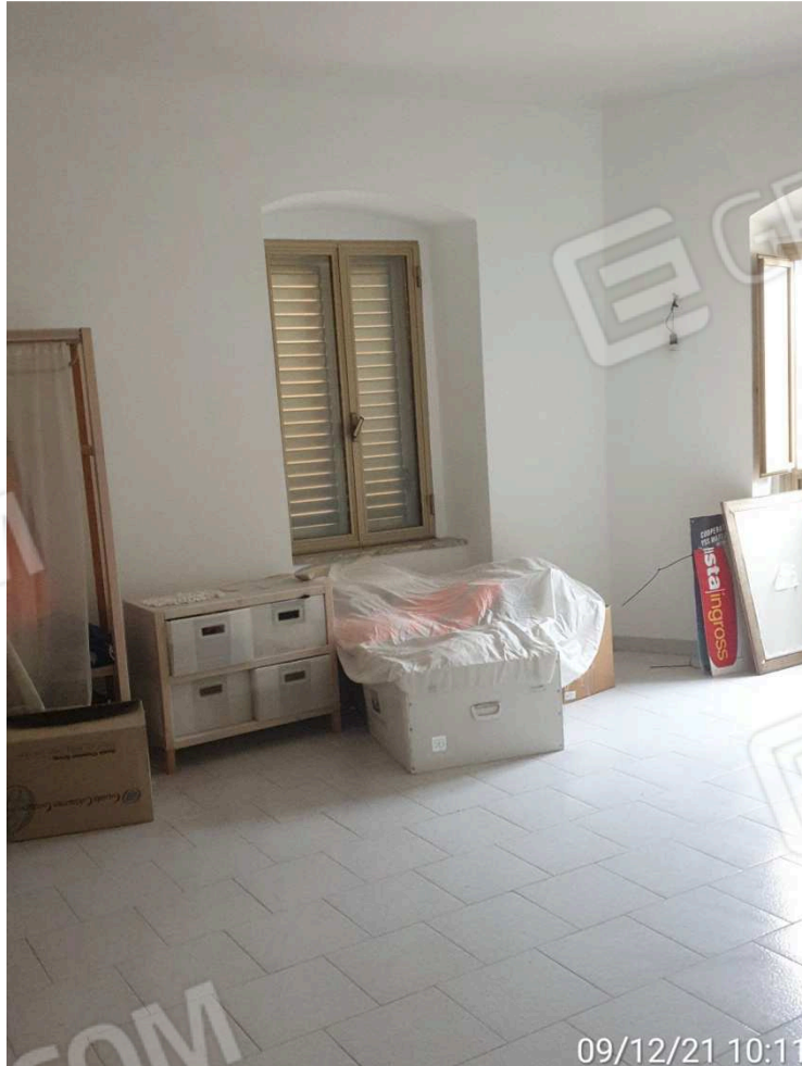
Foto 13 - ALTRA CAMERA DA LETTO AL SECONDO PIANO