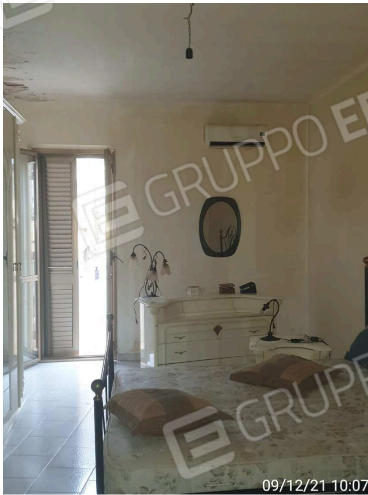
Foto 12 - CAMERA DA LETTO AL SECONDO PIANO