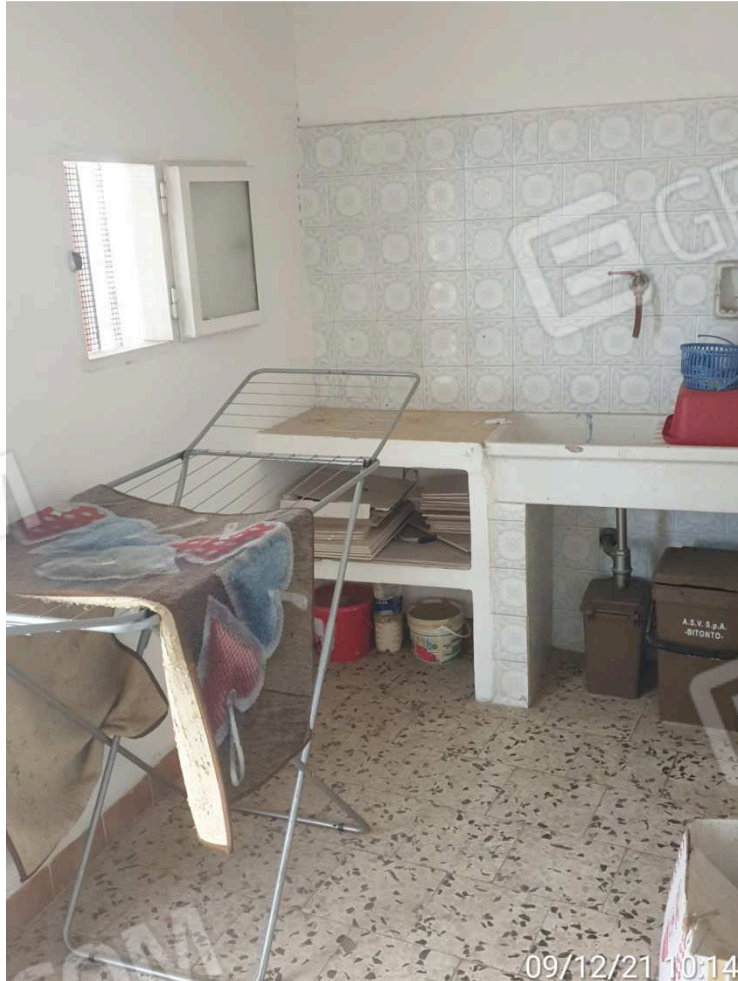
FOTO 18 - LAVANDERIA AL TERZO PIANO