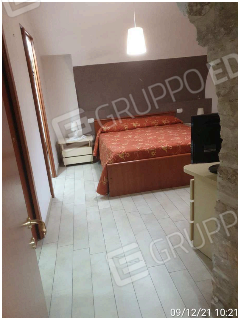
Foto 5- CAMERA DA LETTO A PIANO TERRA