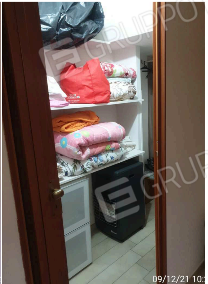
Foto 7- CABINA ARMADIO A PIANO TERRA