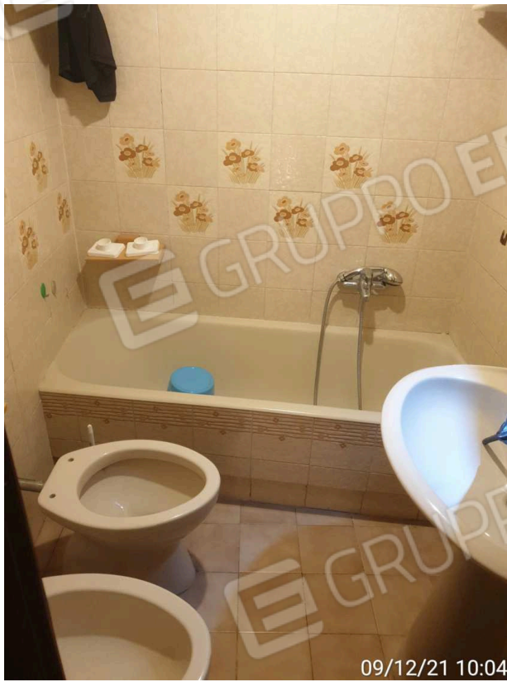
Foto 10 - WC PRIMO PIANO