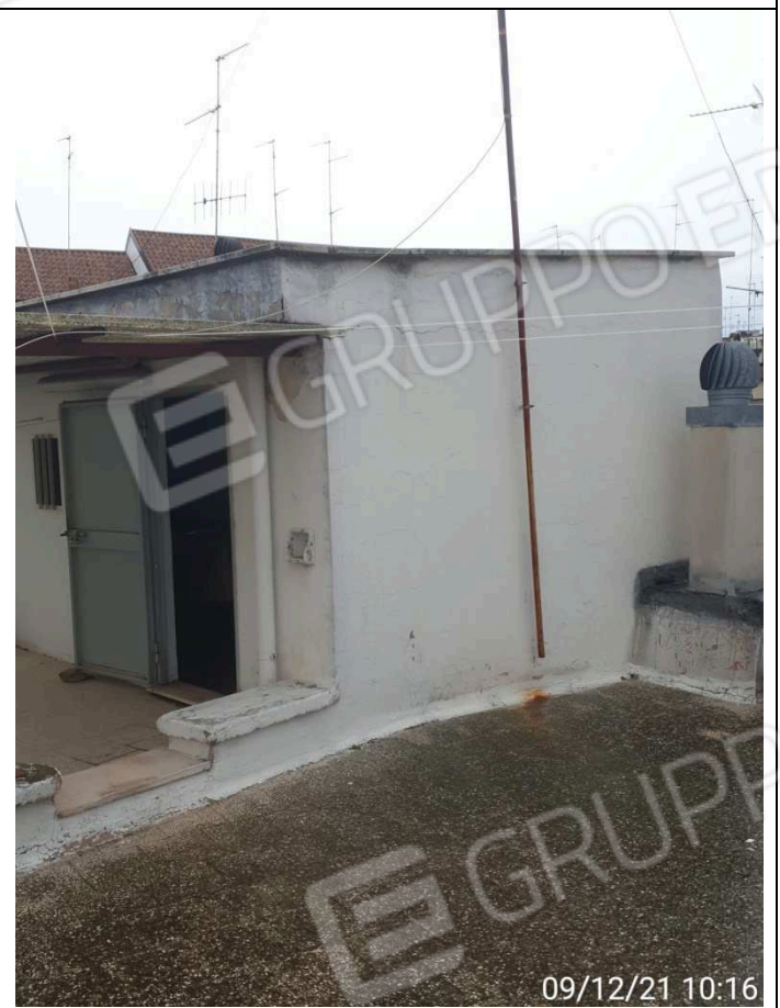
FOTO 19,20,21,22 - LASTRICO SOLARE