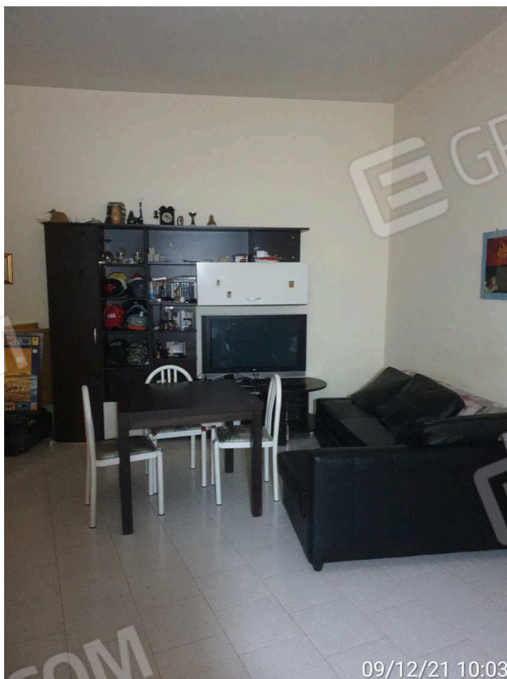
Foto 9 - SOGGIORNO PRANZO A PRIMO PIANO