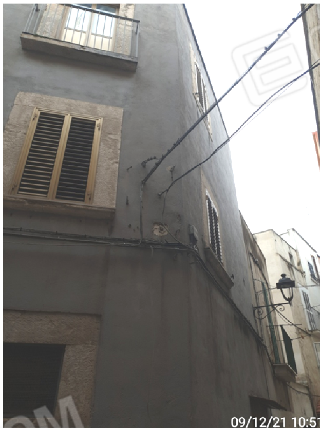
Foto 2 - PROSPETTO VIA PENDILE