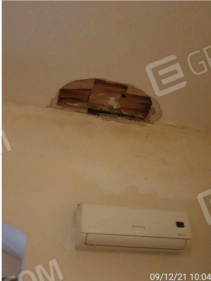
Foto 11 - FENOMENO INFILTRATIVO NELLA CUCINA DEL PRIMO PIANO