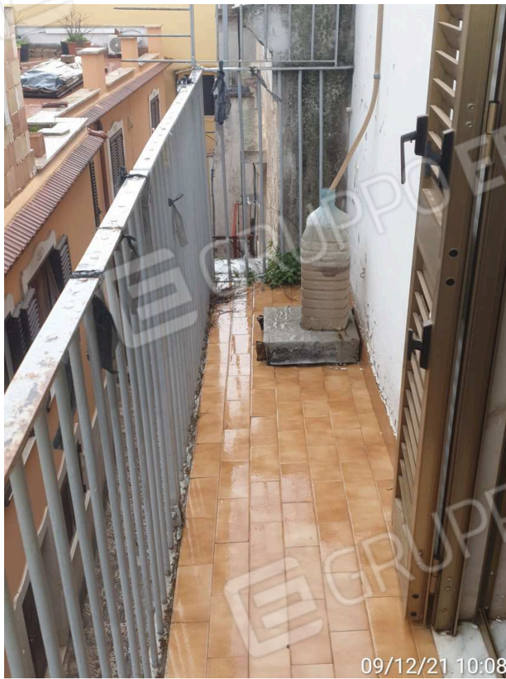
FOTO N.17 - BALCONE SECONDO PIANO