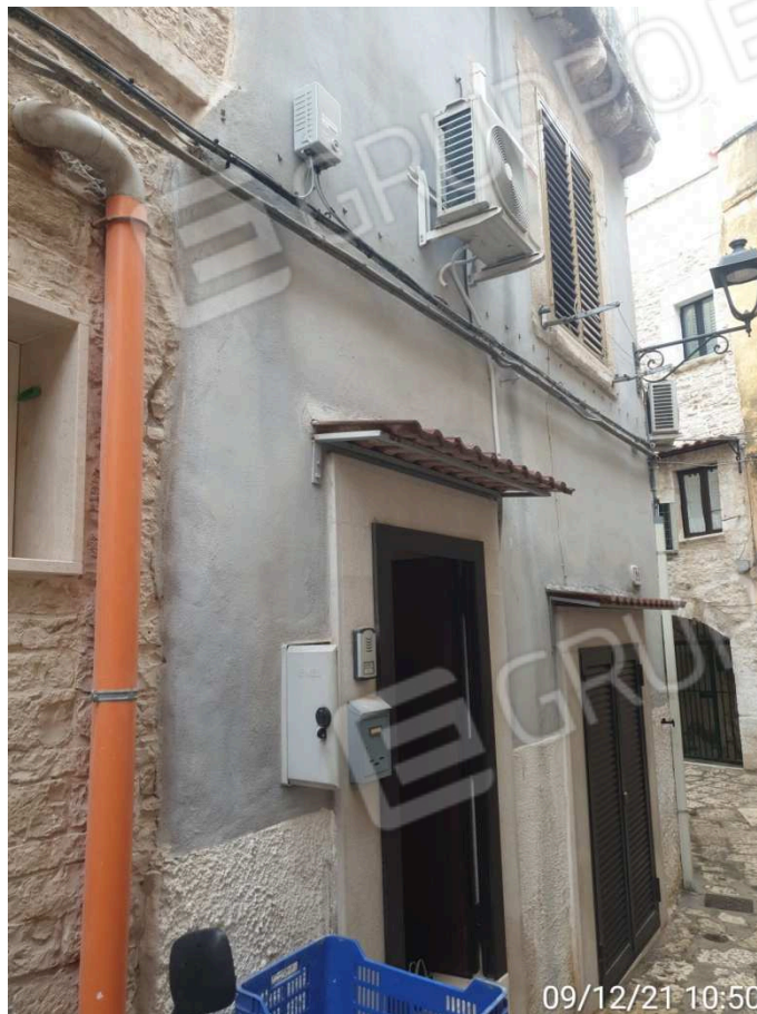
Foto 1- PROSPETTO VIA PENDILE