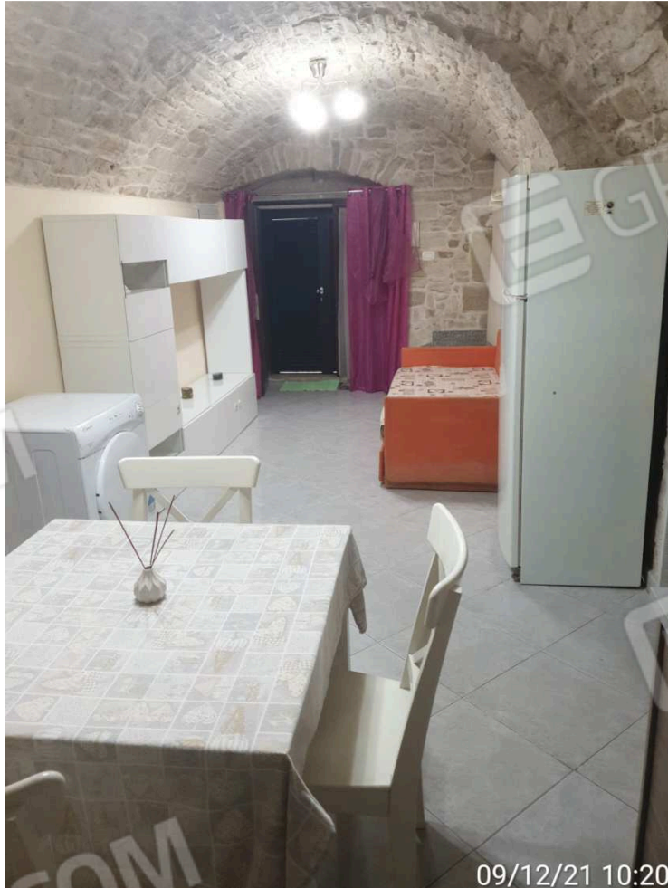
Foto 4- AMBIENTE UNICO A PIANO TERRA