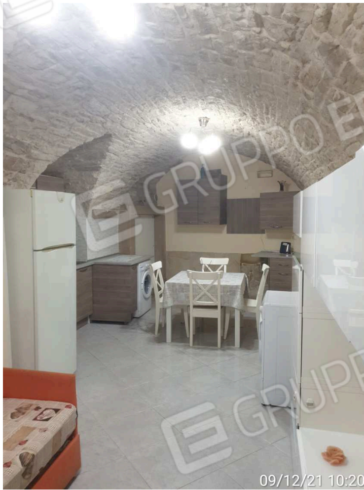
Foto 3- AMBIENTE UNICO A PIANO TERRA