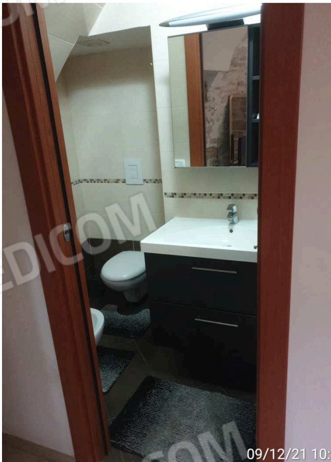
Foto 6 - WC A PIANO TERRA