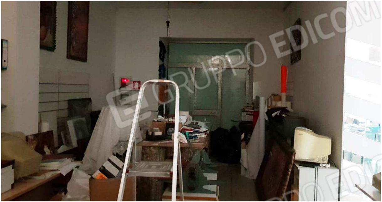
Figura 3: Vista interno locale commerciale in Putignano alla via G. Laterza n. 15