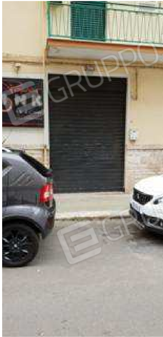
Figura 1: Vista edificio in Putignano alla via G. Laterza (ingresso locale)