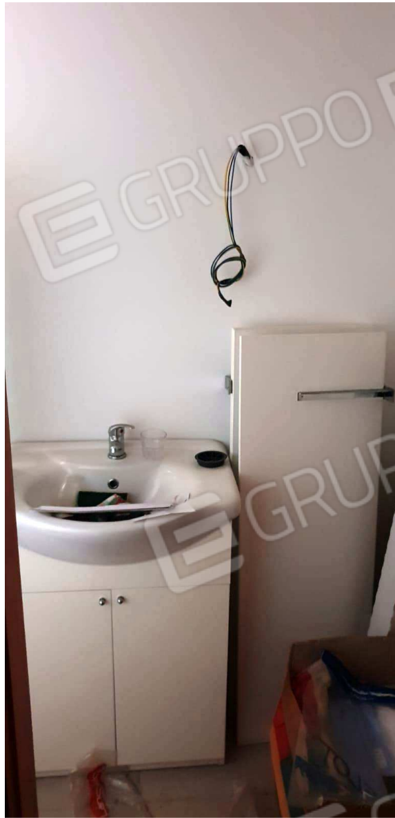
Figura 7: Vista interno W.C. – locale commerciale in Putignano alla via G. Laterza n. 15