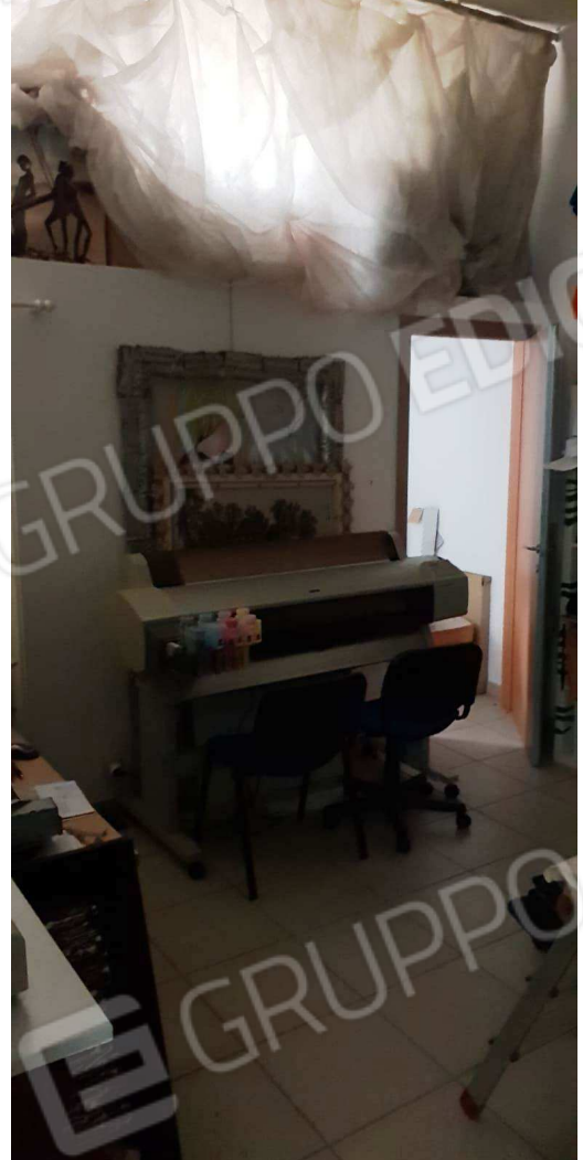
Figura 5 – 6: Vista interno locale commerciale in Putignano alla via G. Laterza n. 15