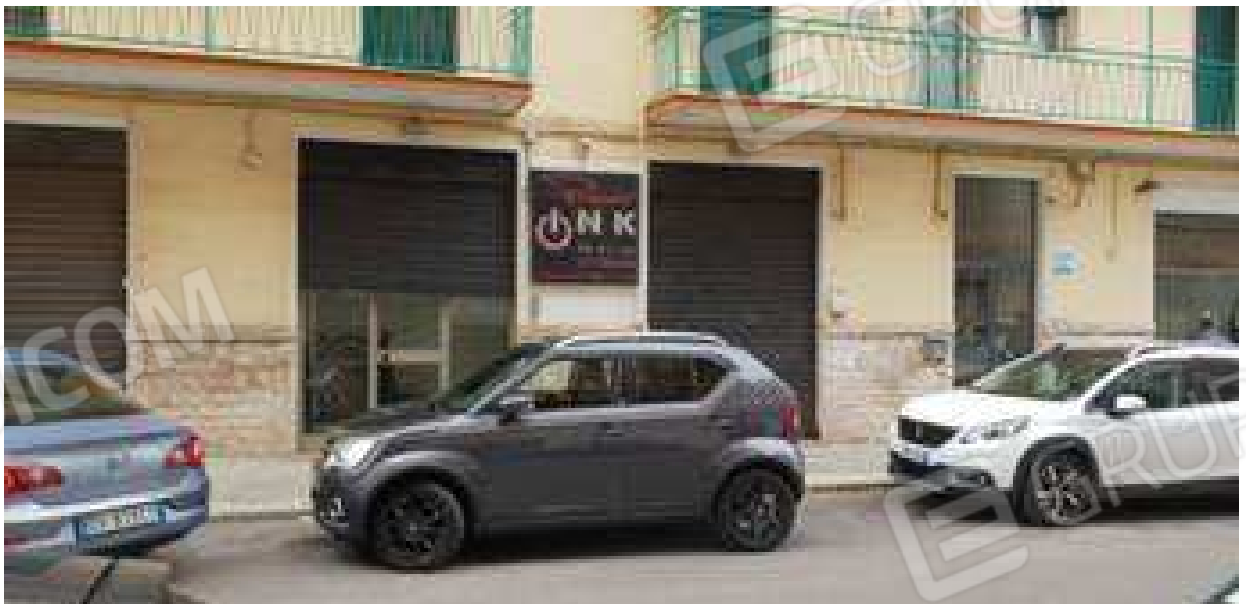
Figura 2: Vista edificio in Putignano alla via G. Laterza (prospetto principale)