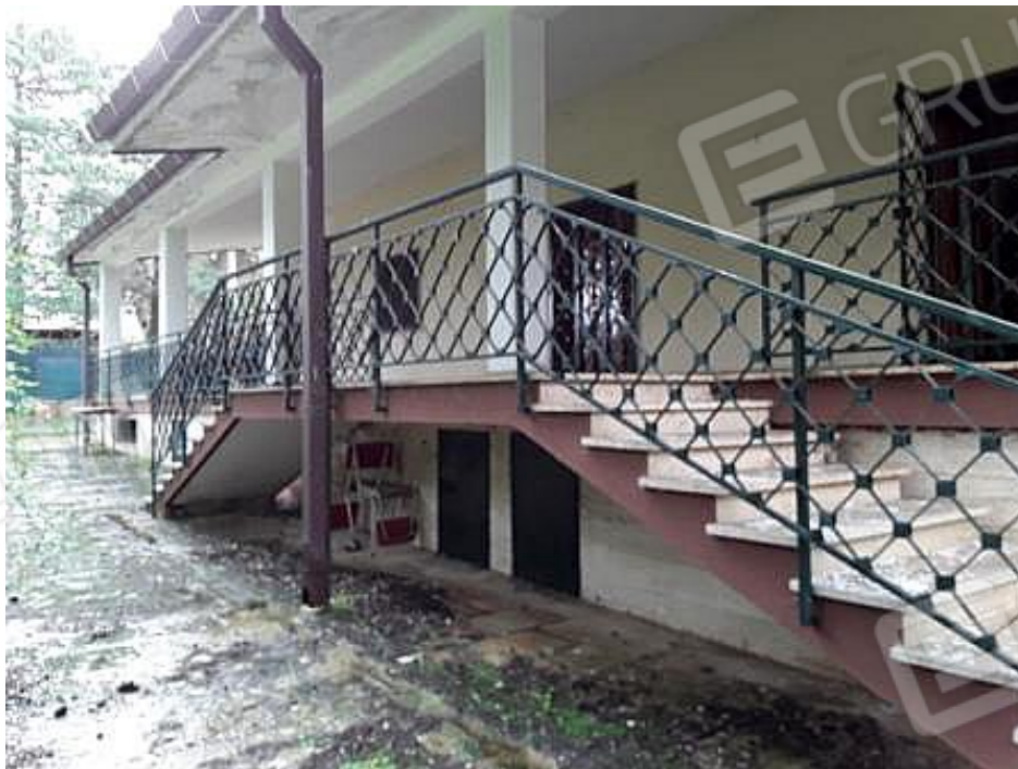
Foto n° 51 : sottoscala locali tecnici sub 8 e 9 accesso all'unità sub 3