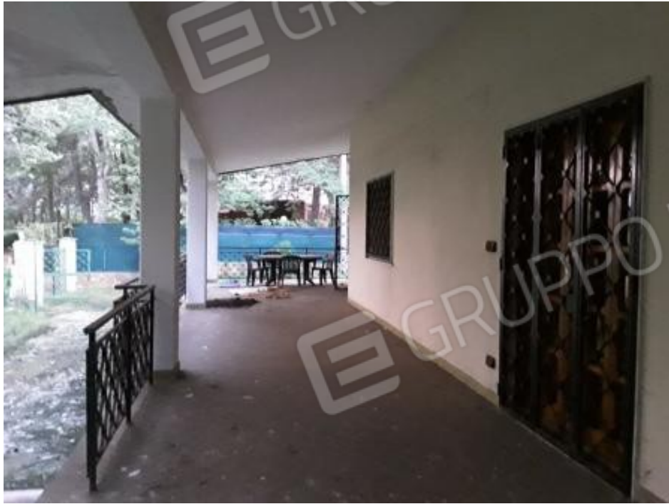
Foto n° 14 : porticato su cui si affacciano le finestre del soggiorno e salotto unità sub 2

Fig. 33 P.IIa 86 sub. 1-2-3-4-5-6-7-8-9-10