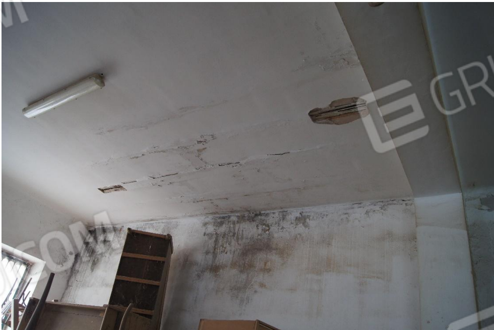
Foto 10: distacco di intonaco per infiltrazioni di acqua meteorica