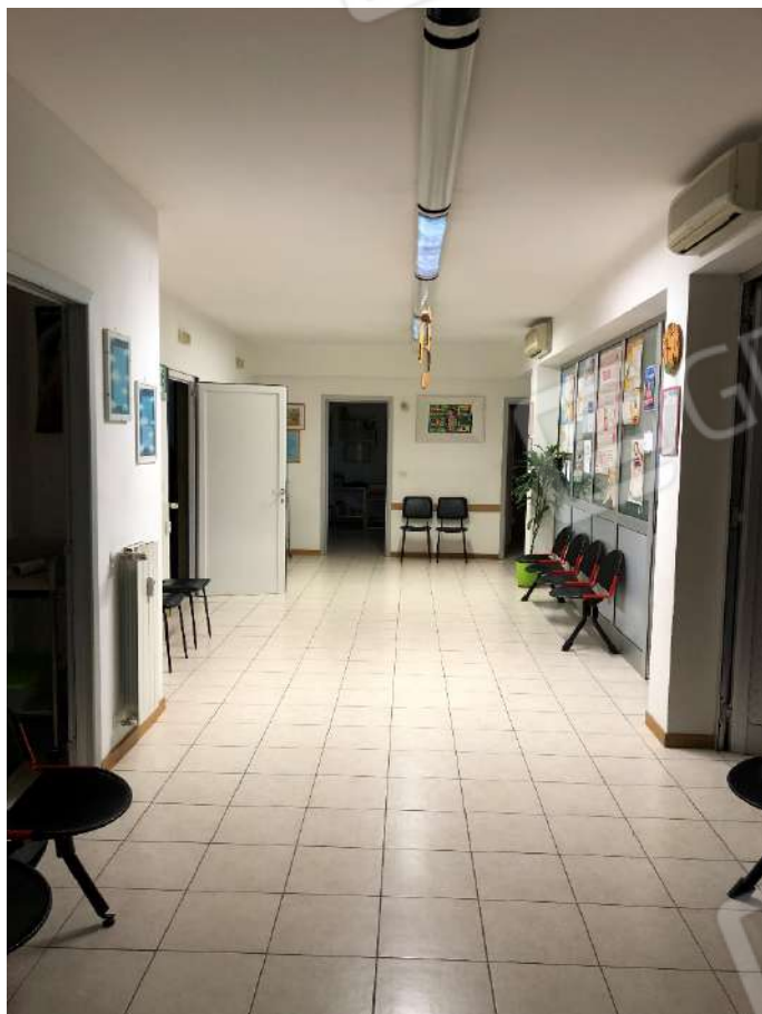
Ripresa fotografica n. 5