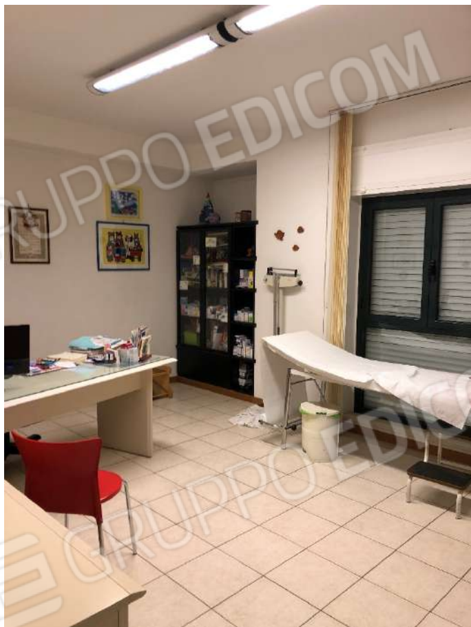
Ripresa fotografica n. 14