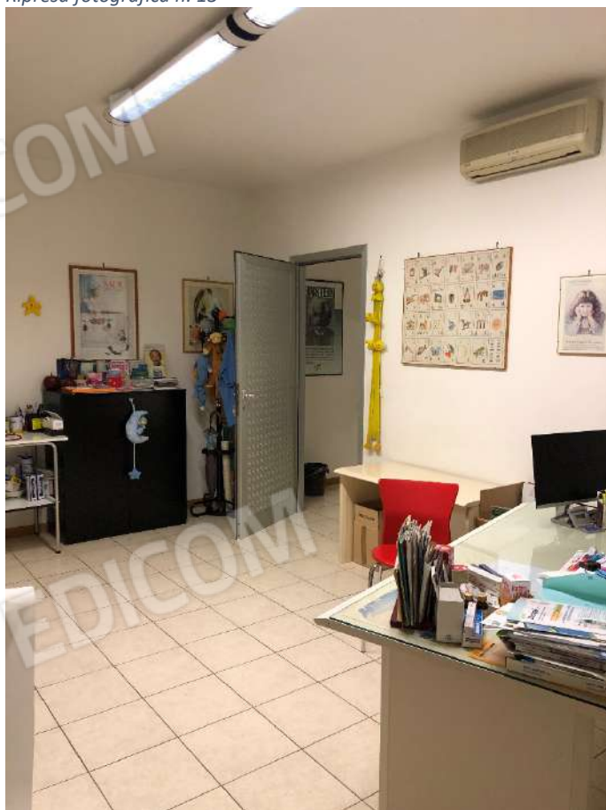
Ripresa fotografica n. 15