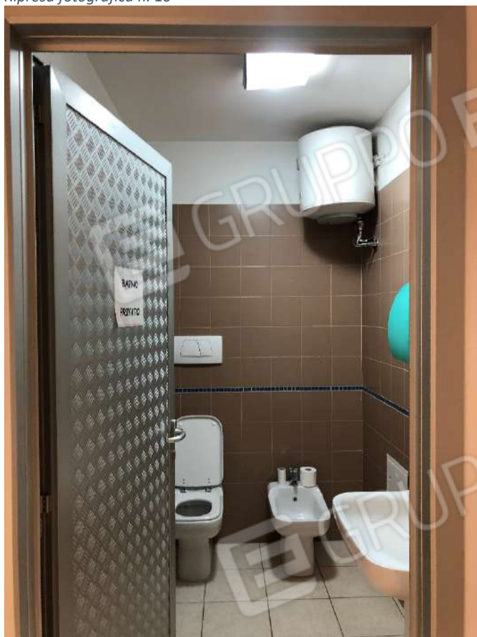
Ripresa fotografica n. 12