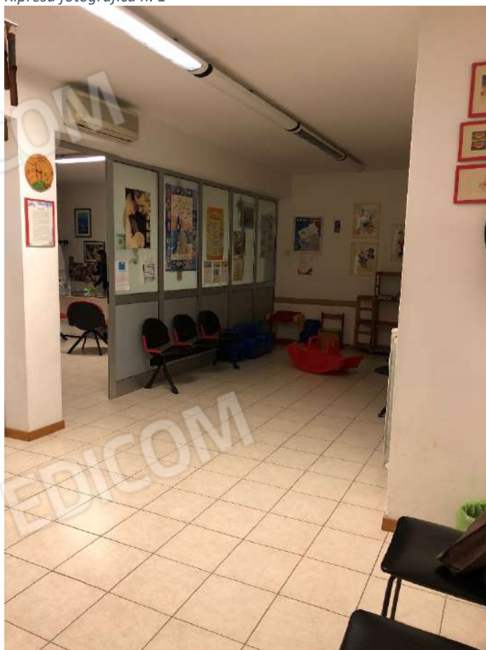
Ripresa fotografica n. 3