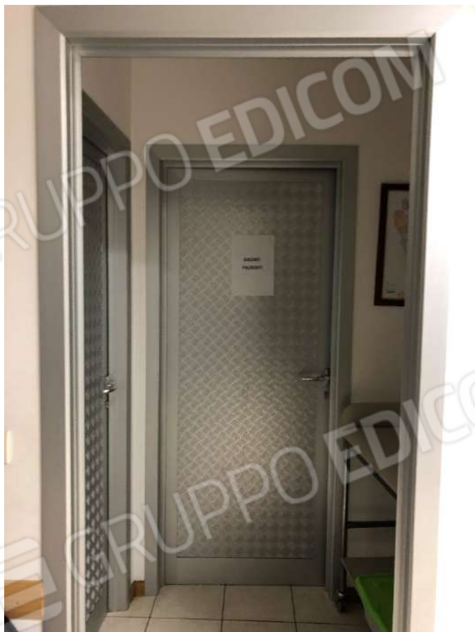
Ripresa fotografica n. 6