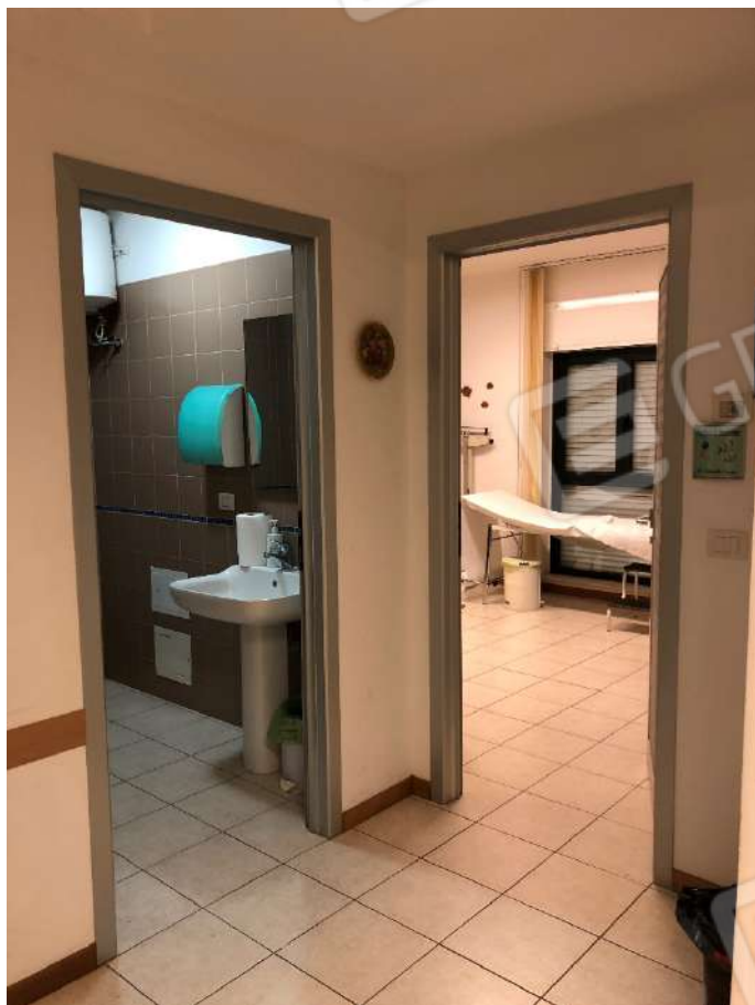
Ripresa fotografica n. 13