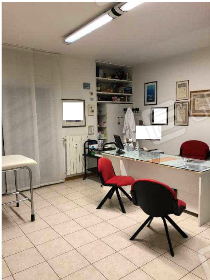
Ripresa fotografica n. 17