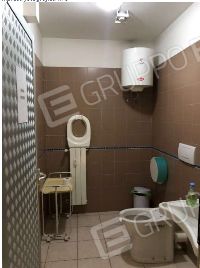
Ripresa fotografica n. 8