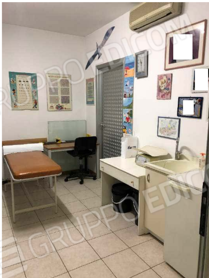
Ripresa fotografica n. 10