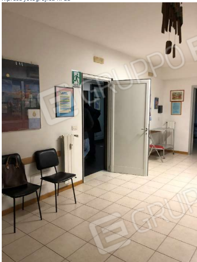
Ripresa fotografica n. 20