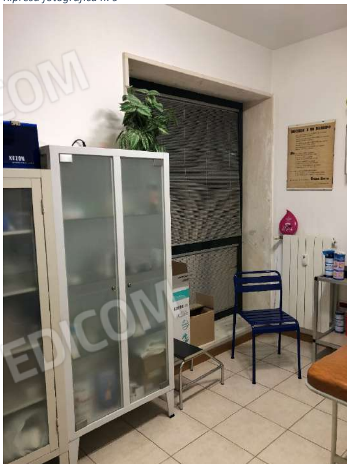
Ripresa fotografica n. 11