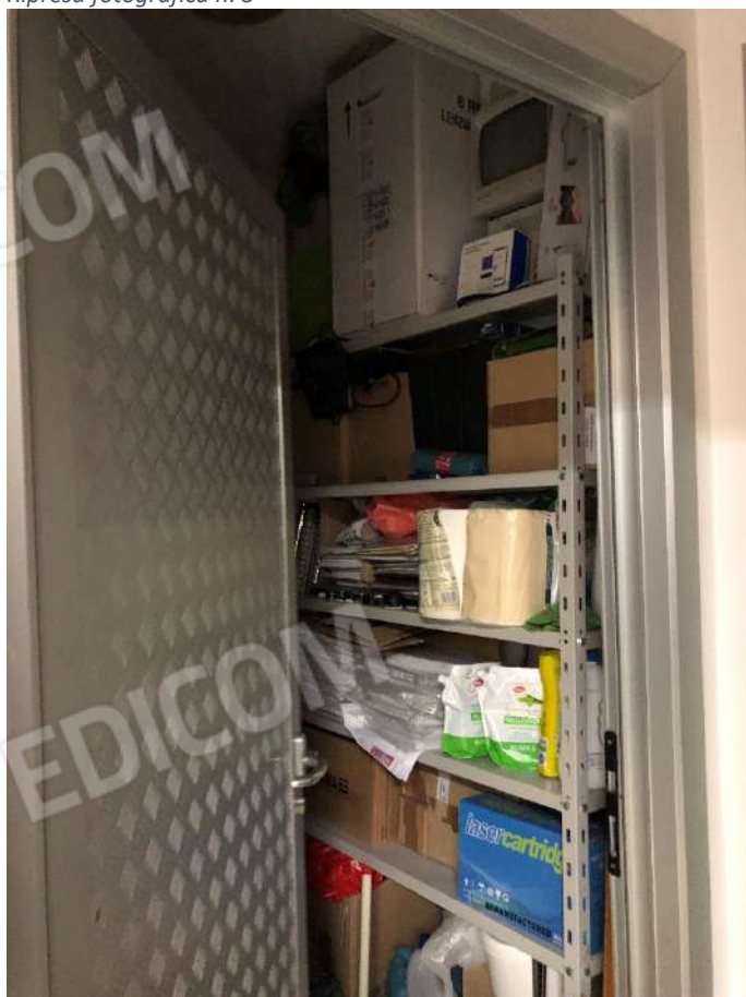
Ripresa fotografica n. 7