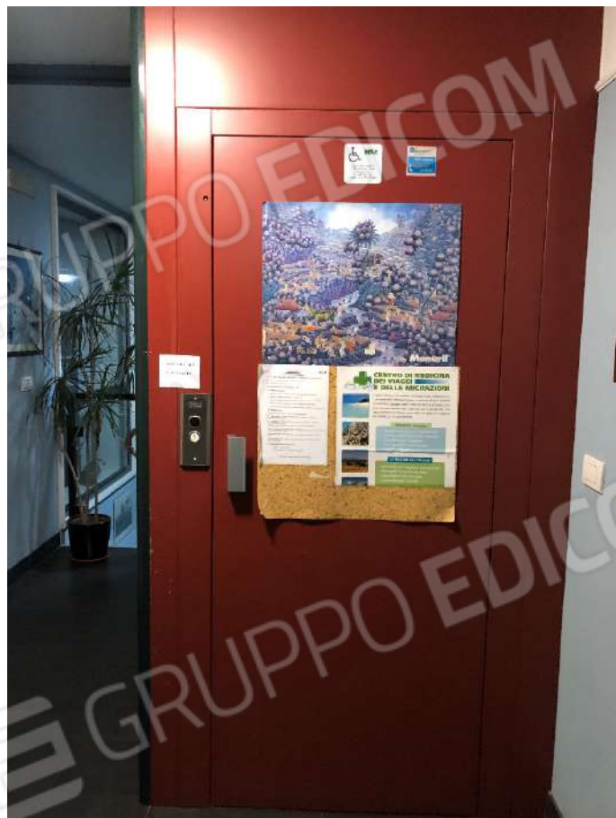
Ripresa fotografica n. 2