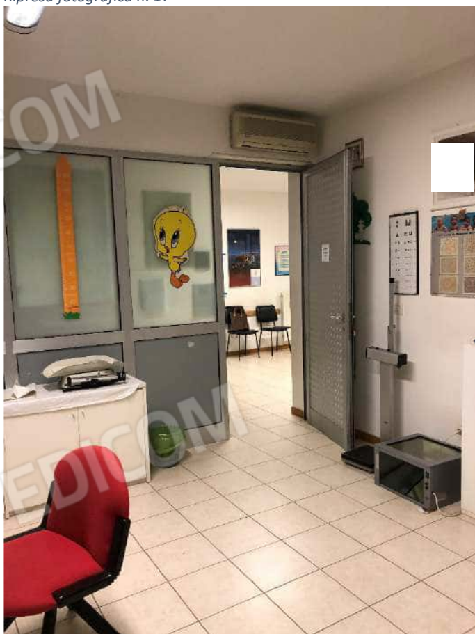
Ripresa fotografica n. 19