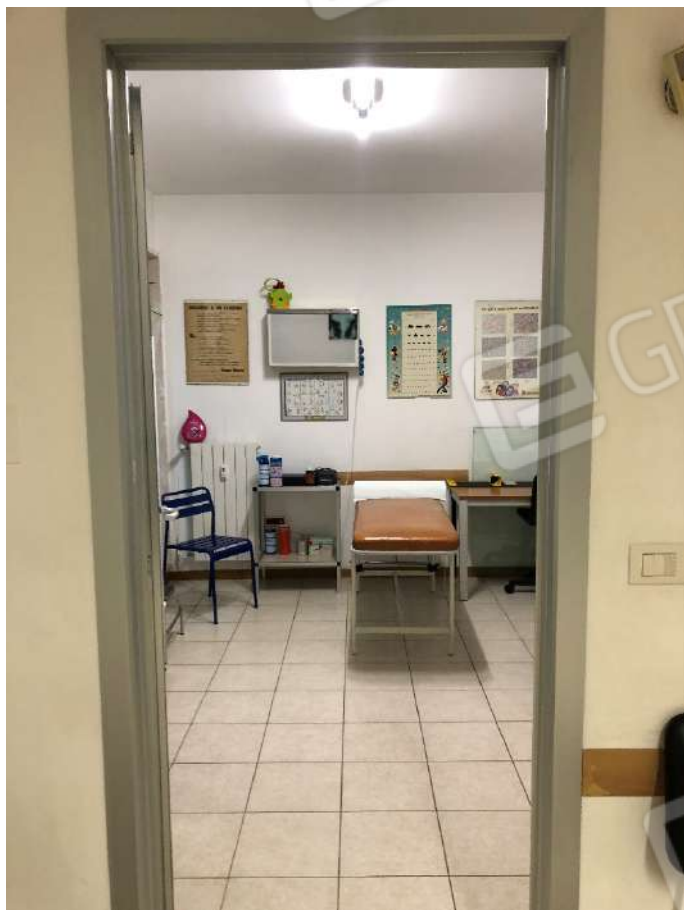
Ripresa fotografica n. 9