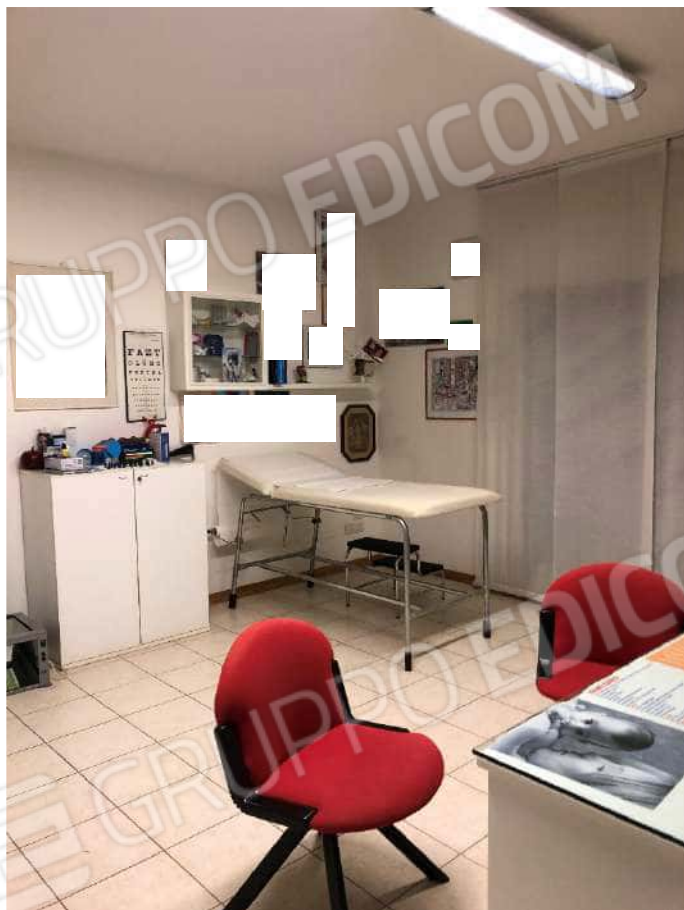
Ripresa fotografica n. 18