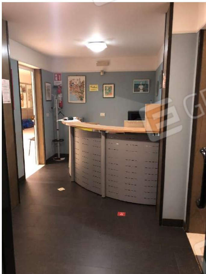
Ripresa fotografica n. 1