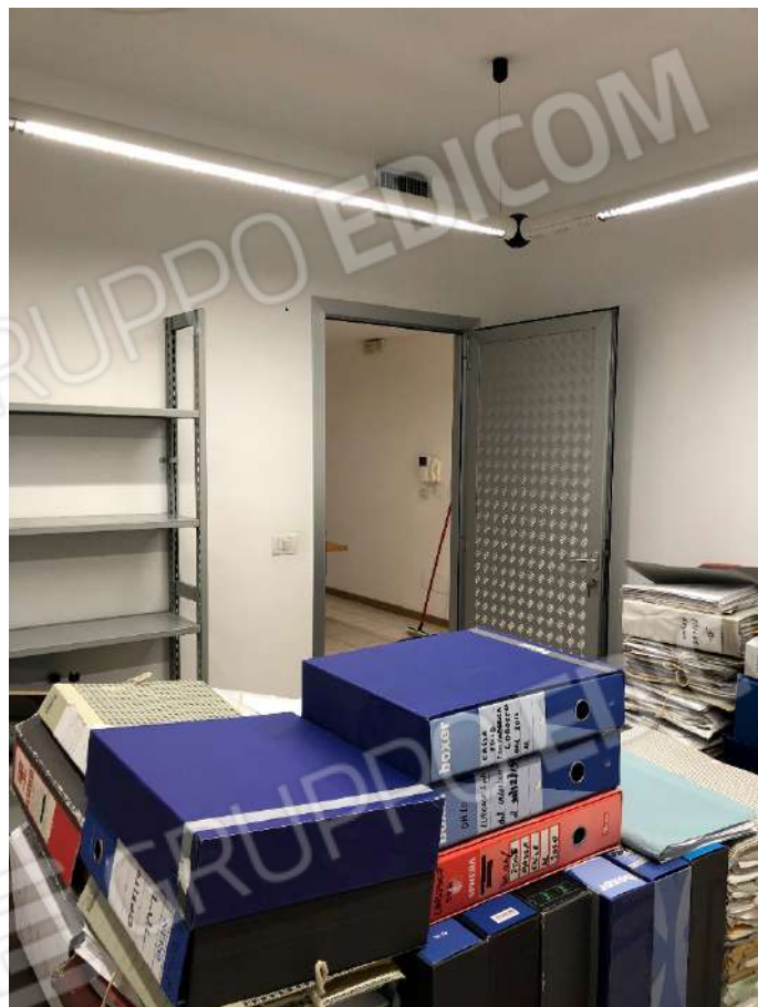
Ripresa fotografica n. 10