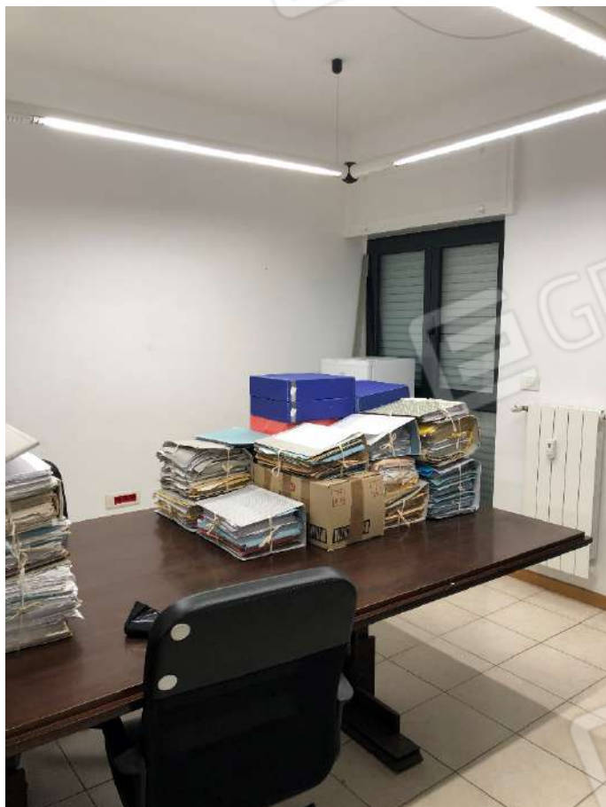
Ripresa fotografica n. 9