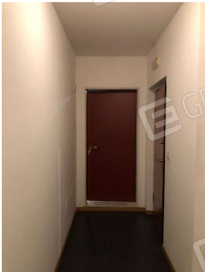
Ripresa fotografica n. 1