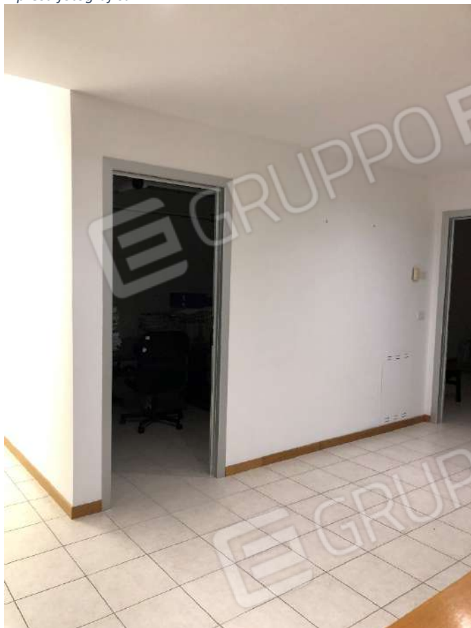
Ripresa fotografica n. 4