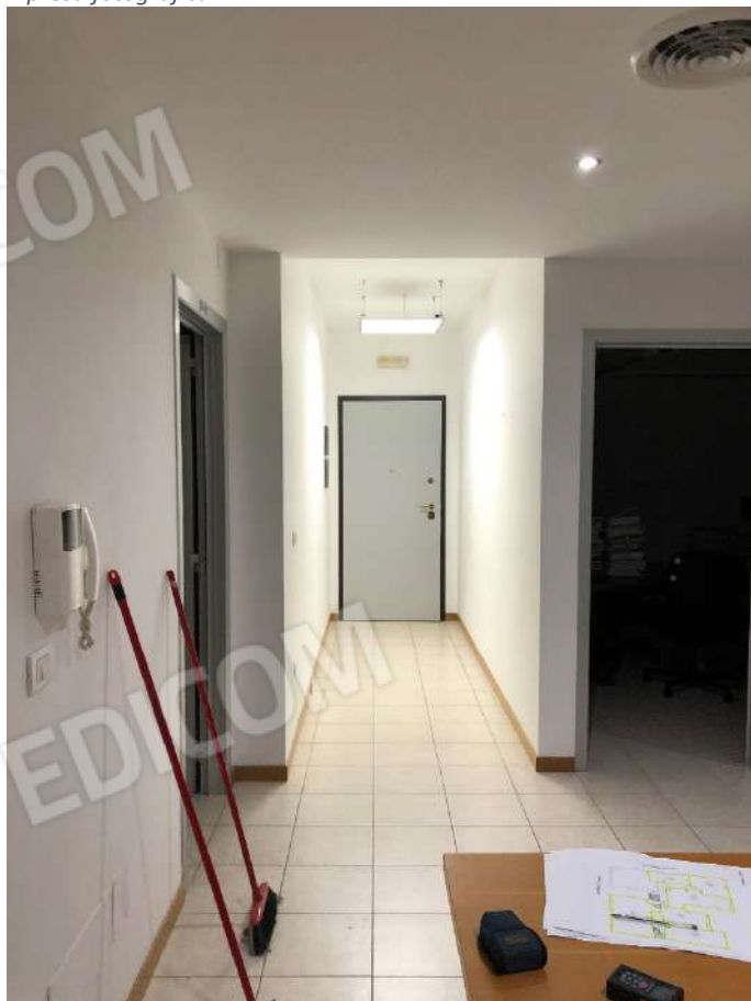
Ripresa fotografica n. 3