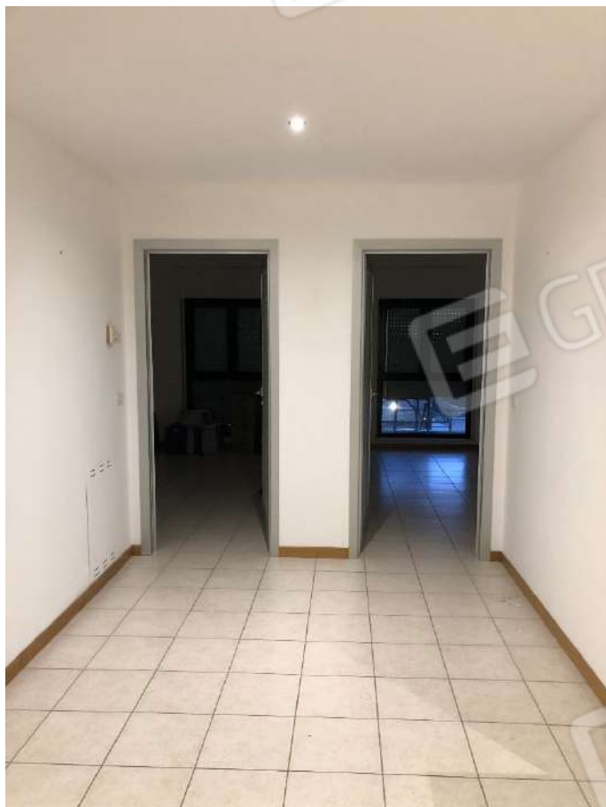
Ripresa fotografica n. 5