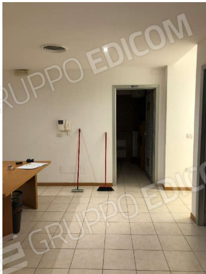
Ripresa fotografica n. 6