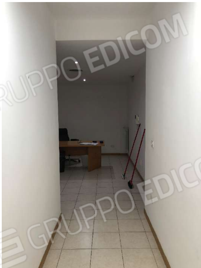
Ripresa fotografica n. 2