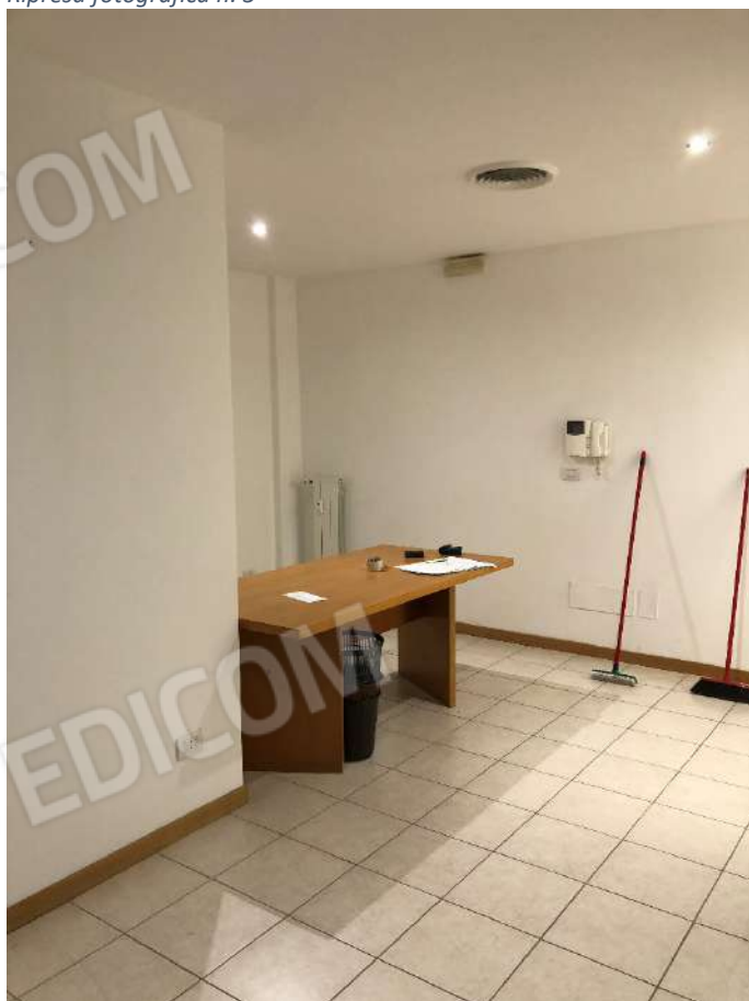
Ripresa fotografica n. 7