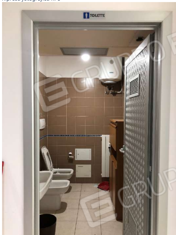
Ripresa fotografica n. 8