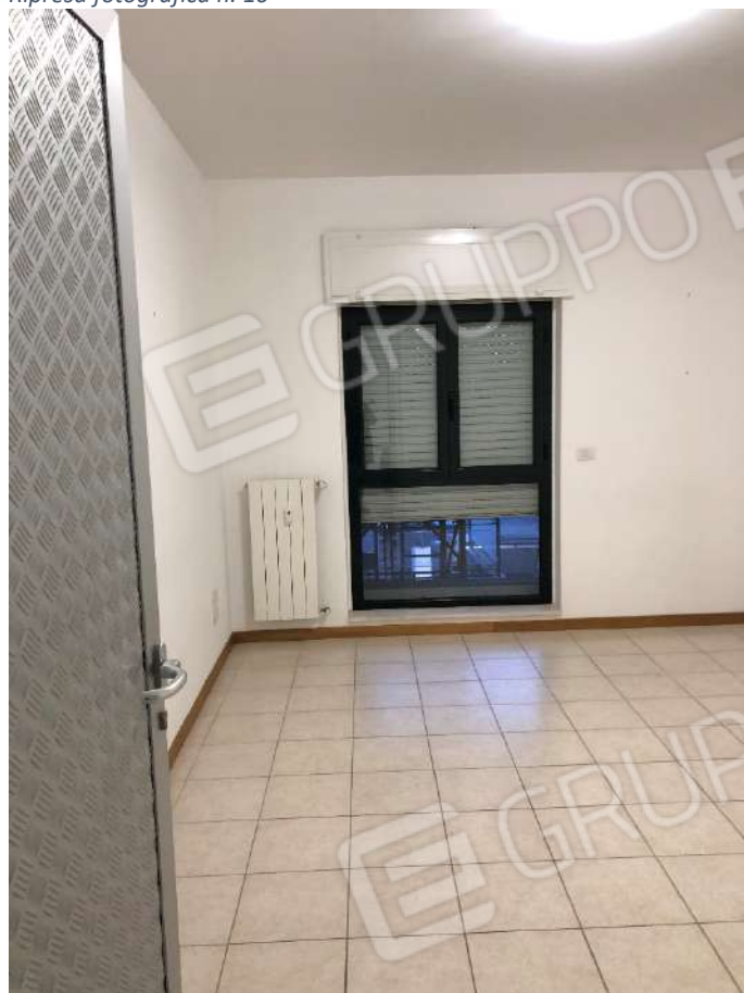
Ripresa fotografica n. 12