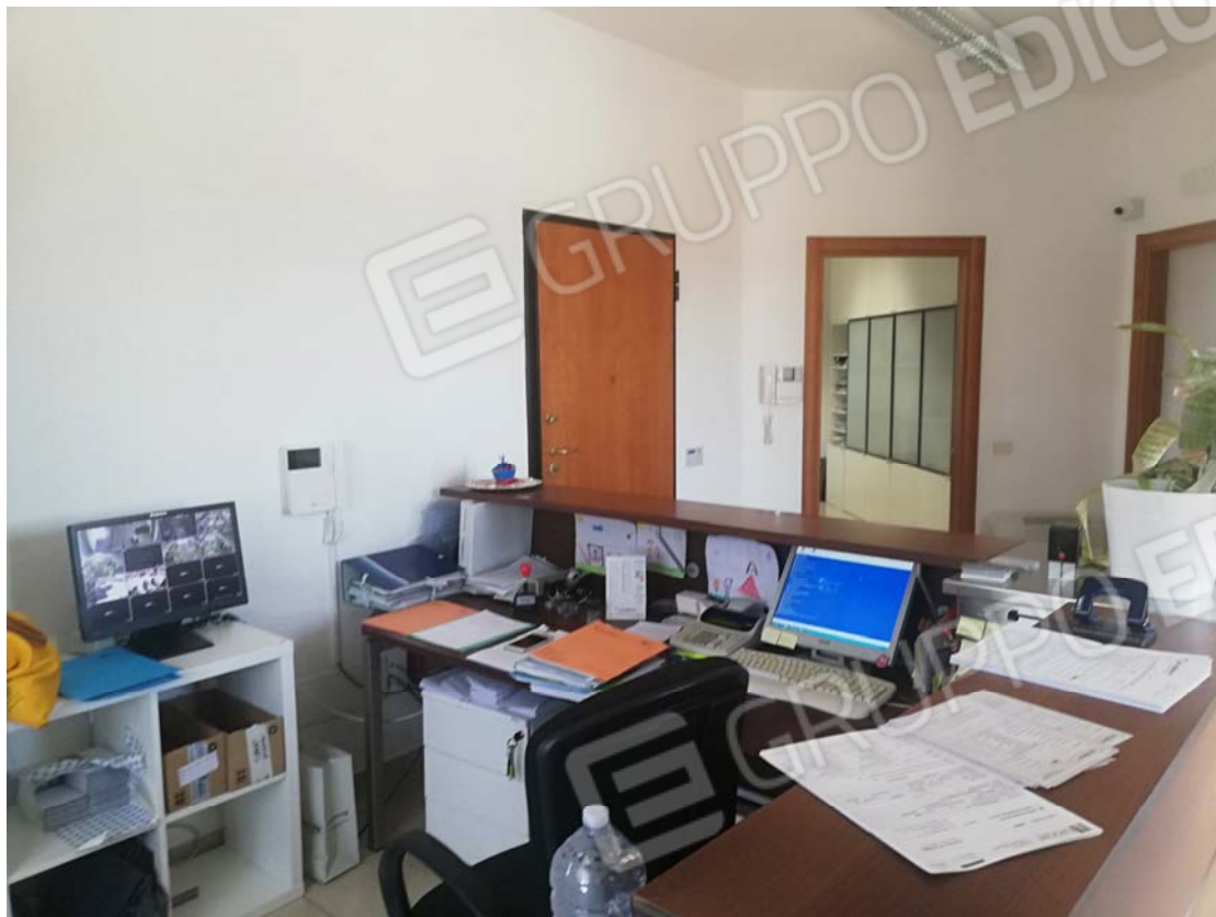
Uffici piano primo