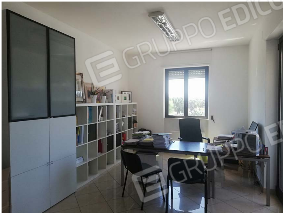
Stanza sub 2