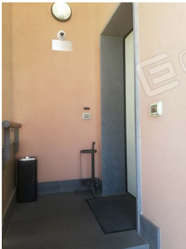
Porta di ingresso uffici piano primo