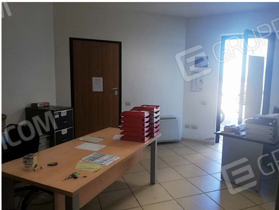
Uffici piano terra