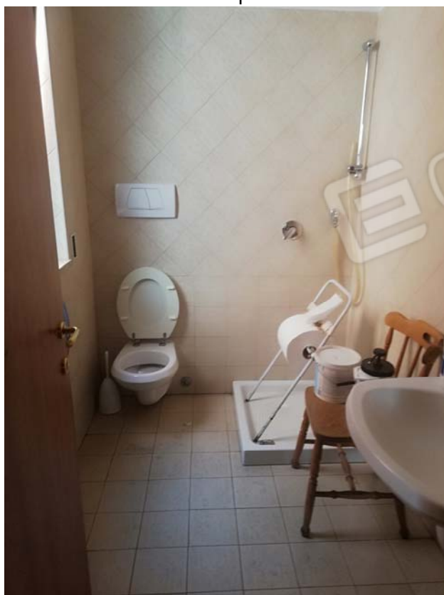
Bagno piano terra