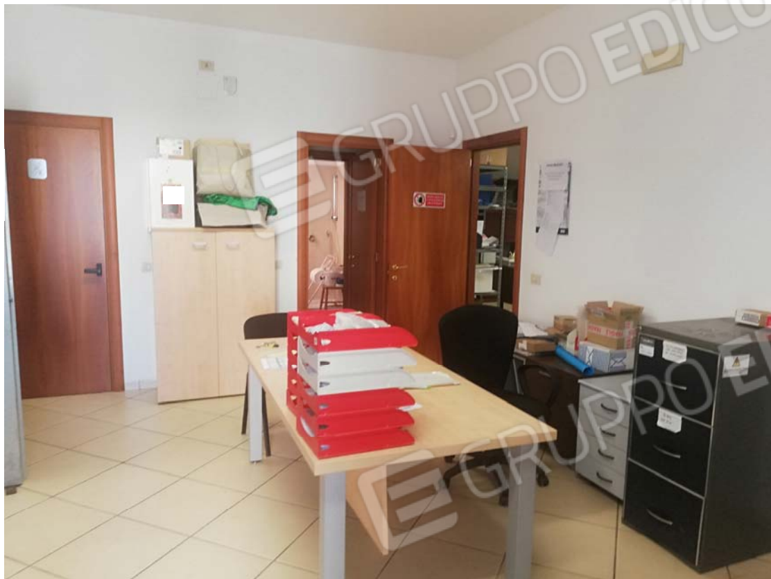
Uffici piano terra