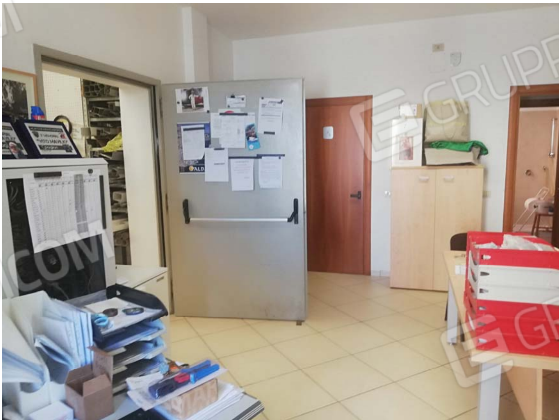
Uffici piano terra