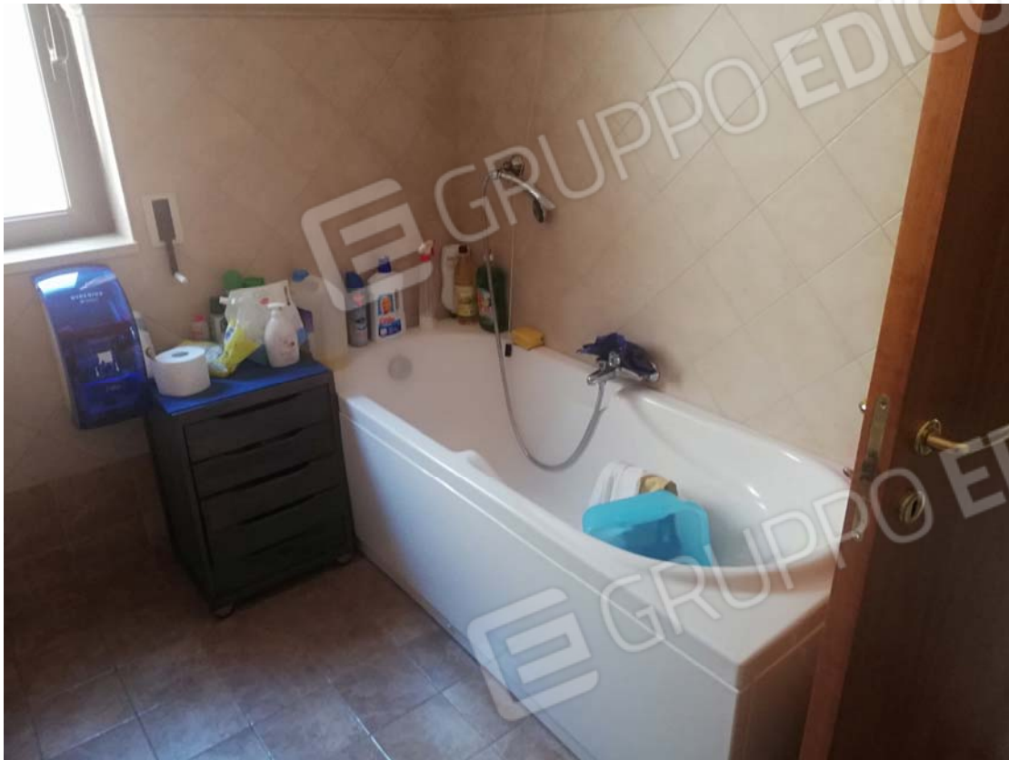
Bagno appartamento sub 2