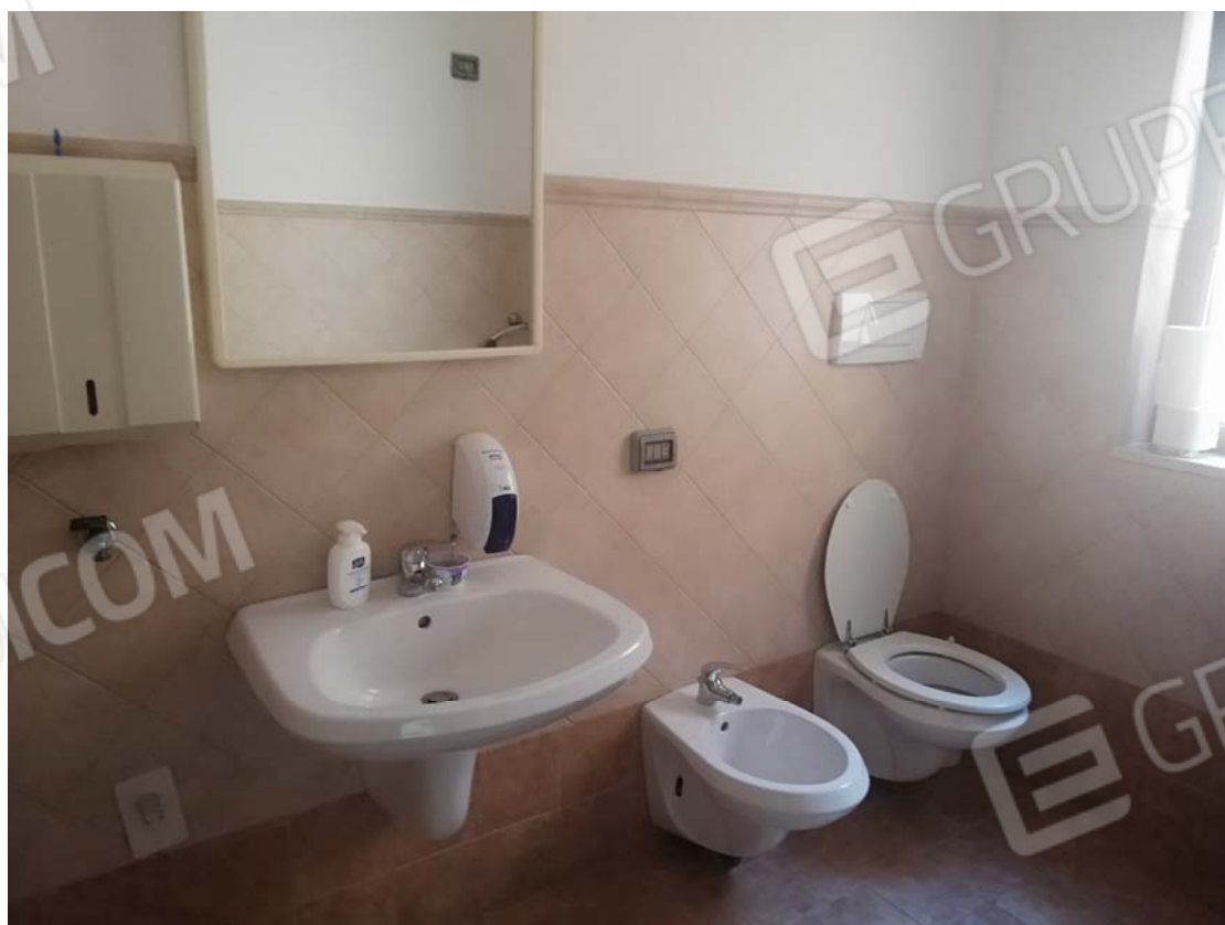
Bagno appartamento sub 2