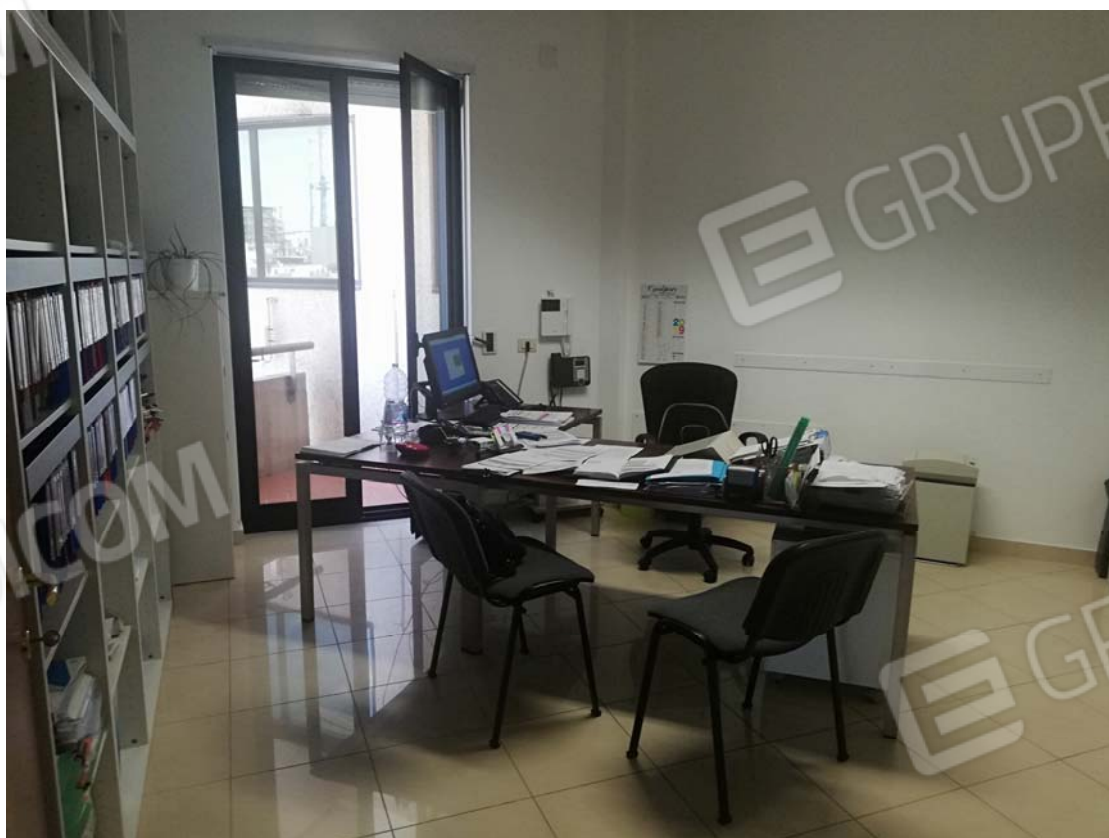
Uffici piano primo