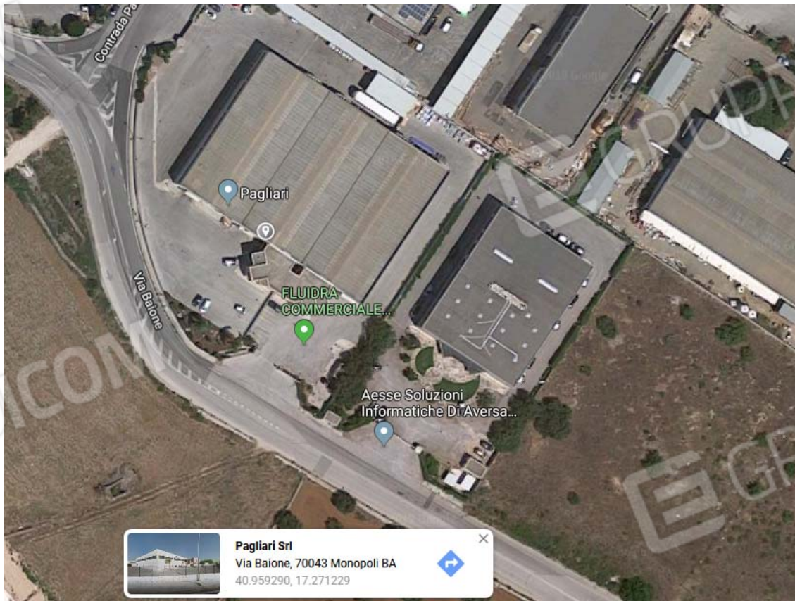
Ortofoto con coordinate