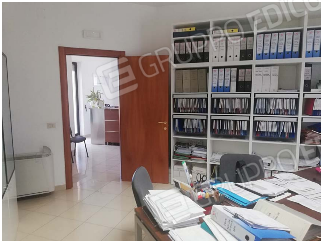
Uffici piano primo