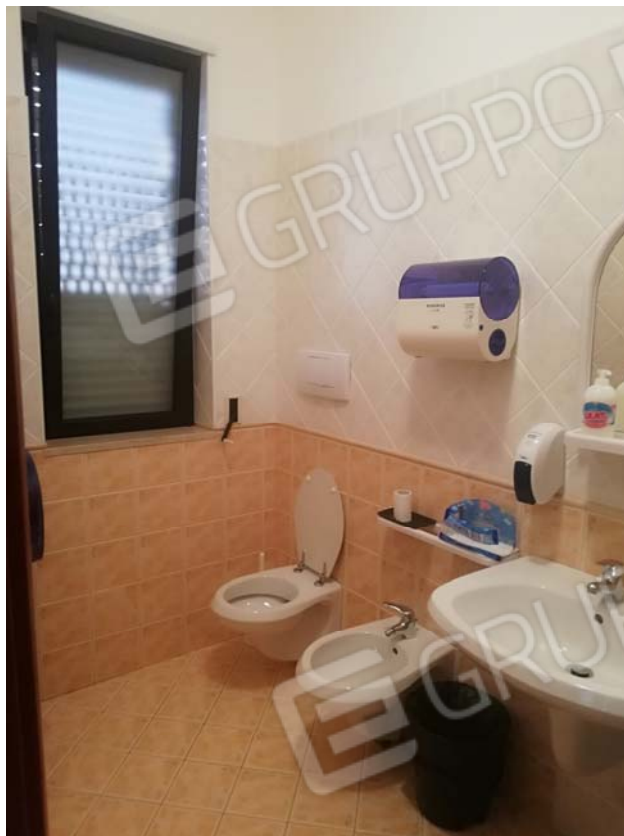
Bagno uffici piano primo