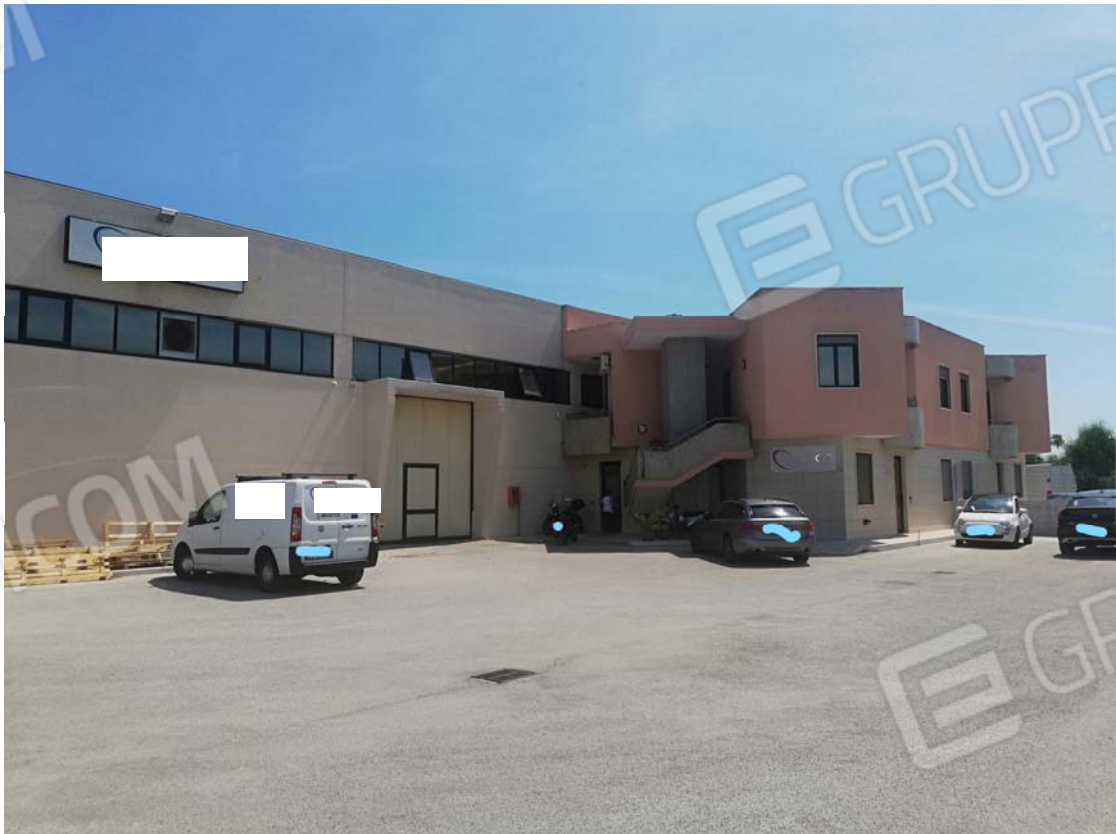
Pertinenza esterna con palazzina uffici e appartamento sub 2