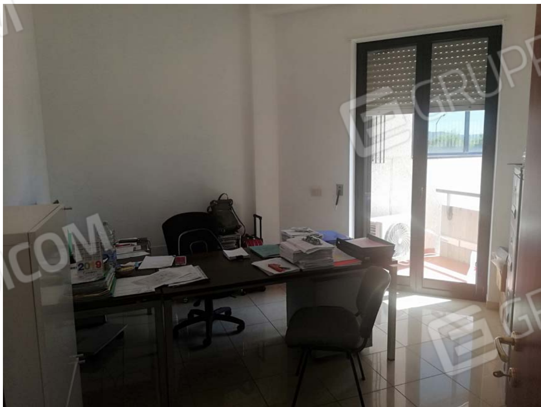
Uffici piano primo