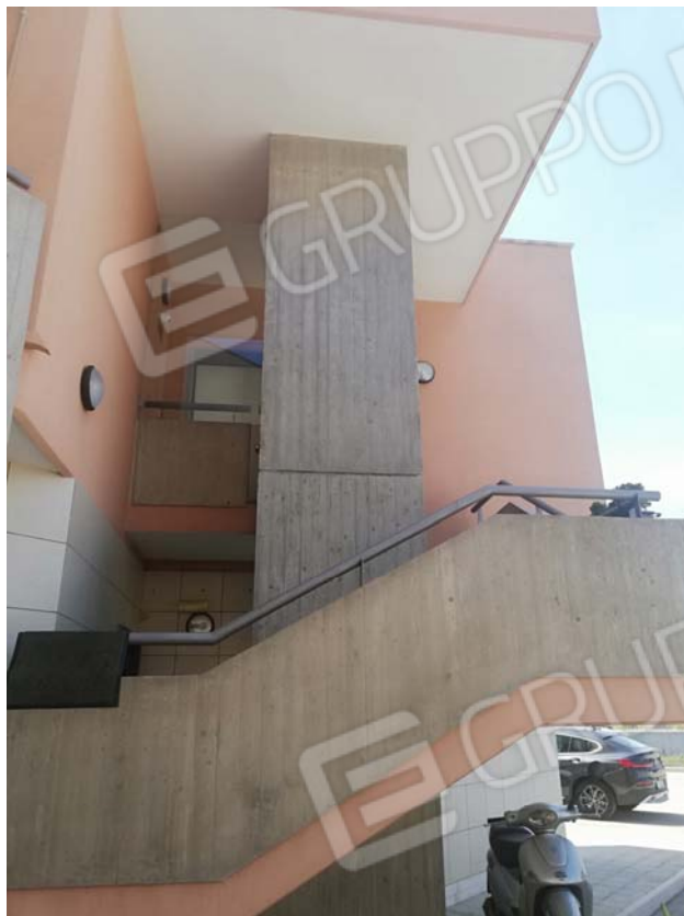
Scala esterna di accesso al primo piano