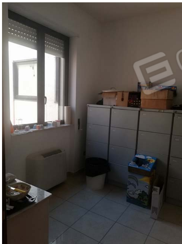
Stanza sub 2