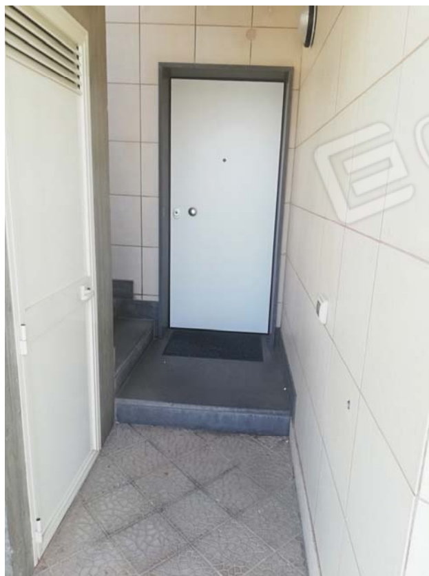
Porta di ingresso uffici piano terra