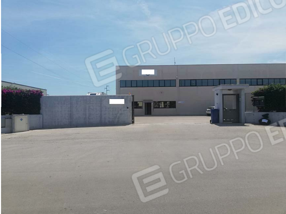
Cancello di accesso dalla contrada Passionisti