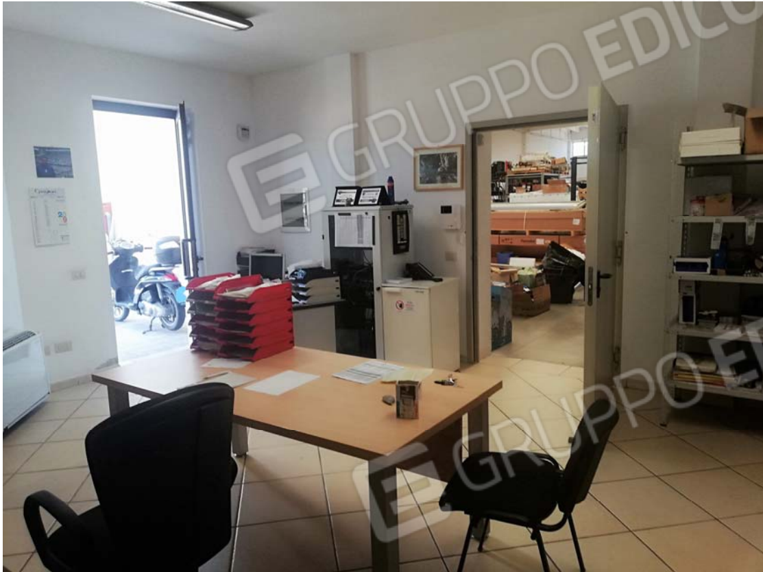
Uffici piano terra