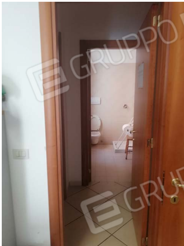
Zona servizi piano terra