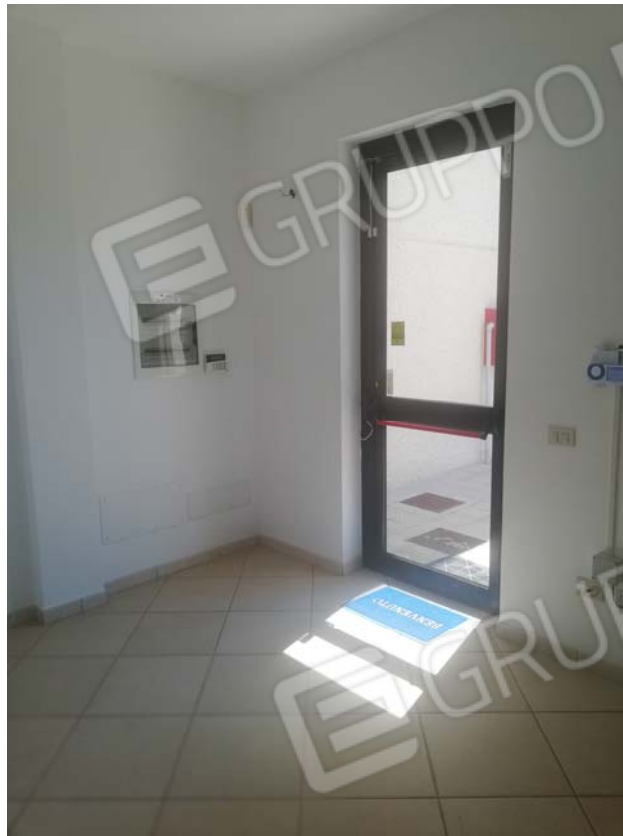
Altro ingresso uffici