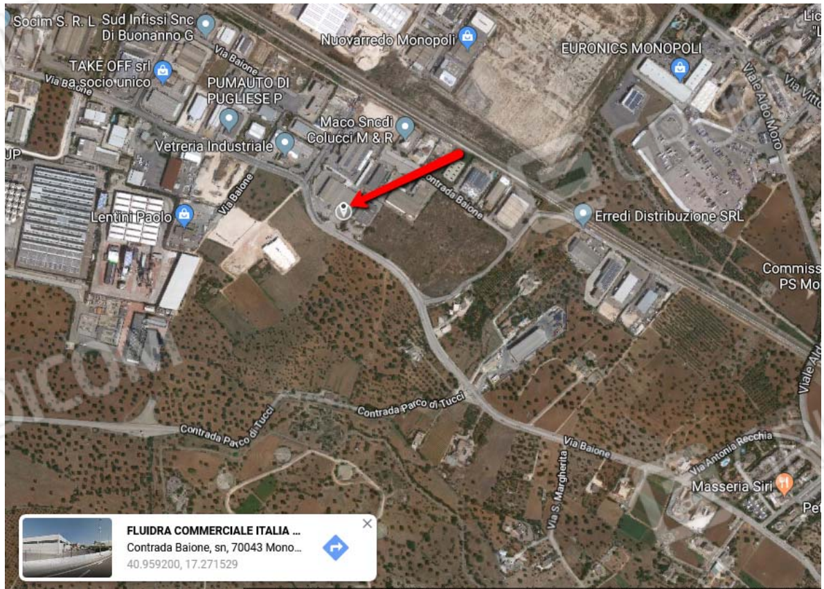
Ortofoto con coordinate