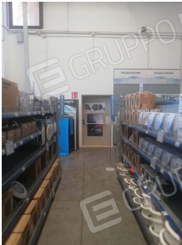
Accesso a uffici e servizi