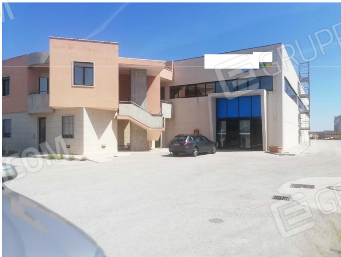
Capannone con palazzina uffici e appartamento sub 2