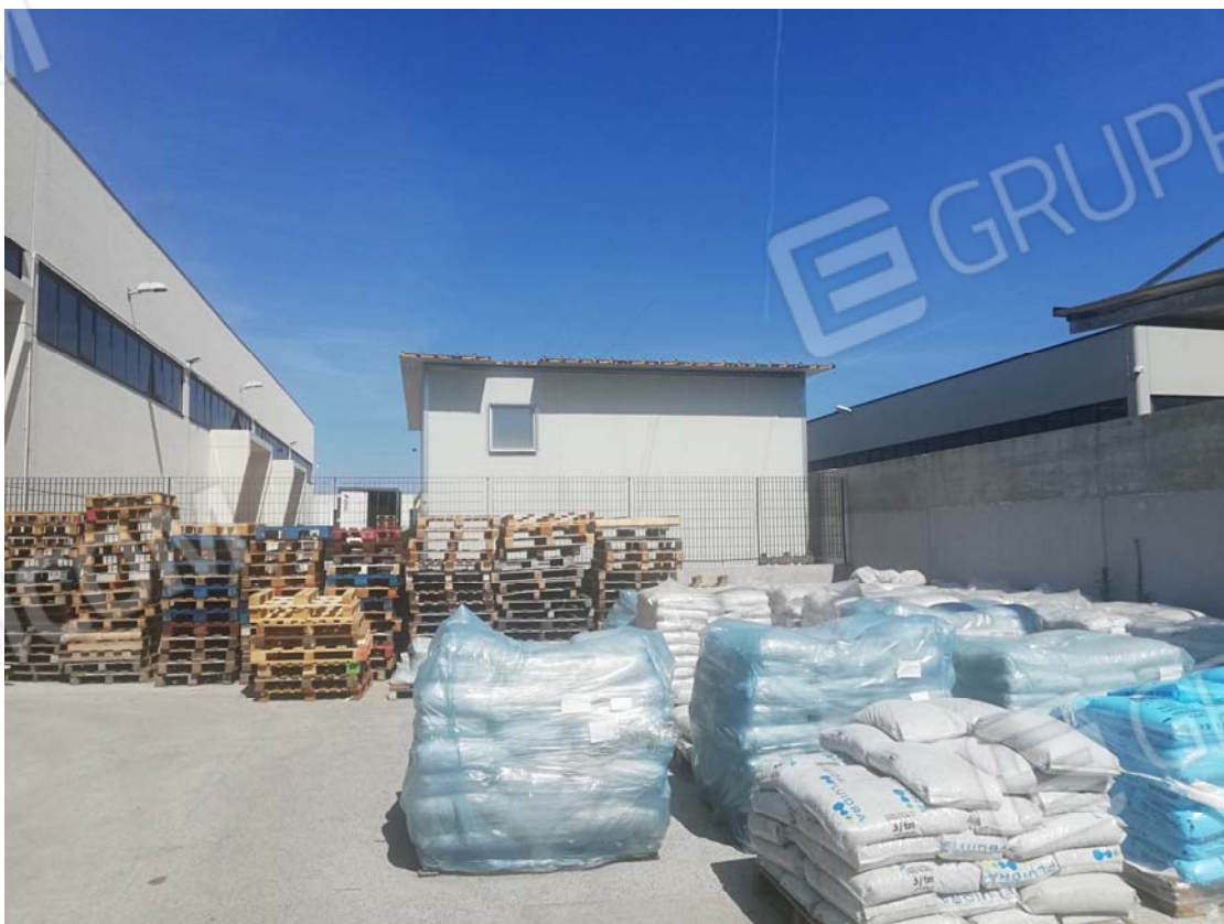
Pertinenza esterna -piano terra