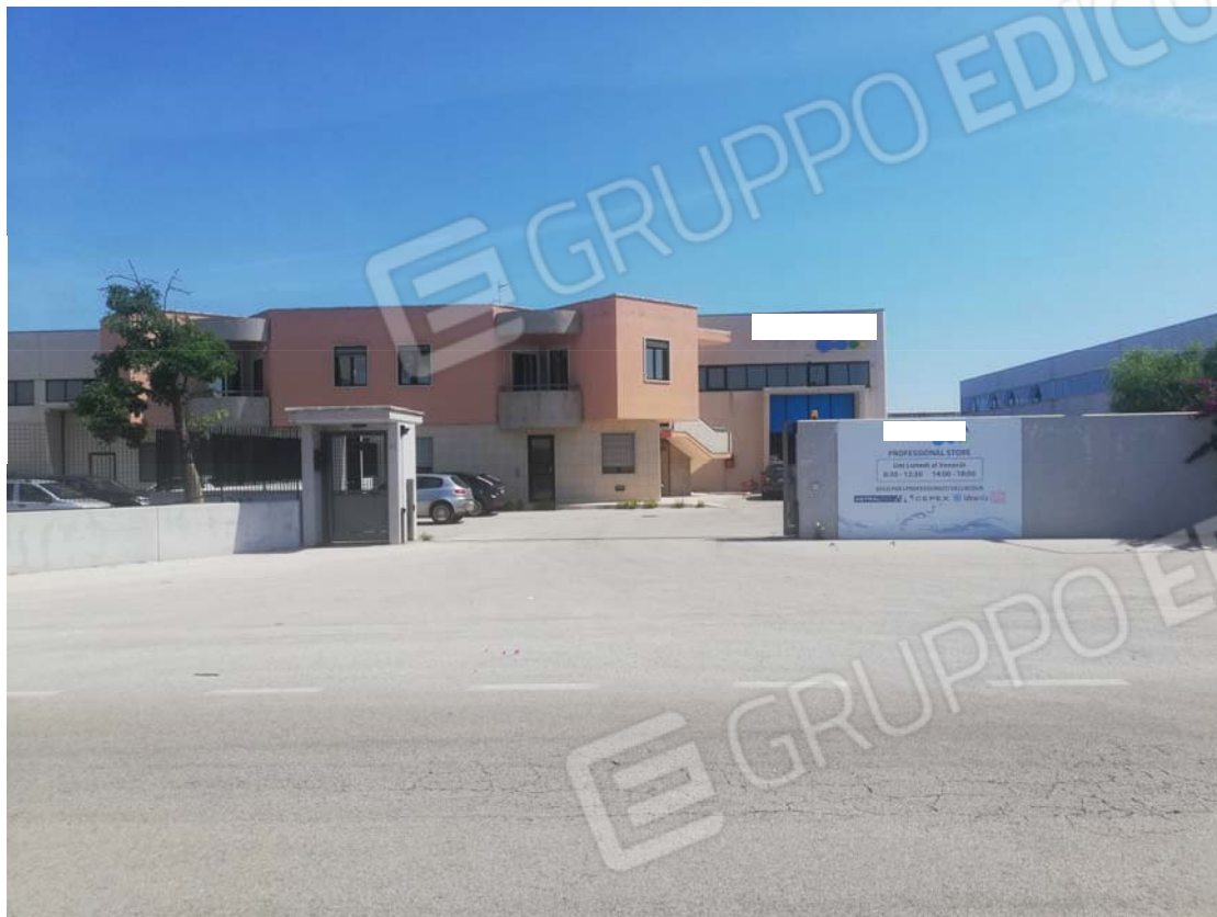
Cancello di accesso