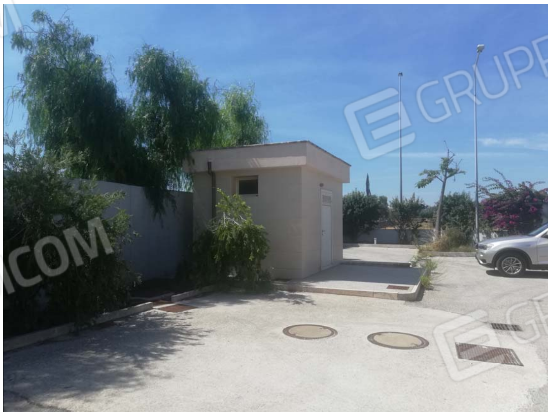
Pertinenza esterna - locale tecnico