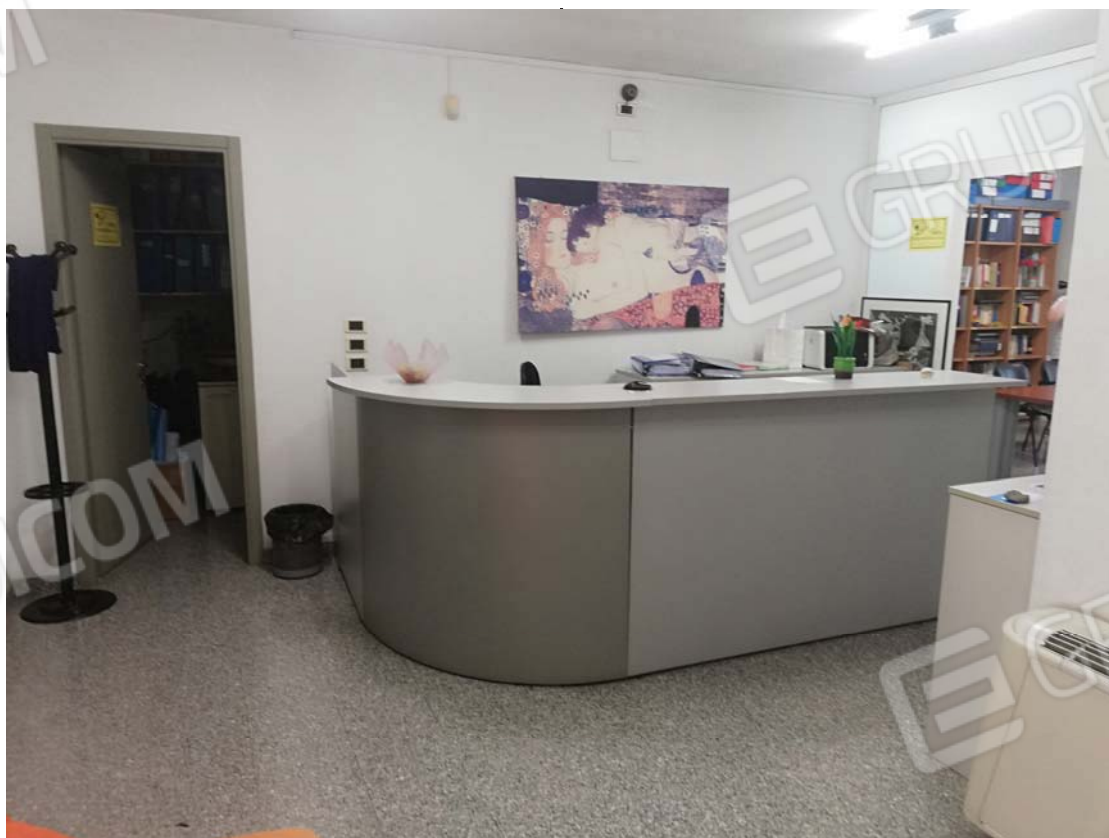
Ambiente reception - ingresso