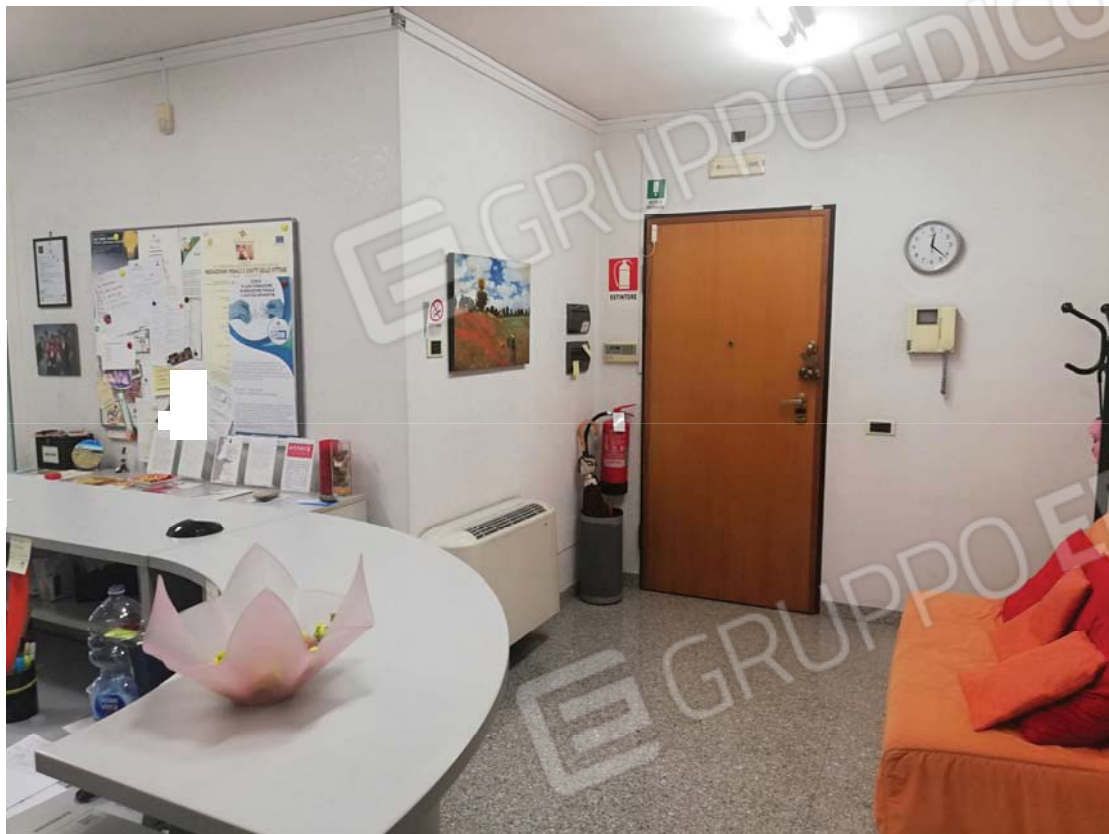
Ambiente reception - ingresso