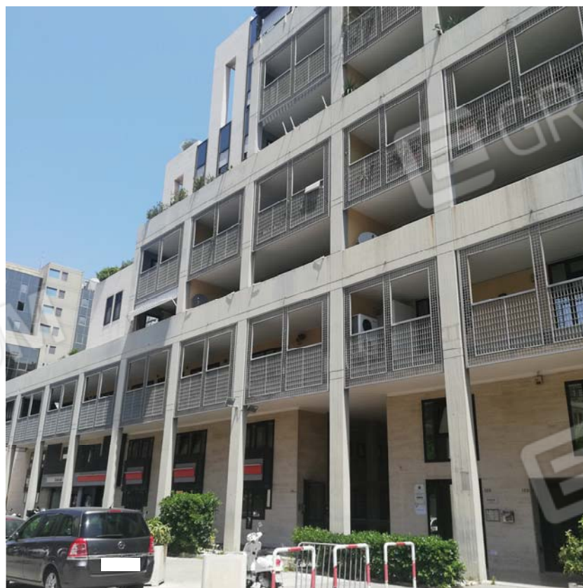
Prospetto dello stabile