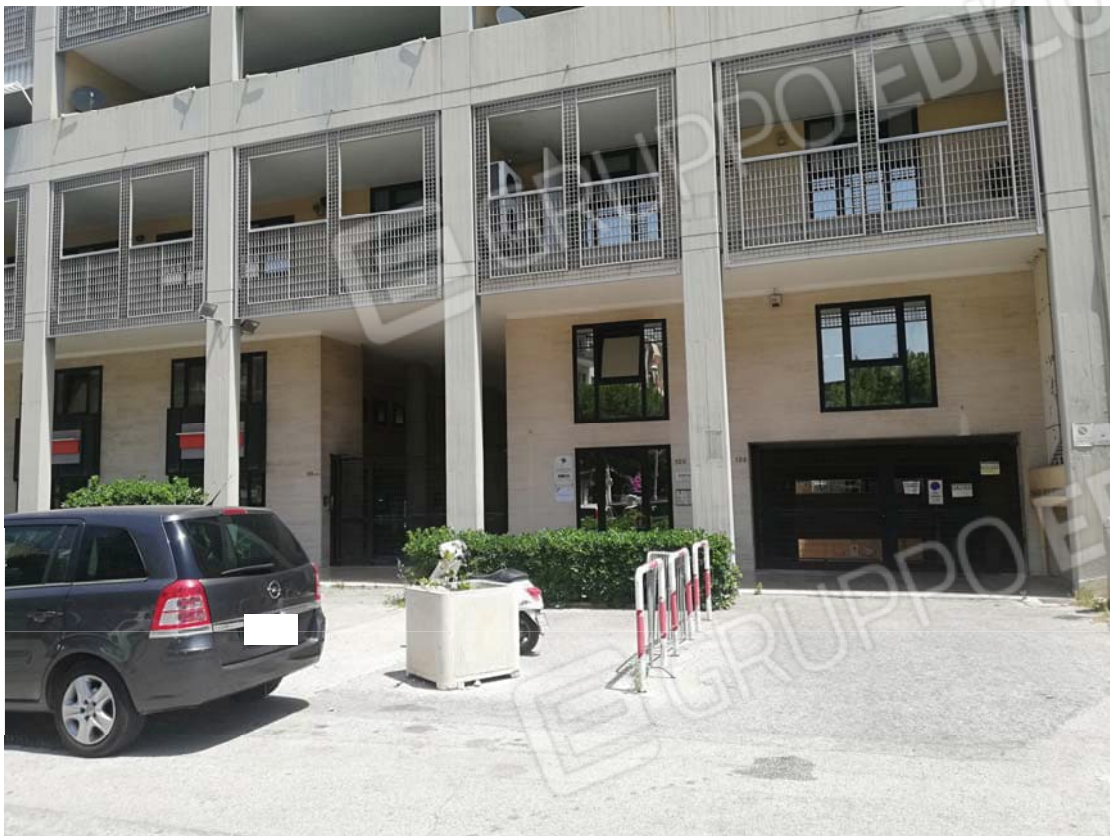
Prospetto dello stabile