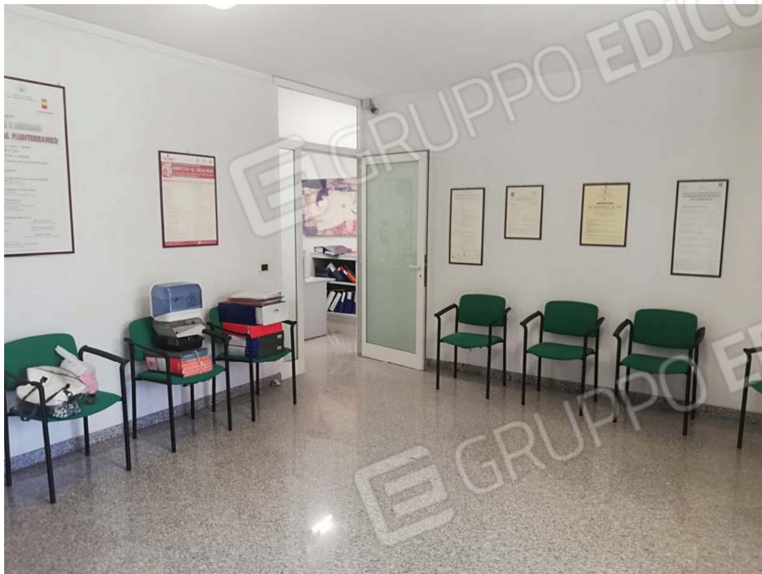
Sala riunioni fronte strada