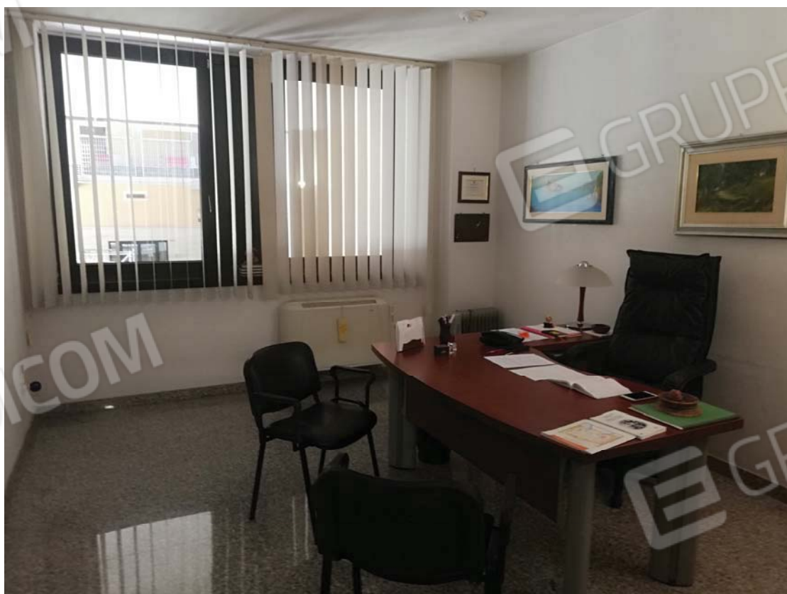
Vano su interno