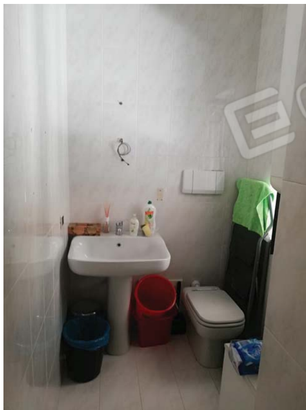
Bagno di servizio