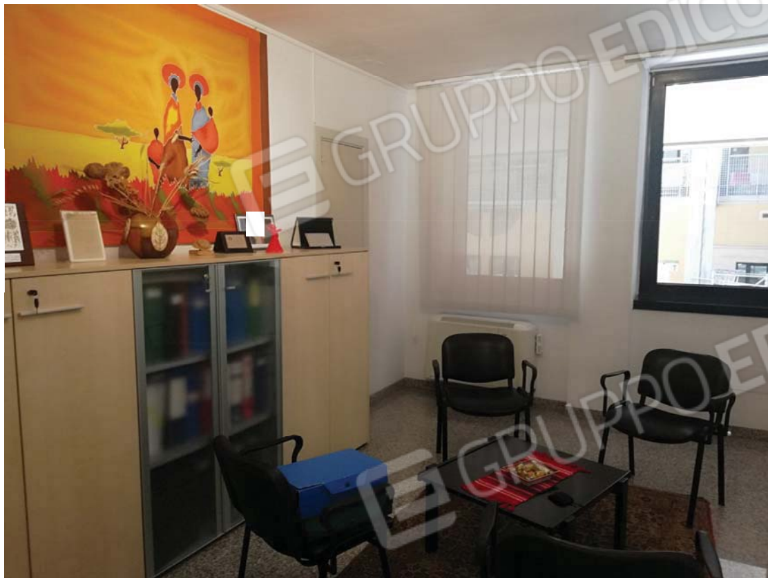
Altro vano su interno