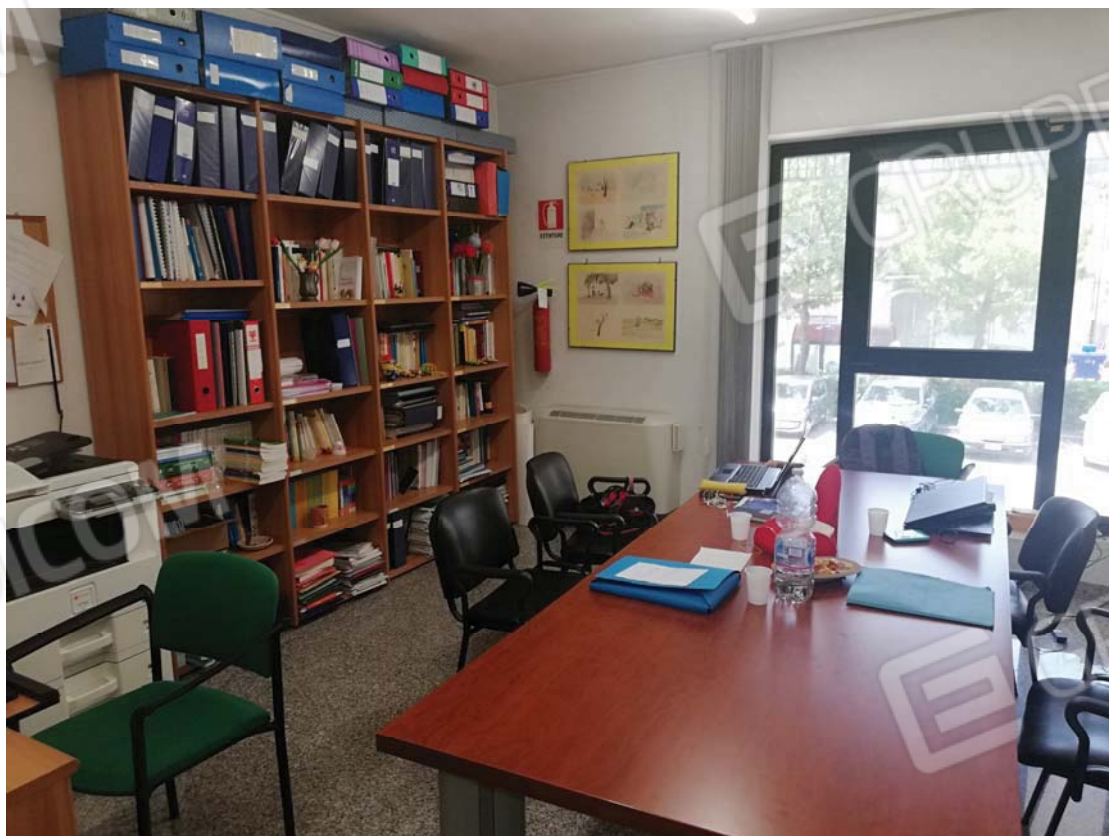
Altro vano fronte strada