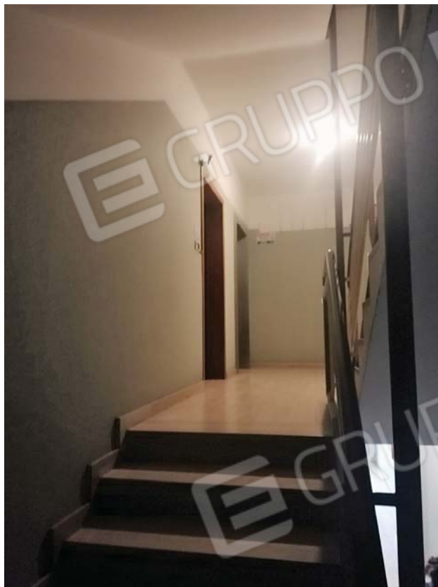
Pianerottolo piano primo