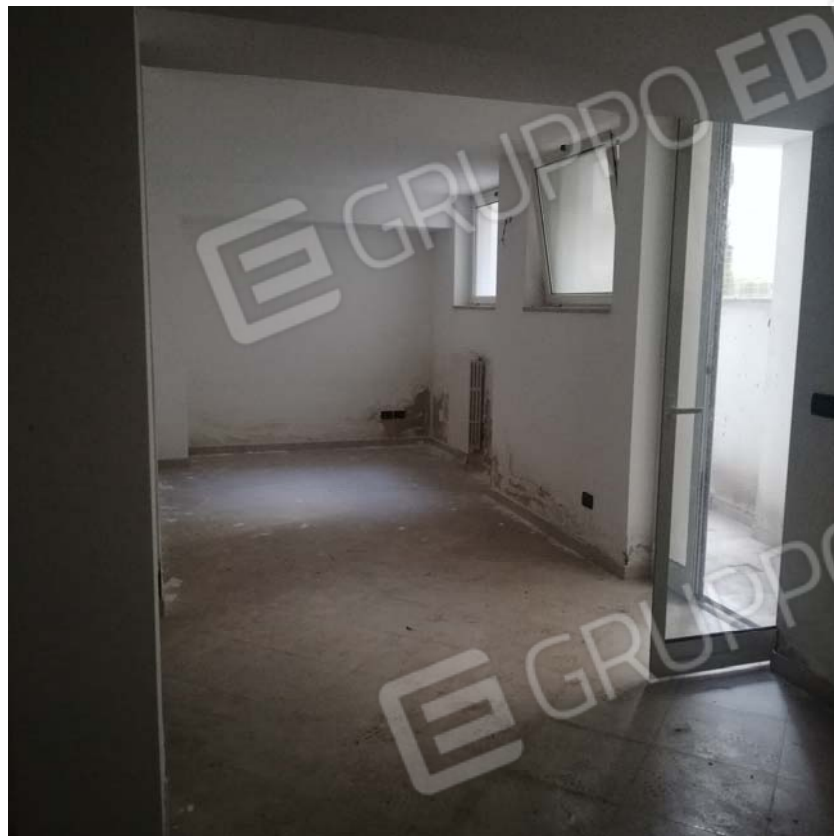
Locale piano interrato