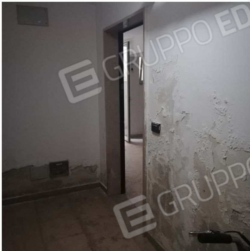
Accesso da pianerottolo piano interrato