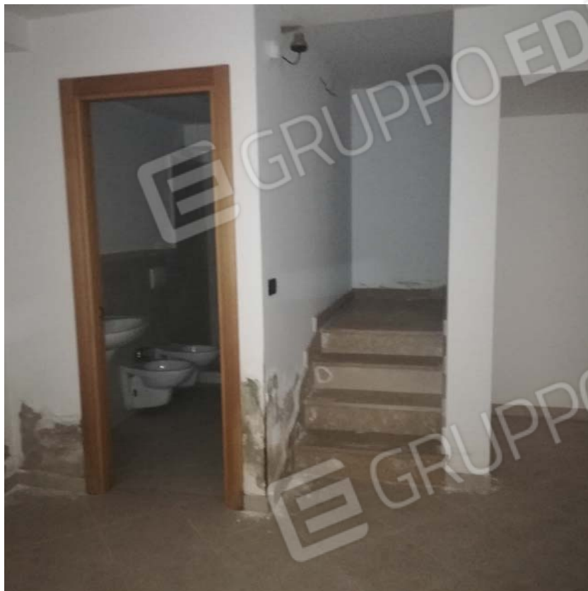
Locale piano interrato con scala al piano primo e bagno