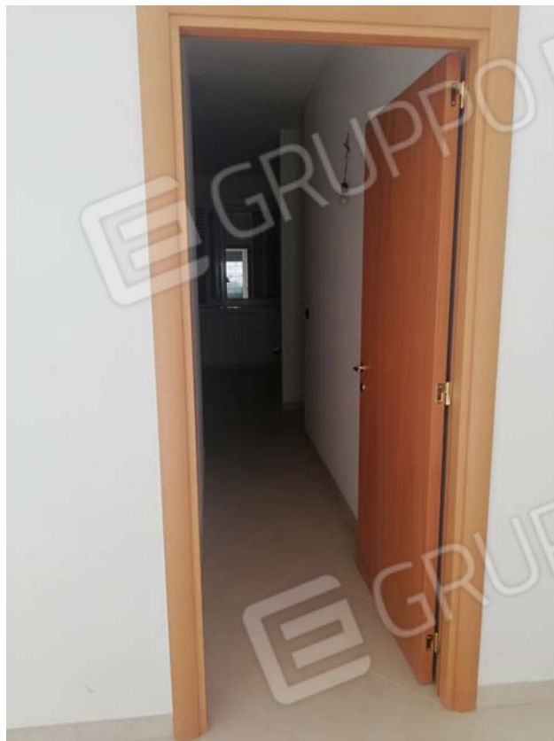
Disimpegno piano terra