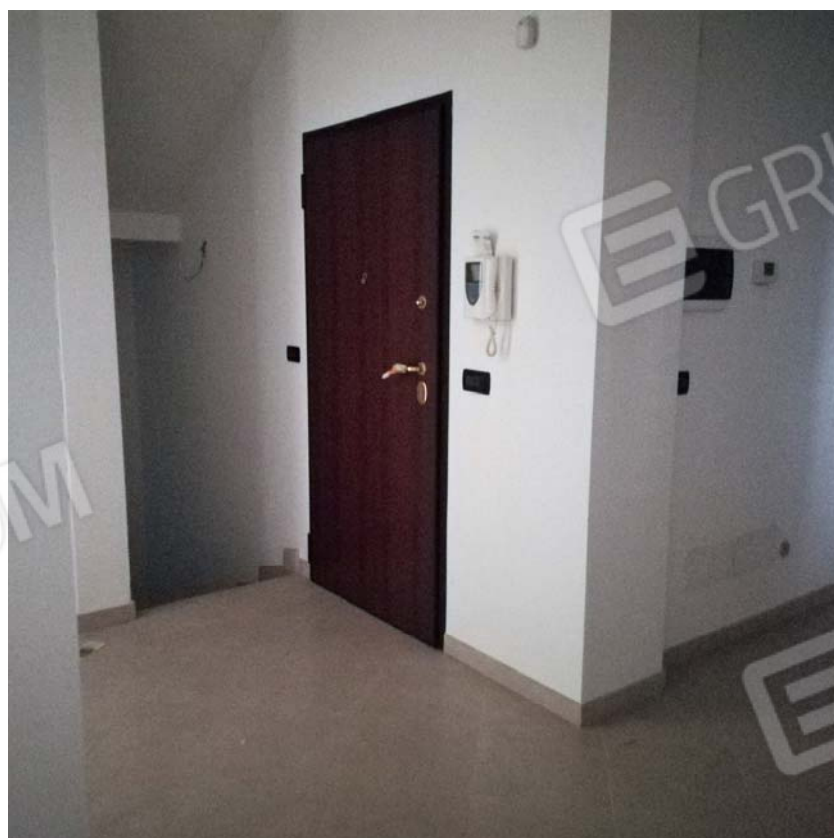
Ingresso piano terra con accesso a scala interna di collegamento con l'interrato