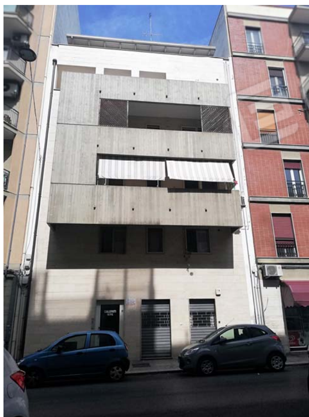
Prospetto dello stabile