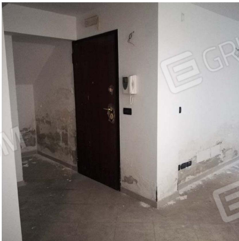
Ingresso piano interrato