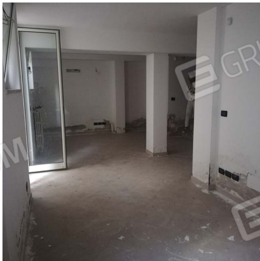
Locale piano interrato