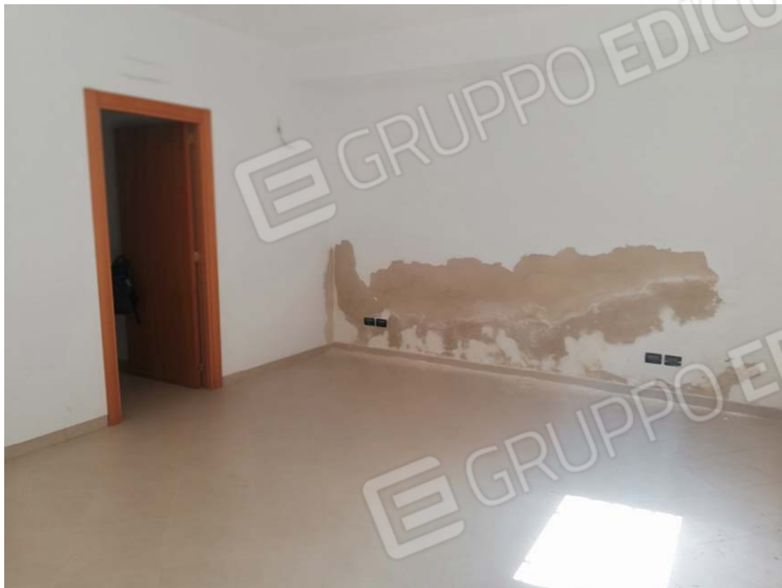
Vano fronte strada piano terra