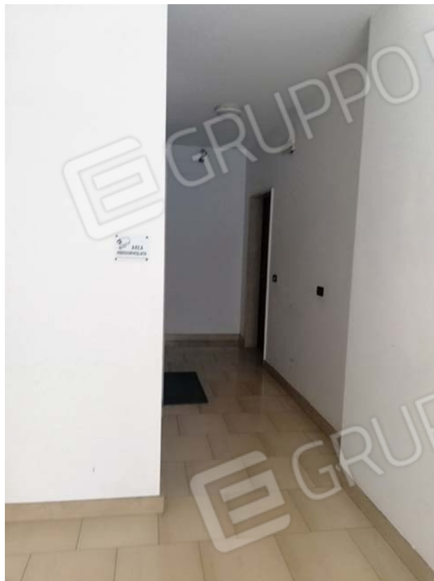
Accesso al piano terra