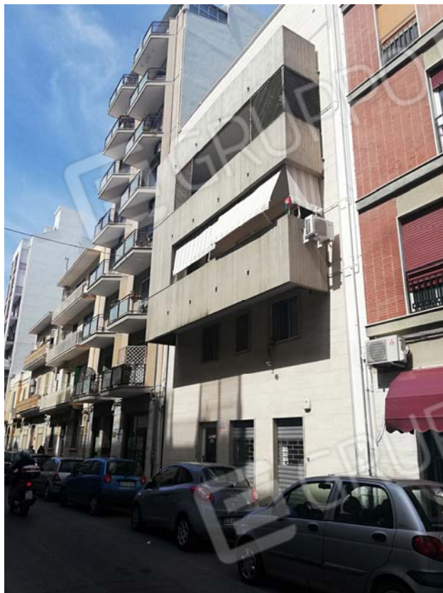
Prospetto dello stabile