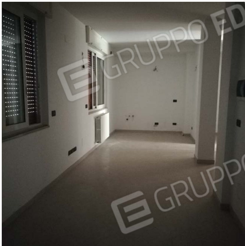
Vano su interno piano terra