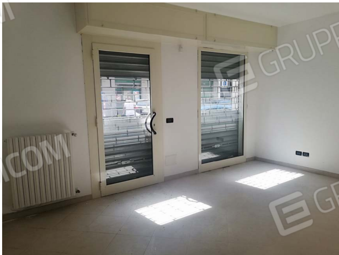
Vano fronte strada piano terra