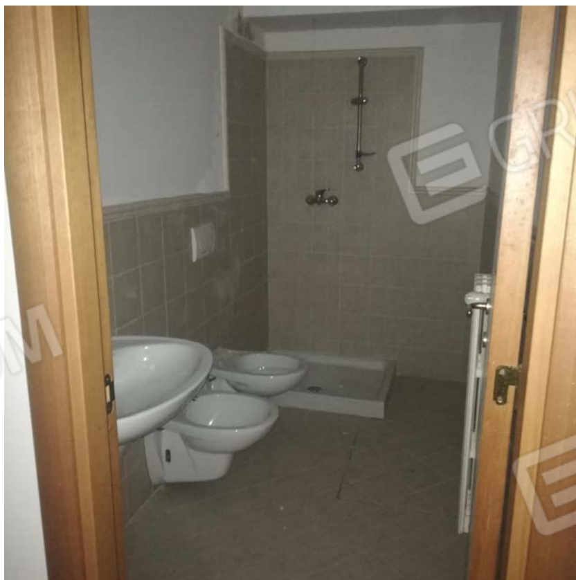
Bagno piano interrato