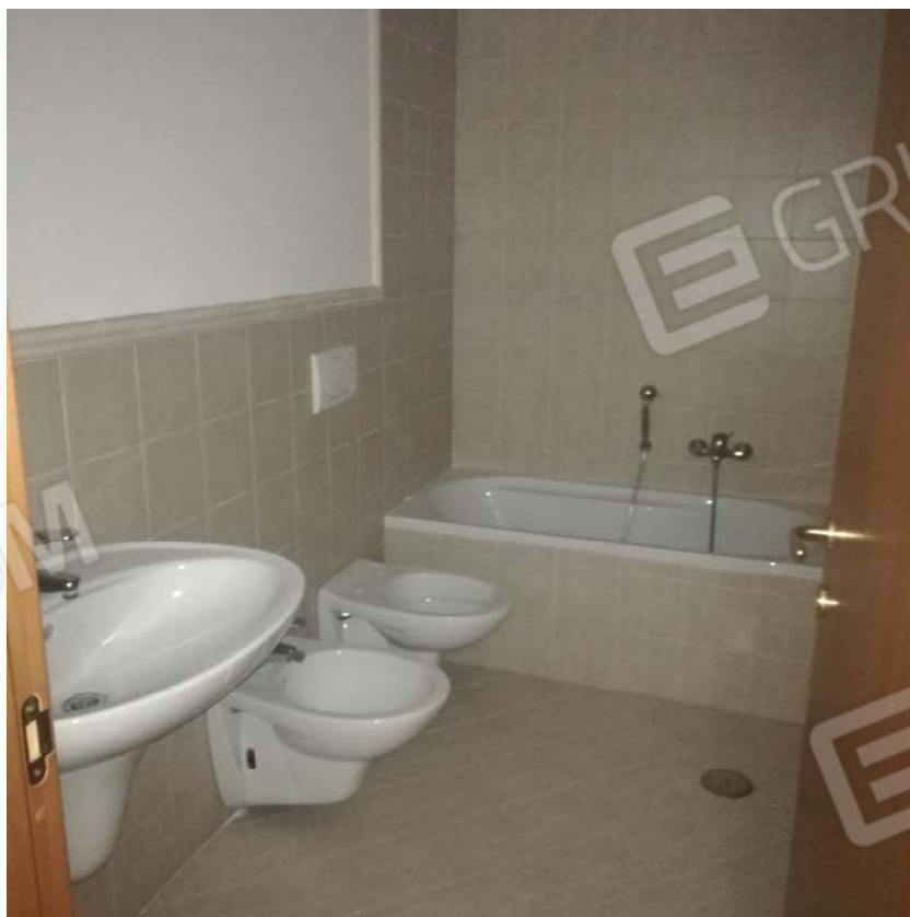
Bagno piano terra