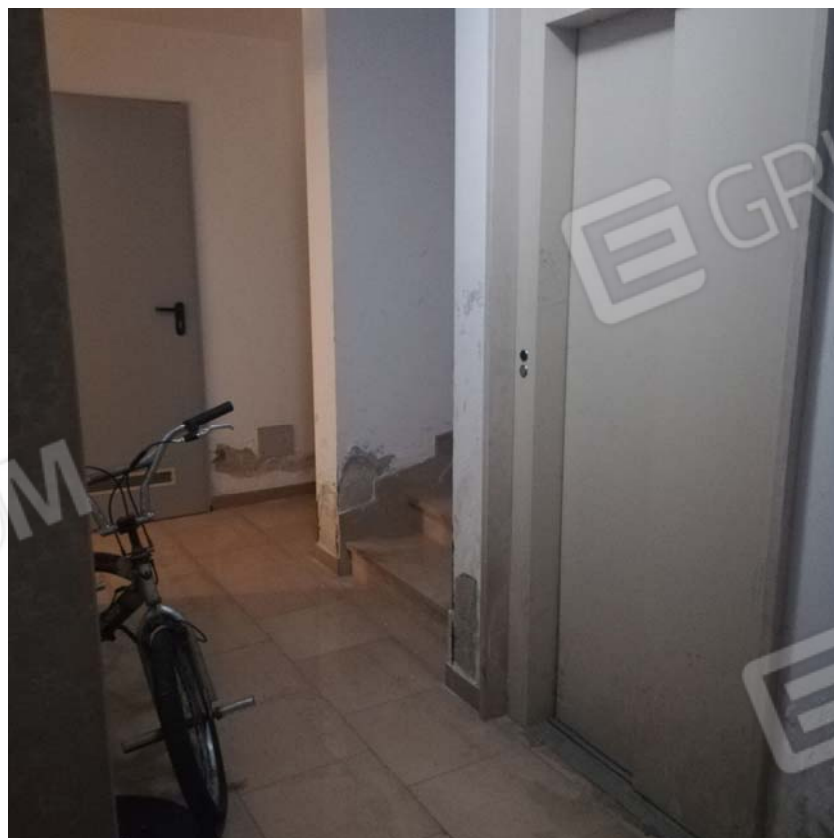
Pianerottolo piano interrato