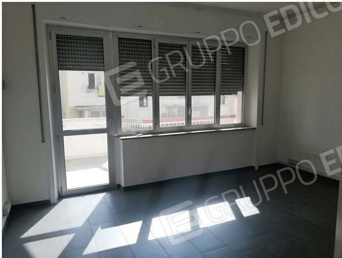
Vano tipo su interno con balcone