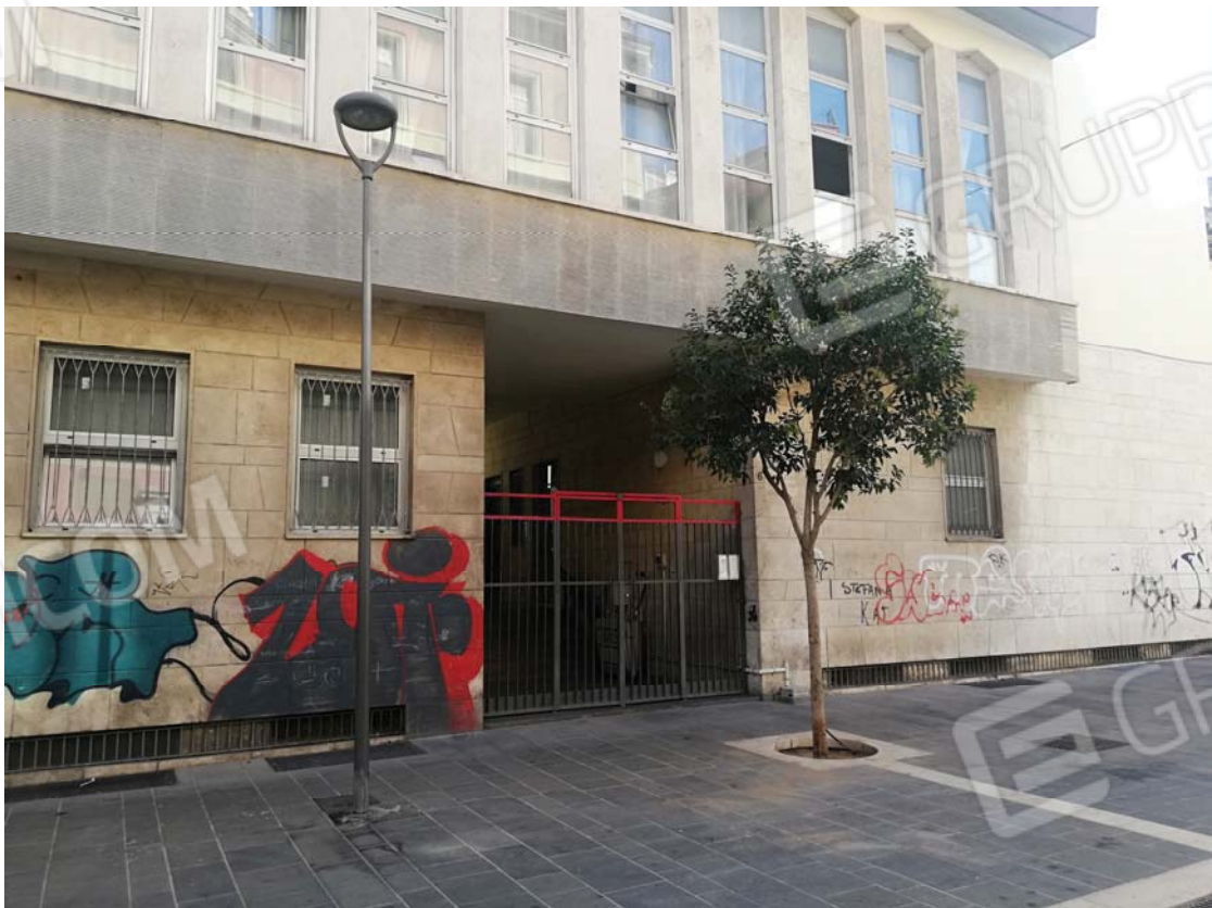
Cancello esterno di cui al civico 6 via Positano