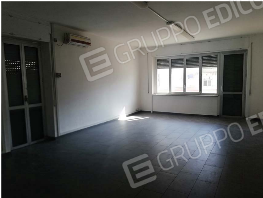
Salone con altro ingresso al civico 6