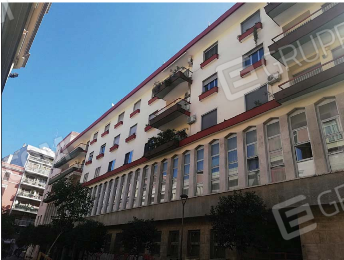
Prospetto dello stabile