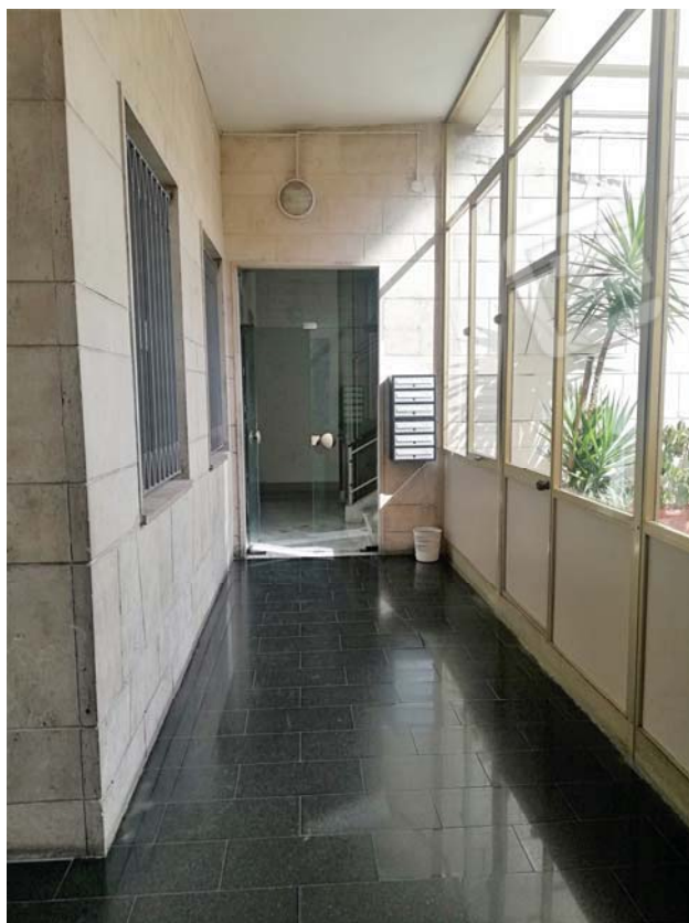
Corridoio di collegamento con vano scale al civico 6