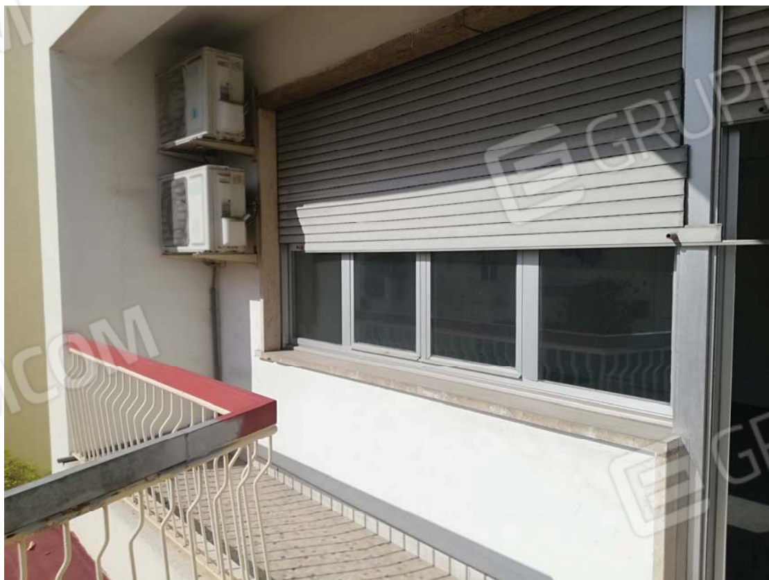
Balcone interno tipo