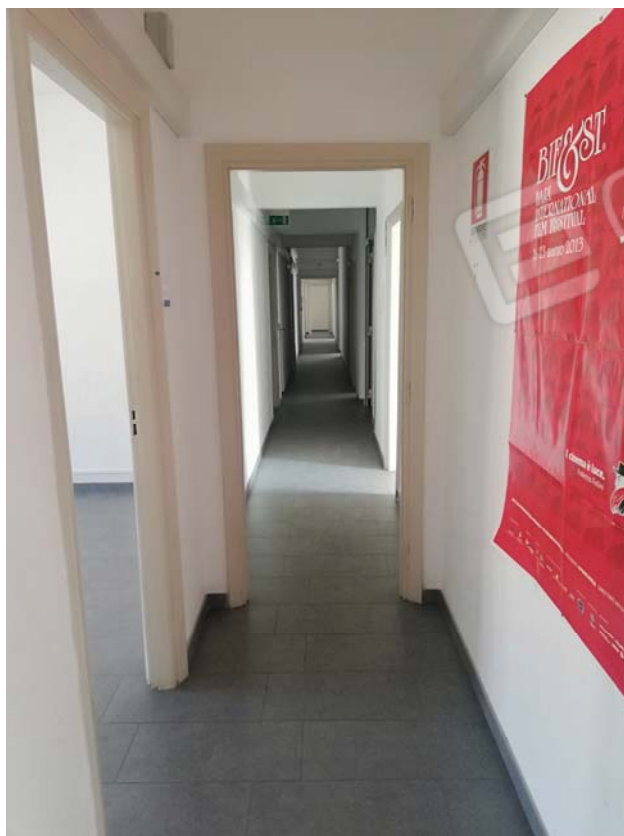
Disimpegno e corridoio