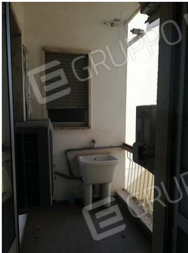
Balconcino interno tipo