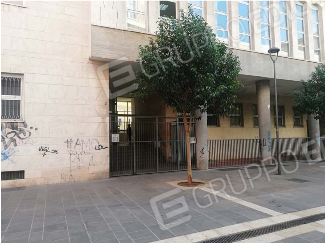
Cancello esterno di cui al civico 2 via Positano