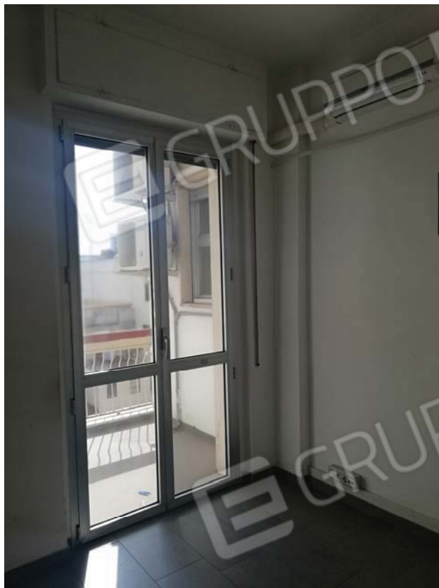
Vano tipo su interno con balconcino