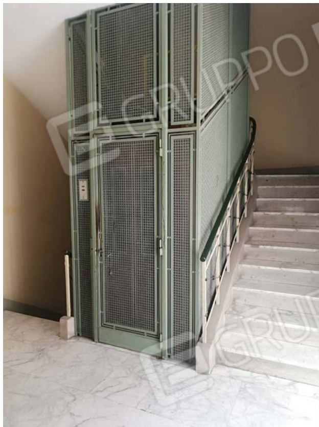
Vano scale al civico 6