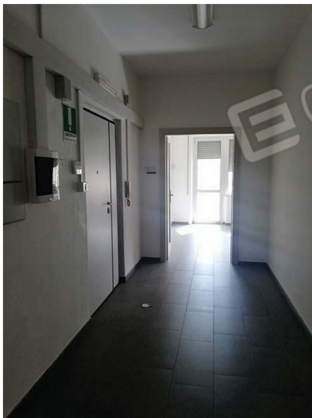
Ingresso di cui al civico 2