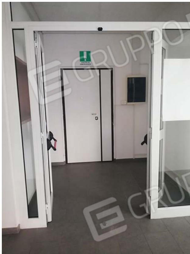
Ingresso al civico 6