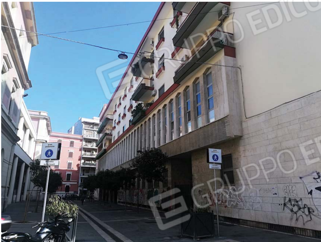
Prospetto dello stabile