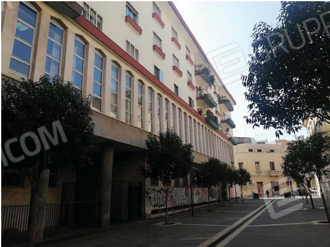
Prospetto dello stabile