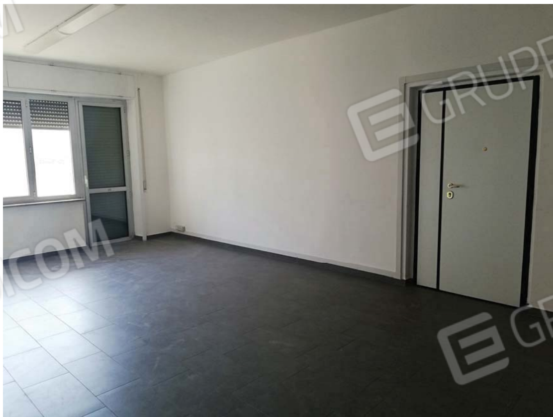
Salone con altro ingresso al civico 6