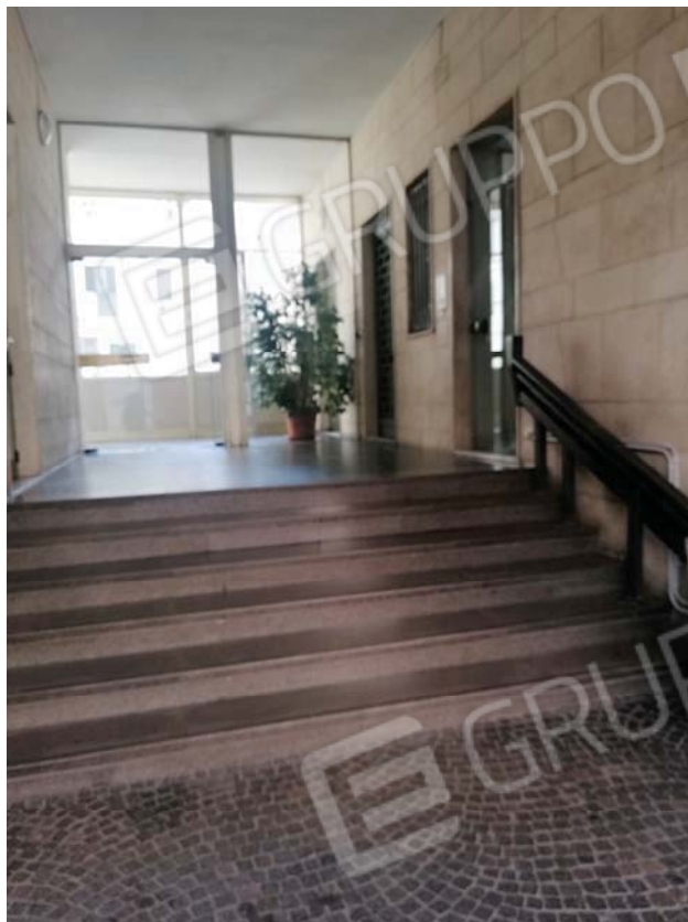
Androne al civico 6