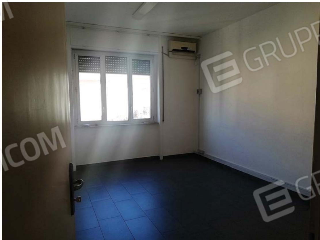
Vano tipo su esterno