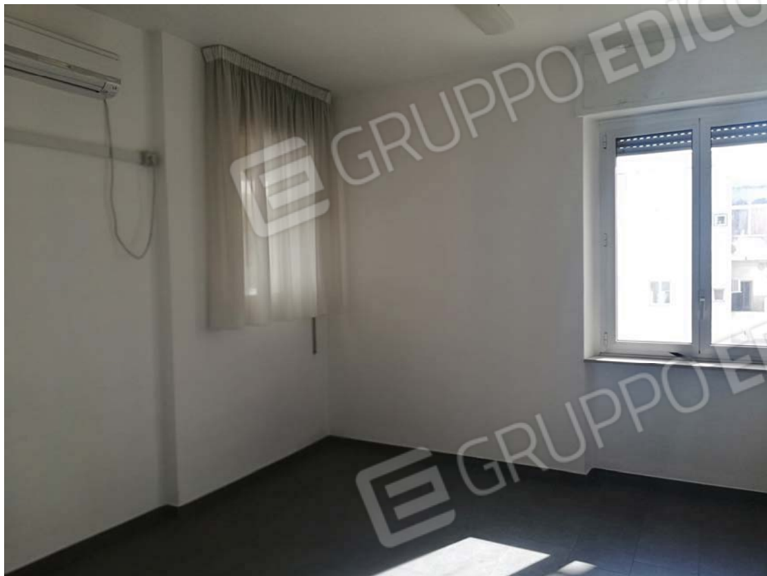
Vano tipo su interno