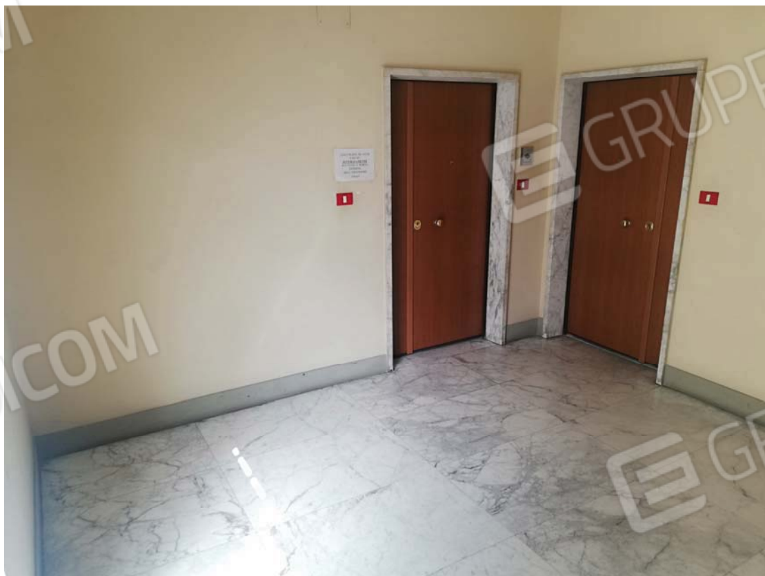
Pianerottolo al civico 6