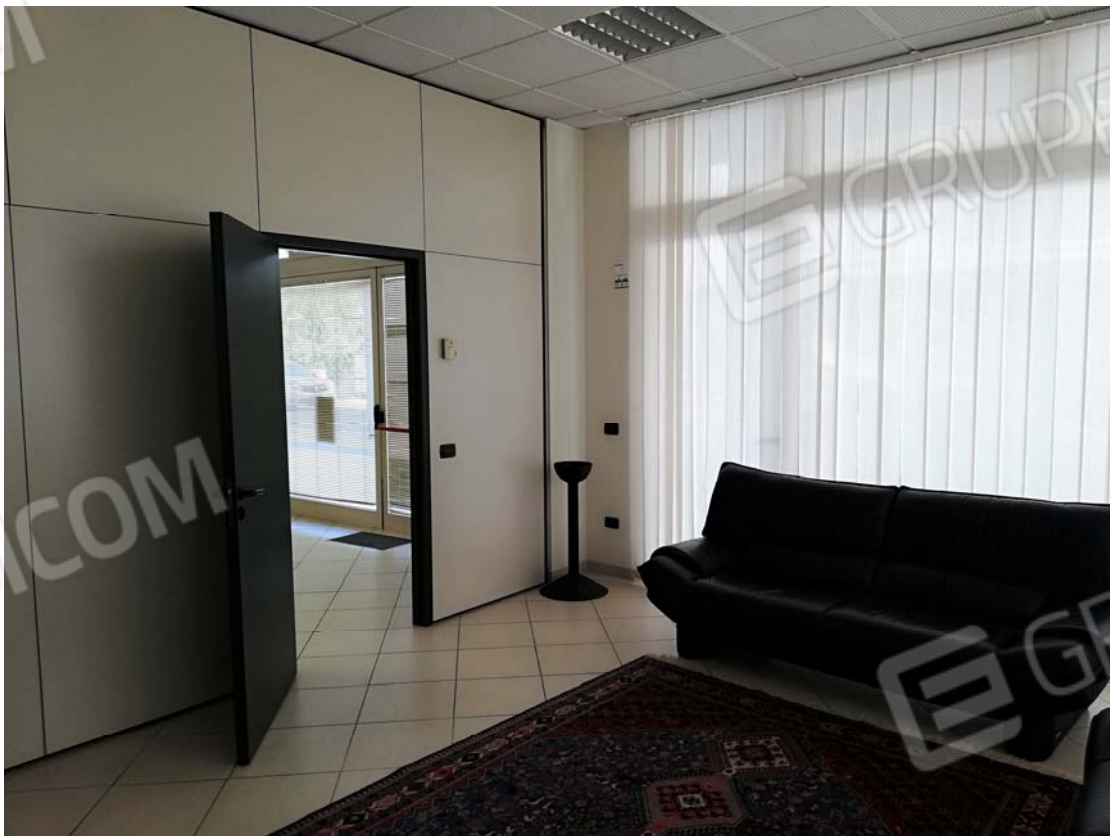
Vano sala aspetto