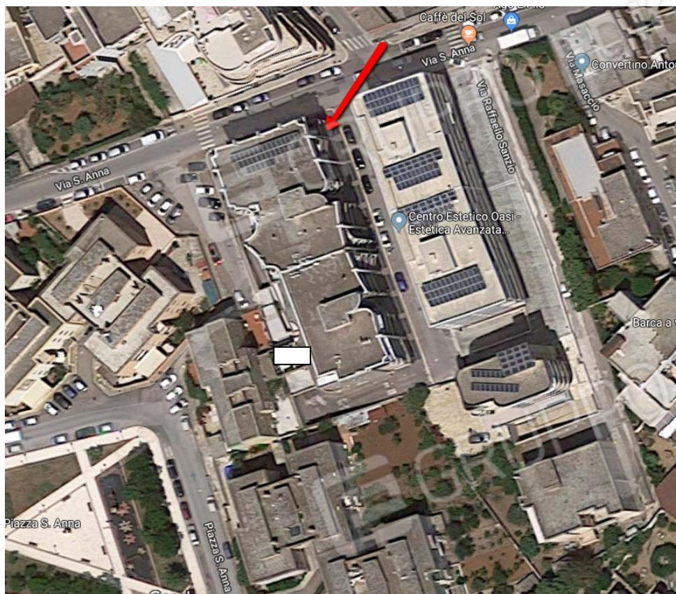
Ortofoto con posizione