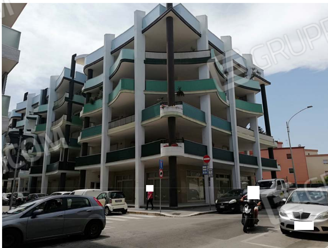
Prospetto del fabbricato