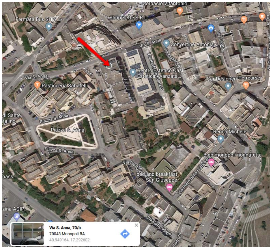
Ortofoto con coordinate