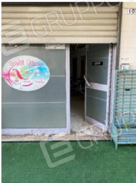
Figura 1: Ingresso locale commerciale

Perizia - Lotto E - Rilievo Fotografico Tribunale di Bari - E.I. - n. 420/2021 R.G.E.