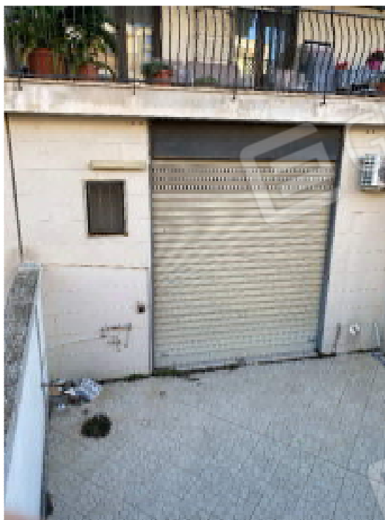
Figura 8: Atrio

Ing. Michele MITOLA - via Imbriani n.36, 70026 Modugno (BA) - michele.mitola@ingpec.eu