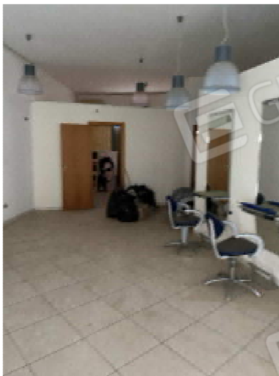
Figura 2: Ambiente unico - 1

Ing. Michele MITOLA - via Imbriani n.36, 70026 Modugno (BA) - michele.mitola@ingpec.eu