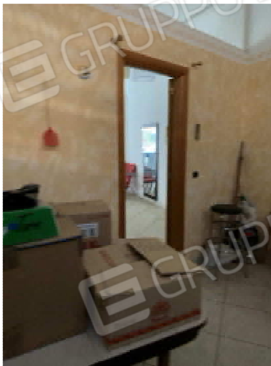
Figura 5: Ripostiglio - 2

Perizia - Lotto E - Rilievo Fotografico Tribunale di Bari - E.I. - n. 420/2021 R.G.E.