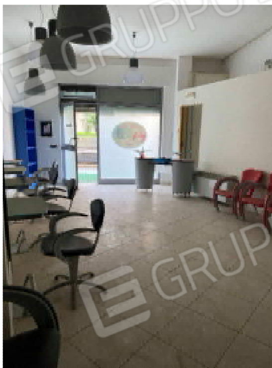
Figura 3: Ambiente unico - 2

Perizia - Lotto E - Rilievo Fotografico Tribunale di Bari - E.I. - n. 420/2021 R.G.E.