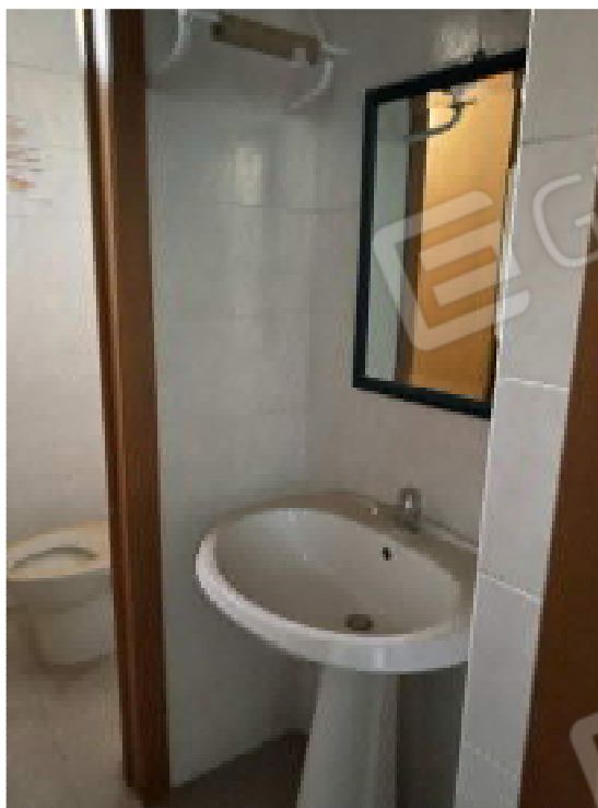
Figura 6: Locale bagno

Ing. Michele MITOLA - via Imbriani n.36, 70026 Modugno (BA) - michele.mitola@ingpec.eu