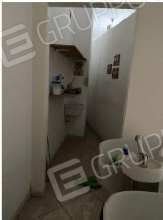
Figura 7: Ambiente servizio ricavato

Perizia - Lotto E - Rilievo Fotografico Tribunale di Bari - E.I. - n. 420/2021 R.G.E.