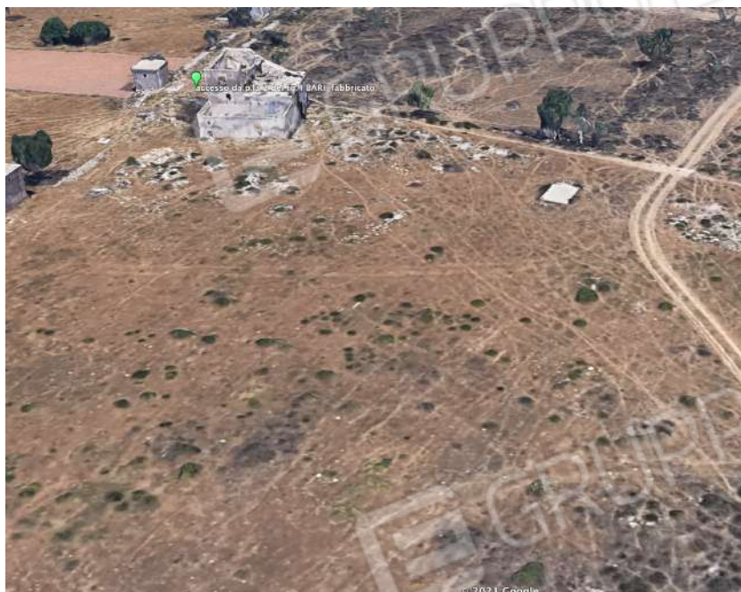
3. ubicazione fabbricato p.la 2 su ortofoto

Tribunale di Bari Ufficio Esecuzioni Immobiliari Proc. Esecuzione n°150/2020 R.G.Esec.