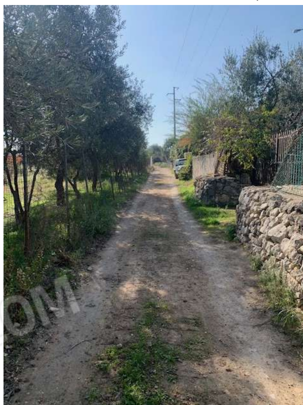
4. strada vicinale accesso a Nord

L'Esperto Stimatore dott. agr. Elena Barbone