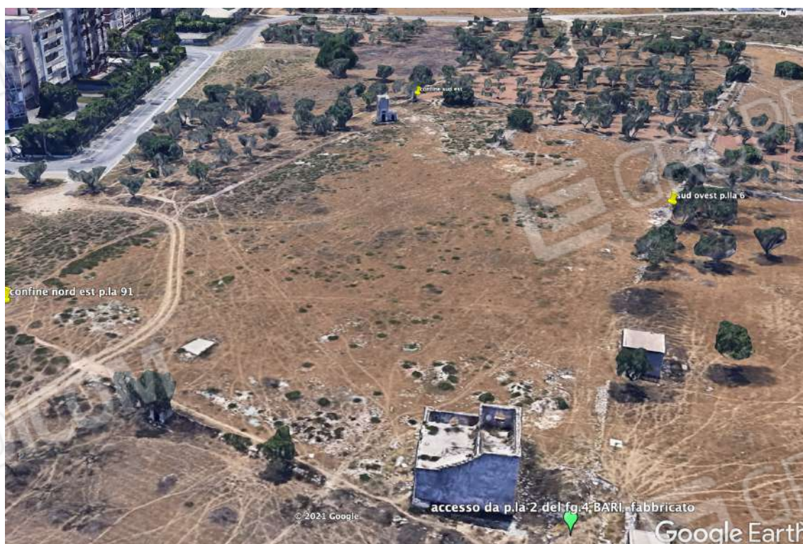
6. Ortofoto da Google Earth con fabbricati rurali