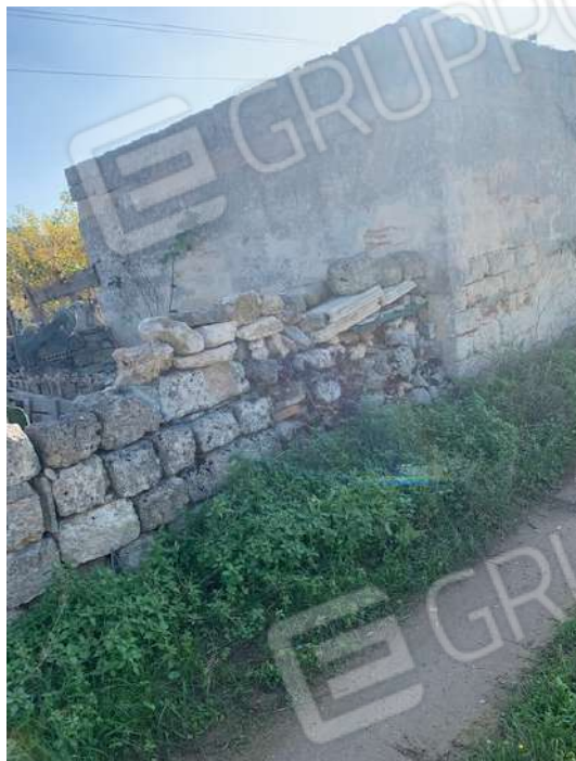
5. fabbricato rurale su strada vicinale accesso a Nord

Tribunale di Bari Ufficio Esecuzioni Immobiliari Proc. Esecuzione n°150/2020 R.G.Esec.