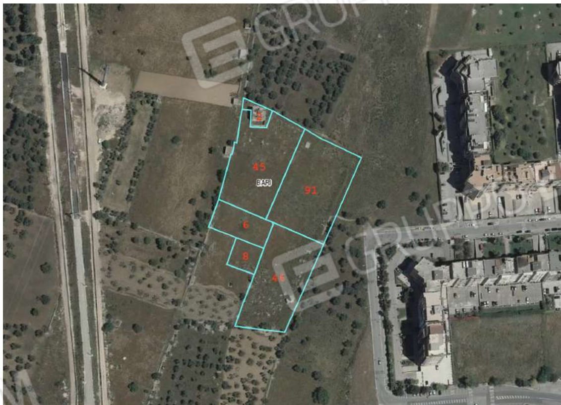
1-2 . ubicazione su ortofoto particelle catastali e confini