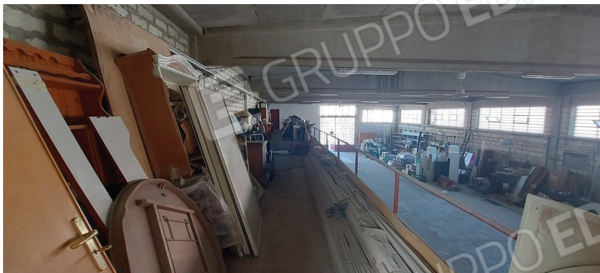
Soppalco sul lato longitudinale