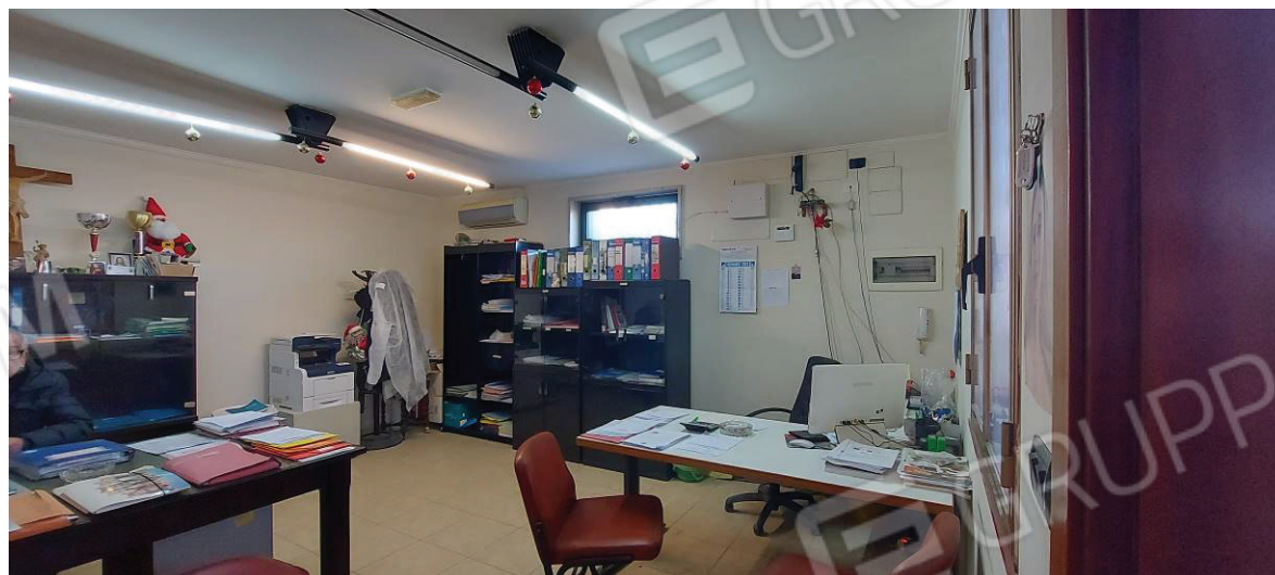
Ufficio al piano terra