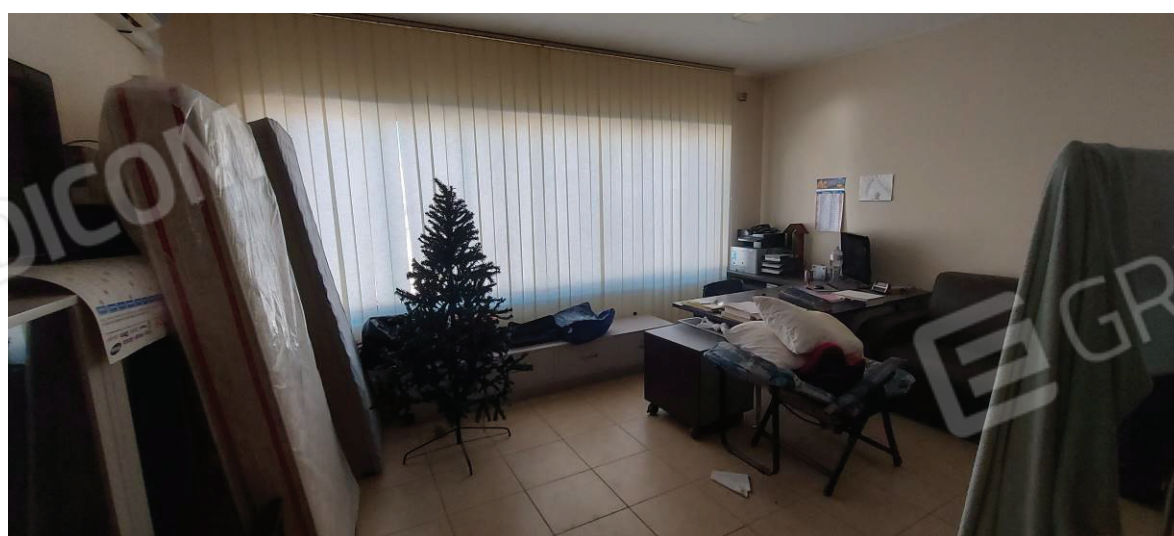
Locale sul soppalco in corrispondenza dell'ufficio