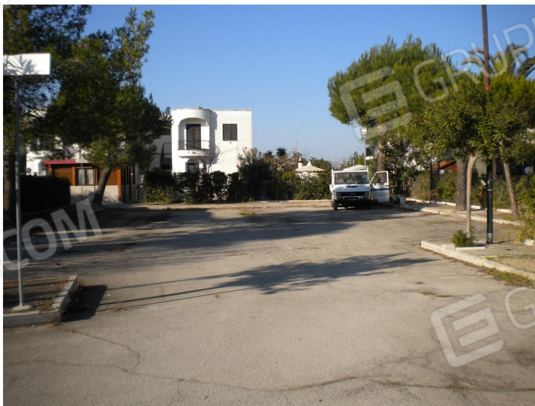
Parcheggio auto part. 1081