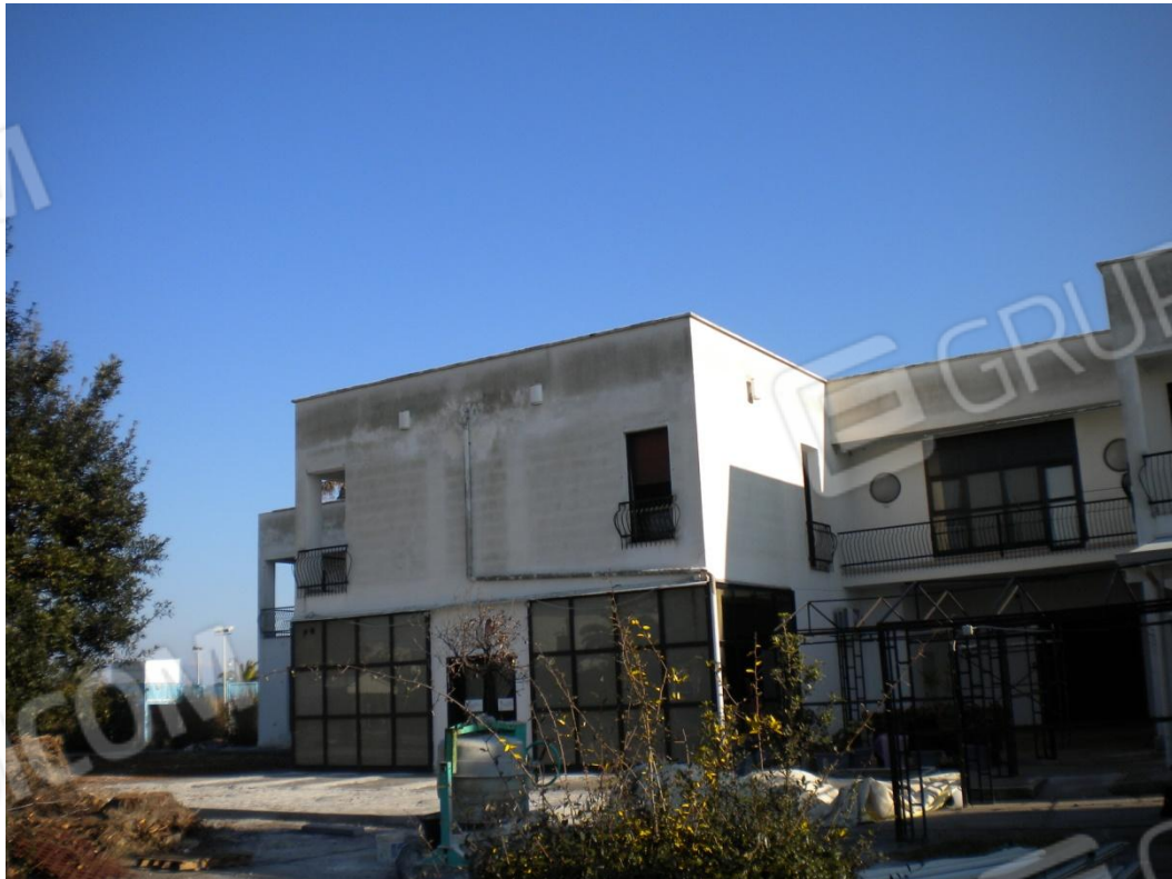
Prospetto principale dell'albergo