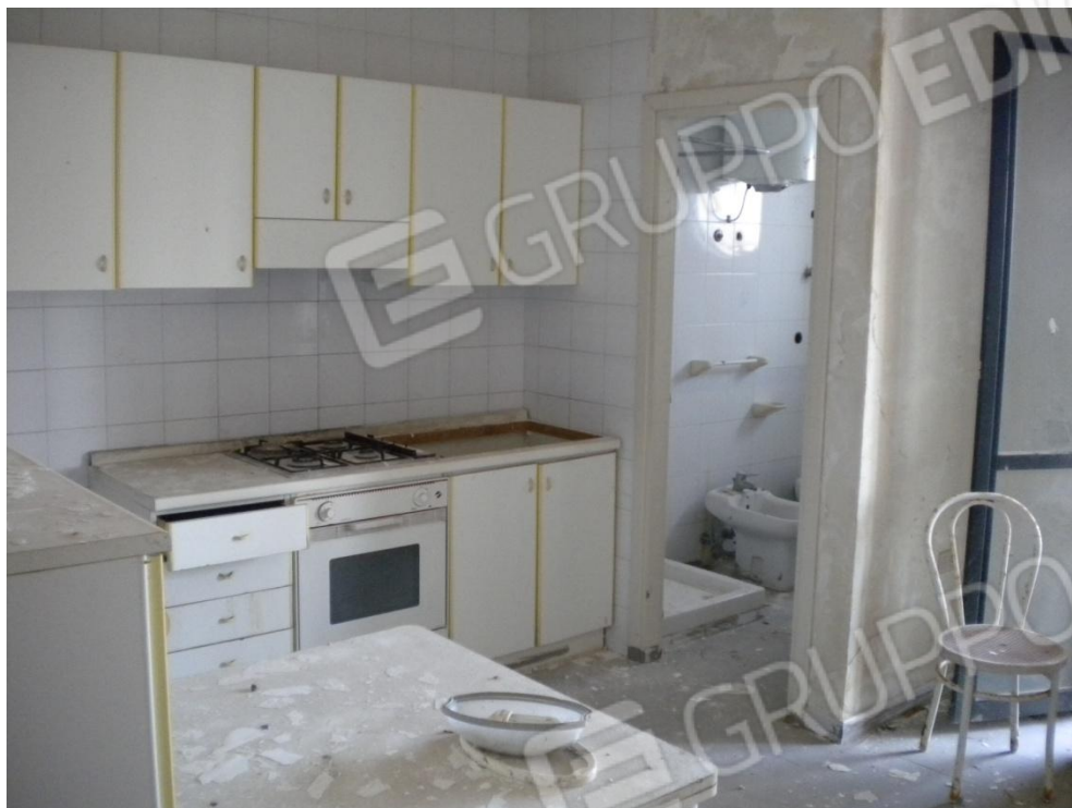
Interno di una camera