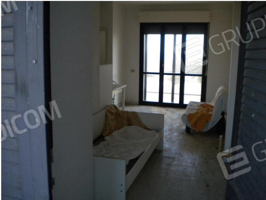
Interno di una camera