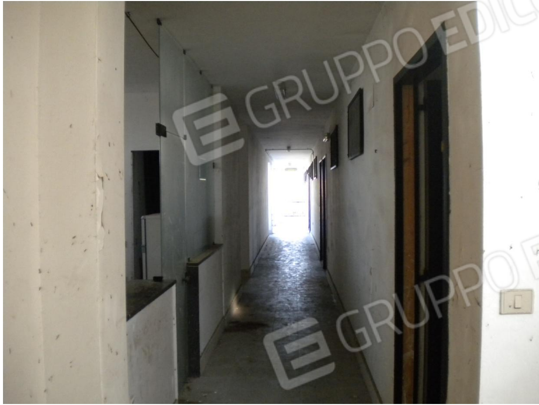
Corridoio e camere