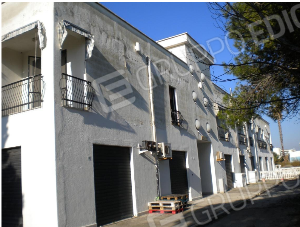
Prospetto posteriore lato mare