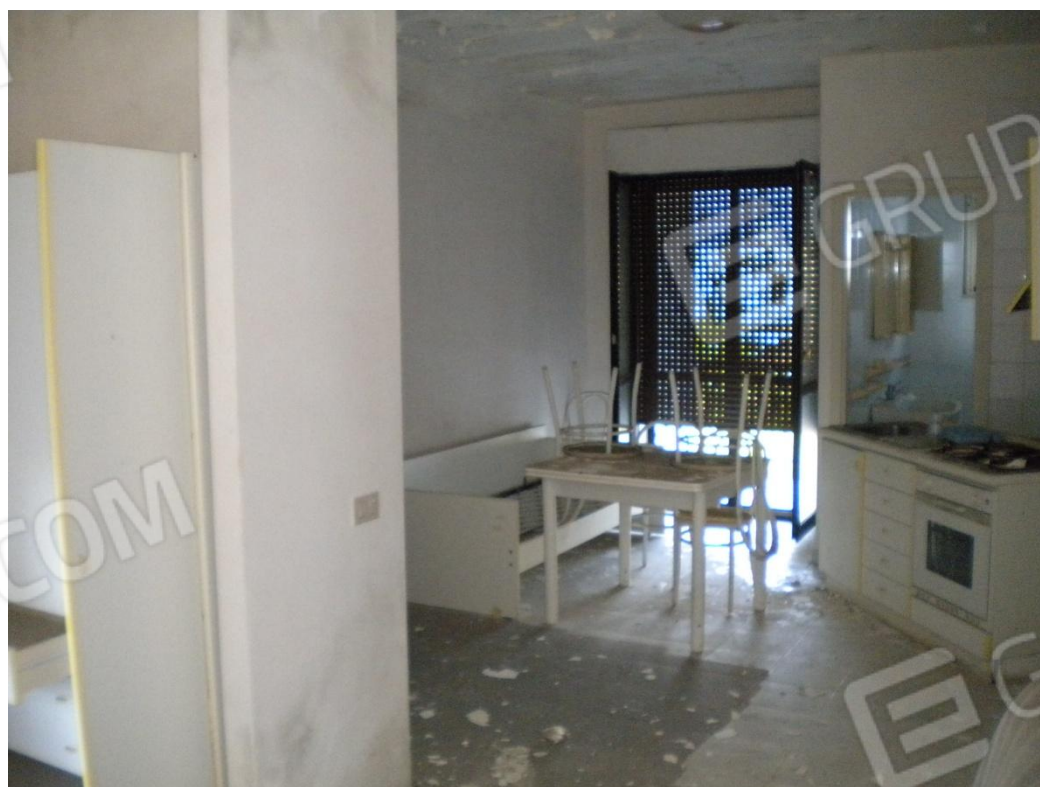
Interno di una camera