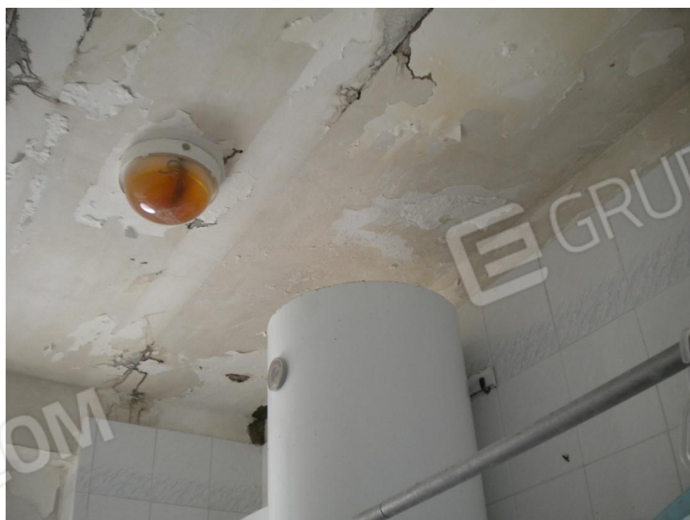
Particolari del soffitto, con evidenti tracce di umidità