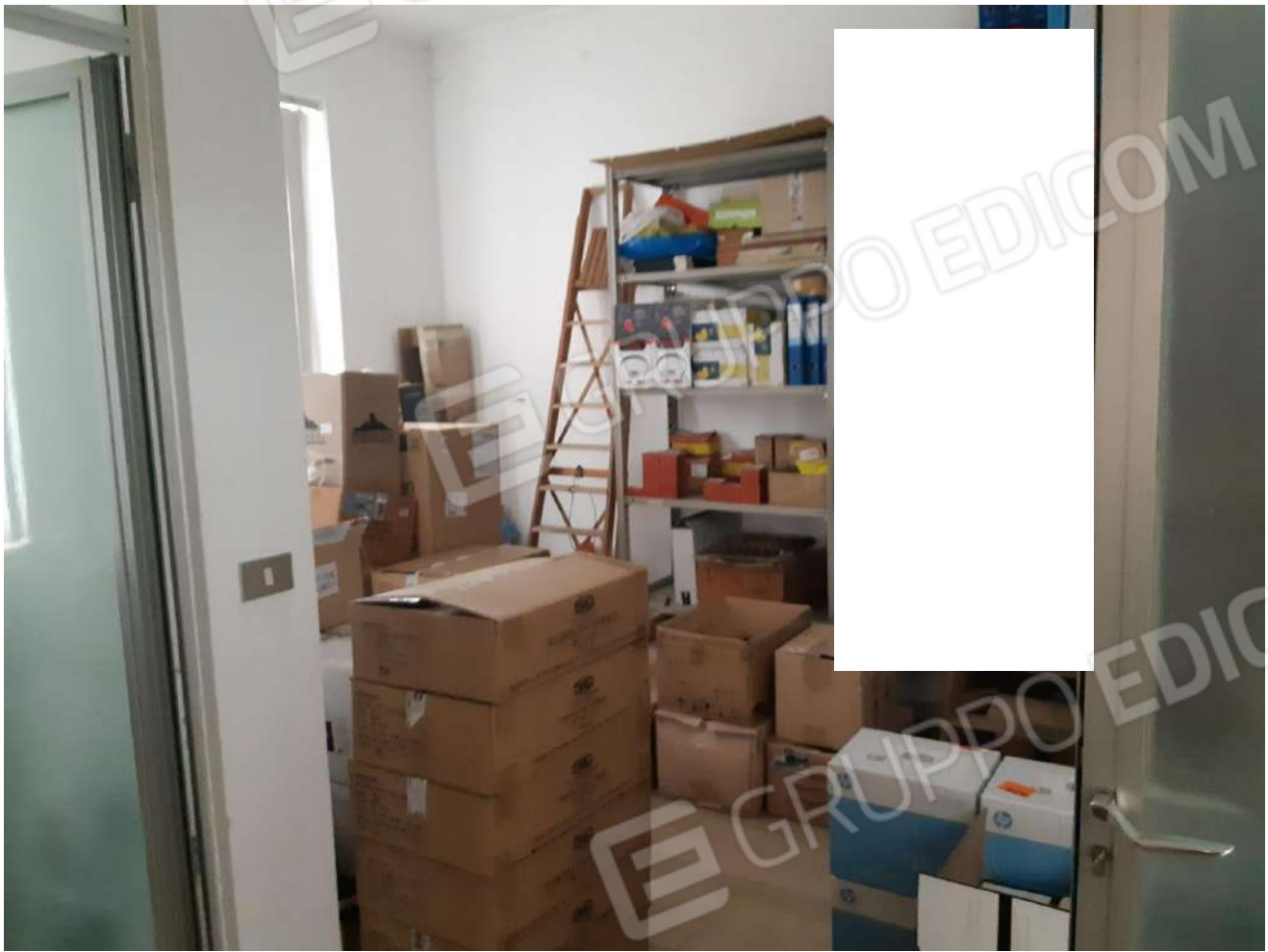
Locali adibiti a deposito piano terra