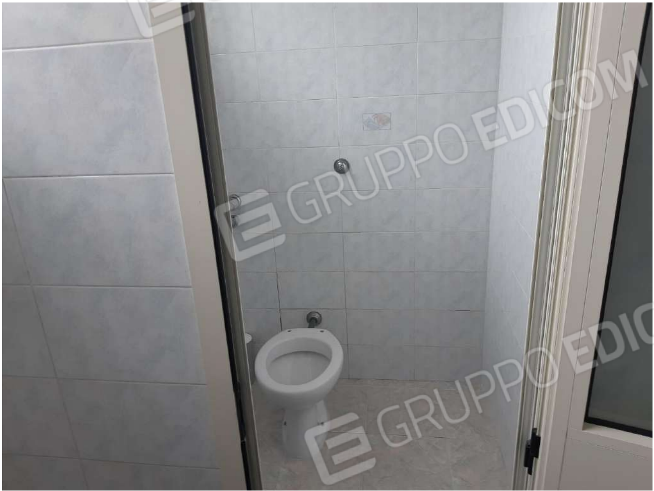
Servizi igienici piano terra