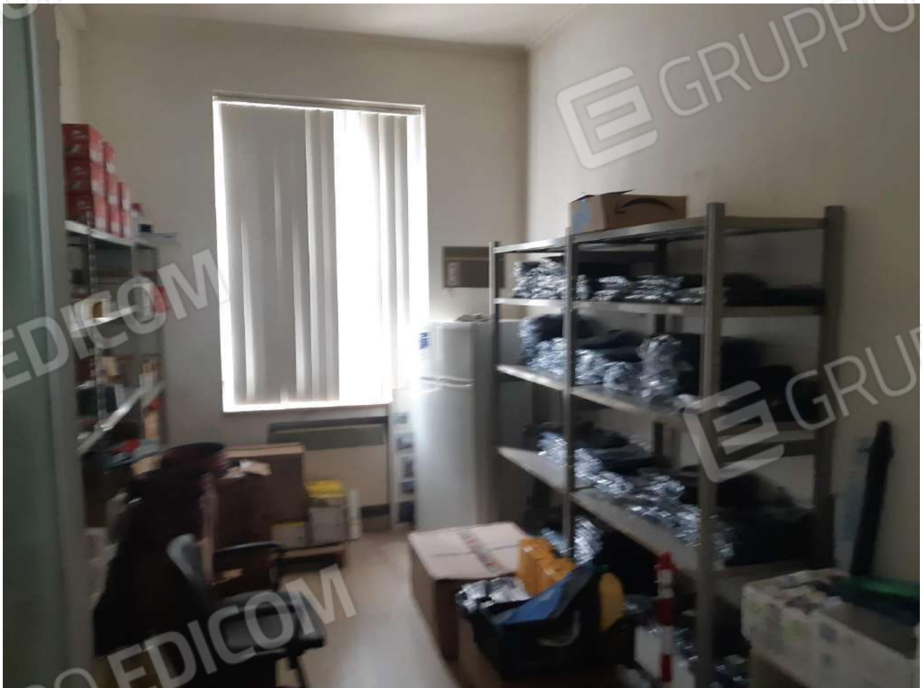
Locali adibiti a deposito piano terra