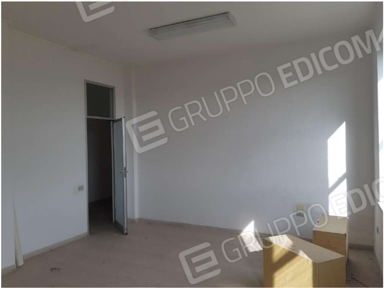
Locali primo piano