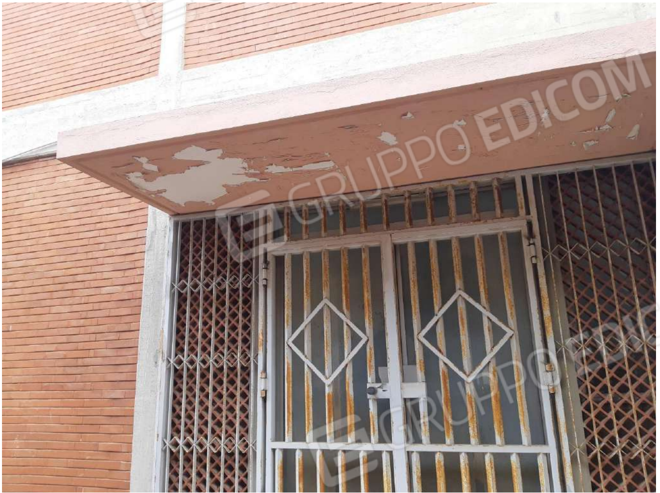
Ingresso posteriore lato sud