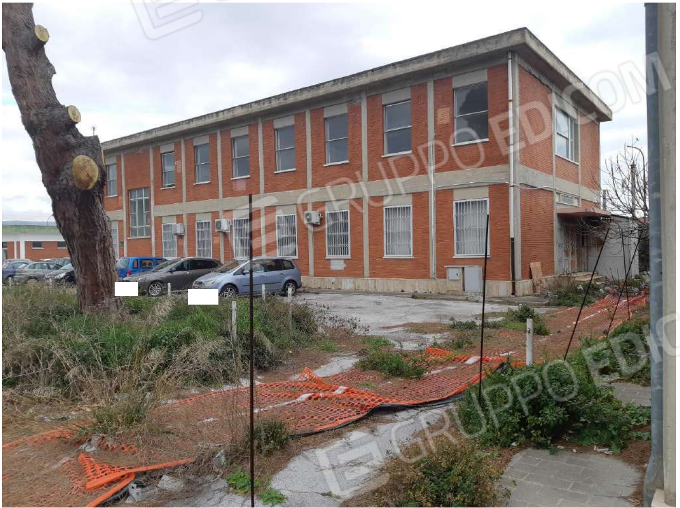
Palazzina uffici con area parcheggio (lato sud)