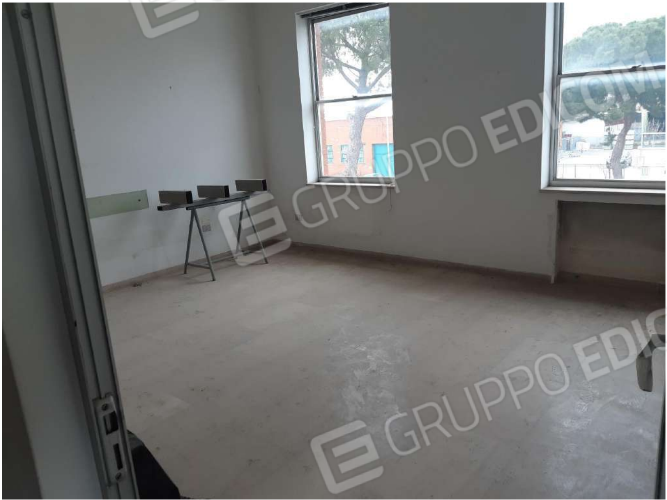
Locali primo piano