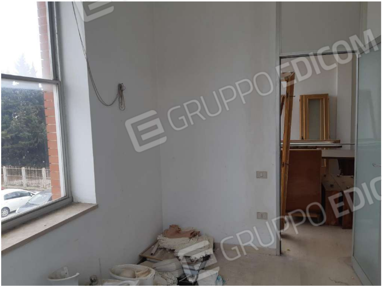
Locali primo piano