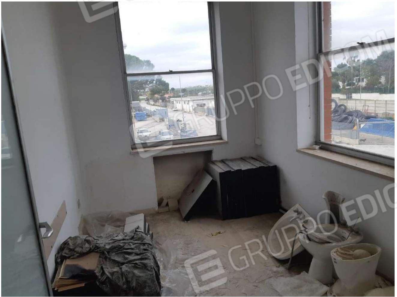
Locali primo piano