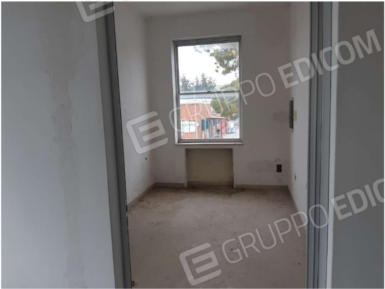
Locali primo piano