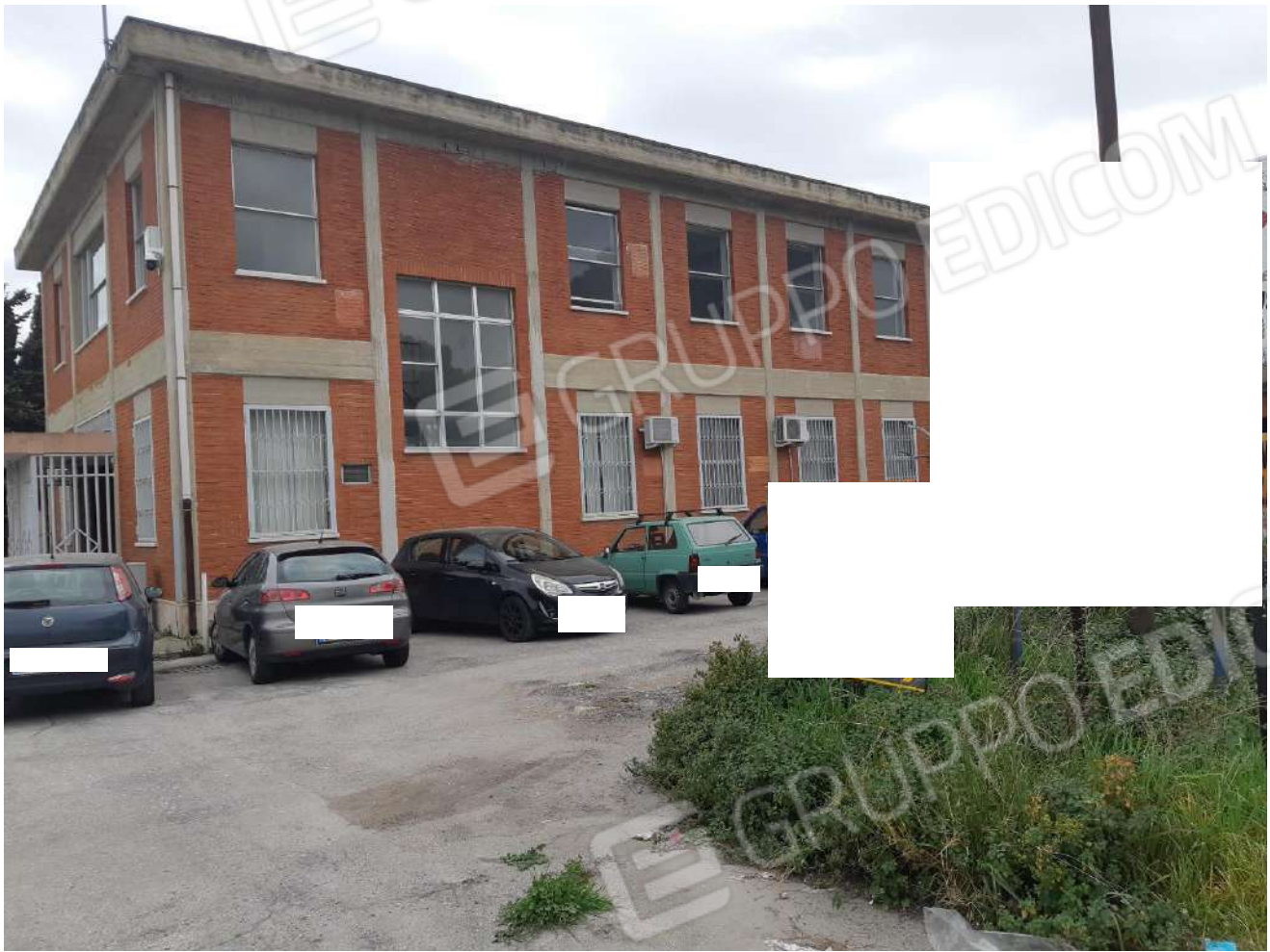
Palazzina uffici con area parcheggio (lato nord)