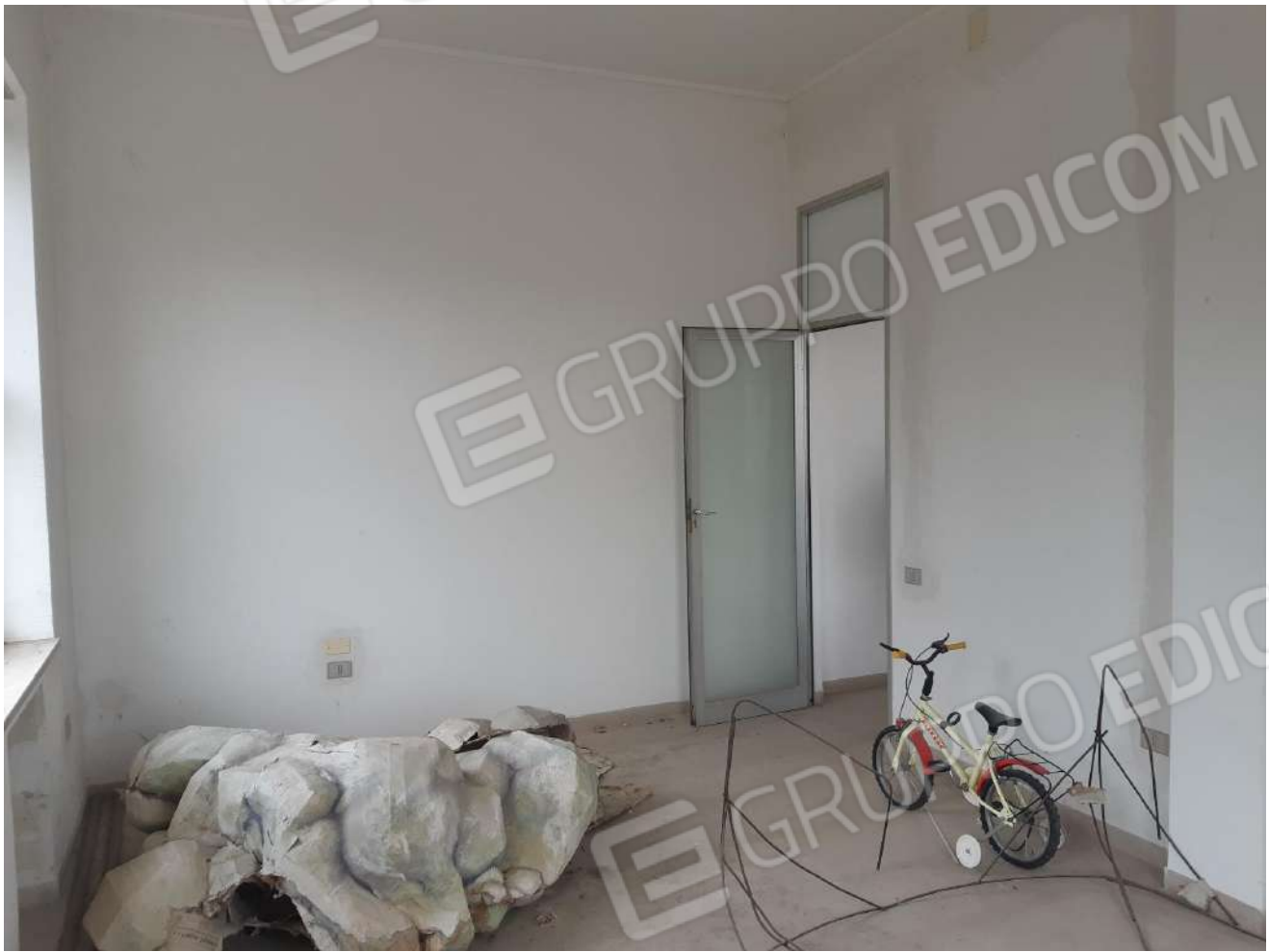
Locali primo piano