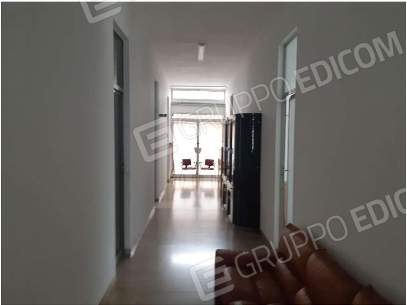
Corridoio piano terra