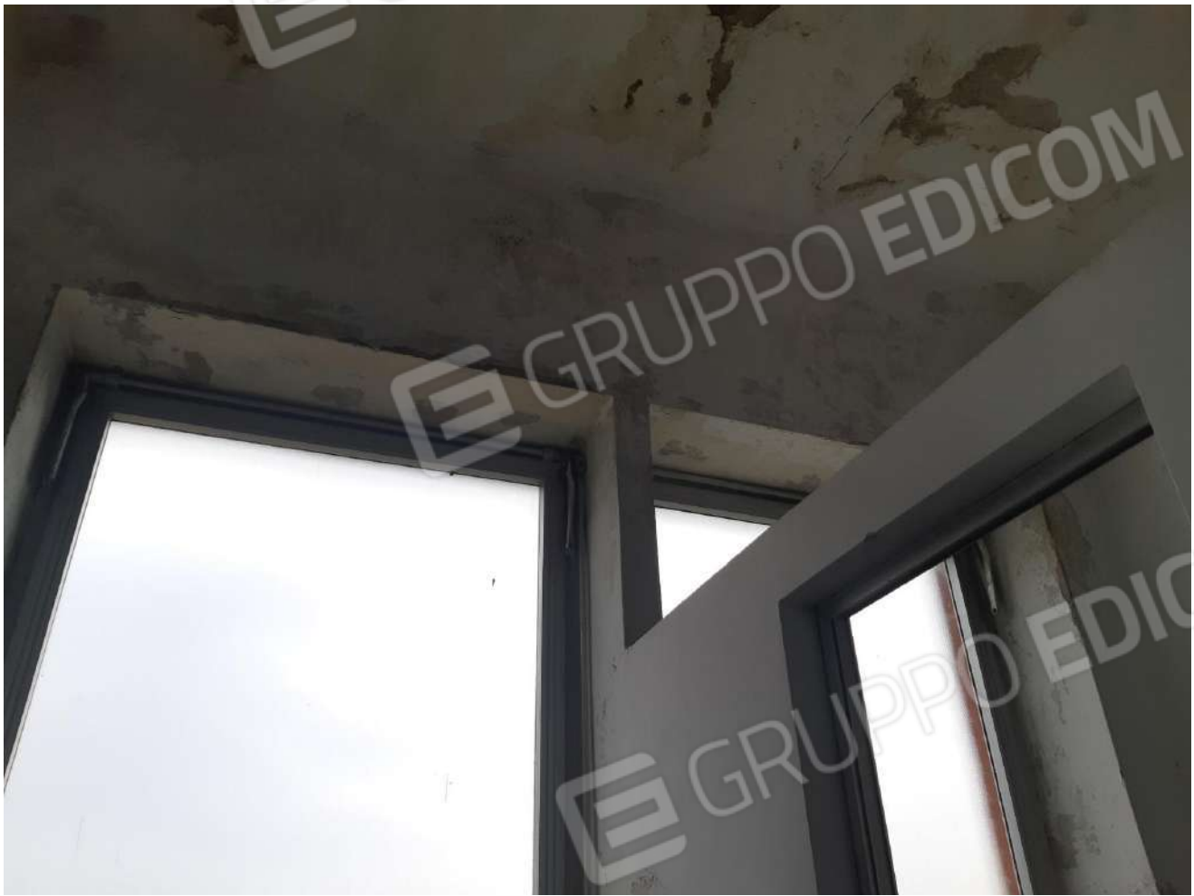
Servizi igienici primo piano