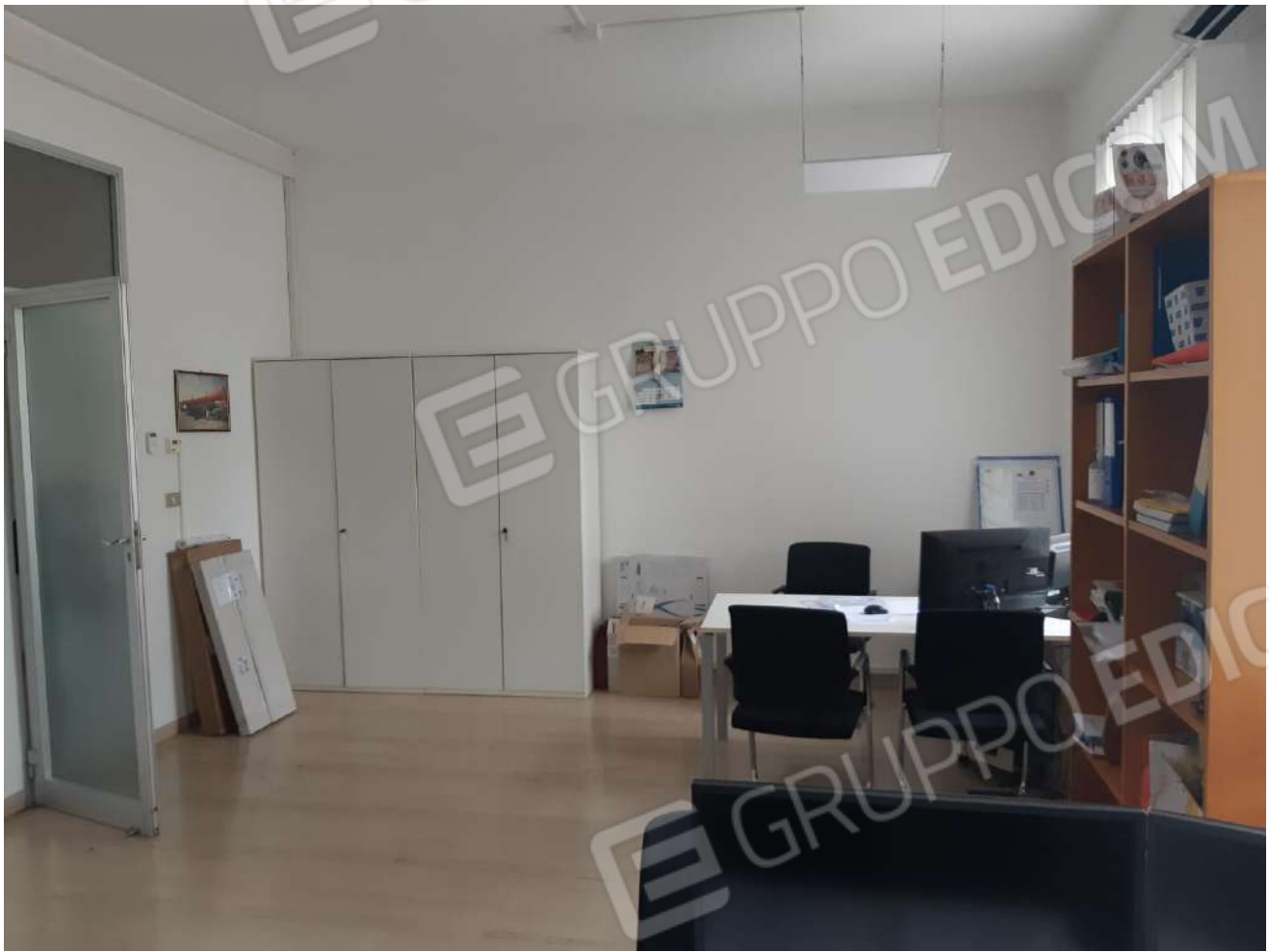
Locali adibiti ad ufficio piano terra