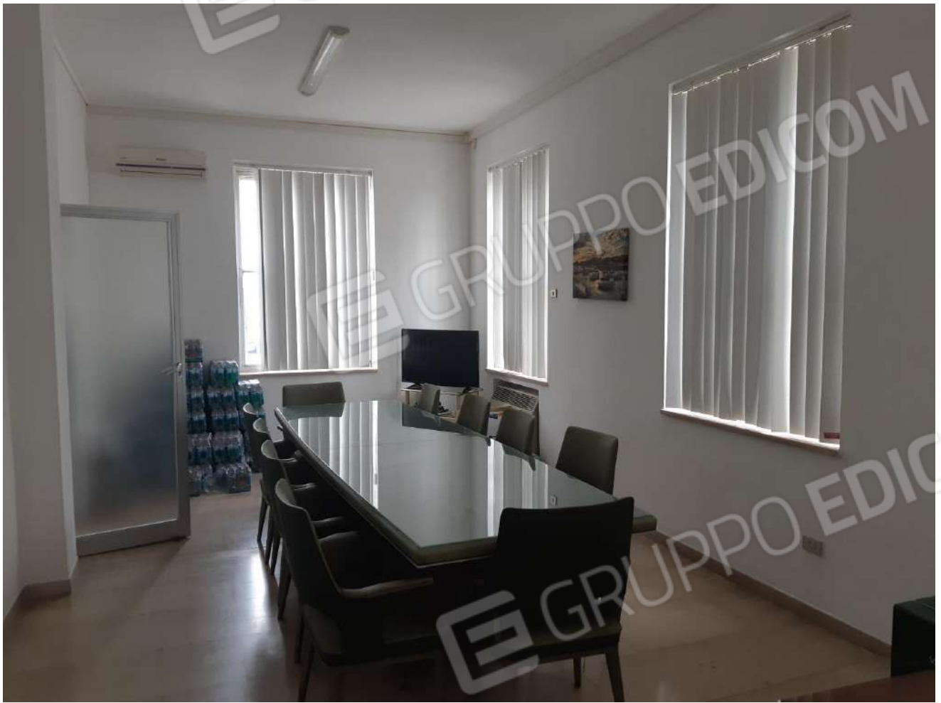
Sala riunioni piano terra