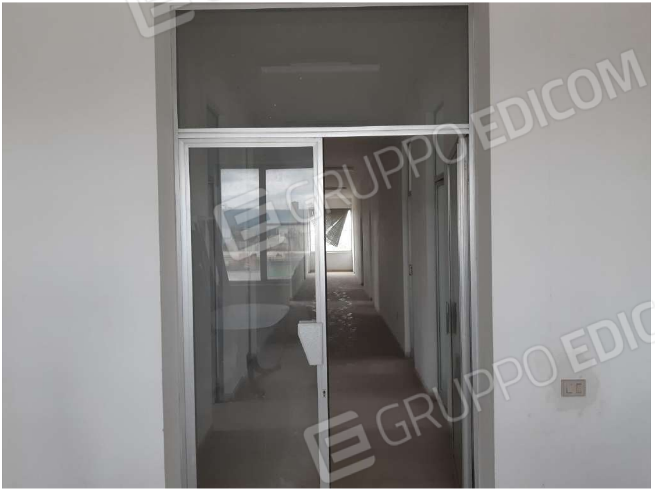
Atrio e scalinata primo piano