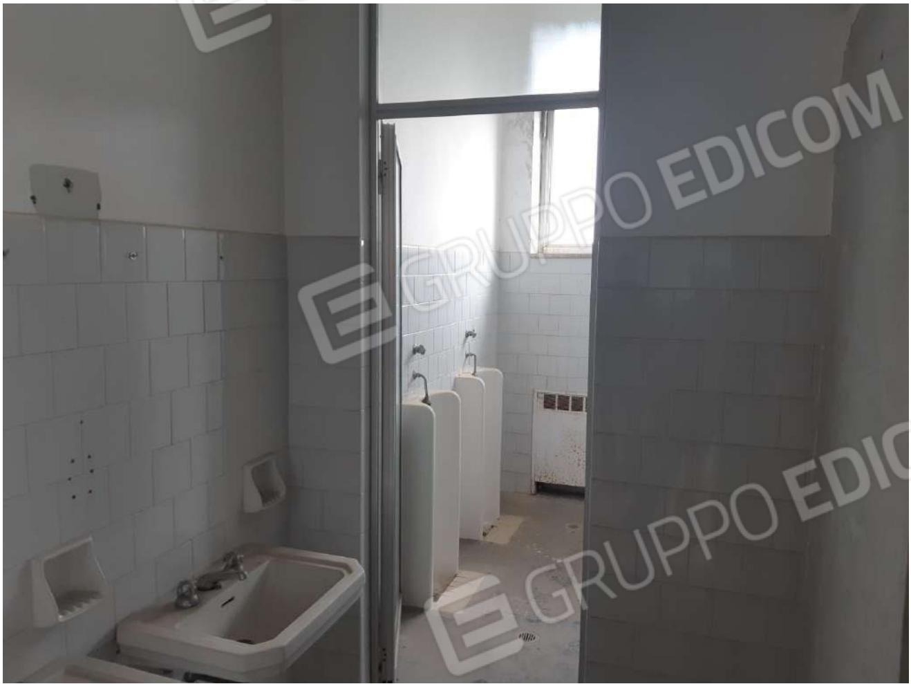
Servizi igienici primo piano