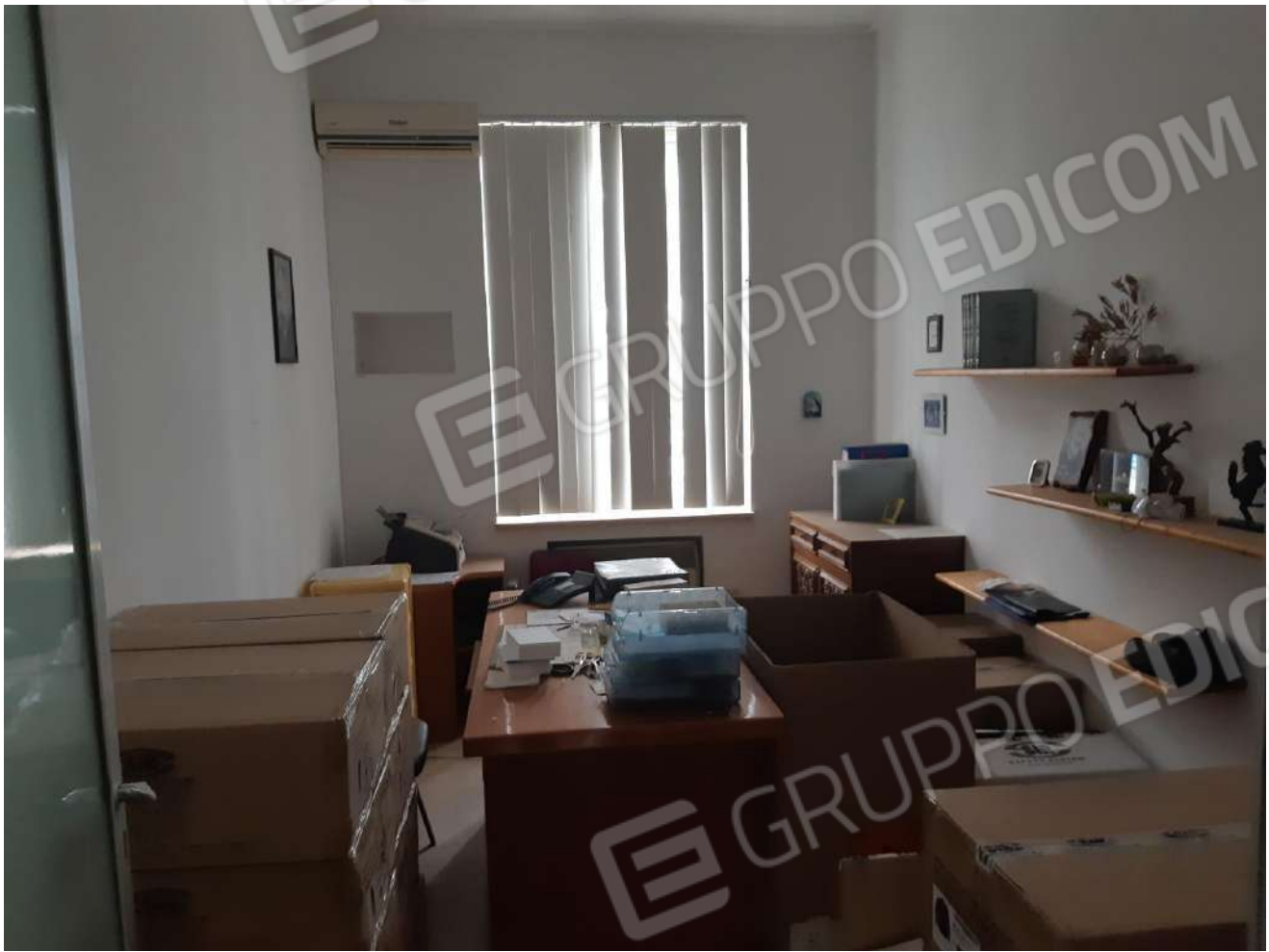
Locali adibiti a deposito piano terra