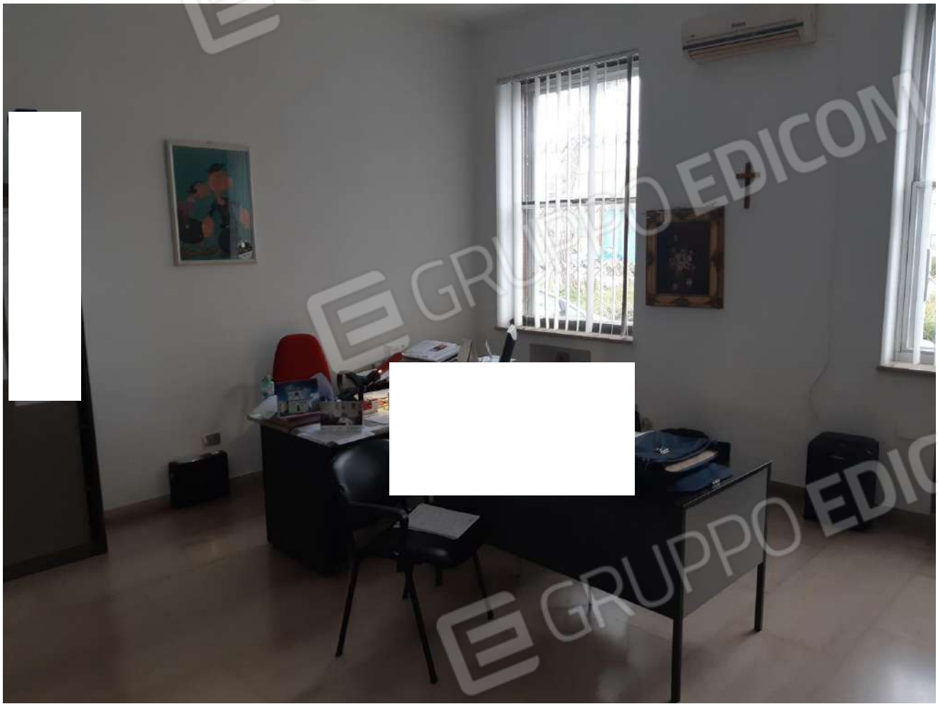
Locali adibiti ad ufficio piano terra