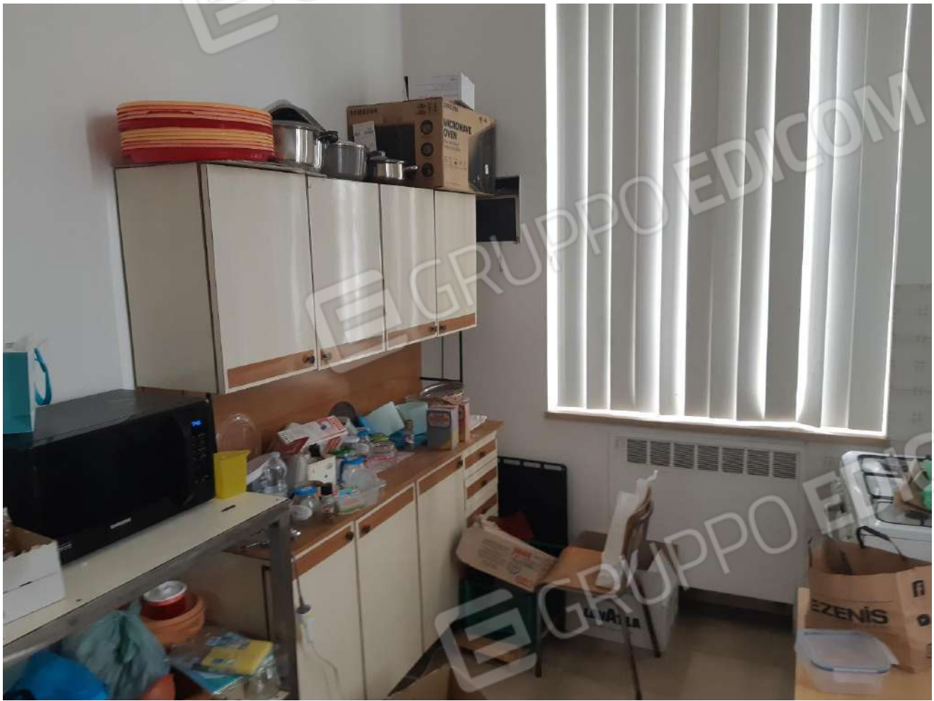
Portineria adibita a cucina piano terra