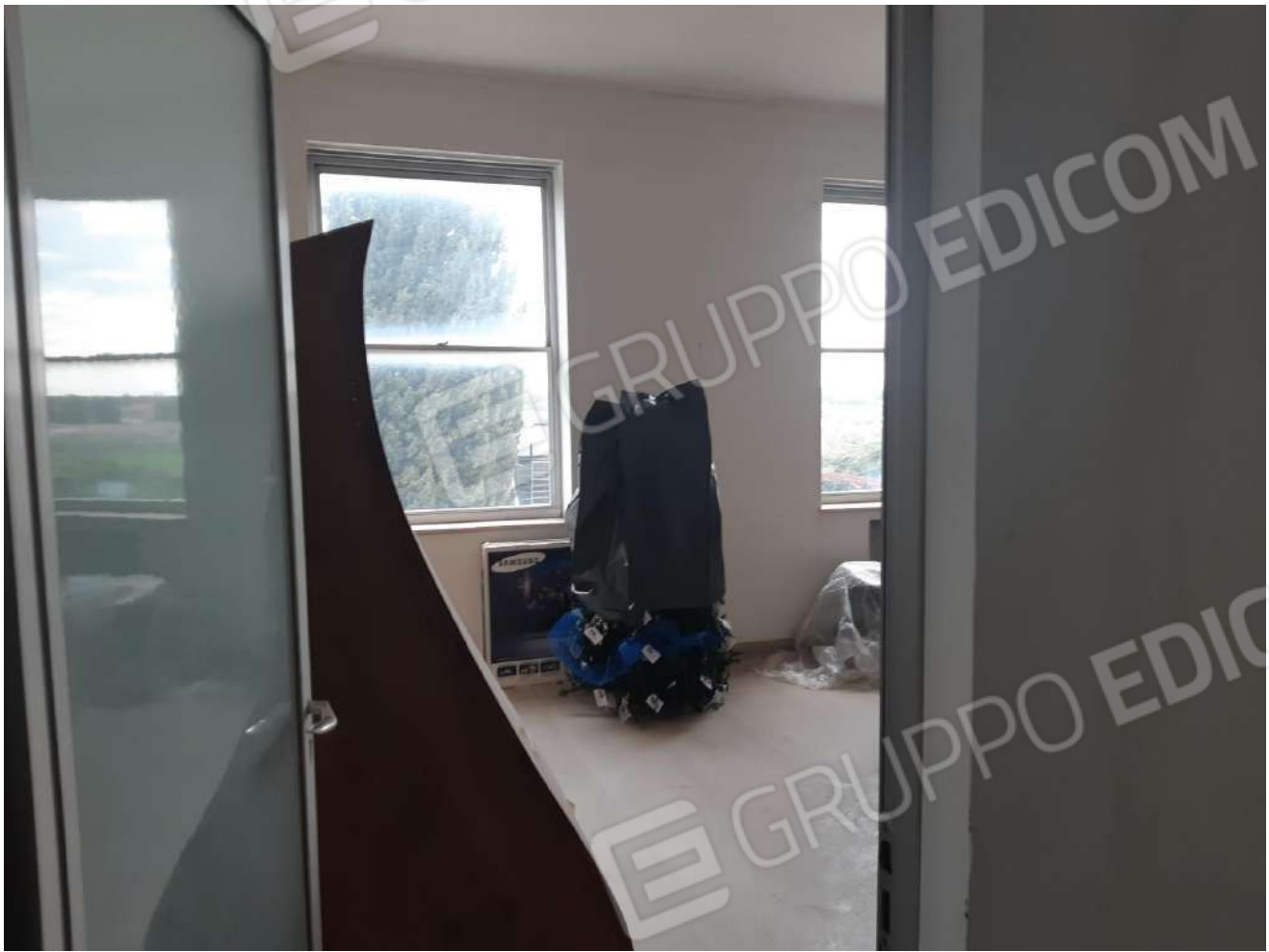
Locali primo piano