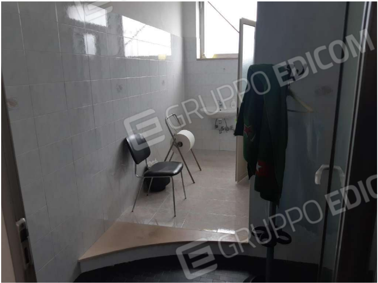
Servizi igienici piano terra