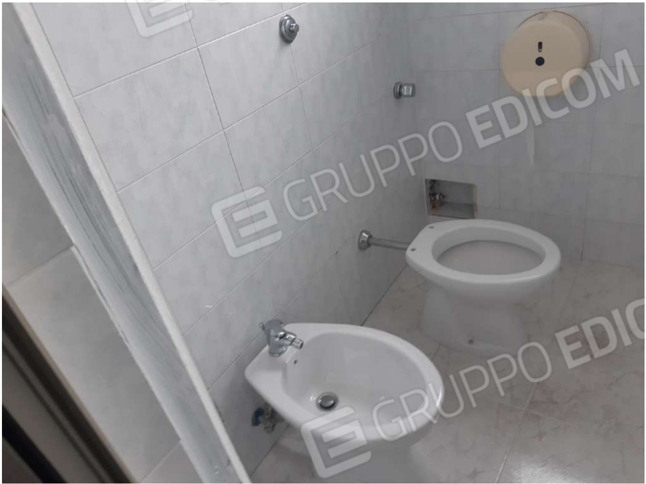
Servizi igienici piano terra