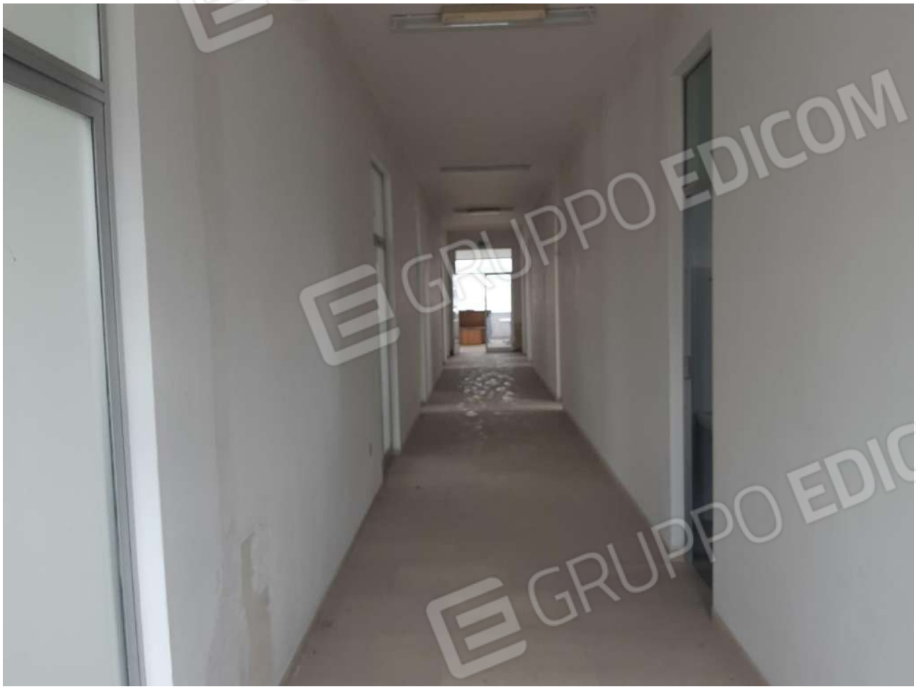
Corridoio primo piano