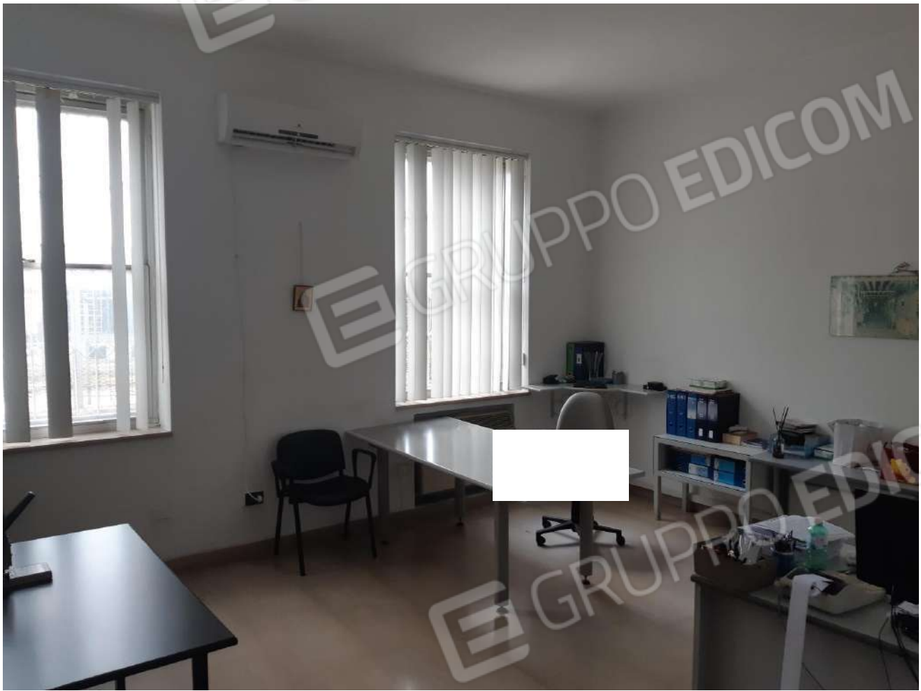
Locali adibiti ad ufficio piano terra