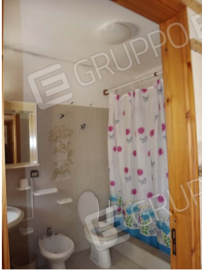
Corpo "B" – I° livello – infiltrazioni d'acqua con conseguente inagibilità san./