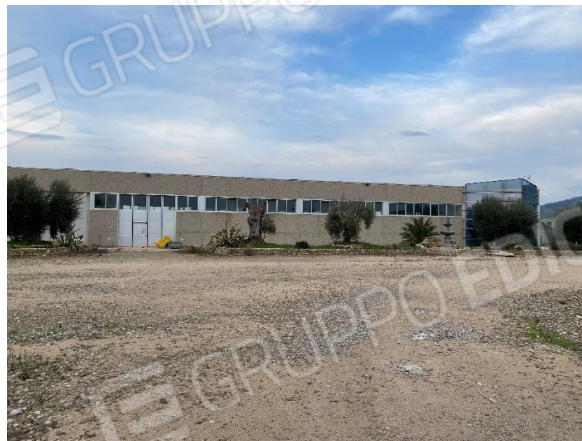
2. Esterno, facciata Sud-Ovest, lato ingresso carrabile.