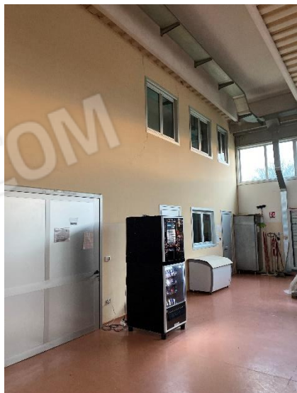
23-24. Finestre uffici, area lavorazione prodotti e celle frigo.