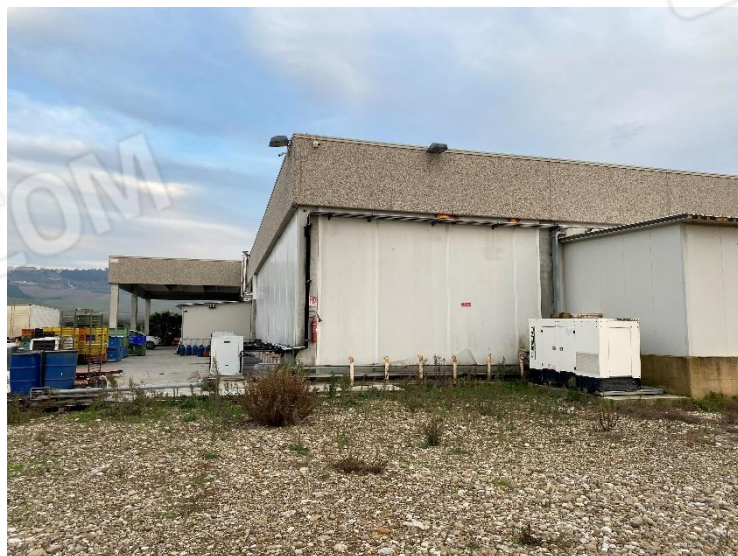
7. Facciata lato celle frigo (Nord-Ovest).