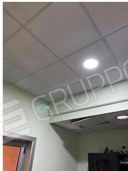
25-26. Interno: zona sopralco uffici.