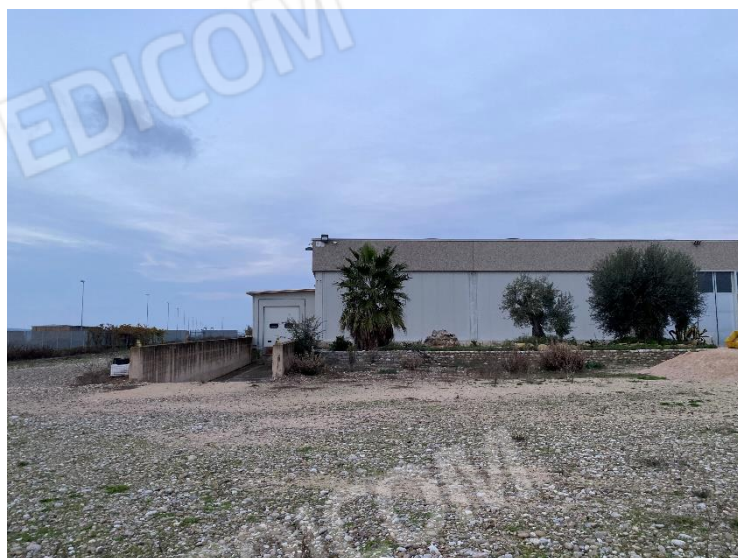
5. Rampa carico/scarico, lato sinistro facciata Sud-Ovest.