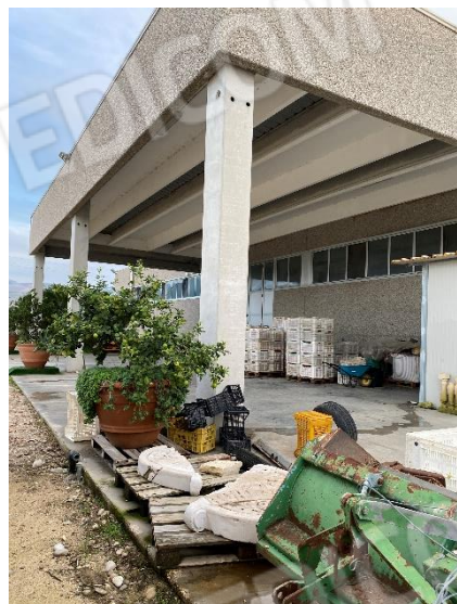
9-10-11. Tettoia e vano centrale termica (Nord-Est).