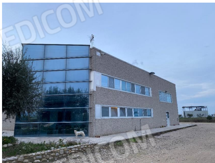
14. Angolo Sud del capannone: prisma vetrato zona uffici.