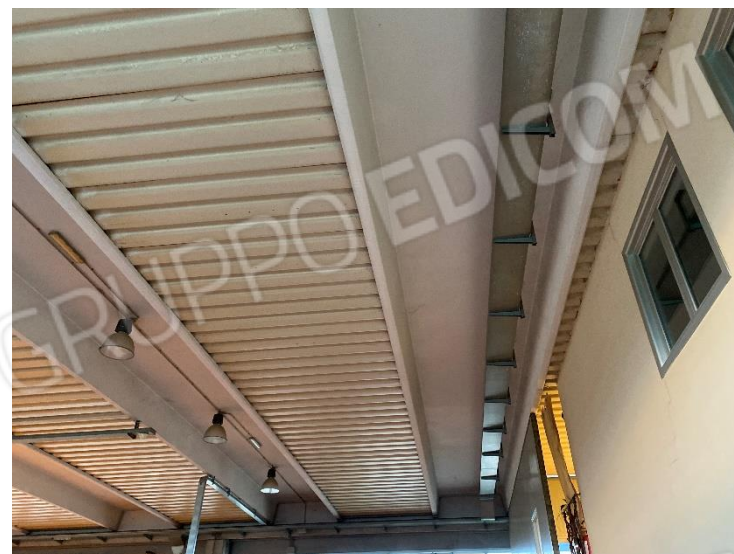
16-17-18. Interno: copertura con travi a doppia pendenza e tegoloni.