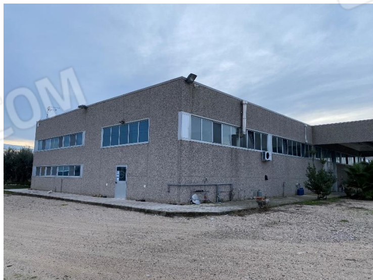
12-13. Facciata Sud-est, lato laboratorio, magazzino, spogliatoio, servizi per gli operai ed uffici.