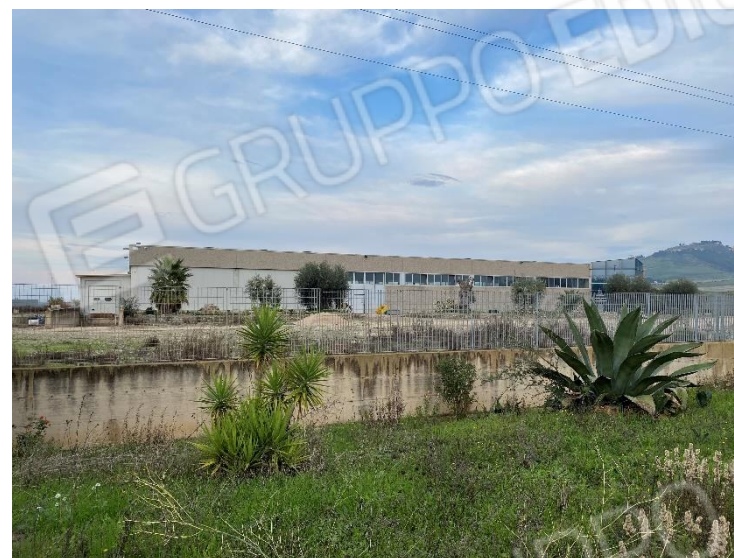
15. Vista dalla strada dell'area industriale, lato Sud-Ovest.