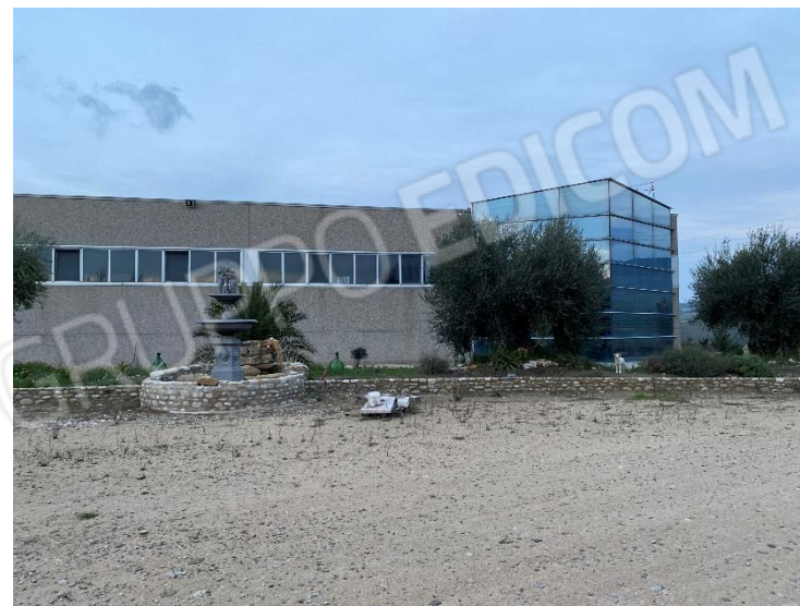
4. Lato destro facciata Sud-Ovest.