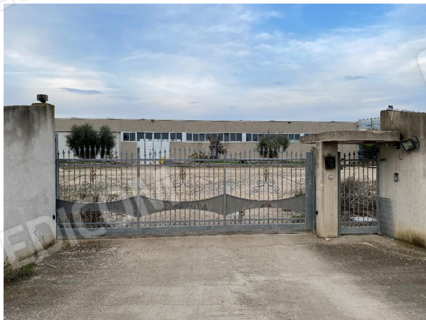
1. Esterno, ingresso carrabile e pedonale, lato Sud-Ovest.