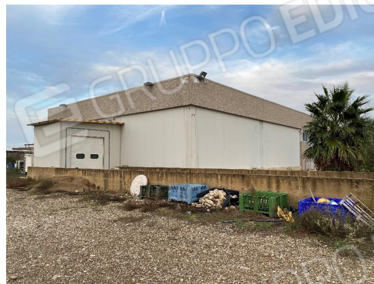
6. Piano carico/scarico, facciata Nord-Ovest.