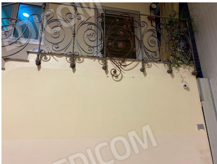
27-28. Interno: scala accesso uffici e risalita capillare alla base della scala.