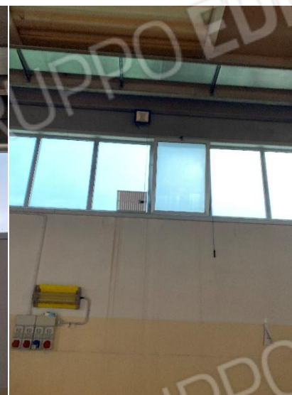
19-20-21-22. Interno: problematiche infiltrative in corrispondenza dei pluviali di scarico e di alcuni infissi.