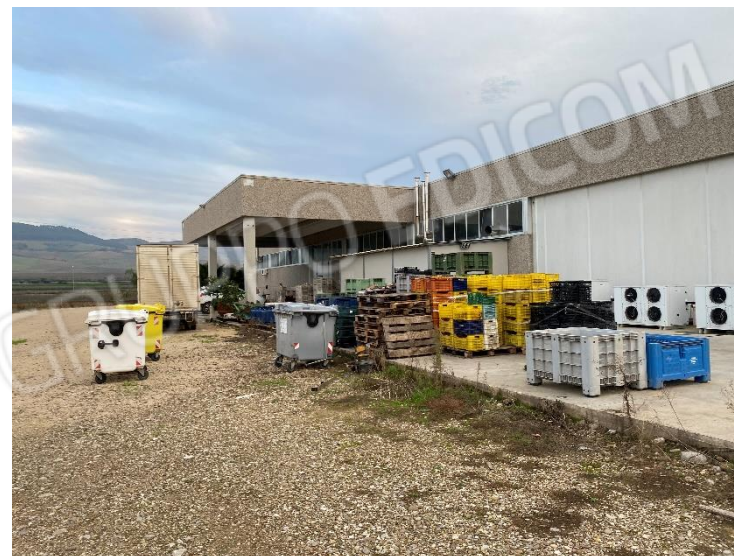
8. Tettoia e vano centrale termica (Nord-Est).