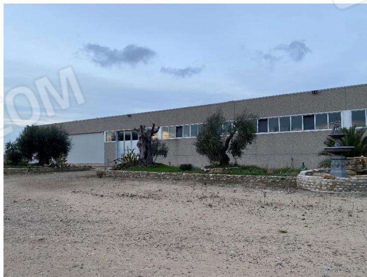
3. Lato sinistro facciata Sud-Ovest.