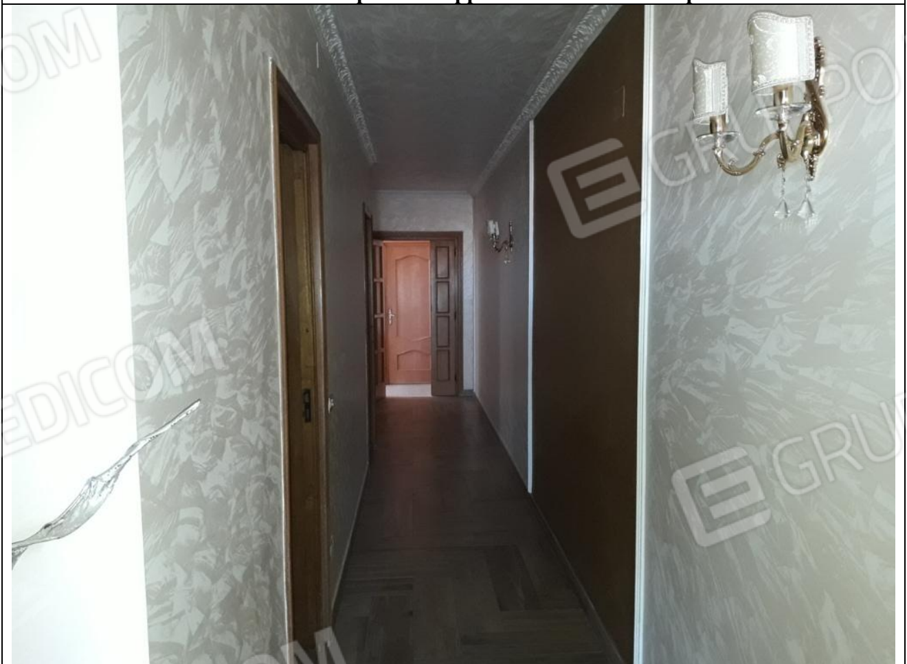
16 – Appartamento in secondo piano: veduta, dall'ingresso, del corridoio