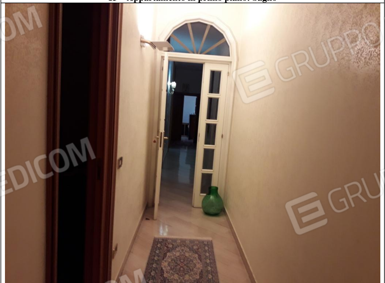
14 – Appartamento in primo piano: veduta, dal bagno, del corridoio e dell'ingresso