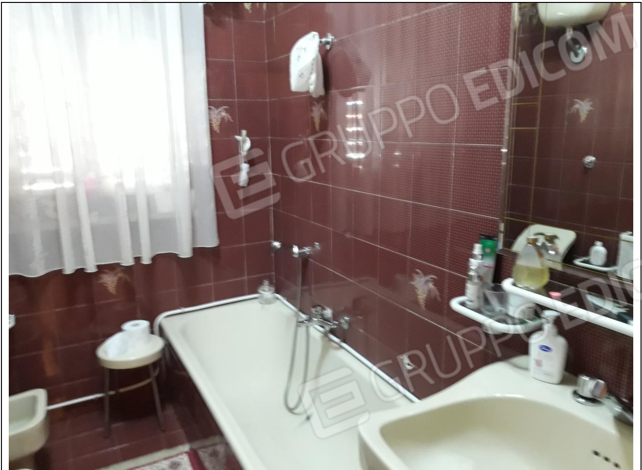
13 – Appartamento in primo piano: bagno