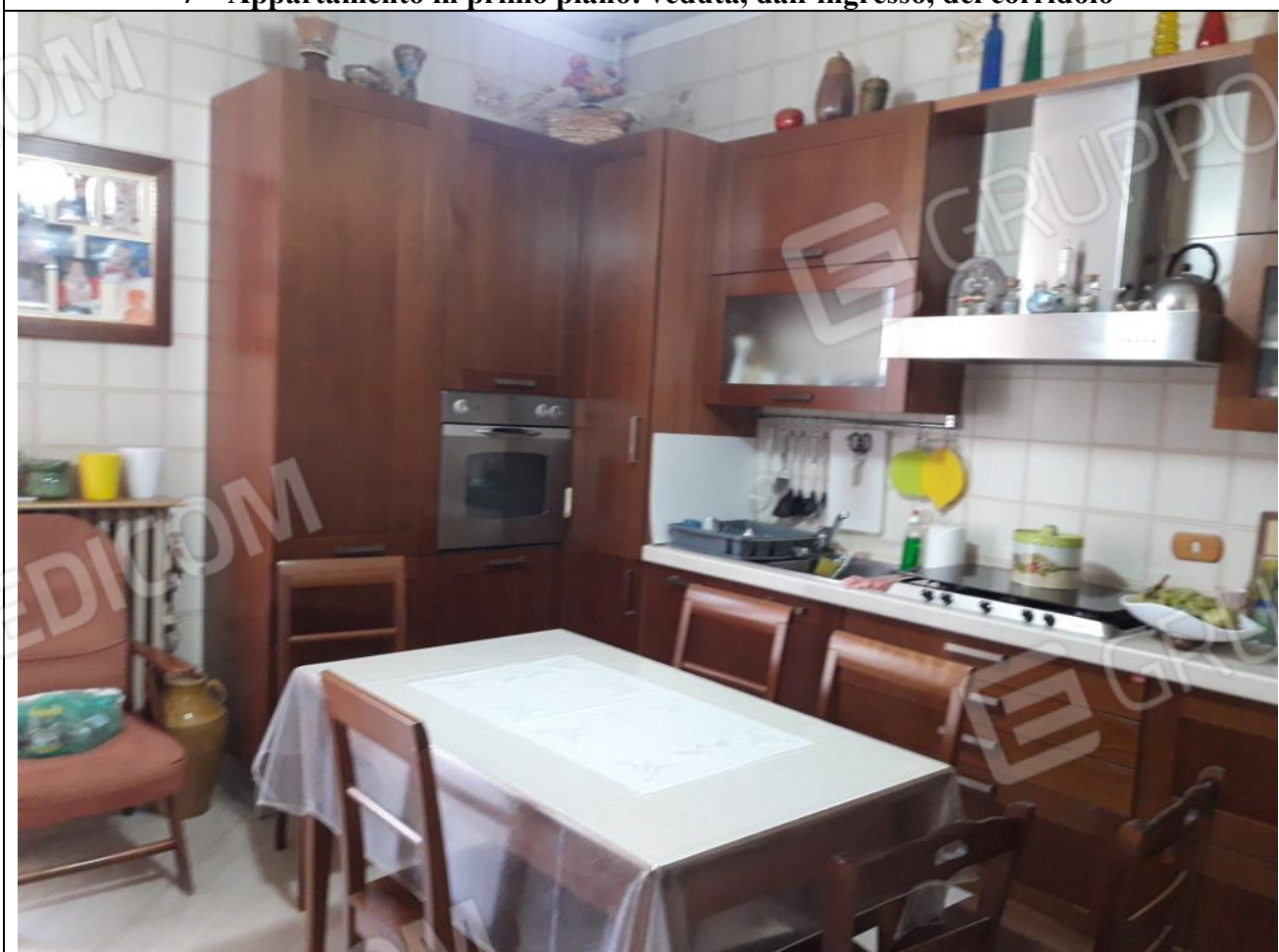
8 – Appartamento in primo piano: cucina