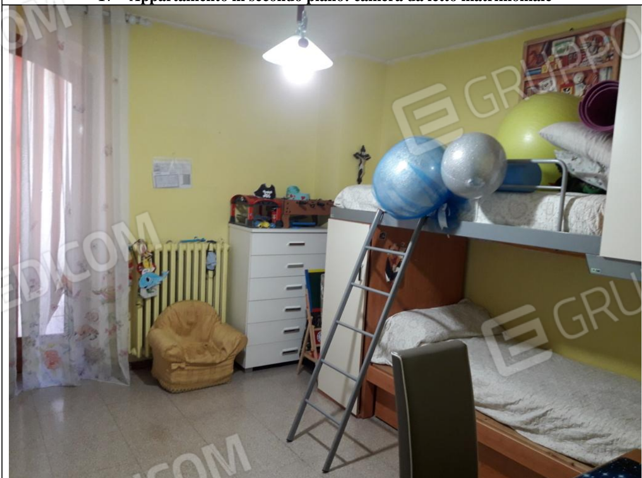
18 – Appartamento in secondo piano: cameretta