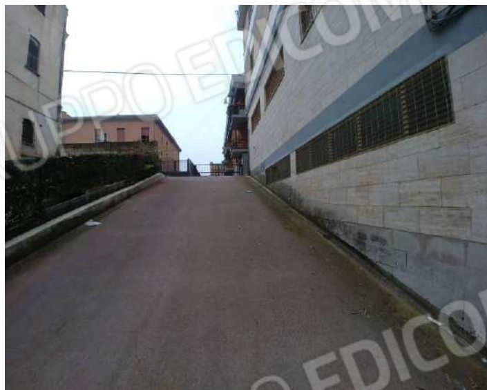
Figura 7: particolare rampa di accesso al piano S1 da via Monte Santo