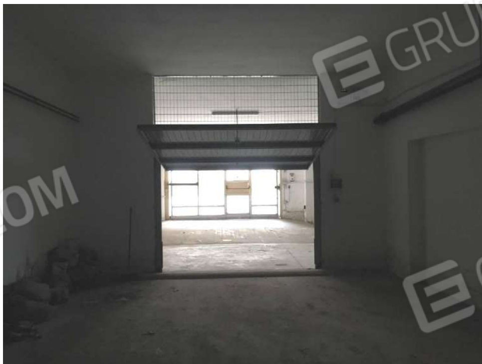
Figura 14 : interno box (F.63 p.lla 797 sub.44 - int.11)