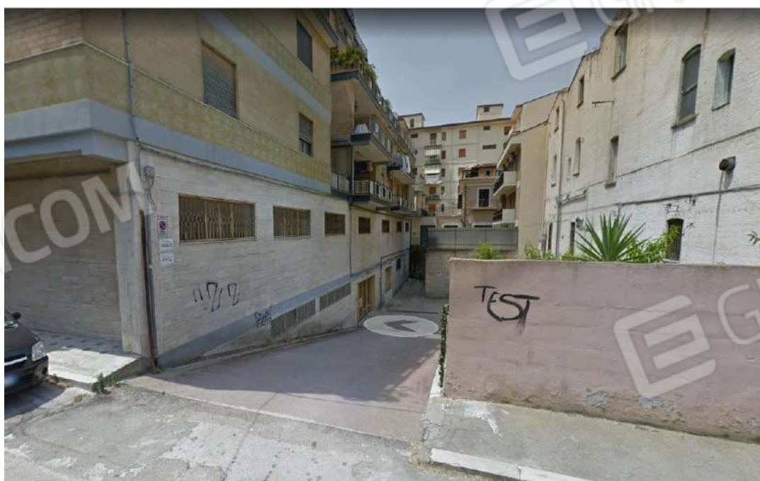
Figura 6: Box in Autorimessa condominiale, via Monte Santo, 3/A - San Severo (FG) – F.63 p.lla 797 sub.44 piano S1