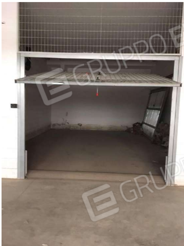
Figura 13 : interno box (F.63 p.lla 797 sub.44 - int.11)