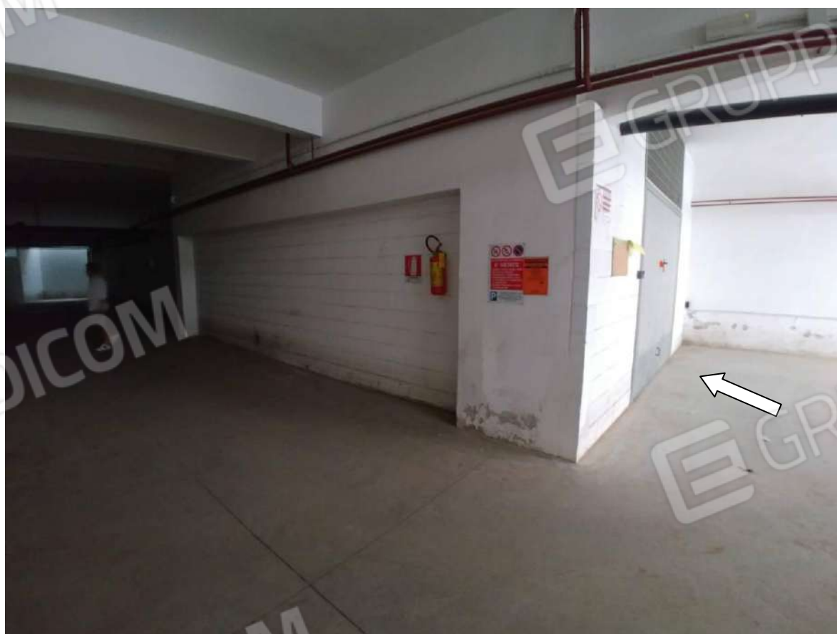
Figura 10: interno corsia box con individuazione box (F.63 p.lla 797 sub.44 - int.11)