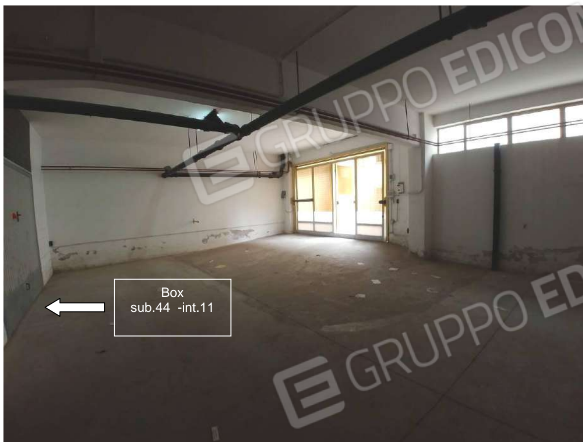
Figura 9: interno corsia box con individuazione box (F.63 p.lla 797 sub.44 - int.11)