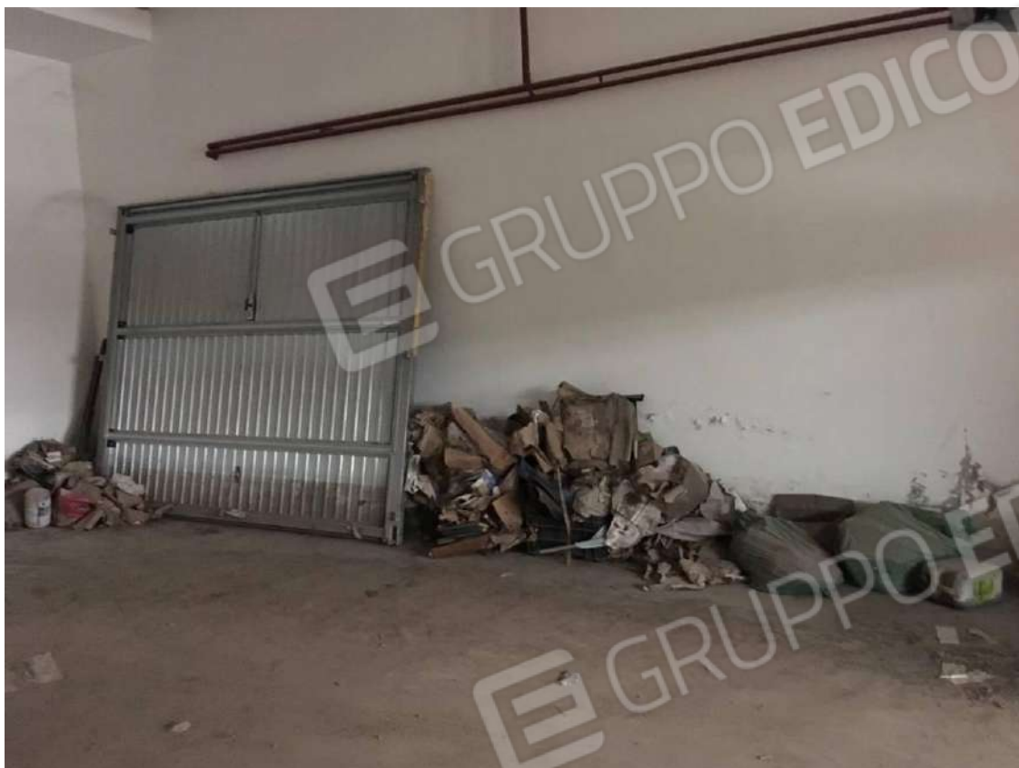
Figura 15 : interno box (F.63 p.la 797 sub.44 - int.11)