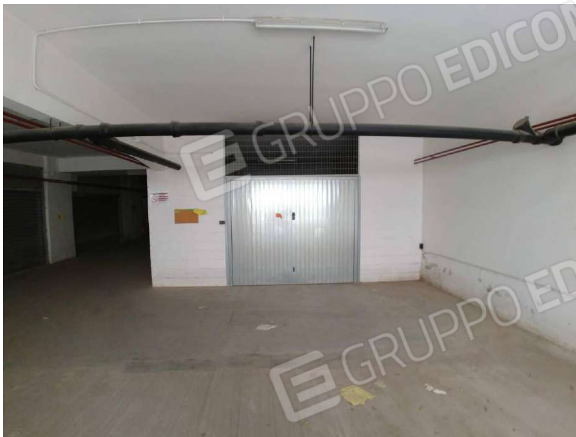
Figura 11 : interno corsia box con individuazione box (F.63 p.la 797 sub.44 - int.11)