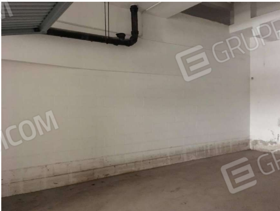
Figura 16 : interno box (F.63 p.la 797 sub.44 - int.11)