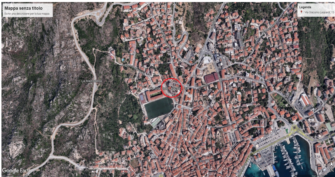
UBICAZIONE DEL BENE: (foto aerea)