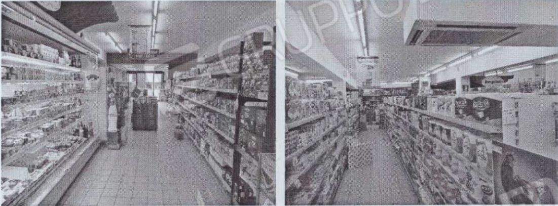
Figura 4 – Vista interna supermercato