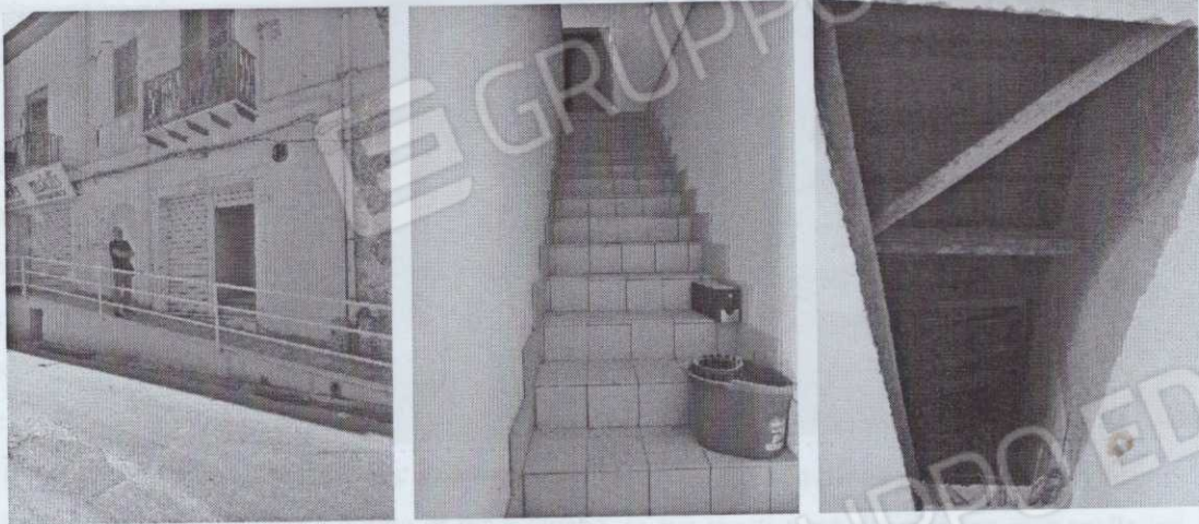
Figura 7 – A sinistra vano di accesso al piano primo, al centro il vano scala ed a sinistra botola per accesso al sottotetto