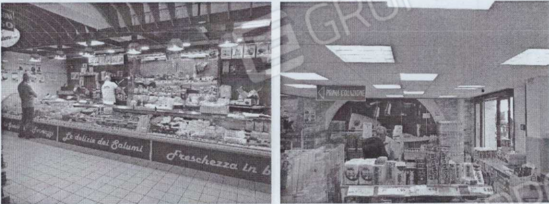
Figura 5 – Vista interna supermercato