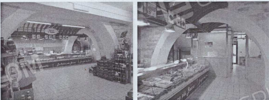
Figura 6 – Vista interna supermercato