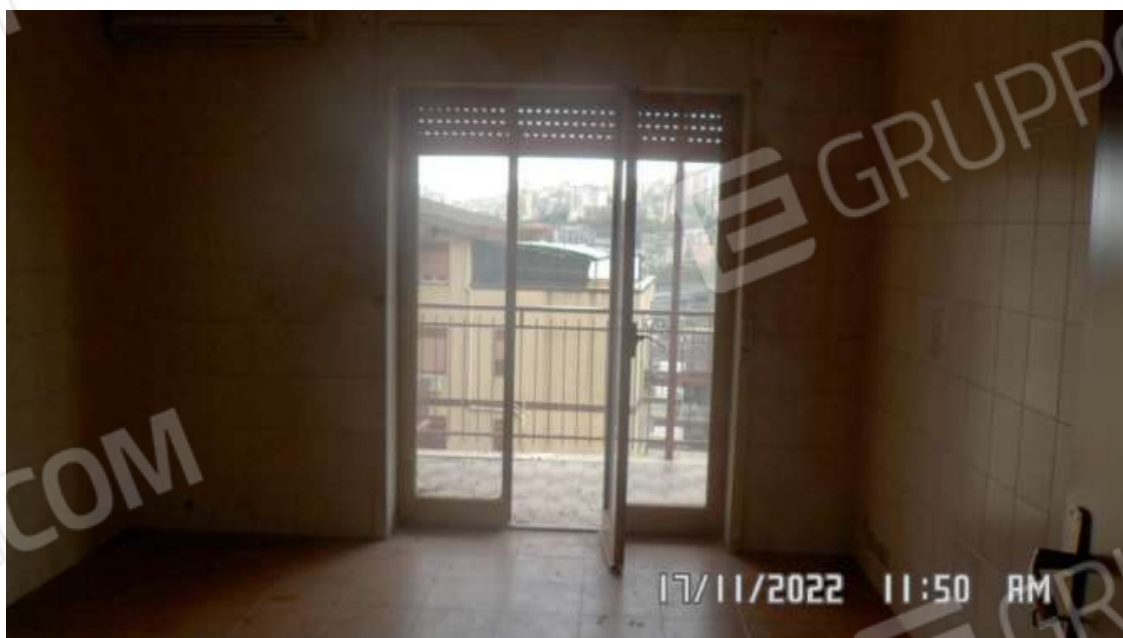
FOTO 4 - VEDUTA DELLA CUCINA