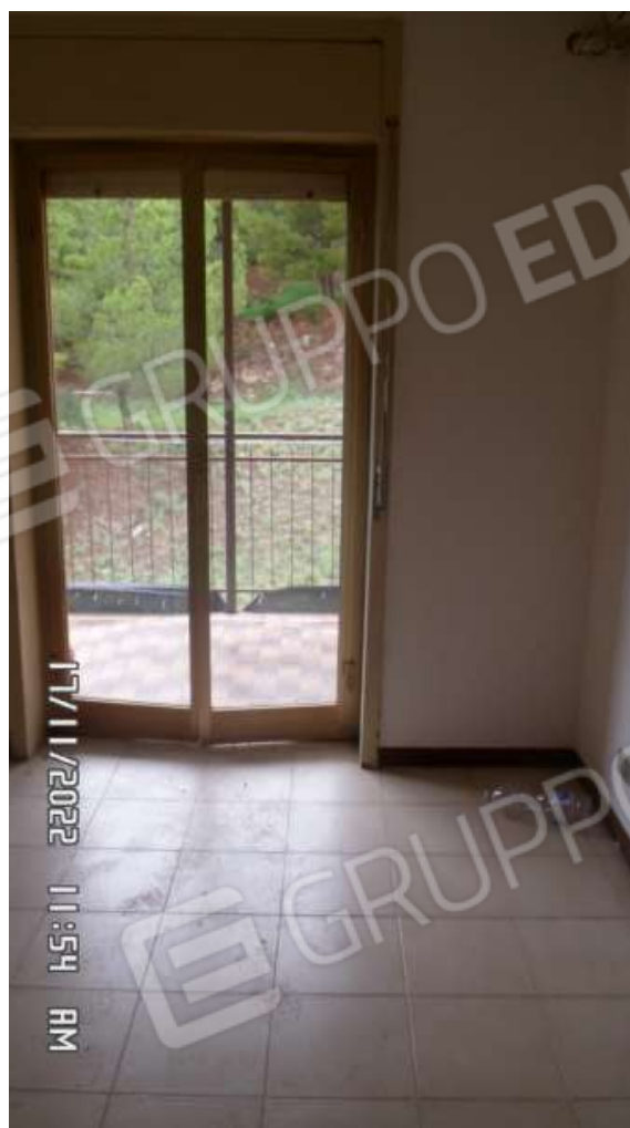
FOTO 8 - VEDUTA DELLA CAMERA