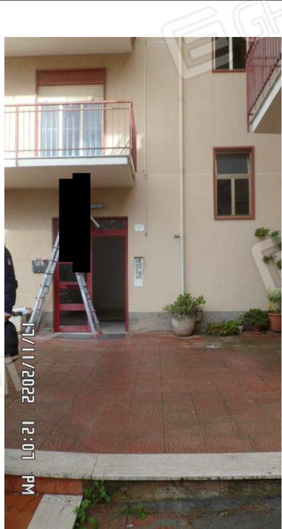
FOTO 2 – VEDUTA DEL PORTONE DI INGRESSO DEL VANO SCALA POSTO SUL LATO SUD DEL FABBRICATO