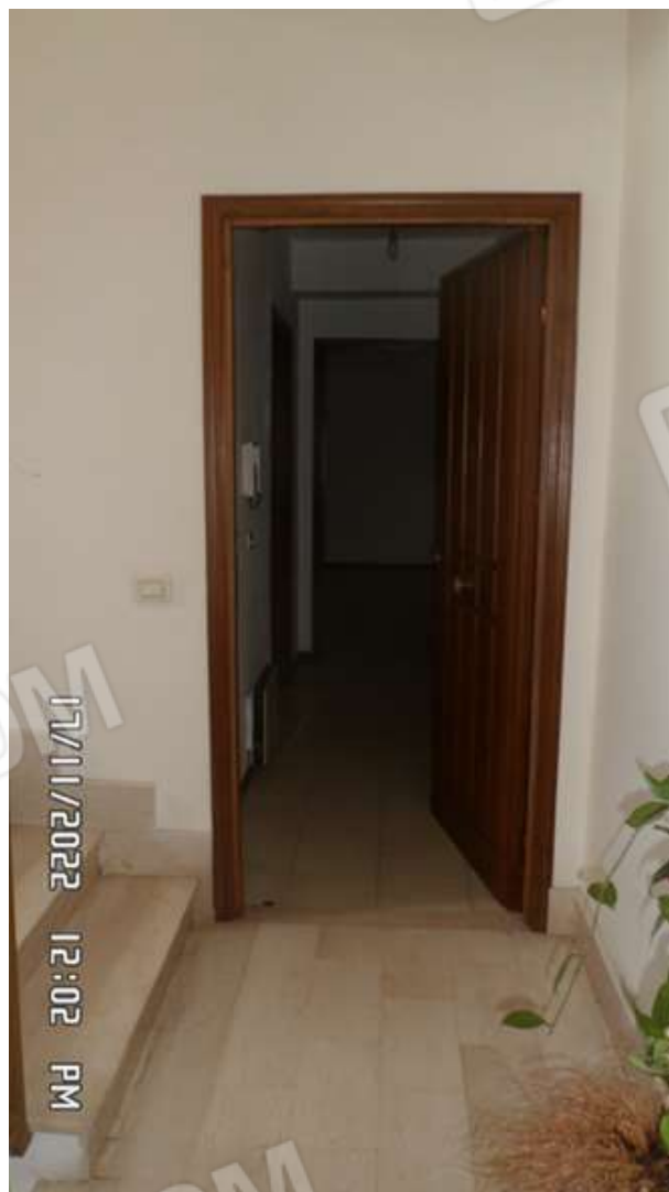
FOTO 1 - VEDUTA DELLA PORTA DI INGRESSO