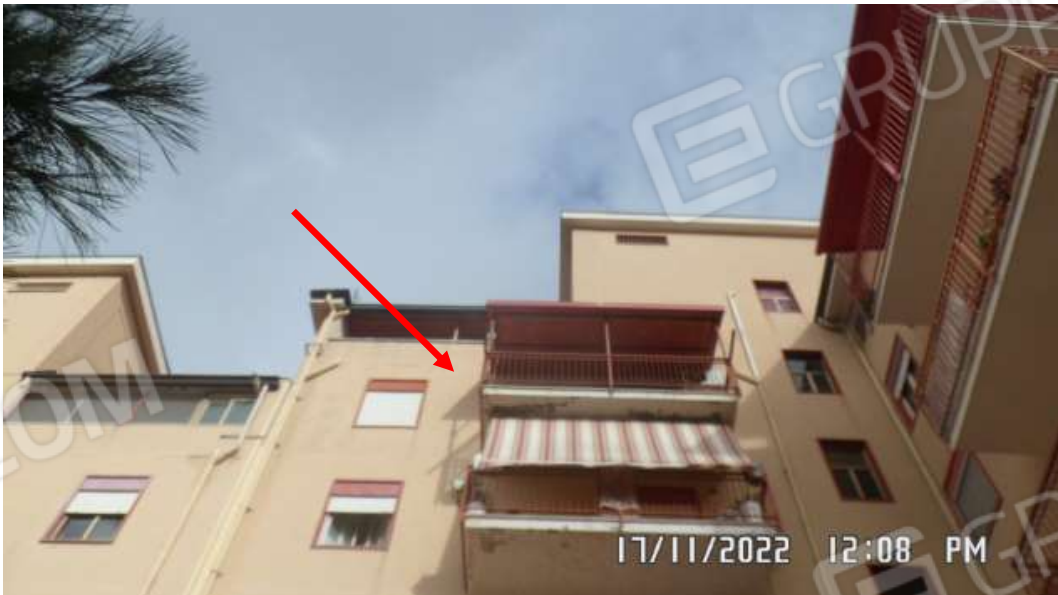
FOTO 1 - VEDUTA LATO SUD DELL' APPARTAMENTO