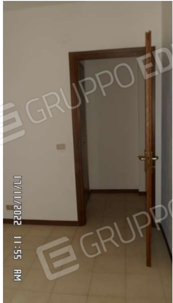
FOTO 6 - VEDUTA DELLA CAMERA