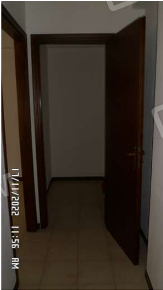
FOTO 5 - VEDUTA DEL RIPOSTIGLIO