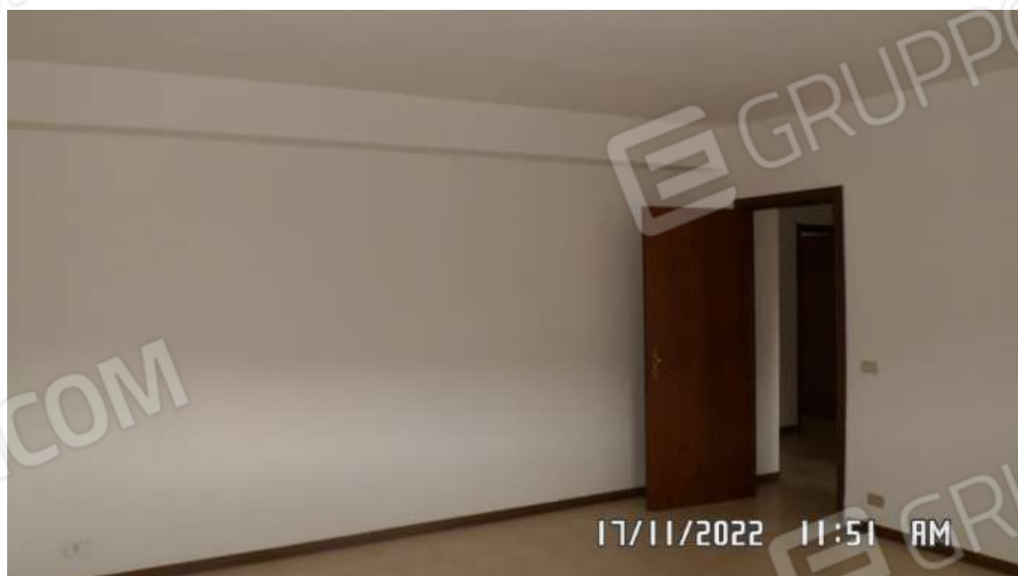
FOTO 10 - VEDUTA DEL SALONE