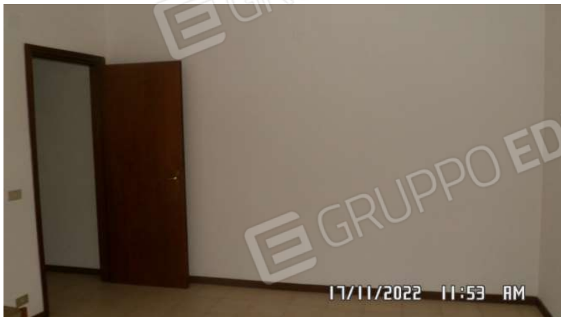
FOTO 9 - VEDUTA DEL LETTO