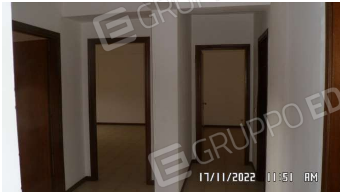
FOTO 3 - VEDUTA DALL' INGRESSO DEL SALONE E DEL LETTO