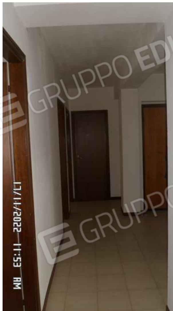
FOTO 2 - VEDUTA DELL' INGRESSO DISIMPEGNO