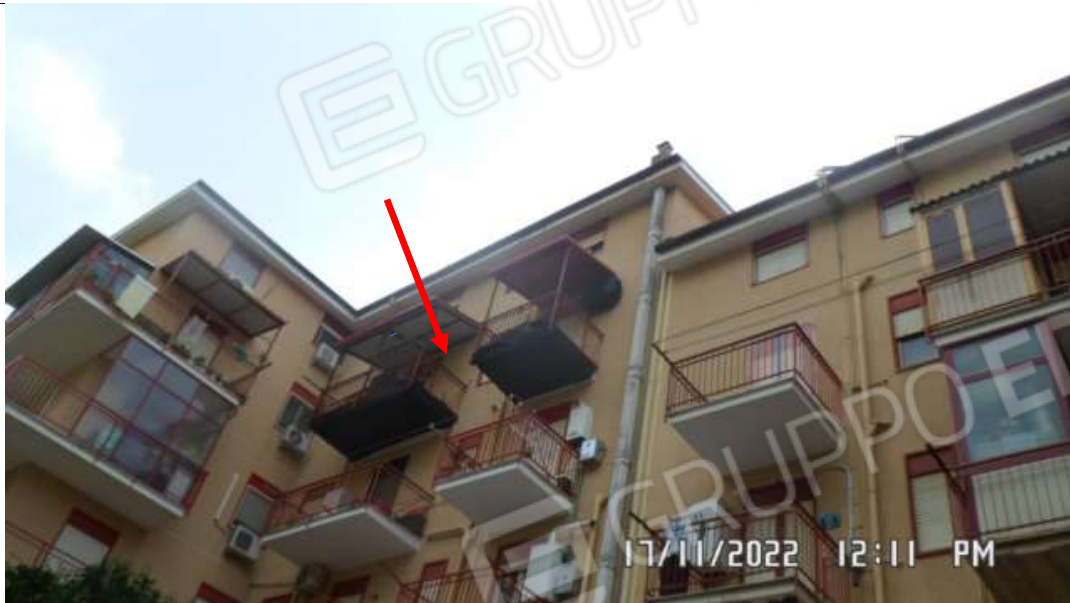
FOTO 4 - VEDUTA LATO NORD DELL' APPARTAMENTO