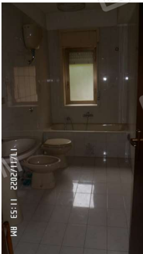
FOTO 7 - VEDUTA DEL BAGNO