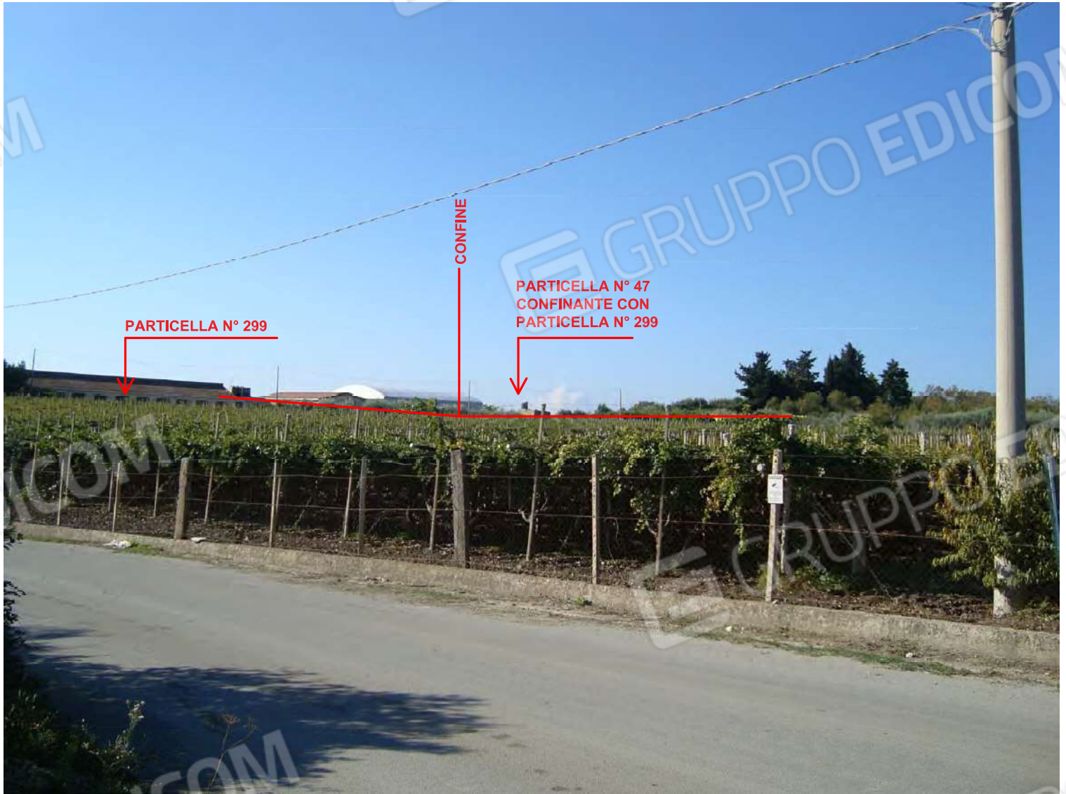
Terreno in Naro Fg. 191 part. 47 - Coltura Vigneto Irriguo