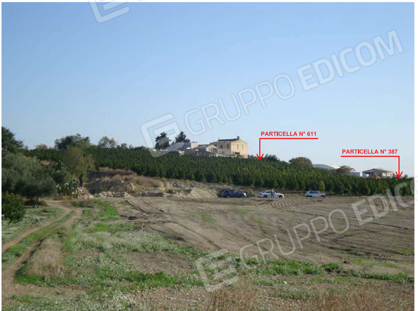
Terreni in Naro Fg. 191 part. 611 (ex 454) e 387 - Coltura Pescheto