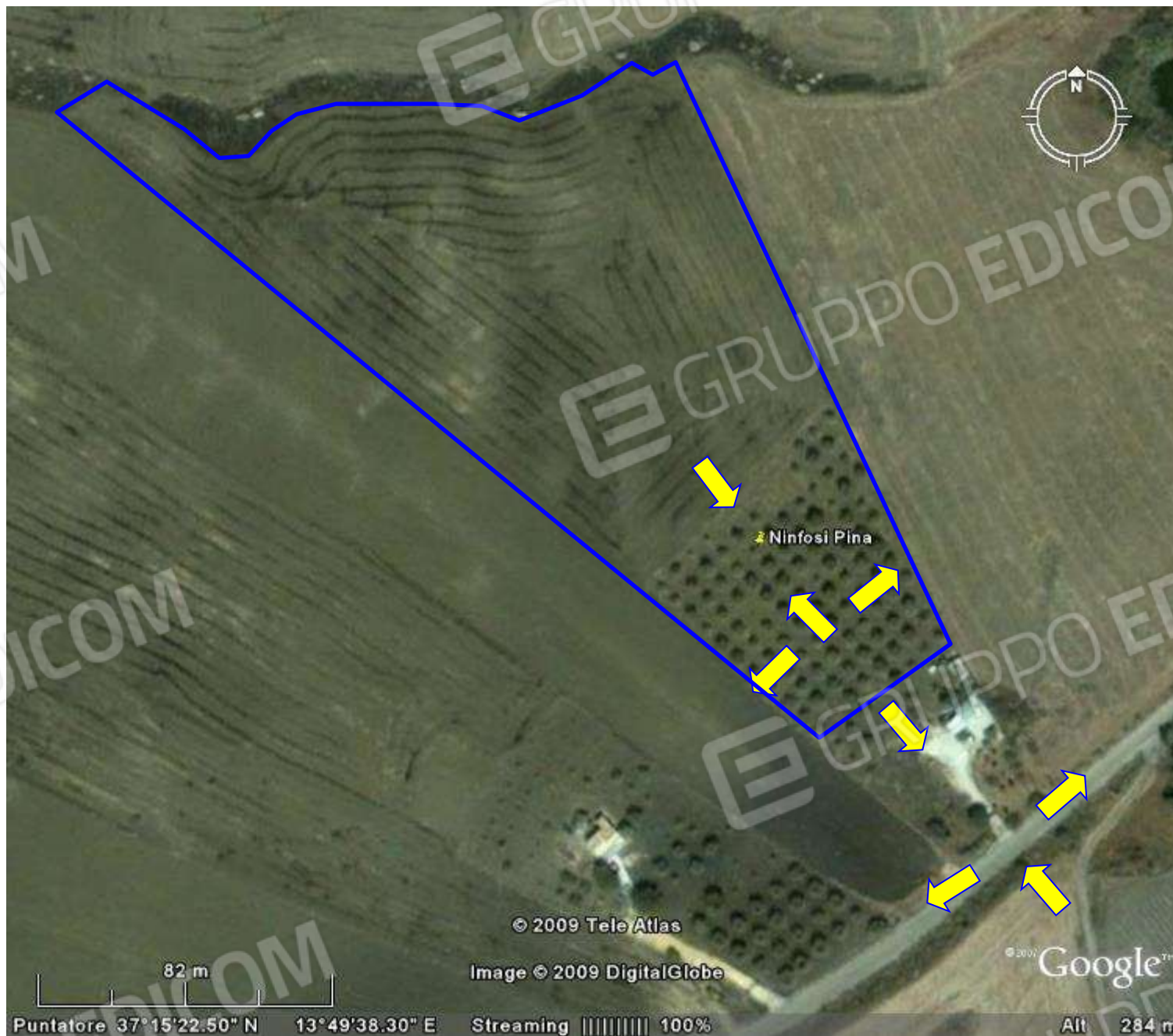
Terreno agricolo in territorio di Naro contrada Mintina di Batia