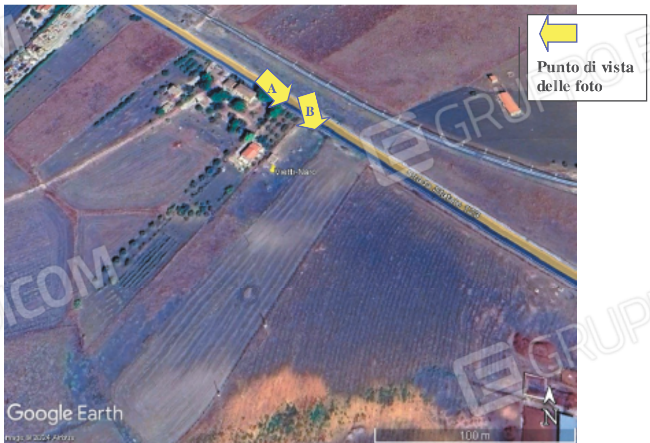
Contesto urbanistico nelle vicinanze del terreno in c.da Ogliaro territorio di Naro